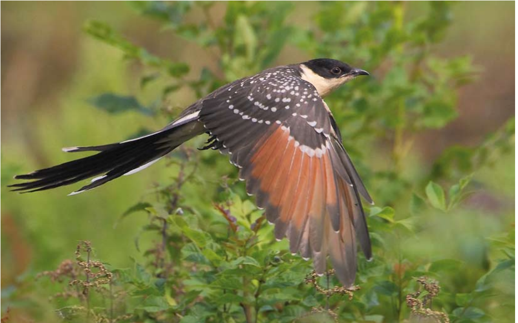
446 Kuifkoekoek / Great Spotted Cuckoo Clamator glandarius , juveniel, Zuiderdijkweg, Wieringerwerf, Noord-Holland, 6 augustus 2011