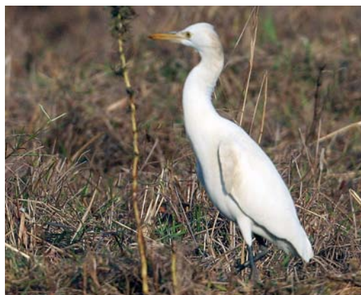
378 Eastern Cattle Egret / Oostelijke Koereiger Bubulcus ibis coromandus , Magic Wood, Laoting, Hebei, China, 15 May 2010 (Ross Ahmed). Long legs apparent, as is neck bulge. Overall shape reminiscent of larger egret, such as Intermediate Egret Mesophoyx intermedia . 379 Western Cattle Egret / Koereiger Bubulcus ibis ibis , S'Albufera, Mallorca, Balearic Islands, Spain, 10 May 2010 (Garth Peacock). Compared with Eastern Cattle Egret B i coromandus in plate 378, legs shorter and neck bulge smaller. Overall impression smaller and more compact than coromandus . 380 Western Cattle Egret / Koereiger Bubulcus ibis ibis , Legbourne, Lincolnshire, England, 9 February 2008 (Darren Chapman). Note shaggy chin-feathers, known as jowl, contributing to rather bulbous head. Chin-feathers tend to be more shaggy in ibis than in Eastern Cattle Egret B i coromandus but is dependent on levels of aggression and fear. Short legs and neck, both characteristic of ibis , both readily apparent. 381 Eastern Cattle Egret / Oostelijke Koereiger Bubulcus ibis coromandus , Baga, Goa, India, 17 January 2009 (Ross Ahmed). Note staining on nape and shoulders, most likely from mud or dust. Stained adult summer plumage in Western Cattle Egret B i ibis could invite confusion with coromandus .

ibis returning to nesting colonies for the breeding season ranged from all white to pale patchy buff to full summer plumage. A second calendar-year coromandus showing patchy summer plumage could invite confusion with ibis . Biometrics from eight skins of juvenile ibis and coromandus were analysed. The indications are that the same structural differences used in the separation of adults still apply to juveniles (see below). However, the sample size of biometrics of first and second