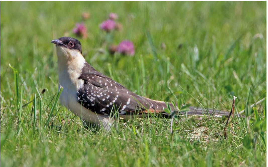
447 Kuifkoekoek / Great Spotted Cuckoo Clamator glandarius , juveniel, Den Oever, Noord-Holland, 20 juli 2011