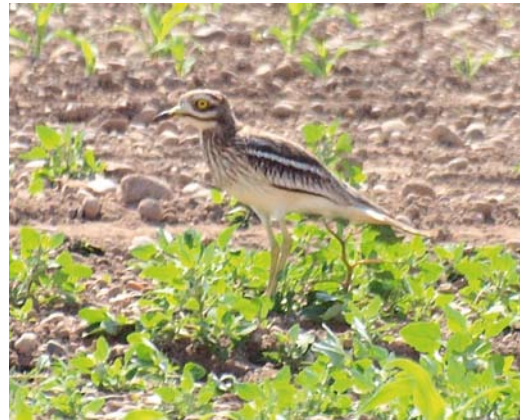
436 Siberian Accentor / Bergheggenmus Prunella montanella , Utsira, Rogaland, Norway, 6 August 2011 437 Eleonora's Falcon / Eleonora's Valk Falco eleonorae , second calendar-year, Oostvaardersplassen, Flevoland, Netherlands, 17 September 2011 438 Sharp-tailed Sandpiper / Siberische Strandloper Calidris acuminata , Reckahner Teiche, Brandenburg, Germany, 11 September 2011 439 Eurasian Stone-curlew / Griel Burhinus oedicnemus , southern Germany, 14 May 2011 cf Dutch Birding 33: 263, 2011

ing one and two fledglings; since the populations in southern Belarus and northern Ukraine seem to be on the increase, both in numbers and range, it is expected that the species will colonize eastern Poland in the future (Ornis Polonica 52: 150-154, 2011). The fourth Alpine Swift Apus melba for Iceland turned up on Heimaey on 6 August. A Red-eyed Vireo Vireo olivaceus on St Mary's, Scilly, from 13 September was this autumn's first Nearctic passerine at Ottenby, Öland, from 11 July until 17 August. A Great Grey Shrike L. excubitor showing features of the subspecies homeyeri at Fochtelöerveen, Drenthe/Friesland, from 7 August to at least 15 September attracted many birders; apparently