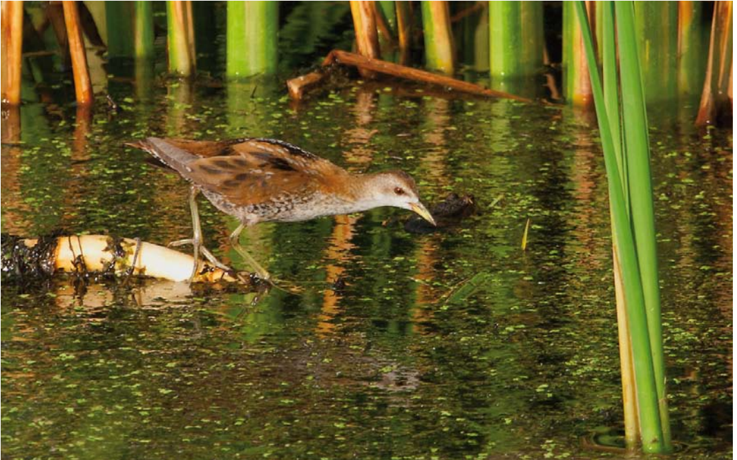
440 Little Crake / Klein Waterhoen Porzana parva , juvenile, Almere, Flevoland, Netherlands, 16 September 2011 ( Mattias Hofstede )