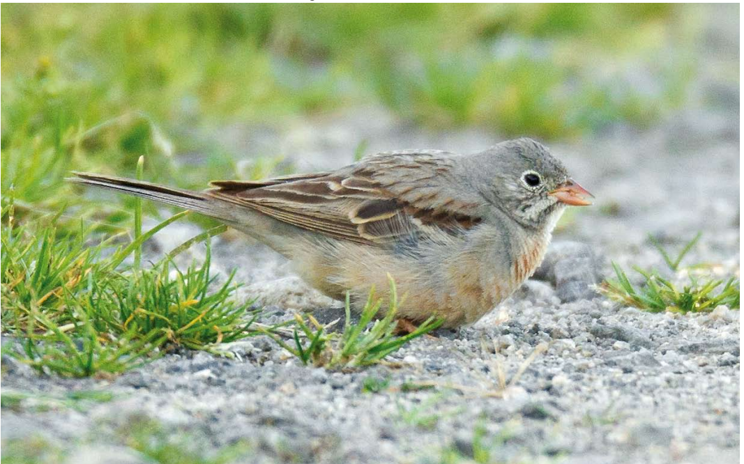
441 Grey-necked Bunting / Steenortolaan Emberiza buchanani , adult female, Lista, Farsund, Vest-Agder, Norway, 12 August 2011 ( Eivind Sande )