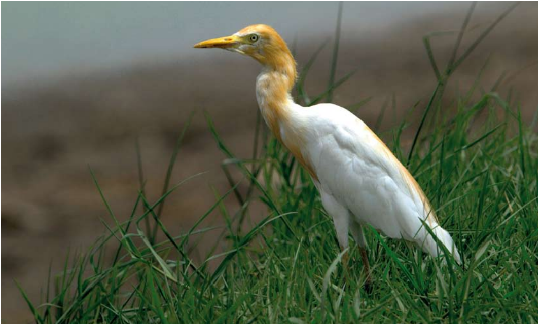
374 Eastern Cattle Egret / Oostelijke Koereiger Bubulcus ibis coromandus , Latkrabang, Bangkok, Thailand, 14 June 2009. Rusty colours of adult summer plumage on head and neck more patchy, and may briefly recall Western Cattle Egret B i ibis . 375 Eastern Cattle Egret / Oostelijke Koereiger Bubulcus ibis coromandus , Baga, Goa, India, 14 January 2009. Proportions of this bird comparable with genus Egretta . Dark bill-tip may persist through second calendar-year, although staining from mud may also account for this feature, as appears to be the case here. Note that adult winter plumage Intermediate Egret Mesophoyx intermedia also shows dark-tipped pale orange-yellow bill, a potential pitfall.