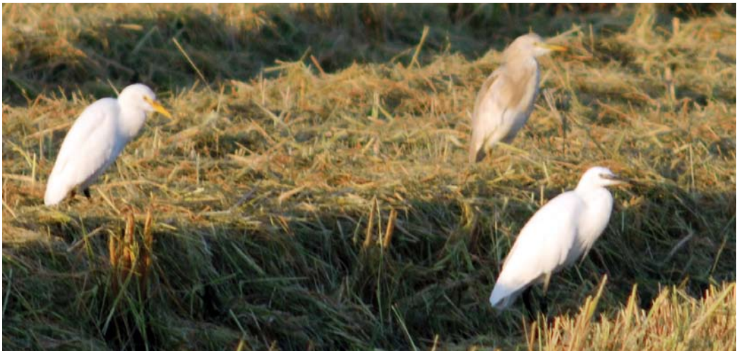
398 Hybrid Squacco Heron x Cattle Egret / hybride Ralreiger x Koereiger Ardeola ralloides x Bubulcus ibis (centre), with Cattle Egret / Koereiger (left) and Little Egret / Kleine Zilverreiger Egretta garzetta (front), Ebro delta, Catalunya, Spain, 18 September 2010

The description is based on notes taken on 18 September 2010 and 1 January 2011, as well as on photographs and videos from both dates.