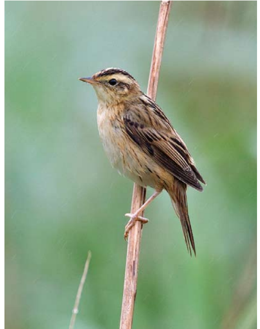
464 Scharrelaar / European Roller Coracias garrulus , Zuidland, Zuid-Holland, 10 juli 2011 465 Waterrietzanger / Aquatic Warbler Acrocephalus paludicola , Groene Jonker, Zevenhoven, Zuid-Holland, 13 augustus 2011 466 Citroenkwikstaart / Citrine Wagtail Motacilla citreola , eerste-zomer mannetje, Zeewolde, Flevoland, 16 juli 2011