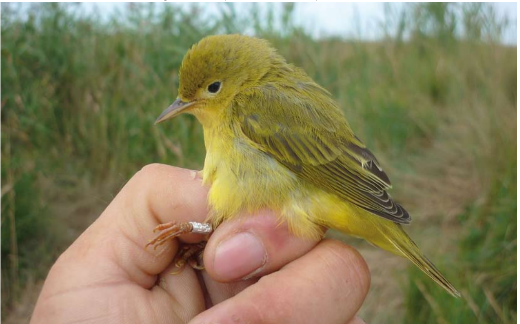
445 American Yellow Warbler / Gele Zanger Setophaga petechia , first-year, Gironde estuary, Charente-Maritime, France, 30 August 2011