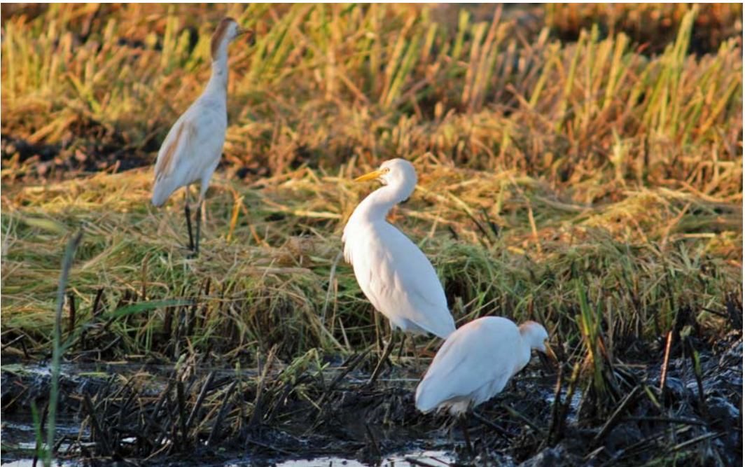
408 Cattle Egrets / Koereigers Bubulcus ibis , Ebro delta, Catalunya, Spain, 18 September 2010