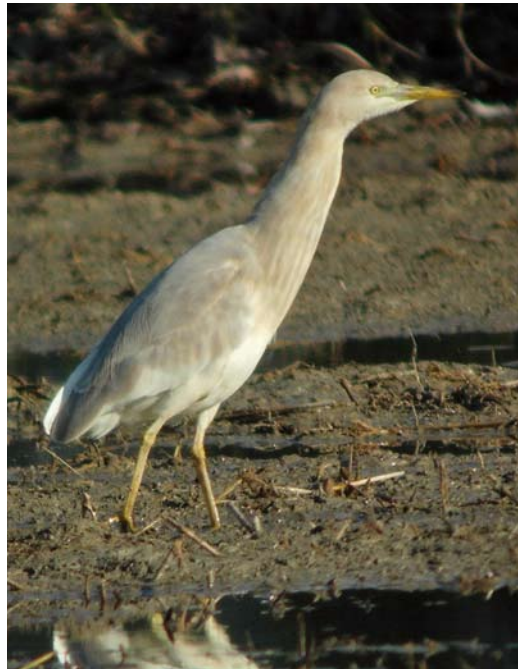
399-401 Hybrid Squacco Heron x Cattle Egret / hybride Ralreiger x Koereiger Ardeola ralloides x Bubulcus ibis , Ebro delta, Catalunya, Spain, 1 January 2011 (Ricard Gutiérrez) 402 Hybrid Squacco Heron x Cattle Egret / hybride Ralreiger x Koereiger Ardeola ralloides x Bubulcus ibis , Ebro delta, Catalunya, Spain, 2 January 2011 (Ricard Gutiérrez)

SIZE & STRUCTURE Rather like Cattle Egret but slightly smaller (direct comparison possible), probably with shorter legs; clearly smaller than Little Egret (in direct comparison) and always resting with retracted neck, in Squacco Heron-like fashion. Upper mandible straight, without any concave shape typical of Cattle Egret. In flight, showing rather hunchbacked look of Squacco Heron, with rather deep chest.