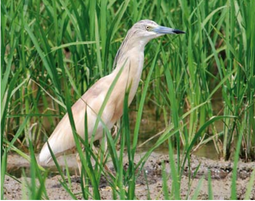
404 Squacco Heron / Ralreiger Ardeola ralloides , adult, Ebro delta, Catalunya, Spain, 8 July 2008 (Ricard Gutiérrez)