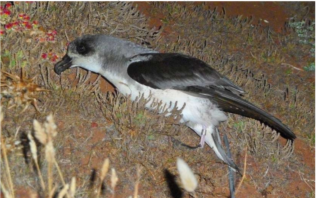
422 Desertas Petrel / Desertastormvogel Pterodroma deserta , Bugío, Desertas, Madeira, 8 July 2011