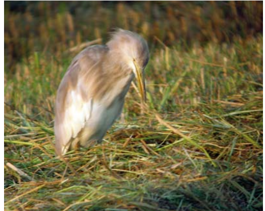
397 Hybrid Squacco Heron x Cattle Egret / hybride Ralreiger x Koereiger Ardeola ralloides x Bubulcus ibis , Ebro delta, Catalunya, Spain, 18 September 2010

Much to my surprise, however, a mid-afternoon's birding south of Platjola lagoon on 1 January 2011 together with Helena Arbonés,