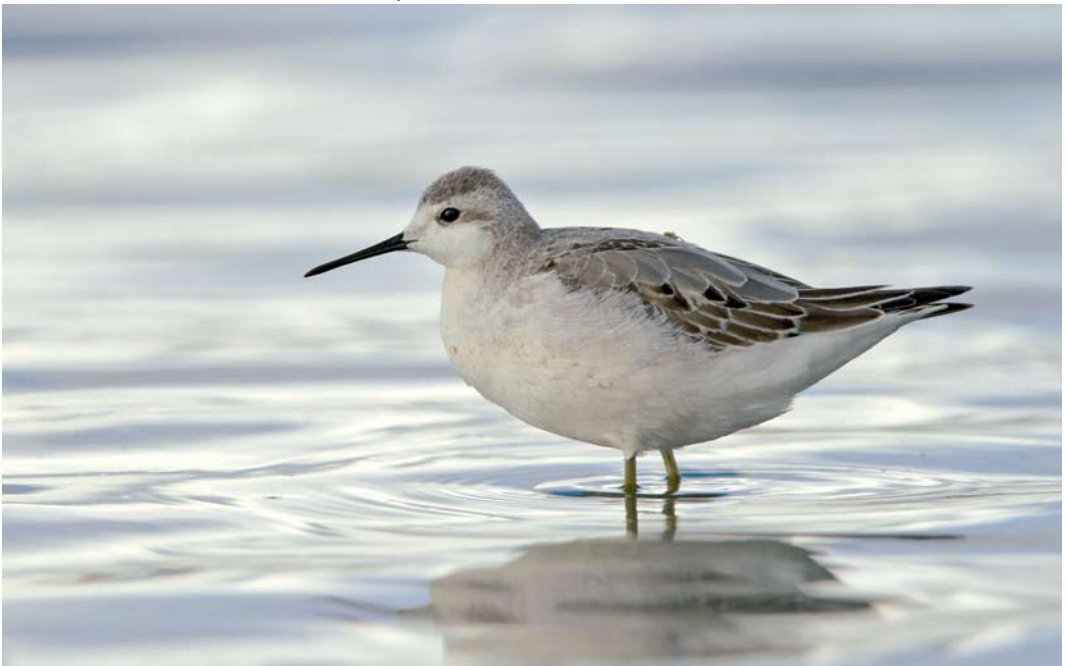
429 Wilson's Phalarope / Grote Franjepoot Phalaropus tricolor , Bakkatjörn, Seltjarnarnes, Iceland, 5 September 2011 (Yann Kolbeinsson)