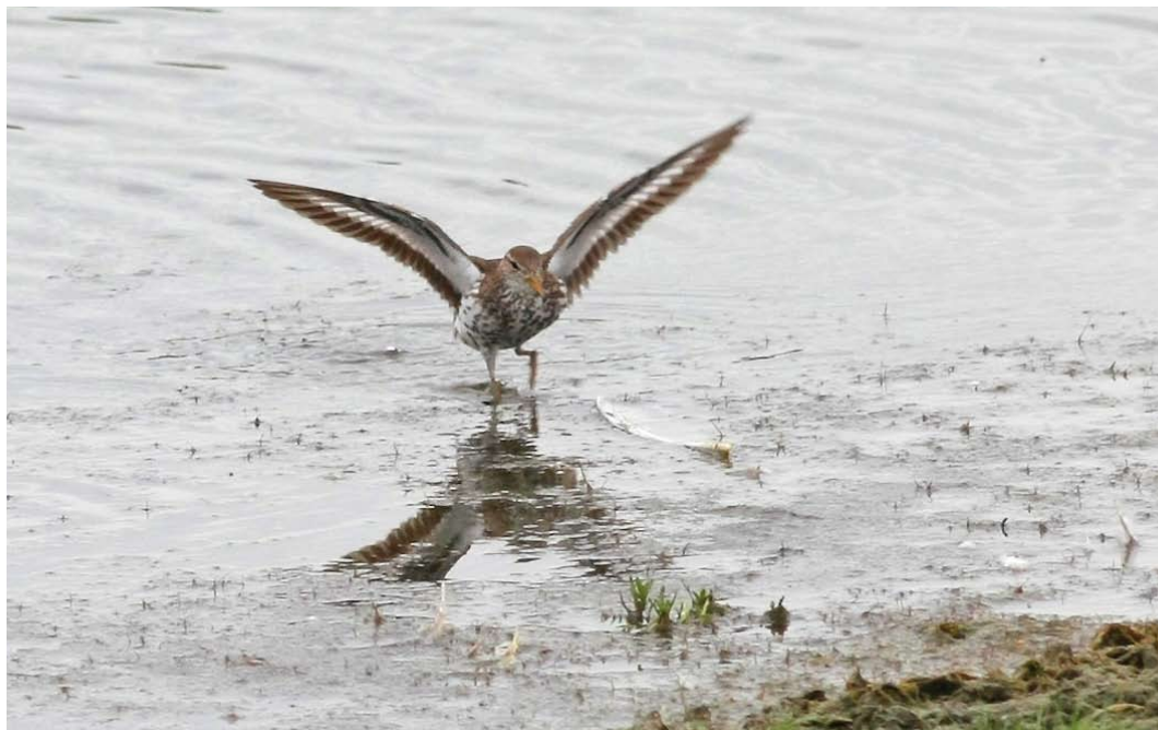
393-394 Amerikaanse Oeverloper / Spotted Sandpiper Actitis macularia , adult zomerkleed, Hogerwaardpolder, Zeeland, 31 juli 2011 ( Jaco Walhout )