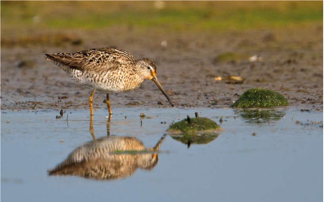
426 Short-billed Dowitcher / Kleine Grijze Snip Limnodromus griseus , Njarðvík, Iceland, 19 July 2011 (Ómar Runólfsson)