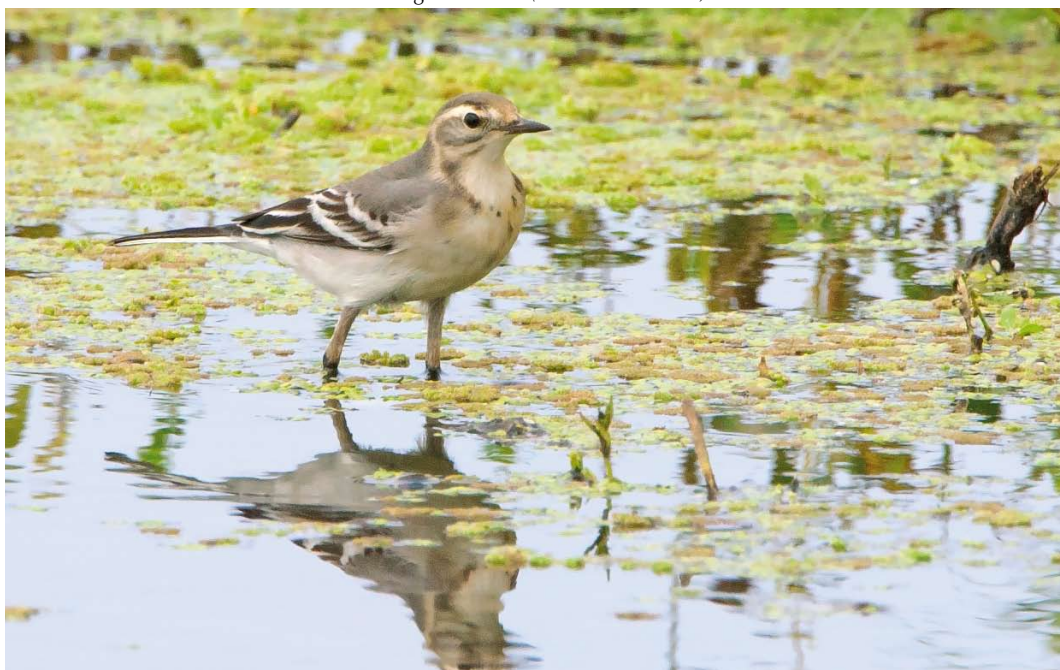
463 Citroenkwikstaart / Citrine Wagtail Motacilla citreola , eerstejaars, Belkmerweg, Petten, Noord-Holland, 25 augustus 2011