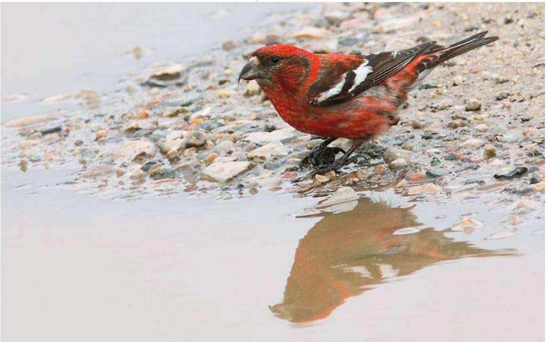
443 Two-barred Crossbill / Witbandkruisbek Loxia leucoptera bifasciata , male, Blåvands Huk, Sydvestjylland, Denmark, 24 July 2011 (Henrik Brandt)