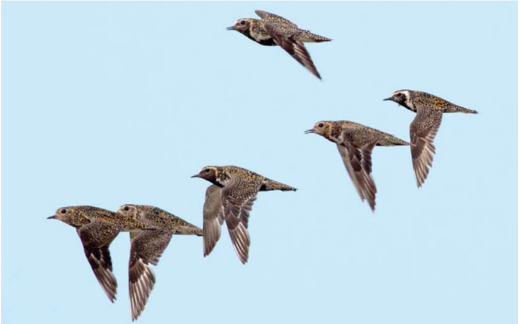
450 Aziatische Goudplevier / Pacific Golden Plover Pluvialis fulva (rechts), met Goudplevieren / European Golden Plovers P. apricaria , Wissenkerke, Zeeland, 11 juli 2011 (Pim A Wolf)