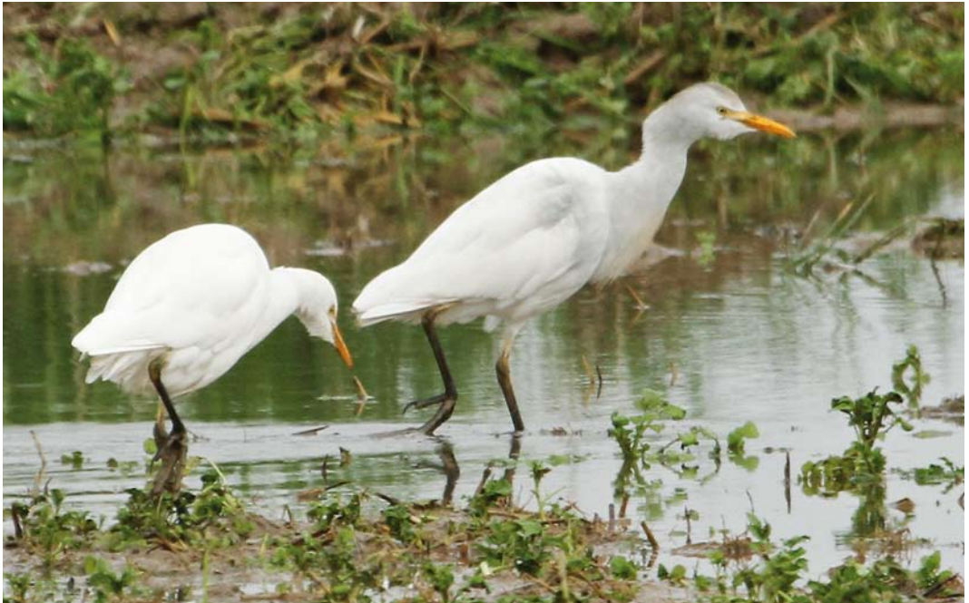
403 Cattle Egrets / Koereigers Bubulcus ibis , Albufera de Valencia, Valencia, Spain, 1 January 2011 (Juan Manuel Ferreira). Aberrantly coloured individual on right.

Adult winter Indian Pond Heron A grayii and Chinese Pond Heron A bacchus that might present