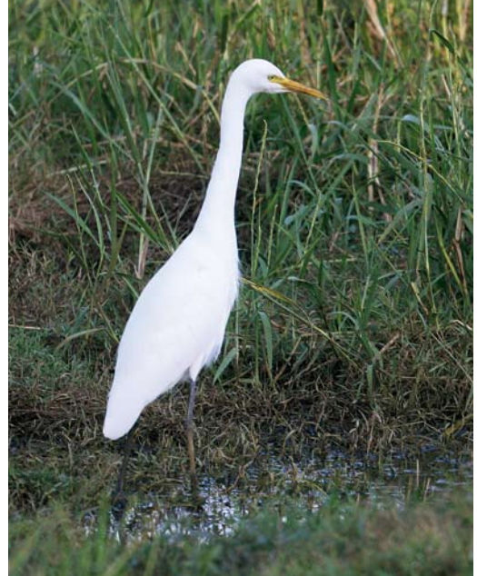
382 Western Cattle Egret / Koereiger Bubulcus ibis ibis , Route des Blicqs, Guernsey, Channel Islands, 9 February 2008. Alert posture resulting in fully outstretched neck. Legs and bill still appearing short, however. Note pale gull-grey legs; it was found that Eastern Cattle Egret B i coromandus does not show this coloration. 383 Eastern Cattle Egret / Oostelijke Koereiger Bubulcus ibis coromandus , Baga, Goa, India, 11 January 2009. Length of bill, neck and legs all reminiscent of genus Egretta .

neck and thick lower neck, whereas the neck in coromandus is more evenly slender. Ibis tends to show a more obvious jowl (shaggy or thick-looking feathering on the chin) than coromandus (plate 380), and the latter generally shows a less steep angle in the feathering on the chin. It was found that coromandus tends not to show a vertical slope in the forehead feathers, this being more likely to be shown by ibis , and more apparent in adult summer plumage. The extent of the jowl and position of the crest feathers varies in both subspecies, however, depending on levels of aggression and fear (Voisin 1991). Kushlan & Hancock (2005) state that coromandus shows more extensive feathering on the tibia. Rasmussen & Anderton (2005) state that ibis shows less bare facial skin than coromandus . Although both taxa can show black legs (contra Rasmussen & Anderton (2005) and Brazil (2009) who both state that only coromandus shows black legs), it was found that only ibis shows a pale 'gull grey' leg coloration in adult winter plumage (plate 382). However, a coromandus in transition between yellow/green and black legs could theoretically show this coloration. Voisin (1991) stated that the colour of the feet