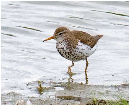
395 Amerikaanse Oeverloper / Spotted Sandpiper Actitis macularia , adult zomerkleed, Hogerwaardpolder, Zeeland, 31 juli 2011 (Marcel Klootwijk)