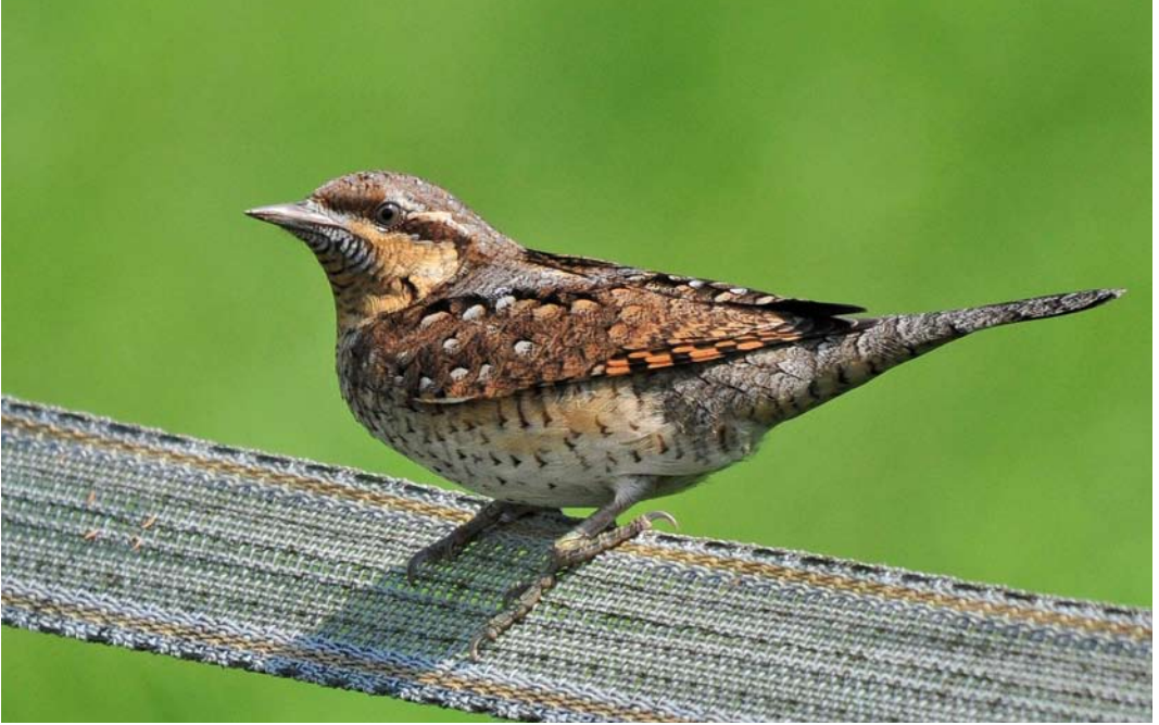
467 Draaihals / Eurasian Wryneck Jynx torquilla , De Uithof, Utrecht, Utrecht, 2 september 2011

Eltenberg, Gelderland. Na berichten over hoge aantallen Witbandkruisbekken Loxia leucoptera in onder meer Denemarken volgden enkele meldingen: op 3 augustus bij Noordwijk (geluidsopname), op 20 augustus over trektelepost Kwintelooyen bij Veenendaal, Utrecht (geluidsopname), en een mannetje op 24 augustus bij Bussum, Noord-Holland. Op een drietal plekken werden Roodmussen Carpodacus erythrinus waargenomen,