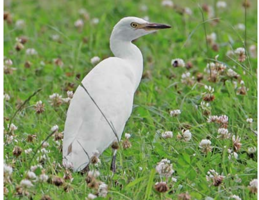
384 Western Cattle Egret / Koereiger Bubulcus ibis ibis , first calendar-year, Chew Valley Lake, Somerset, England, 3 August 2008. Plumage of Eastern Cattle Egret B i coromandus of same age is similar, although structural differences still evident in some individuals.

HERKENNING VAN ONDERSOORTEN EN STATUS VAN KOEREIGER Zowel nominaat Koereiger Bubulcus ibis ibis als Oostelijke Koereiger B i coromandus zijn in staat om grote afstanden af te leggen en coromandus dient daarom te worden beschouwd als waarschijnlijke dwaalgast in het West-Palearctische gebied. Dwaalgasten zijn reeds vastgesteld op het Arabisch Schiereiland (Oman, Verenigde Arabische Emiraten); een geval in Tunesië is van twijfelachtige herkomst. In dit artikel wordt de herkenning van beide ondersoorten (die volgens sommige auteurs soortstatus verdie-