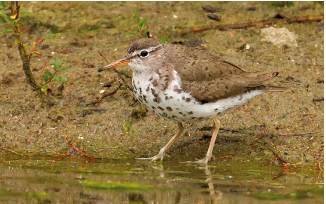
431 Spotted Sandpiper / Amerikaanse Oeverloper Actitis macularius , adult summer, Het Rot, Antwerpen, Antwerpen, Belgium, 4 August 2011