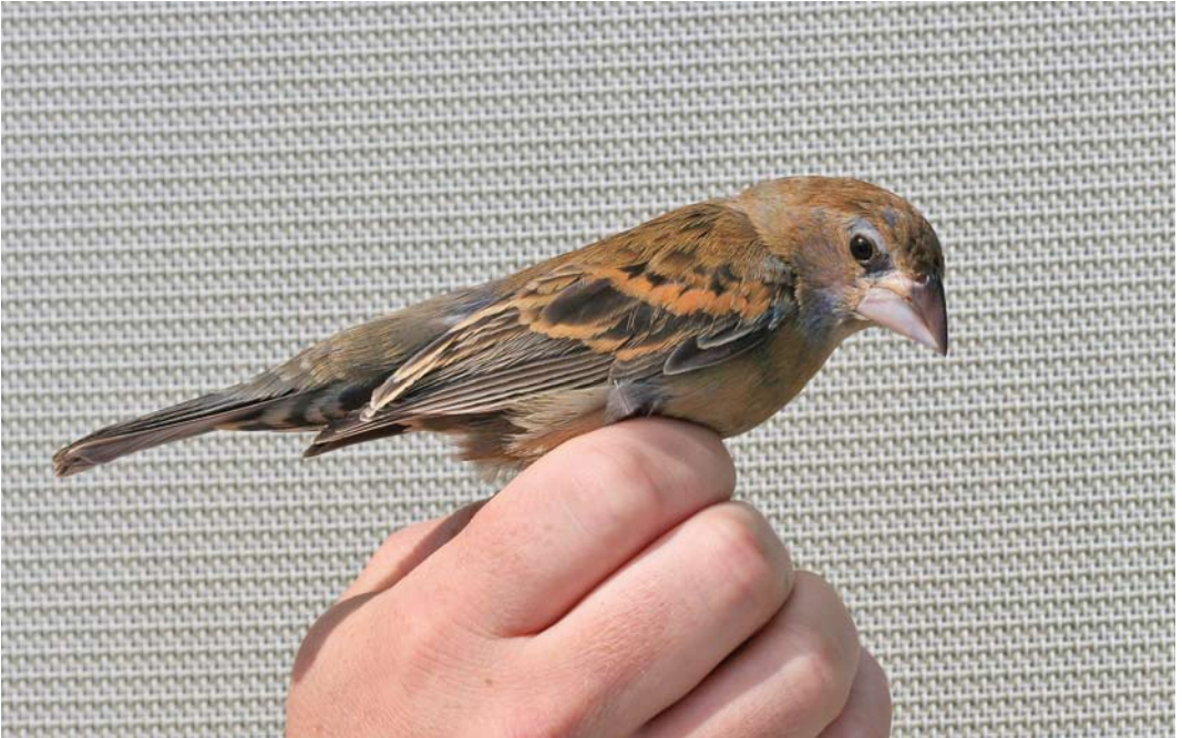
444 Blue Grosbeak / Blauwe Bisschop Passerina caerulea , female, Store Færder, Vestfold, Norway, 15 July 2011 (Stig Eid)