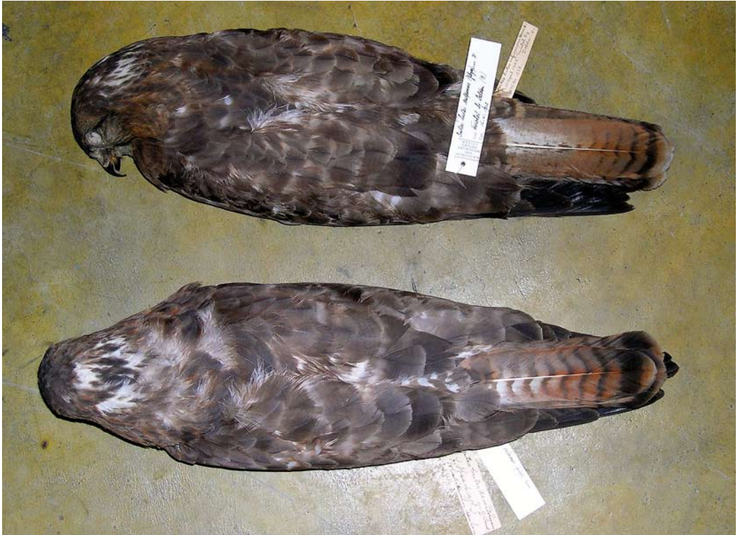
365-366 Steppebuizerds / Steppe Buzzards Buteo buteo vulpinus , adult mannetje (verzameld te Twickel, Overijssel, op 16 april 1902; boven), met adult vrouwtje (verzameld in Zuid-Rusland in maart 1908), Nederlands Centrum voor Biodiversiteit Naturalis, Leiden, Zuid-Holland, 15 maart 2006. Zie opvallende gelijkenis, hoewel patroon van onderdelen niet diagnostisch is voor vulpinus . Nederlands exemplaar heeft staartpatroon dat zelfs verder van nominaat buteo afligt dan exemplaar uit Zuid-Rusland. Staartpatronen samen benaderen grens van bandbreedte binnen 'rossige' vorm van vulpinus .

ter een gebandeerde staart en een patroon dat kan overlappen met nominaat buteo (gemiddeld vanaf banderingsverhouding 3:4), maar de hieronder genoemde kenmerken zijn indicatief voor vulpinus (in belangrijkheid aflopend). 1 Smalle donkere bandering (verhouding \leq 2:4 ) die ook nog versmalt of wegvalt naar basis; of bij adult smalle donkere bandering met relatief grote tussenruimten, soms slechts 5-8 banden maar dichtere staartbandering komt ook bij adult regelmatig voor. Bij vulpinus is de centrale donkere bandering duidelijk smaller dan de lichte tussendelen (verhouding \leq 2:4 ); hoe smaller, hoe sterker indicatief - maar sommige oude nominaat buteo kunnen ook zeer smalle staartbandering hebben. Naast grote individuele variatie hebben juveniele staartpenen gemiddeld een bredere bandering dan oudere generaties. 2 Smalle centrale bandering (verhouding \leq 2:4 ) op oranje of rossige basiskleur of in combinatie met