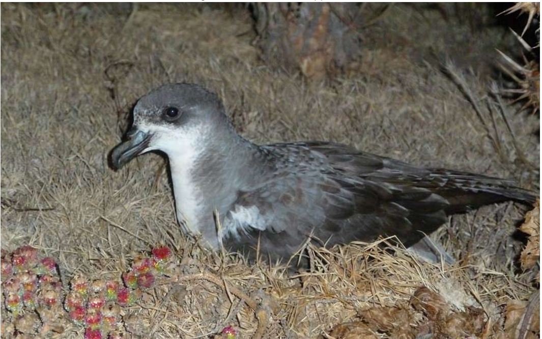
419 Desertas Petrel / Desertastormvogel Pterodroma deserta , Bugío, Desertas, Madeira, 8 July 2011