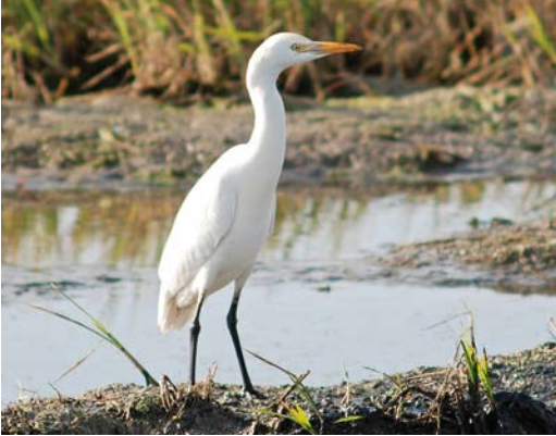
407 Cattle Egret / Koereiger Bubulcus ibis , Ebro delta, Catalunya, Spain, 8 December 2009

Dies et al 2001), one of which has frequented Ebro delta for 10 years in a row since it fledged there in 2002 (Dies et al 2010).