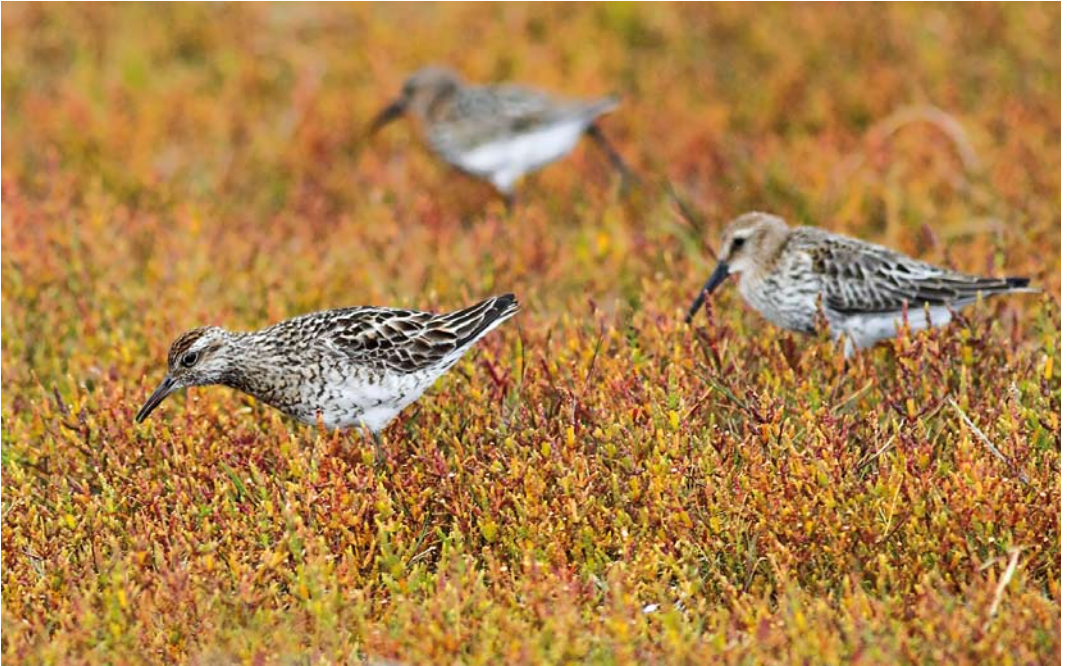
430 Sharp-tailed Sandpiper / Siberische Strandloper Calidris acuminata , adult summer, with Dunlins / Bonte Strandlopers C alpina , Tacumshin, Wexford, Ireland, 30 August 2011