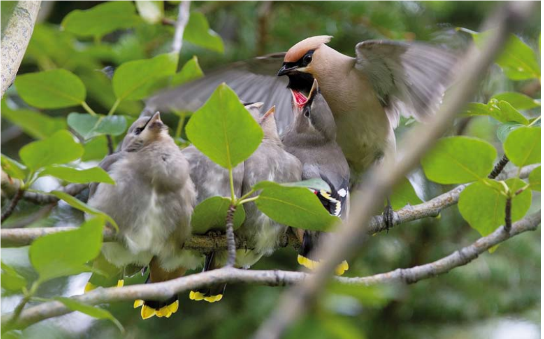
442 Bohemian Waxwings / Pestvogels Bombycilla garrulus , adult feeding young, Reykjahlíð, Mývatnssveit, Iceland, 29 July 2011 (Yann Kolbeinsson)