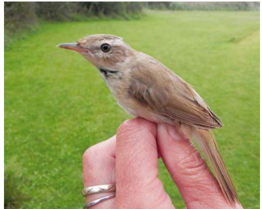
458 Groene Bijeneter / Blue-cheeked Bee-eater Merops persicus , Slikken van Flakkee, Zuid-Holland, 22 juli 2011 ( Henk Gazan ) 459 Vermoedelijke Homeyers Klapekster / presumed Homeyer's Great Grey Shrike Lanius excubitor homeyeri , adult, Fochteloërveen, Drenthe, 4 september 2011 ( Toy Janssen ) 460 Krekeltzanger / River Warbler Locustella fluviatilis , eerstejaars, Noordhollands Duinreservaat, Castricum, Noord-Holland, 21 augustus 2011 ( Arnold Wijker ) 461 Veldrietzanger / Paddyfield Warbler Acrocephalus agricola , AW-Duinen, Zandvoort, Noord-Holland, 26 augustus 2011 ( Hans Vader/Vrs AW-duinen )

Terschelling. Vanaf 9 augustus werden langs de kust 10 Vorkstaartmeeuwen Xema sabini opgemerkt, waaronder twee adulte die op 30 augustus samen langs Ameland vlogen. Een adulte Ross' Meeuw Rhodostetia rosea – wellicht dezelfde als in april bij Numansdorp, Zuid-Holland – werd gemeld op 30 juli bij Noordwijk, op 31 juli langs Noordwijk en de Langevelderslag en op 12 en 15 augustus langs Katwijk in Zuid-Holland. Het hoogste aantal Lachsterns Gelochelidon nilotica bedroeg 32 op 8 augustus op de traditionele slaappleaats op het Balgzand, Noord-Holland. Daaronder bevonden zich drie juveniele vogels. Langstreckende exemplaren werden gezien in Zuid-Holland op 19 juli vanaf de Vulkaan bij Den Haag en op 12 augustus langs Katwijk en Scheveningen. Concentraties van 10 tot 30 Reuzensterns Hydroprogne caspia werden waargenomen in de Workumerwaard, de Makkumerwaard en bij Paesens in