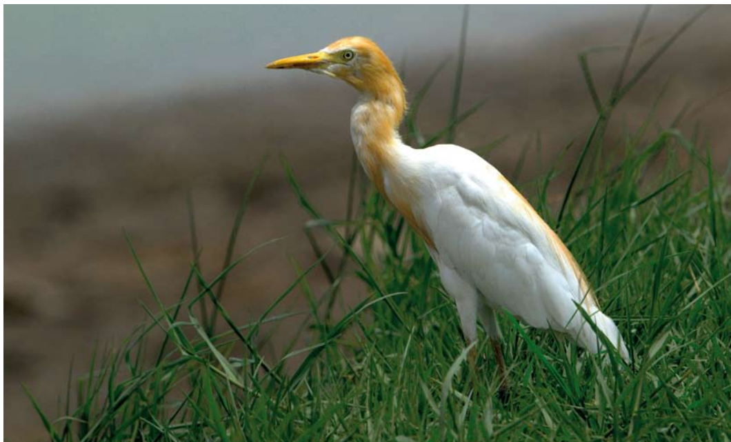
374 Eastern Cattle Egret / Oostelijke Koereiger Bubulcus ibis coromandus , Latkrabang, Bangkok, Thailand, 14 June 2009. Rusty colours of adult summer plumage on head and neck more patchy, and may briefly recall Western Cattle Egret B i ibis . 375 Eastern Cattle Egret / Oostelijke Koereiger Bubulcus ibis coromandus , Baga, Goa, India, 14 January 2009. Proportions of this bird comparable with genus Egretta . Dark bill-tip may persist through second calendar-year, although staining from mud may also account for this feature, as appears to be the case here. Note that adult winter plumage Intermediate Egret Mesophoyx intermedia also shows dark-tipped pale orange-yellow bill, a potential pitfall.