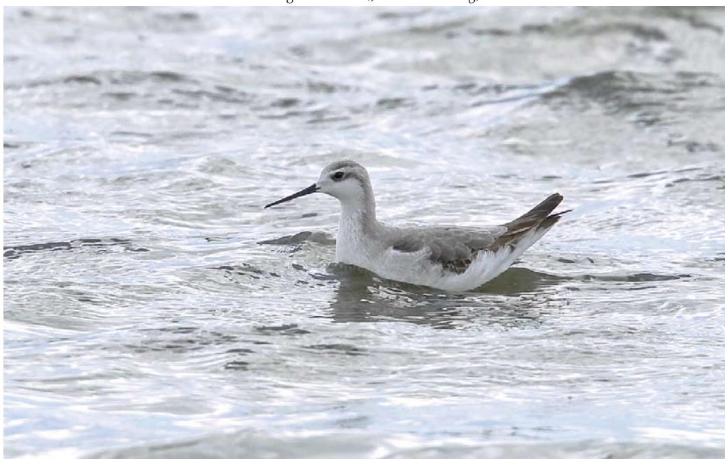
449 Grote Franjepoot / Wilson's Phalarope Phalaropus tricolor , eerstejaars, Wagejot, Texel, Noord-Holland, 28 augustus 2011