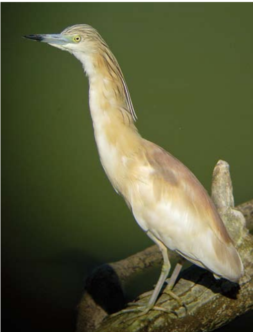
406 Squacco Heron / Ralreiger Ardeola ralloides , adult, Llobregat delta, Catalunya, Spain, 25 May 2006

head and mantle was not evident (or absent) in September and this agrees with a start of growth in autumn, growing through January-February, to be retained until replacement during the following post-breeding moult (Pyle & Howell 2004).