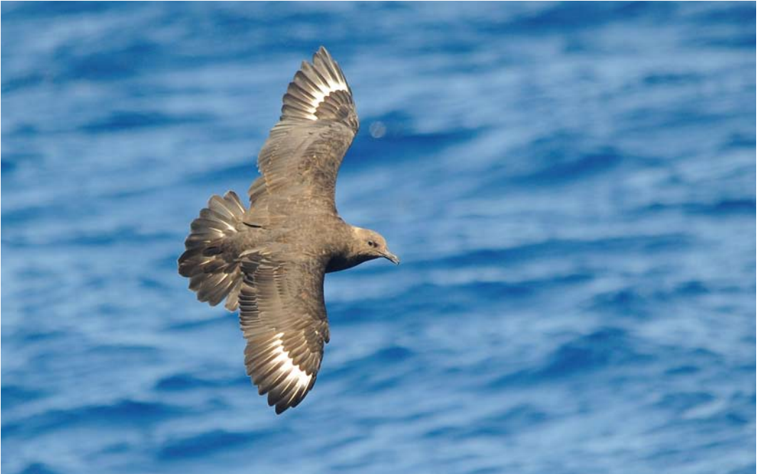
418 South Polar Skua / Zuidpooljager Stercorarius maccormicki , off Lanzarote, Canary Islands, 10 September 2011