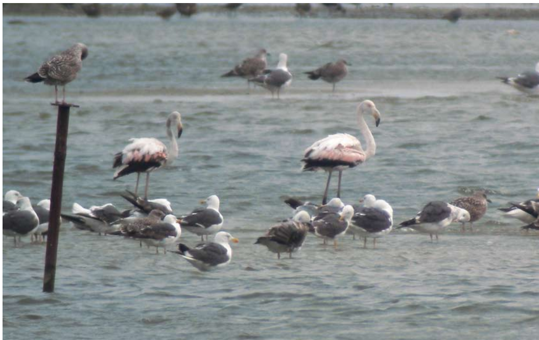
448 Flamingo's / Greater Flamingos Phoenicopterus roseus , onvolwassen, Kinselbaai, Waterland, Noord-Holland, 21 augustus 2011