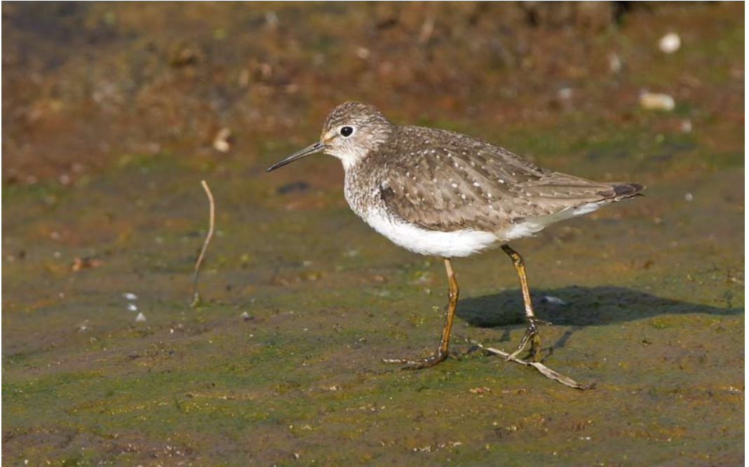
428 Solitary Sandpiper / Amerikaanse Bosruiter Tringa solitaria , Húsavík, Iceland, 27 July 2011