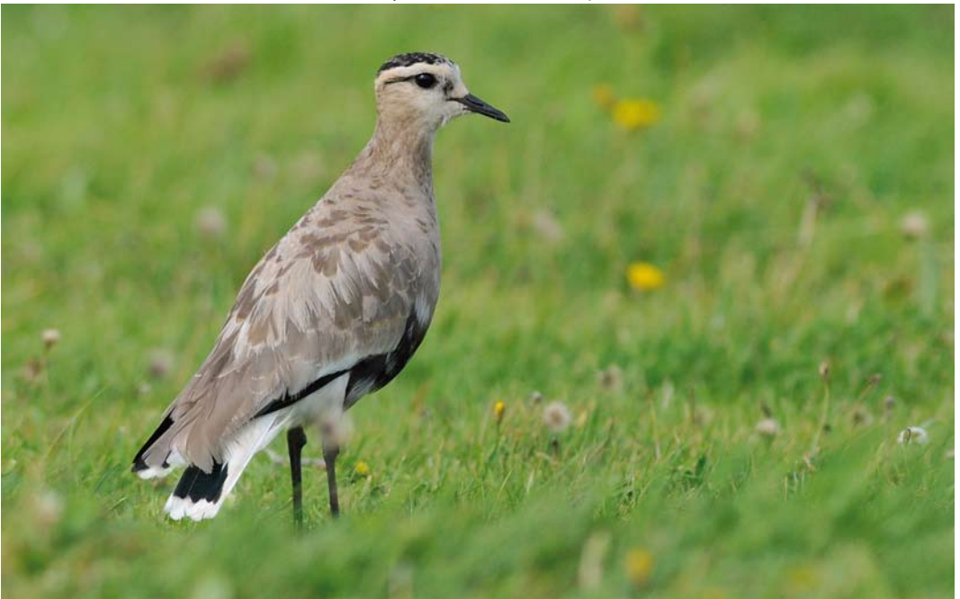
427 Sociable Lapwing / Steppekievit Vanellus gregarius , adult, Texel, Noord-Holland, Netherlands, 20 September 2011 (René Pop)