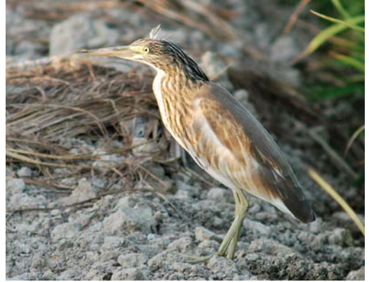
405 Squacco Heron / Ralreiger Ardeola ralloides , juvenile, Ebro delta, Catalunya, Spain, 25 July 2009 (Ricard Gutiérrez)

head and mantle was not evident (or absent) in September and this agrees with a start of growth in autumn, growing through January-February, to be retained until replacement during the following post-breeding moult (Pyle & Howell 2004).