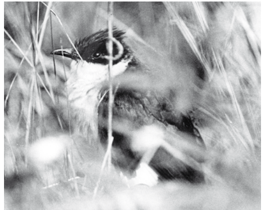
413-416 Jacobin Cuckoo / Jacobijnkoekoek Clamator jacobinus , Lehtimäki, Finland, 11 September 1976

Seychelles, in March and November-January (Skerrett et al 2006), highlighting the capacity of this species for non-stop over-water flights. In the Himalayas, vagrants have reached altitudes higher than 2600 m (Rasmussen & Anderton 2005). To the east, vagrants have occurred in Cambodia (Poole & Evans 2004) and Thailand, where there have been 15 records involving 19 individuals and the species may even be in the process of colonising the country (Phil Round in litt). More impressively, vagrants have reached the Ryukyu Islands, Japan, where one was videoed on Iriomote-shima on 1 June 1997 (Kamata 1997), and the Philippines, where one was recorded at Visita, Dalupiri, on 21 May 2004 (Allen et al 2006).