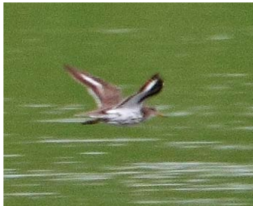
396 Amerikaanse Oeverloper / Spotted Sandpiper Actitis macularia , adult zomerkleed, Hogerwaardpolder, Zeeland, 31 juli 2011

GROOTTE & BOUW Als Oeverloper maar wat kleiner met compacter lichaam en kortere staart. Staartprojectie geschat op c 5-10 mm.