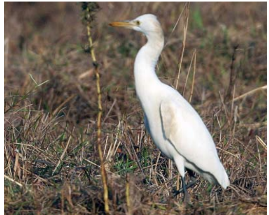
378 Eastern Cattle Egret / Oostelijke Koereiger Bubulcus ibis coromandus , Magic Wood, Laoting, Hebei, China, 15 May 2010 (Ross Ahmed). Long legs apparent, as is neck bulge. Overall shape reminiscent of larger egret, such as Intermediate Egret Mesophoyx intermedia . 379 Western Cattle Egret / Koereiger Bubulcus ibis ibis , S'Albufera, Mallorca, Balearic Islands, Spain, 10 May 2010 (Garth Peacock). Compared with Eastern Cattle Egret B i coromandus in plate 378, legs shorter and neck bulge smaller. Overall impression smaller and more compact than coromandus . 380 Western Cattle Egret / Koereiger Bubulcus ibis ibis , Legbourne, Lincolnshire, England, 9 February 2008 (Darren Chapman). Note shaggy chin-feathers, known as jowl, contributing to rather bulbous head. Chin-feathers tend to be more shaggy in ibis than in Eastern Cattle Egret B i coromandus but is dependent on levels of aggression and fear. Short legs and neck, both characteristic of ibis , both readily apparent. 381 Eastern Cattle Egret / Oostelijke Koereiger Bubulcus ibis coromandus , Baga, Goa, India, 17 January 2009 (Ross Ahmed). Note staining on nape and shoulders, most likely from mud or dust. Stained adult summer plumage in Western Cattle Egret B i ibis could invite confusion with coromandus .

ibis returning to nesting colonies for the breeding season ranged from all white to pale patchy buff to full summer plumage. A second calendar-year coromandus showing patchy summer plumage could invite confusion with ibis . Biometrics from eight skins of juvenile ibis and coromandus were analysed. The indications are that the same structural differences used in the separation of adults still apply to juveniles (see below). However, the sample size of biometrics of first and second