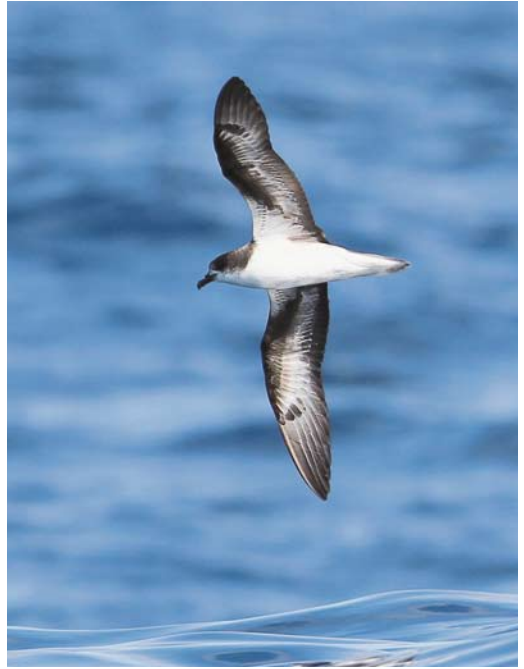
420-421 Zino's Petrel / Freira Pterodroma madeira , off north-eastern Madeira, 4 August 2011