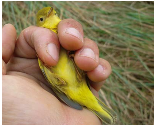
409-412 American Yellow Warbler / Gele Zanger Setophaga petechia , first-year, Gironde estuary, Charente-Maritime, France, 30 August 2011