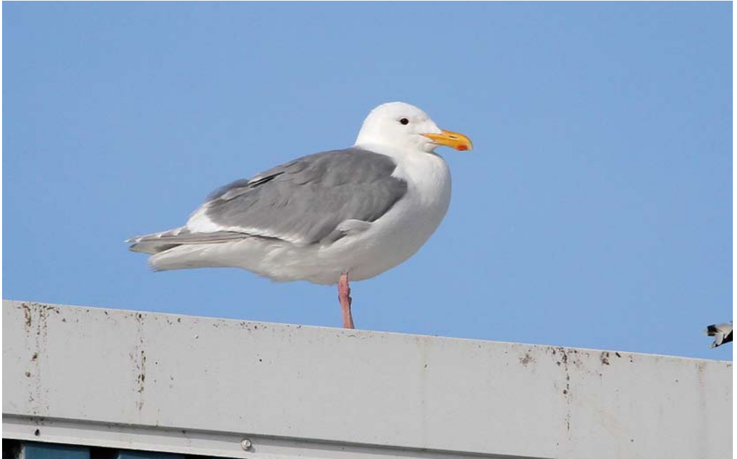
423 Glaucous-winged Gull / Beringmeeuw Larus glaucescens , adult, Vardø, Norway, 27 July 2011 ( Jakob Hochuli ) 424 Yellow-crowned Night Heron / Geelkruinkwak Hydranassa violacea , Funchal, Madeira, 23 August 2011 ( Menno Hornman ) 425 Dwarf Bittern / Afrikaanse Woudaap Ixobrychus sturmii (shot at Wied ix-Xoqqa, Birżebbuġa, Malta, on 16 November 2010), Malta, March 2011 ( Natalino Fenech )