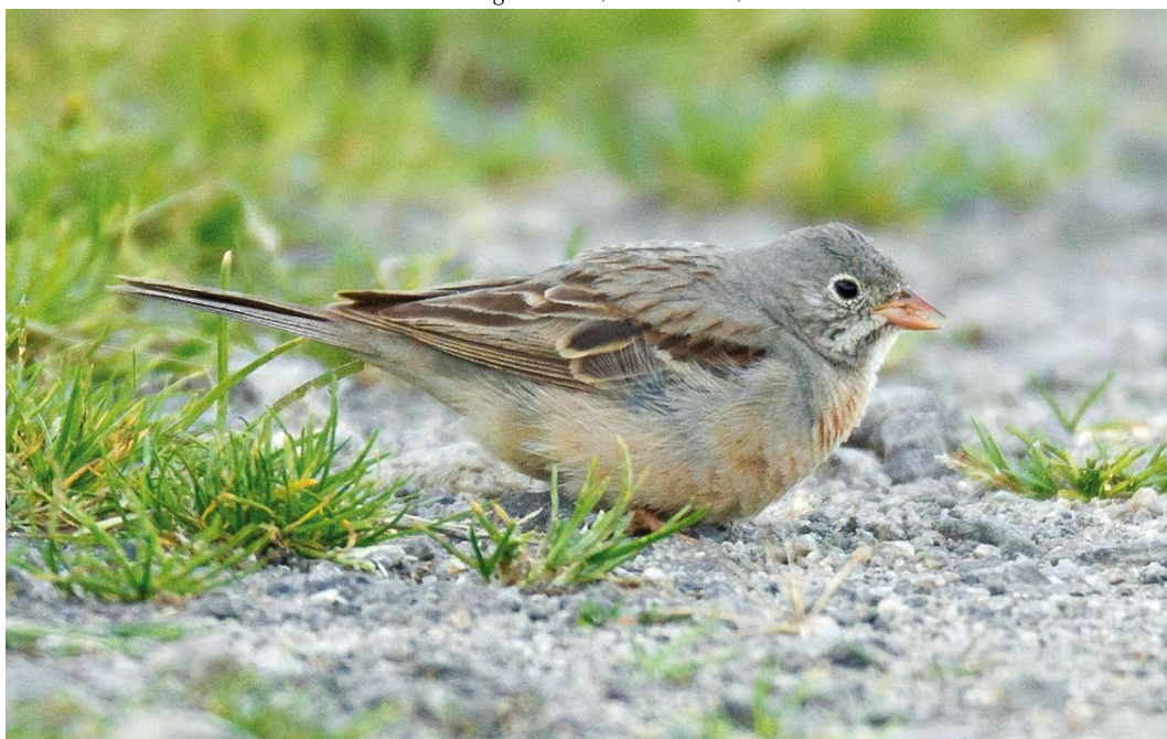
441 Grey-necked Bunting / Steenortolaan Emberiza buchanani , adult female, Lista, Farsund, Vest-Agder, Norway, 12 August 2011 ( Eivind Sande )