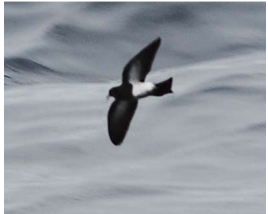
432 Sandhill Crane / Canadese Kraanvogel Grus canadensis (right), with Common Crane / Kraanvogel G. grus , Espoo, Laajalahti, Finland, 5 September 2011 ( Joonatan Toivanen ) 433 Little Bustard / Kleine Trap Tetrax tetrax , adult male, Otterlosche Zand, Hoge Veluwe, Gelderland, Netherlands, 3 September 2011 ( Jaap Denee ) 434 American Black Tern / Amerikaanse Zwarte Stern Chlidonias niger surinamensis , juvenile, Covenham Reservoir, Lincolnshire, England, 17 September 2011 ( Graham Catley ) 435 Black-bellied Storm Petrel / Zwartbuikstormvogeltje Fregetta tropica , off Madeira, 8 August 2011 ( Ricardo van Dijk )

Balgzand, Noord-Holland, was 32 (including three juveniles) on 8 August. In Gulf of Cagliari, Sardinia, 70-80 breeding pairs were counted. On 3 September, a juvenile American Black Tern Chlidonias niger surinamensis was reported at Brandon Point, Kerry. A juvenile at Covenham Reservoir, Lincolnshire, from 17 September was the first for eastern England. In southern Spain, a presumed adult Elegant Tern Sterna elegans was photographed at Doñana on 31 August. Like the Dutch taxonomic committee, the TSC of the BOURC recommends to recognize Cabot's Tern S. acullavida (with subspecies acullavida and eurygnatha ) as a separate species from Sandwich Tern S. sandvicensis (monotypic) (Ibis 153: 883-892, 2011); in the WP, Cabot's Tern has been recorded thanks to ringing recoveries from North Carolina, USA, in England (25 November 1984) and the Netherlands (23 December 1978; Dutch Birding 1: 60,