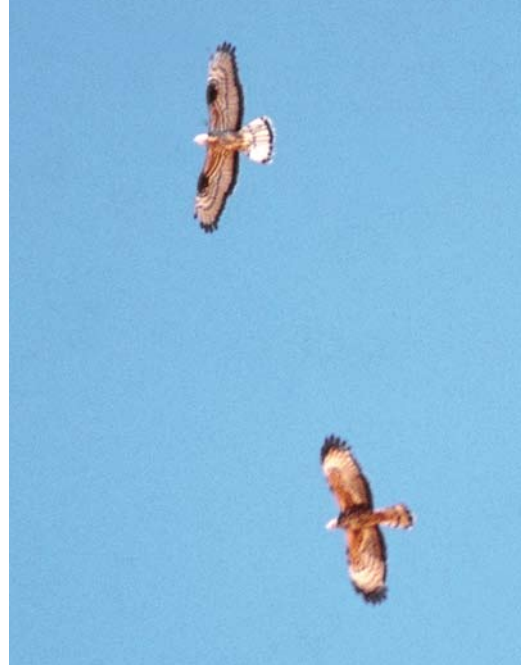
175 Crested Honey Buzzard / Aziatische Wespindief Pernis ptilorhyncus , female, pale morph (below), with European Honey Buzzard / Wespindief P.apivorus , Eilat, Israel, mid-May 2001. Note broader wings of ptilorhyncus than apivorus , with six fingered primaries and dark gorget. Extensive dark outer primaries may indicate second calendar-year plumage.

Orientalis records are considered by the Oman Bird Records Committee; this record was submitted as a hybrid between orientalis and apivorus . If accepted as such, it would be the first for Oman.