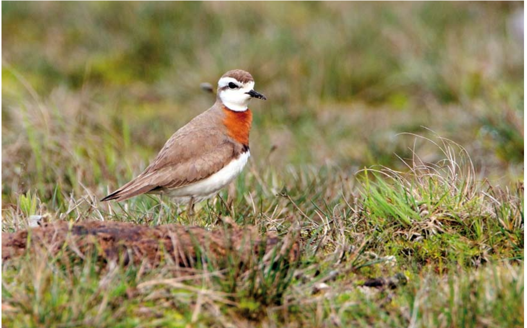
228 Kaspische Plevier / Caspian Plover Charadrius asiaticus , adult mannetje, De Nederlanden, Texel, Noord-Holland, 28 april 2011 229 Kaspische Plevier / Caspian Plover Charadrius asiaticus , adult mannetje, De Nederlanden, Texel, Noord-Holland, 28 april 2011 230 Kaspische Plevier / Caspian Plover Charadrius asiaticus , adult mannetje, De Nederlanden, Texel, Noord-Holland, 28 april 2011