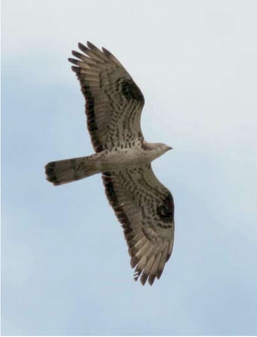
174 European Honey Buzzard / Wespindief Pernis apivorus , adult male, Kasmala, Altay kraj, southern Siberia, Russia, 24 June 2009. Pale-morph bird showing typical slim appearance and five fingered primaries, as well as clear and contrasting carpal patch. Tail pattern and yellow iris also typical for male apivorus . Photograph taken at far eastern edge of breeding range of apivorus , very close to supposed overlap zone with Crested Honey Buzzard P.ptilorhyncus .