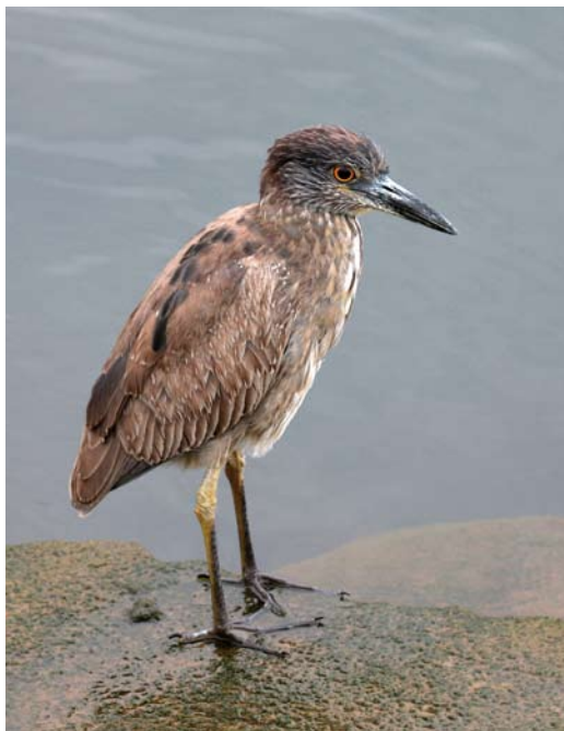
231 Yellow-crowned Night Heron / Geelkruinkwak Nyctanassa violacea , first-year, Funchal, Madeira, 27 March 2011 (Frank Zino)