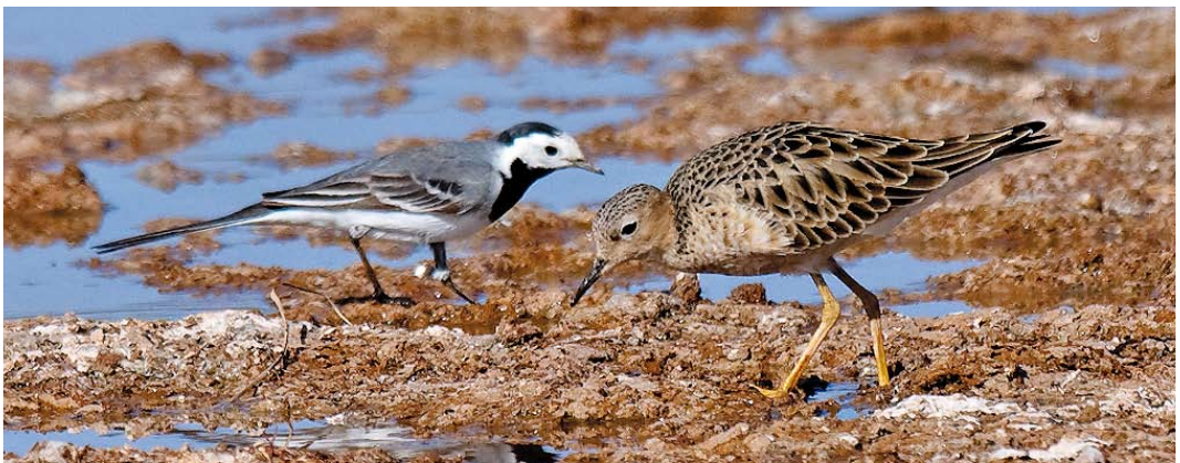
240 White-tailed Tropicbird / Witstaartkeerringvogel Phaethon lepturus , off Santiago, Cape Verde Island, 3 May 2011 241 Calandra Lark / Kalandereleeuwrik Melanocorypha calandra , Verlée, Liège, Belgium, 14 May 2011 242 Baikal Teal / Siberische Taling Anas formosa , male, Drijdyck, Oost-Vlaanderen, Belgium, 13 April 2011 243 Pink-backed Pelican / Kleine Pelikaan Pelecanus rufescens , immature, Göksü delta, Turkey, 10 May 2011 244 Buff-breasted Sandpiper / Blonde Ruiters Tryngites subruficollis , with White Wagtail / Witte Kwikstaart Motacilla alba , Ouarzazate, Morocco, 10 April 2011