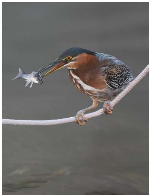
192-193 Groene Reiger / Green Heron Butorides virescens , Berre l'Étang, Bouches-du-Rhône, Frankrijk, 28 december 2008

onderscheidt vier ondersoorten van Groene Reiger waarvan er twee trekgedrag vertonen: nominaat virescens broedend in oostelijk Noord-Amerika en Mexico zuidelijk tot Panama en anthonyi in de westelijke VS en het noord-westen van Mexico. Nominaat virescens overwintert van het zuiden van de VS tot in het noorden van Colombia en Venezuela en is verder zuidwaarts zeldzaam in december-maart tot in Ecuador (Ridgely & Greenfield 2001) en Suriname (Haverschmidt & Mees 1994). Het taxon is een dwaalgast in Europa. Anthonyi is dunner gezaaid in zijn westelijke verspreidingsgebied dan nominaat virescens en trekt minder ver, om te overwinteren in Mexico. De twee niet-trekkende ondersoorten zijn frazari in zuidelijk Baja California, Mexico, en maculata van Antillen, Bahama's, Kaaimaneilanden, Tobago en andere Caribische eilanden. In verenkleed verschillen de vier ondersoorten nauwelijks terwijl de normale variatie binnen elke ondersoort groot is, vooral bij maculata (Monroe & Browning 1992). Er zijn wel verschillen in formaat waarbij maculata kleiner is dan nominaat virescens en de gemiddeld nog grotere anthonyi . Blake (1977) noemt voor anthonyi niet alleen een groter formaat maar ook een lichter verenkleed en rodere hals als onderscheid met nominaat virescens .