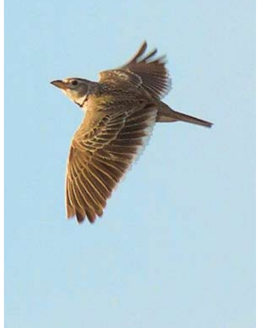
236 Eurasian Crag Martin / Rotszwaluw Ptyonoprogne rupestris , Hernar, Hordaland, Norway, 5 May 2011 237 Calandra Lark / Kalanderleeuwerik Melanocorypha calandra , Paal 48, Vlieland, Friesland, Netherlands, 8 May 2011 238 Forster's Tern / Forsters Stern Sterna forsteri , adult, Tacumshin, Wexford, Ireland, 13 May 2011