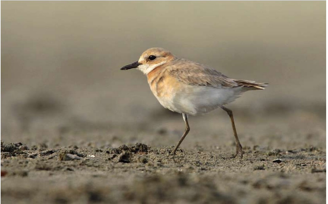
256 Woestijnplevier / Greater Sand Plover Charadrius leschenaultii , tweede-kalenderjaar, Hoek van Holland, Zuid-Holland, 27 april 2011