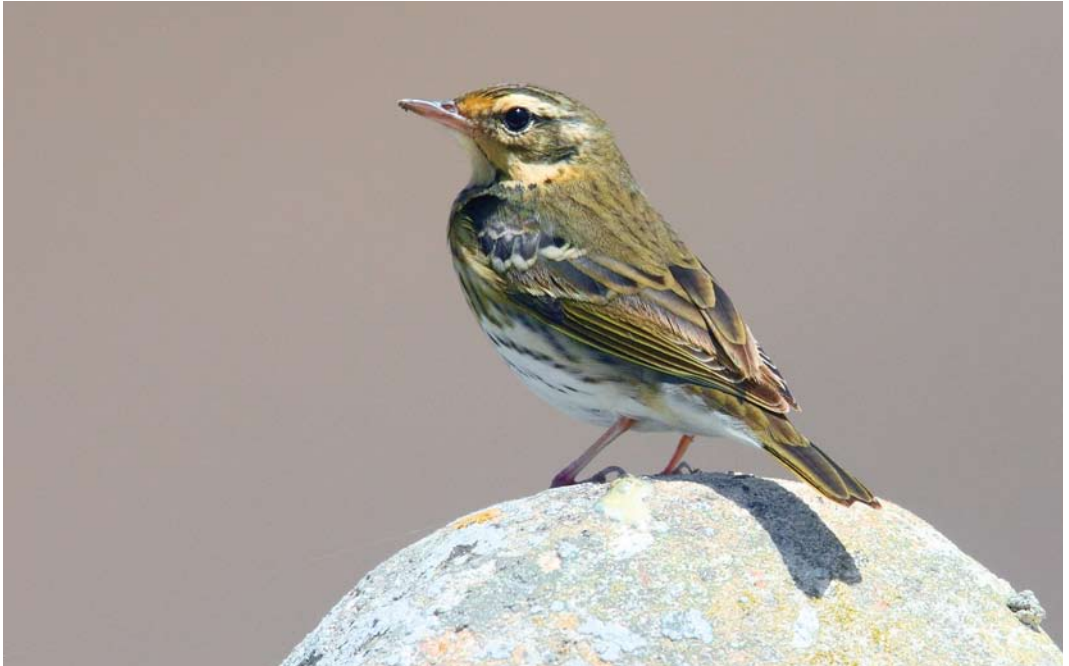
245 Olive-backed Pipit / Siberische Boompieper Anthus hodgsoni , San Bartolomé, Lanzarote, Canary Islands, 10 April 2011 ( Juan Sagardía Pradera )