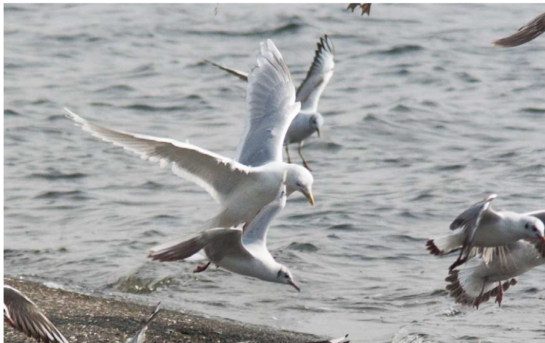
225-226 Kumliens Meeuw / Kumlien's Gull Larus glaucooides kumlieni , adult, met Kokmeeuwen / Black-headed Gulls Chroicocephalus ridibundus , De Gijster, Brabantse Biesbosch, Noord-Brabant, 3 april 2011 (Mars Muusse)