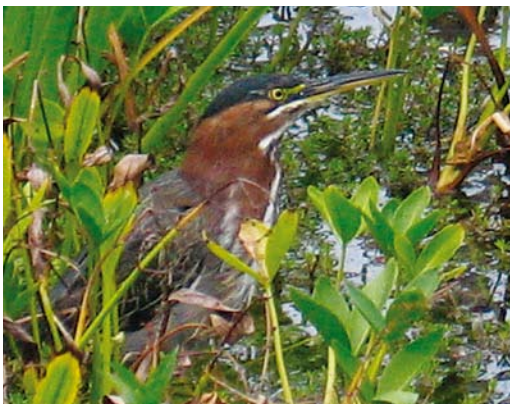
188 Groene Reiger / Green Heron Butorides virescens , Amsterdam, Noord-Holland, 14 september 2006 (Effendi Haidar)

stand van het aan de overkant van het water gelegen Marignane, het internationale vliegveld van Marseille, Bouches-du-Rhône, en hemelsbreed 30 km ten oosten van de Camargue. De precieze data zijn van 16 december 2006 tot en met 2 mei 2007 (een melding op 5 november is niet aanvaard), van 31 oktober 2007 tot en met 4 mei 2008 en van 8 november 2008 tot en met 6 mei 2009 (cf Dutch Birding 28: 325, 2006, 29: 45, 255-256, 2007, 30: 124, 2008, 31: 125, 190, 2009, Reeber & Comité d'homologation national 2009). In de winters van 2009/10 en 2010/11 werd hij niet meer gezien. Hij viste hier meestal aan een waterzuiveringskanaaltje bij een bruggetje van de weg van Berre richting de zoutpannen van de lagune en was ook geregeld in de nabijgelegen jachthaven te vinden.