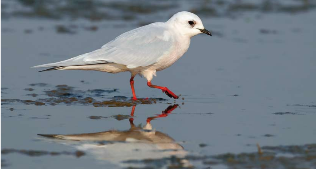
268 Ross' Meeuw / Ross's Gull Rhodostethia rosea , adult winter, Oosterse Bekade Gorzen, Numansdorp, Zuid-Holland, 24 april 2011