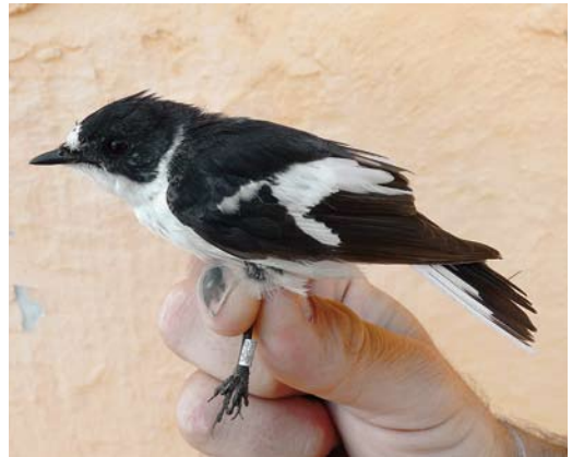
249 Masked Wagtail / Maskerkwikstaart Motacilla personata , Jahra pool reserve, Kuwait, 1 March 2011 ( Khaled Al-Ghanem ) cf Dutch Birding 33: 143, 2011 250 Mongolian Finch / Mongoolse Woestijnvink Rhodopechys mongolicus , Sabah Al-Ahmad Reserve, Kuwait, 8 April 2011 ( Khaled Al-Ghanem ) 251 Eastern Black Redstart / Oosterse Zwarte Roodstaart Phoenicurus ochruros phoenicuroides , second calendar-year male, Isla Grosa, Murcia, Spain, 23 March 2011 ( José Antonio Barba ) 252 Semicollared Flycatcher / Balkanvliegenvanger Ficedula semitorquata , adult male, Cabrera, Balearic Islands, Spain, 17 April 2011 ( Eduardo do Amengual Ramis )

tee, the numbers appear to be higher than previously thought; for instance, between 31 March and 18 April eight were found in a short section of tamarisks along the Mansour lake near Ouarzazate. A Blyth's Reed Warbler Acrocephalus dumetorum trapped at Eemshaven, Groningen, on 6 May was by far the earliest for the Netherlands; previous records were in September-October (eight) and late June (three). A male Moustached Warbler A melanopogon , presumably an Eastern Moustached Warbler A m mimica , was singing at Lehrte, Niedersachsen, Germany, on 3-4 April.