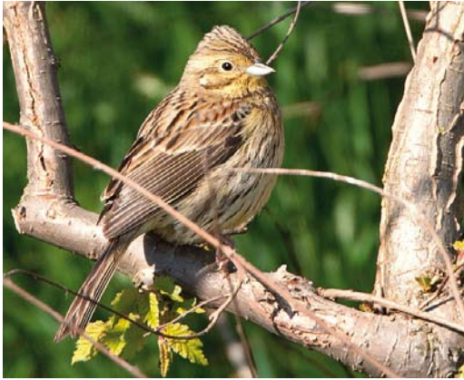
269 Cirlgors / Cirl Bunting Emberiza cirlus , vrouwtje, Westkapelle, Zeeland, 4 mei 2011