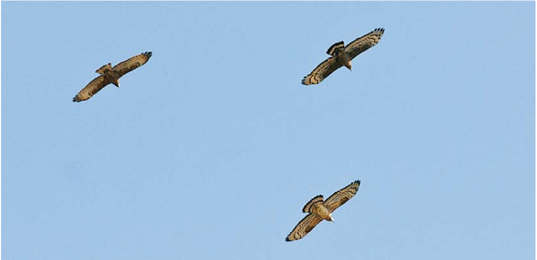
173 Presumed hybrid honey buzzard / vermoedelijke hybride wespendif Pernis , presumably male (below), with Crested Honey Buzzards / Aziatische Wespendif Pptilorhyncus , male (left) and female, Taukum desert, Kazakhstan, 12 May 2008. Lower bird showing features of both ptilorhyncus and European Honey Buzzard P apivorus . Bird looks rather bulky but also gives impression of being somewhat slimmer than other two birds. Hand looks more slender than arm, whereas wings look more evenly broad in both ptilorhyncus . Pattern of primaries indicates male: there is sharp contrast between black tips and whitish remainder of primaries, giving impression of feathers dipped in black ink. Tail pattern does not fit either species: too much white for ptilorhyncus and too much contrast and too much dark for apivorus . Bird also shows clear carpal patch. All combined, bird clearly shows features of both species and can therefore be considered a hybrid.

of orientalis . However, the presence of a carpal patch and the tail pattern are not right for orientalis .