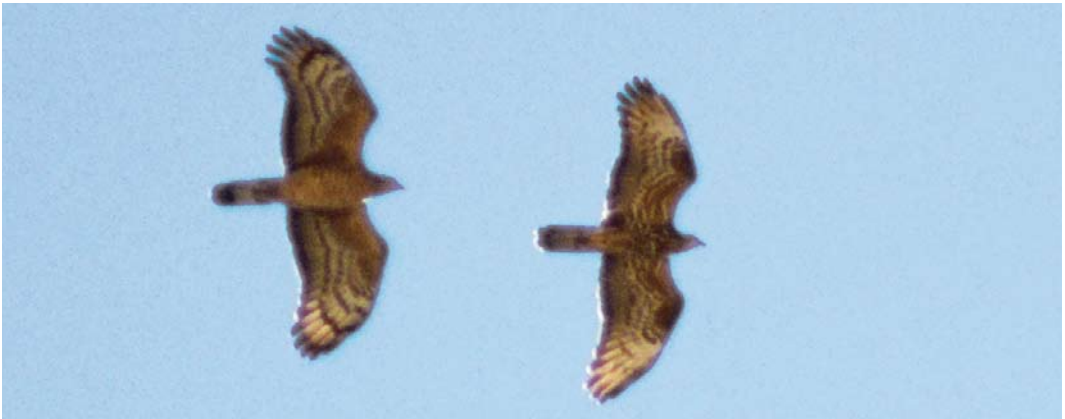
179 Presumed Crested Honey Buzzard / vermoedelijke Aziatische Wespendif Pernis ptilorhyncus , male, pale morph, Eilat, Israel, 21 May 2001 (Barak Granit). Same bird as in plate 178. 180 Crested Honey Buzzard / Aziatische Wespendif Pernis ptilorhyncus , male, Eilat, Israel, 20 May 2001 (Barak Granit). Bird showing interesting tail pattern, lacking inner black band. Dark gorget not developed. Note stronger than usual black bar on primary bases. 181 Crested Honey Buzzard / Aziatische Wespendif Pernis ptilorhyncus , male (left), with European Honey Buzzard / Wespendif P. apivorus , Eilat, Israel, 20 May 2001 (Barak Granit). Same bird as in plate 180. Note size difference, heavier body and belly and broader wing with six fingered primaries.

al 2008; Avner Cohen in litt; Dutch Birding 30: 189, plate 210, 2008).