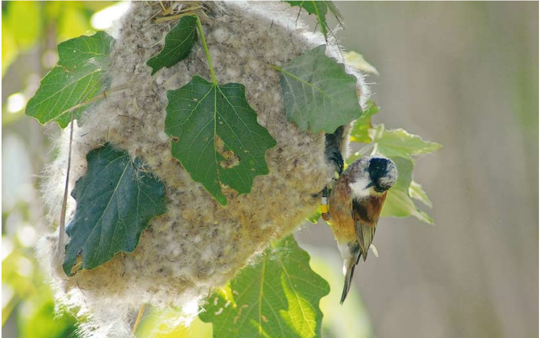
198 Eurasian Penduline Tit / Buidelmees Remiz pendulinus pendulinus , male, Fehértó, Hungary, 30 July 2006 (René van Dijk). Individual with unusually intensive red breast coloration (this male was at least five years old when photographed).

Kazakhstan for White-crowned (subspecies R c coronatus ) and Black-headed (subspecies R m ssa-poshnikovi ) and sites in China for White-crowned (subspecies R c stoliczkae ) and Chinese Penduline Tit. The fieldwork in Asia not only provided us with a wealth of data useful for further investigation of the evolution and implications of breeding systems but we also obtained interesting and largely unknown information about identification, vocalisations and breeding systems of these species, as well as some ideas about taxonomy, which we present here. Further genetic and comparative work is currently being carried out to substantiate these ideas.