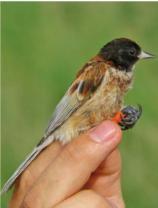
201 Black-headed Penduline Tit / Zwartkopbuidelmees Remiz macronyx ssaposhnikowi , male, Topar lakes, Almaty province, Kazakhstan, 25 June 2008. Same individual as in plate 200. Intermediate bird. Note extensive red-brown markings on breast and white throat.

feather-tips and a paler throat. Both sexes possibly show substantial variation in head pattern but from available literature it is not possible to get a clear picture of the morphological variation. Hence it is unclear whether macronyx can always be safely distinguished from hybrids caspius x macronyx in the Caspian Sea region. The fact that menzbieri Eurasian Penduline Tit hybridises with neglectus Black-headed along the south-western coast adds to the complexity around the Caspian Sea. Unfortunately, little is known about the Caspian Sea situation and further research is required to acquire more information about morphology and hybridisation of the (sub)species in this region.