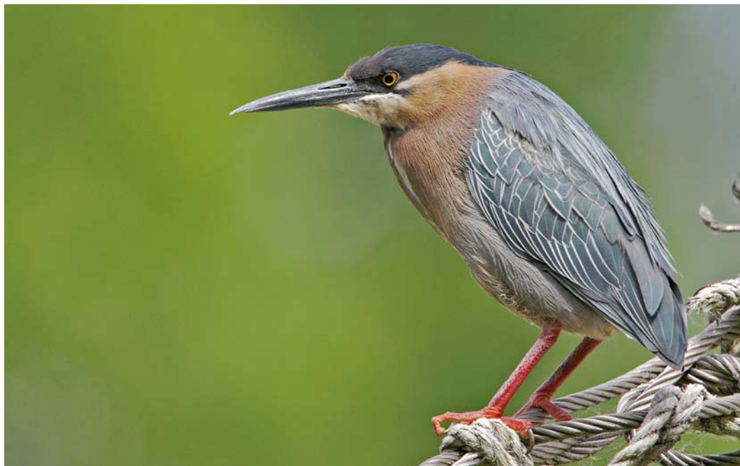
194 Groene Reiger / Green Heron Butorides virescens , Zaandam, Noord-Holland, 4 juni 2009 (Lesley van Loo)