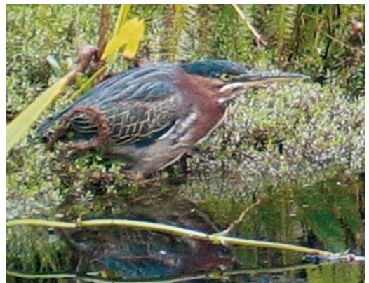
189 Groene Reiger / Green Heron Butorides virescens , Amsterdam, Noord-Holland, 19 september 2006

BOVENDELEN Mantel vlekkerig bruingrijs met groenige tint. Schouderveren blauwgrijs met smalle witte schacht-