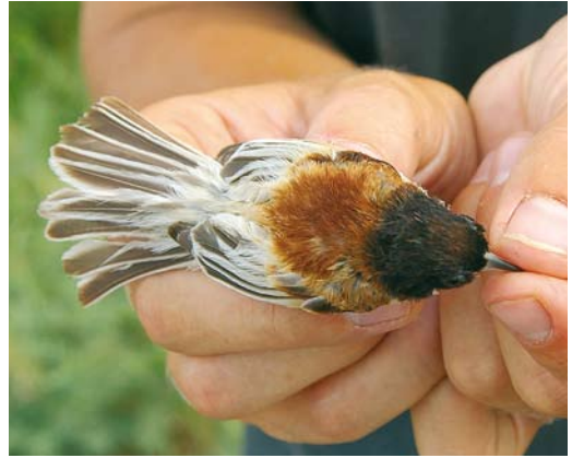
200 Black-headed Penduline Tit / Zwartkopbuidelmees Remiz macronyx ssaposhnikowi , male, Topar lakes, Almaty province, Kazakhstan, 25 June 2008 ( René van Dijk ). Same individual as in plate 201. Note black crown-feathers interspersed with some chestnut feathers and broad white fringes of tail- and flight-feathers.