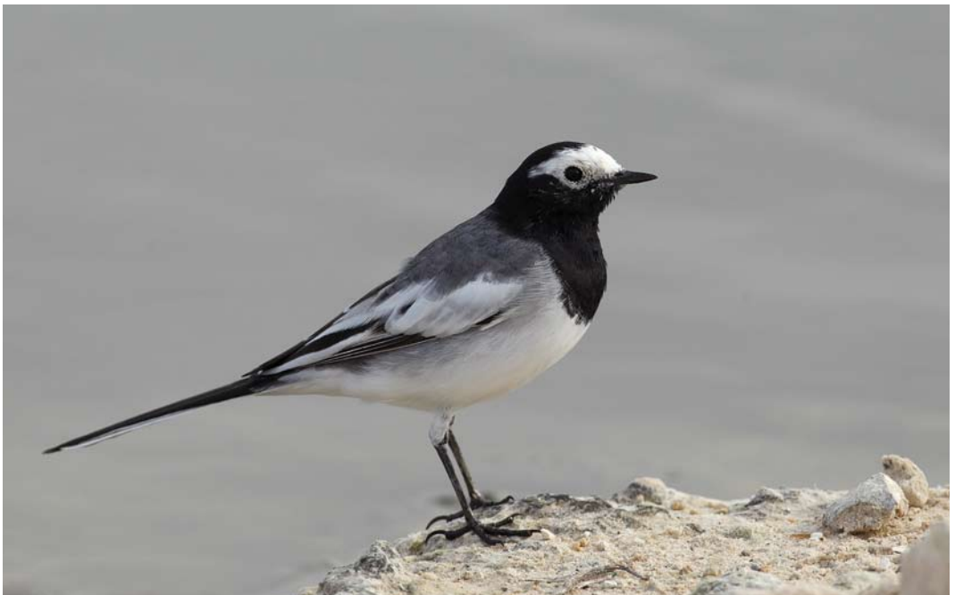
246 Masked Wagtail / Maskerkwikstaart Motacilla personata , Ma'agan Michael, Israel, 18 March 2011 ( Amir Ben Dov )