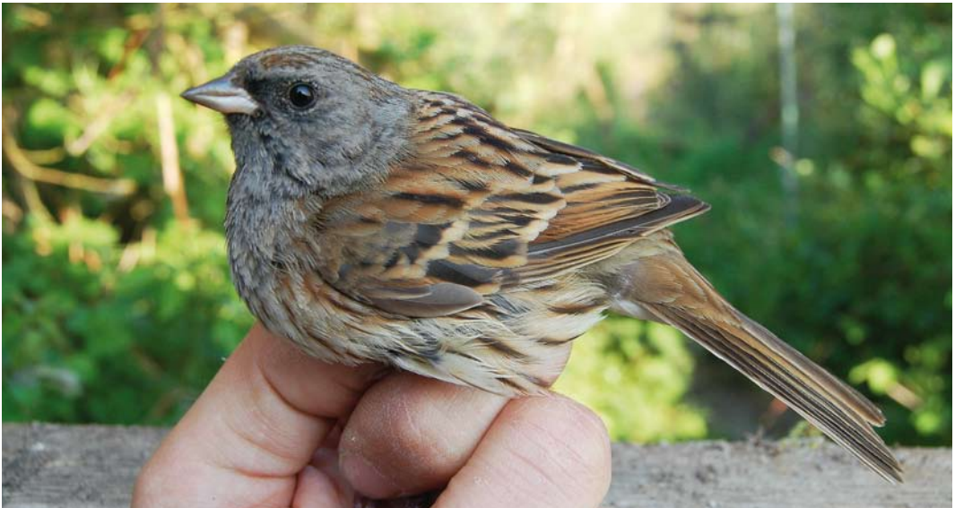
270 Maskergors / Black-faced Bunting Emberiza spodocephala , adult mannetje, Zwanenwater, Noord-Holland, 7 mei 2011 (Peter Spannenburg)

BLACK-FACED BUNTING On 7 and 9 May 2011, an adult male Black-faced Bunting Emberiza spodocephala was trapped at a site closed for the public at Zwanenwater, Noord-Holland, the Netherlands. If accepted, this is the fourth record for the Netherlands and the first in spring. The previous ones were trapped between 28 October and 18 November in 1986, 1993 and 2007.