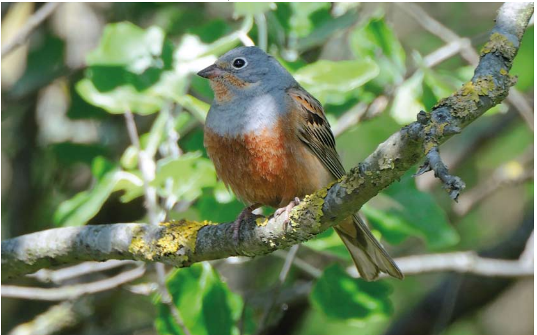
248 Cretzschmar's Bunting / Bruinkeelortolaan Emberiza caesia , male, Rottumerplaat, Groningen, Netherlands, 13 May 2011