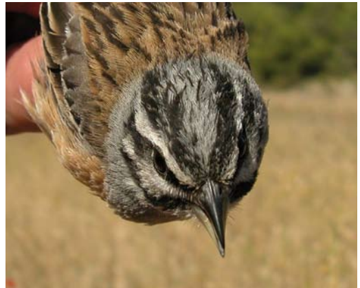
215-216 Grijze Gors / Rock Bunting Emberiza cia , adult mannetje, Pina de Ebro, Zaragoza, Spanje, 18 juni 2009 (Javier Blasco-Zumeta) 217-218 Grijze Gors / Rock Bunting Emberiza cia , tweede-kalenderjaar mannetje, Pina de Ebro, Zaragoza, Spanje, 12 juni 2009 (Javier Blasco-Zumeta)

soort een veel minder markante koptekening heeft. Zowel Huisgors als Gestreepte missen daarnaast de sterk donker gestreepte warmbruine bovendelen. Verder ontbreken bij Gestreepte de oranjebruine, egaal gekleurde onderdelen begrensd door de grijze borst. Huisgors heeft wel egaal gekleurde onderdelen, zelfs met scherp begrensd grijze borst maar de borst is gestreept (Byers et al 1995, Svensson et al 2010). Van Huisgors is in Nederland een waarneming van een ontsnapte vogel bekend, in Wieringerwerf, Noord-Holland, in oktober 2008. Voor het uitsluiten van (andere) ontsnapte gorzen wordt verwezen naar Cazemier (2006). Met name Weidegors E. coides (Oost-Azië), Rotsgors E. godlewskii (Oost-Azië), Socotragors E. socotrana (endeem van Socotra, Jemen), Zevenstrengengors E. tahapisi (tropisch Afrika en Arabisch Schiereiland), Stewarts