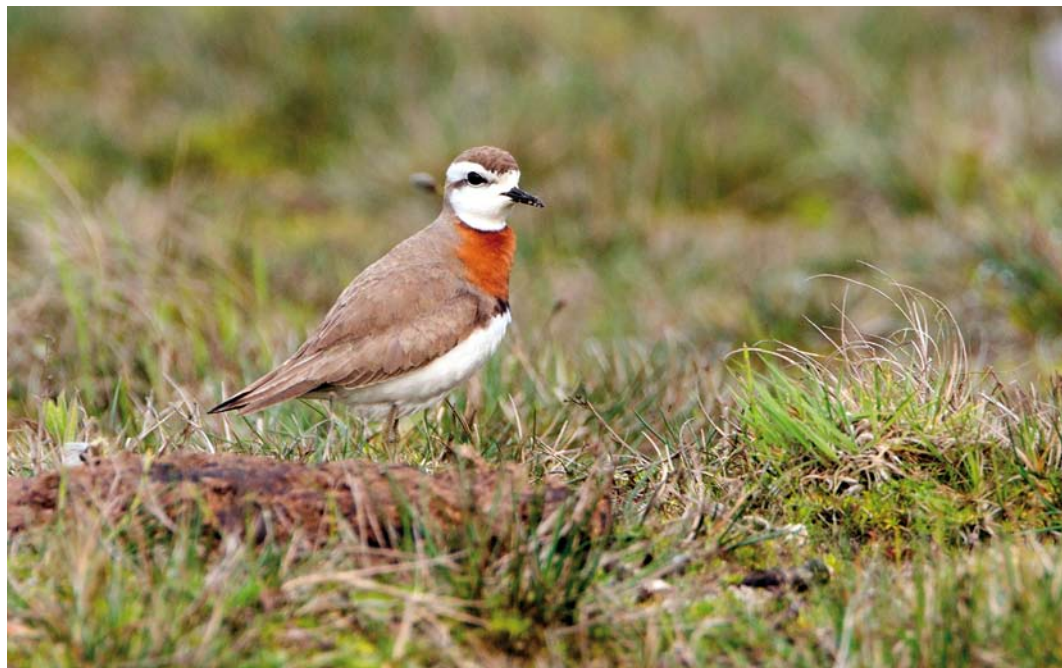
228 Kaspische Plevier / Caspian Plover Charadrius asiaticus , adult mannetje, De Nederlanden, Texel, Noord-Holland, 28 april 2011 229 Kaspische Plevier / Caspian Plover Charadrius asiaticus , adult mannetje, De Nederlanden, Texel, Noord-Holland, 28 april 2011 230 Kaspische Plevier / Caspian Plover Charadrius asiaticus , adult mannetje, De Nederlanden, Texel, Noord-Holland, 28 april 2011