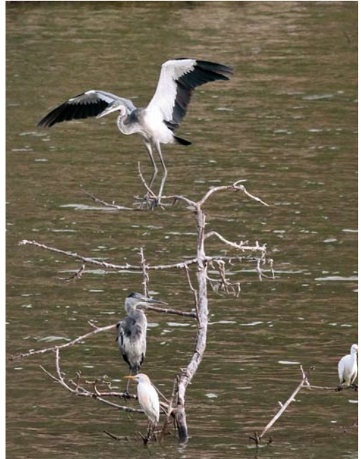
233 Intermediate Egret / Middelste Zilverreiger Mesophoyx intermedia , Barragem de Poilão, Santiago, Cape Verde Islands, 30 April 2011 ( Richard Bonser ) 234 Black-headed Heron / Zwartkopreiger Ardea melanocephala , Barragem de Poilão, Santiago, Cape Verde Islands, 30 April 2011 ( Richard Bonser ) 235 Thayer's Gull / Thayers Meeuw Larus thayeri , fifth-calendar year, San Cibrao, Cervo, Galicia, Spain, 13 March 2011 ( David Calleja ) cf Dutch Birding 33: 142, 2011