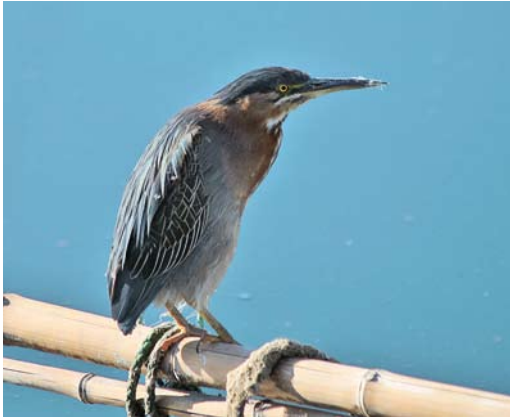
191 Groene Reiger / Green Heron Butorides virescens , Berre l'Étang, Bouches-du-Rhône, Frankrijk, 3 november 2007

Witte lijn onder teugel en snavelbasis. Kin en keel wit en gestreept.