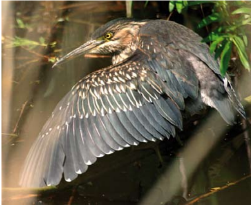
187 Groene Reiger / Green Heron Butorides virescens , eerstejaars, Amsterdam, Noord-Holland, 5 mei 2006

stand van het aan de overkant van het water gelegen Marignane, het internationale vliegveld van Marseille, Bouches-du-Rhône, en hemelsbreed 30 km ten oosten van de Camargue. De precieze data zijn van 16 december 2006 tot en met 2 mei 2007 (een melding op 5 november is niet aanvaard), van 31 oktober 2007 tot en met 4 mei 2008 en van 8 november 2008 tot en met 6 mei 2009 (cf Dutch Birding 28: 325, 2006, 29: 45, 255-256, 2007, 30: 124, 2008, 31: 125, 190, 2009, Reeber & Comité d'homologation national 2009). In de winters van 2009/10 en 2010/11 werd hij niet meer gezien. Hij viste hier meestal aan een waterzuiveringskanaaltje bij een bruggetje van de weg van Berre richting de zoutpannen van de lagune en was ook geregeld in de nabijgelegen jachthaven te vinden.