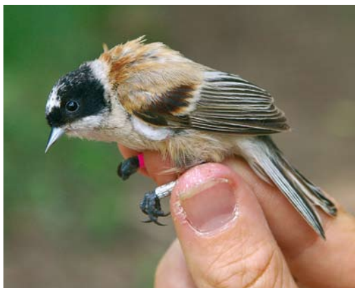
203 White-crowned Penduline Tit / Witkruinbuidelmee Remiz coronatus coronatus , male, Dzhabagly, South Kazakhstan, Kazakhstan, 1 June 2008 (Sander Bot). Typical individual. 204 White-crowned Penduline Tit / Witkruinbuidelmee Remiz coronatus coronatus , female, Topar lakes, Almaty province, Kazakhstan, 13 June 2008 (Sander Bot). Note paler appearance with greyer crown-feathers and paler mantle compared with males of same species in plate 203 and 205.

In both studied subspecies, females differed from males in the same way as in Eurasian Penduline Tit: females have a smaller and less well defined mask, are duller and have less bright chestnut on the back than males. We studied nominate coronatus in the foothills of the western Tien Shan mountain range in southern Kazakhstan (42°25'N, 70°29'E). Males resemble Eurasian in plumage but the black of their mask is generally larger and extends onto the nape. This character is variable: in some males the black of the mask extends only marginally onto the nape, while in others the nape is completely black, leaving only the crown white. Compared with Eurasian, males also lack the red-brown fringe bordering the mask above the bill. Identifying female coronatus from Eurasian might be more difficult. They show a variable amount of black on the nape but to a lesser extent and more diffuse compared with males, while some females lack the dark markings on the nape altogether. These females might still be identified by the col-