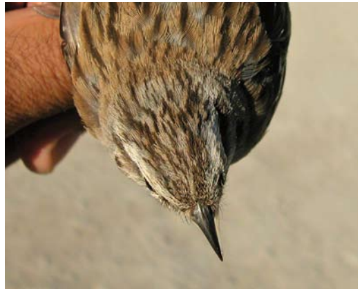
219-220 Grijze Gors / Rock Bunting Emberiza cia , adult vrouwtje, Pina de Ebro, Zaragoza, Spanje, 18 juni 2009 (Javier Blasco-Zumeta) 221-222 Grijze Gors / Rock Bunting Emberiza cia , tweede-kalenderjaar vrouwtje, Pina de Ebro, Zaragoza, Spanje, 27 juni 2009 (Javier Blasco-Zumeta)