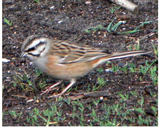
213-214 Grijze Gors / Rock Bunting Emberiza cia , Schiermonnikoog-Dorp, Schiermonnikoog, Friesland, 3 april 2011

resse. De tweede groep heb ik om een vogelboek gevraagd. Een korte blik in het boek en vervolgens op het scherm van mijn camera bevestigde dat het inderdaad om een Grijze Gors ging.