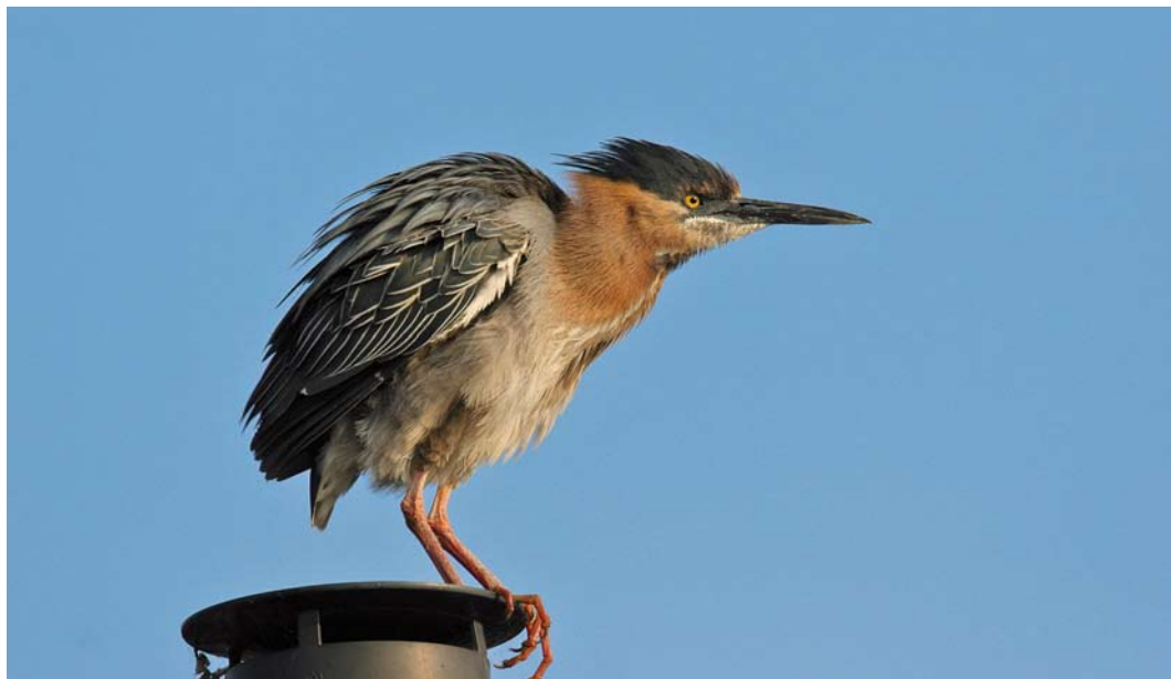
190 Groene Reiger / Green Heron Butorides virescens , Amsterdam, Noord-Holland, 1 juni 2007

lijn. Rug en stuit bruingrijs, lichter dan mantel.