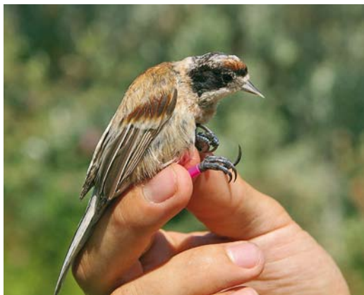
202 Black-headed Penduline Tit / Zwartkopbuidelmee Remiz macronyx ssaposhnikowi , female, Topar lakes, Almaty province, Kazakhstan, 26 June 2008

and flanks. Males with a caspicus -like appearance seem to be indistinguishable from true caspicus : comparing these males with the few photographs available on the internet (eg, www.birds-online.ru/gallery/thumbnails.php?album=104 ) and descriptions in the literature of caspicus (Harrap & Quinn 1996, Madge 2008), no consistent differences in plumage could be found. All observed females resembled nominate pendulinus of Eurasian but differed from these in having a clear red fringe on the head above the forehead patch extending to the side of the crown and in having