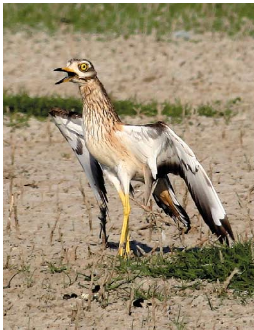
253 Ross' Meeuw / Ross's Gull Rhodostethia rosea , adult winter, Oosterse Bekade Gorzen, Numansdorp, Zuid-Holland, 24 april 2011 ( Kris De Rouck ) 254 Griel / Eurasian Stone-curlew Burhinus oedicnemus , Oudeland van Strijen, Zuid-Holland, 25 april 2011 ( Lodewijk Ouwens ) 255 Ross' Meeuw / Ross's Gull Rhodostethia rosea , adult winter, Oosterse Bekade Gorzen, Numansdorp, Zuid-Holland, 24 april 2011 ( Filip De Ruwe )