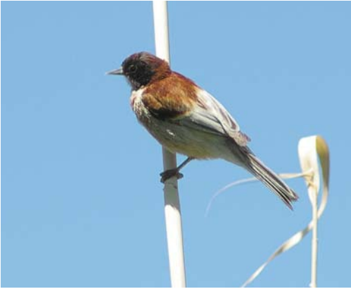
199 Black-headed Penduline Tit / Zwartkopbuidelmees Remiz macronyx ssaposhnikowi , male, Topar lakes, Almaty province, Kazakhstan, 18 June 2008. This individual looks identical to Eurasian Penduline Tit R. pendulinus caspius . Note chestnut crown and nape, white throat and broad white fringes of tail- and flight-feathers.