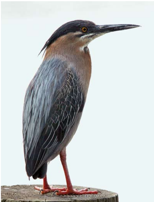
195 Groene Reiger / Green Heron Butorides virescens , Zaandam, Noord-Holland, 3 juli 2009

De vogel bleek de nabijheid van vaak 10-tallen vogelaars te negeren om zich volledig te concentreren op het vangen van visjes. Deze tamheid is bekend van wilde vogels, die makkelijk en snel aan mensen kunnen wennen en dan hetzelfde tamme gedrag vertonen (Richard Crossley in litt); dit gedrag lijkt zelfs eerder regel dan uitzondering in bijvoorbeeld Florida, VS. Bovendien zijn er voorbeelden van dwaalgasten in Europa die vertrouwelijk gedrag lieten zien, zoals de Groene Reiger in Kent, Engeland, van 19 oktober tot 9 november 2008 (Birding World 21: 399, 2008; Dutch Birding 30: 420-421, 2008). Op 4 juli 2009 werd door Edwin Russer en anderen te Zaandam het gebruik van lokaas vastgesteld. Hierbij pakte de vogel een insect ('een vlieg of iets dergelijks'), deponeerde dat op het water en liet het een aantal seconden drijven. Als het te ver afdreef, pakte de vogel het weer op om het een halve meter voor zich weer op het water te laten vallen. Dit ritueel herhaalde zich een paar keer (zie www.waarneming.nl/waarneming/view/43680682 ).