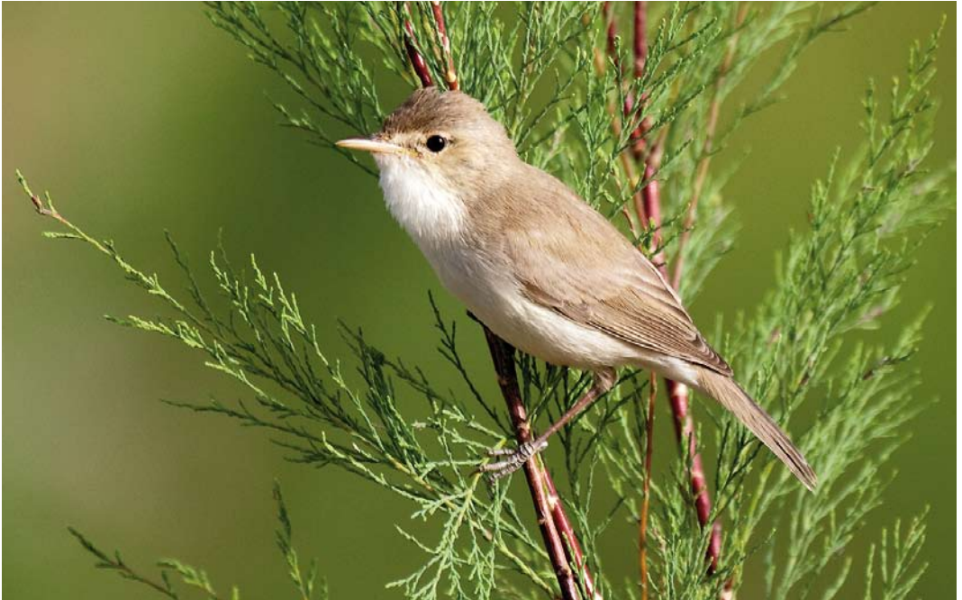
247 Saharan Olivaceous Warbler / Saharaanse Vale Spotvogel Iduna pallida reiseri , Ouarzazate, Morocco, 18 April 2011