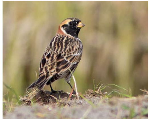
264 Blonde Ruiter / Buff-breasted Sandpiper Tryngites subruficollis , Oosterse Bekade Gorzen, Numansdorp, Zuid-Holland, 25 april 2011 ( Frank Dröge ) 265 Griel / Eurasian Stone-curlew Burhinus oedicephalus , Oudeland van Strijen, Zuid-Holland, 24 april 2011 ( Arjen Hahn ) 266 Roodkopklauwier / Woodchat Shrike Lanius senator , Den Helder, Noord-Holland, 23 april 2011 ( Fred Visscher ) 267 Ijsgors / Lapland Longspur Calcarius lapponicus , mannetje, Hindeloopen, Friesland, 10 april 2011 ( Roelof de Beer )

torquilla opgemerkt. Leuk was het exemplaar op 29 april op de Zuidpier van IJmuiden. Verder werden er zeker acht geringd, waarvan maar liefst vijf in de Eemshaven. Roodkopklauwieren Lanius senator bevonden zich op 23 april bij Den Helder en op 27 april bij Zoetermeer, Zuid-Holland. Opvallend waren de waarnemingen van Raven Corvus corax op 19 maart in de Amsterdamse Waterleidingduinen, tussen 19 maart en 2 april in de omgeving van Schoorl, Noord-Holland (minimaal twee), en op 2 en 3 april op Texel (minimaal twee). Vanaf 24 maart kwamen er van in totaal c 30 plekken in het land meldingen van Buidelmezen Remiz pendulinus . Negen trektelposten waren alleen al goed voor 20 overvliegende exemplaren. In dezelfde periode in zowel 2009 als 2010 werden er slechts acht genoteerd. Een Kalanderleeuwerik Melanocorypha calandra werd op 29 april gefotografeerd in een gedurende het broedseizoen afgesloten deel van de Sallandse Heuvelrug en