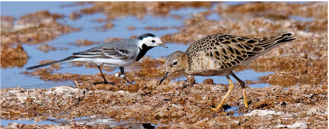
240 White-tailed Tropicbird / Witstaartkeerringvogel Phaethon lepturus , off Santiago, Cape Verde Island, 3 May 2011 241 Calandra Lark / Kalandereleeuwerik Melanocorypha calandra , Verlée, Liège, Belgium, 14 May 2011 242 Baikal Teal / Siberische Taling Anas formosa , male, Drijdyck, Oost-Vlaanderen, Belgium, 13 April 2011 243 Pink-backed Pelican / Kleine Pelikaan Pelecanus rufescens , immature, Göksü delta, Turkey, 10 May 2011 244 Buff-breasted Sandpiper / Blonde Ruiters Tryngites subruficollis , with White Wagtail / Witte Kwikstaart Motacilla alba , Ouarzazate, Morocco, 10 April 2011