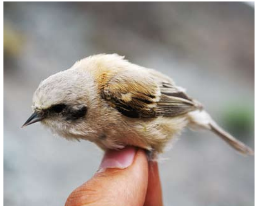
206 White-crowned Penduline Tit / Witkruinbuidelmees Remiz coronatus coronatus , female, Dzhabagly, South Kazakhstan, Kazakhstan, 6 June 2008 ( Sander Bot ). Female without black in nape, thus very similar to female Eurasian Penduline Tit R. pendulinus . 207 White-crowned Penduline Tit / Witkruinbuidelmees Remiz coronatus stoliczkae , male, Kulan river, Xinjiang, China, June 2008 ( Dušan Brinkhuizen ). Males in this subspecies often look similar to Eurasian Penduline Tit R. pendulinus but note absence of chestnut feathers above mask on forehead and whiter crown and nape. 208 White-crowned Penduline Tit / Witkruinbuidelmees Remiz coronatus stoliczkae , female, Kulan river, Xinjiang, China, June 2008 ( Dušan Brinkhuizen ). Typical female. 209 White-crowned Penduline Tit / Witkruinbuidelmees Remiz coronatus stoliczkae , female, Kulan river, Xinjiang, China, June 2008 ( Dušan Brinkhuizen ). Individual showing small, less solid black mask, to some extent resembling Chinese Penduline Tit R. consobrinus .

ed two male Black-headed Penduline Tits. Both produced a song structurally typical for Remiz penduline tits but none of the syllables used was found in the other species. The call of Black-headed is markedly different from the other species: longer, c 1 sec long, and not descending or twisting (for a sonagram, see Bot & van Dijk 2009). This difference is distinguishable in the field. The song of Chinese Penduline Tit is relatively simple. Less complex syllables are used and most syllables are only variations of the call. Because the song contains so many calls, it is sometimes hard