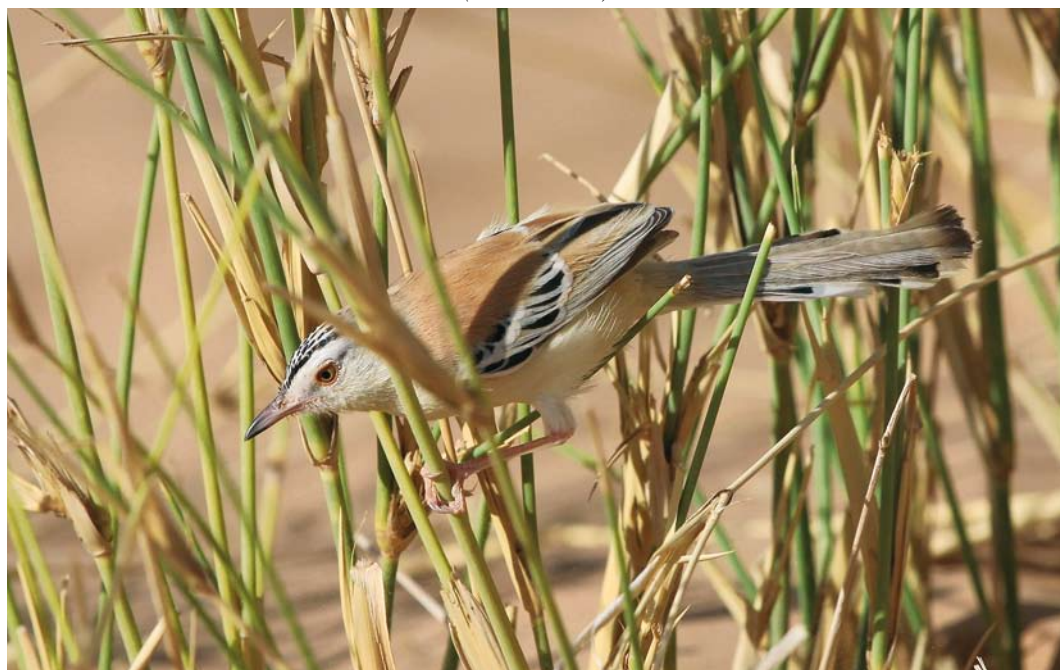
177 Cricket Warbler / Krekelprinia Spiloptila clamans , Aoussard, Western Sahara, Morocco, 6 March 2010