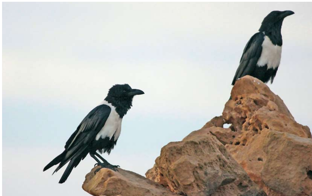
176 Pied Crows / Schildraven Corvus albus , 154 km north-east of Dakhla, Western Sahara, Morocco, 5 March 2010