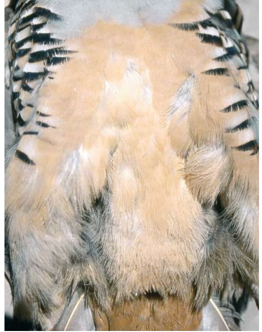
119 Sicilian Rock Partridge / Siciliaanse Steenpatrijs Alectoris (graeca) whitakeri , collected at Monti Nebrodi, Sicily, Italy (Angelo Scuderi). Note richly coloured underparts with intense creamy coloration, especially very saturated and deeply coloured undertail-coverts.

other tail-feathers. Nominata graeca shows more often mottling on t1, rarely with barely visible vermiculations also on the uppertail-coverts (three birds out of 40). However, contrary to previous literature that mainly refers to the central pair (t1) and the uppertail-coverts, the truly typical whitakeri character are the dark vermiculations on the base of the complete tail (figure 4), which, during the present study, was not found as conspicuously in any individual of the other taxa.