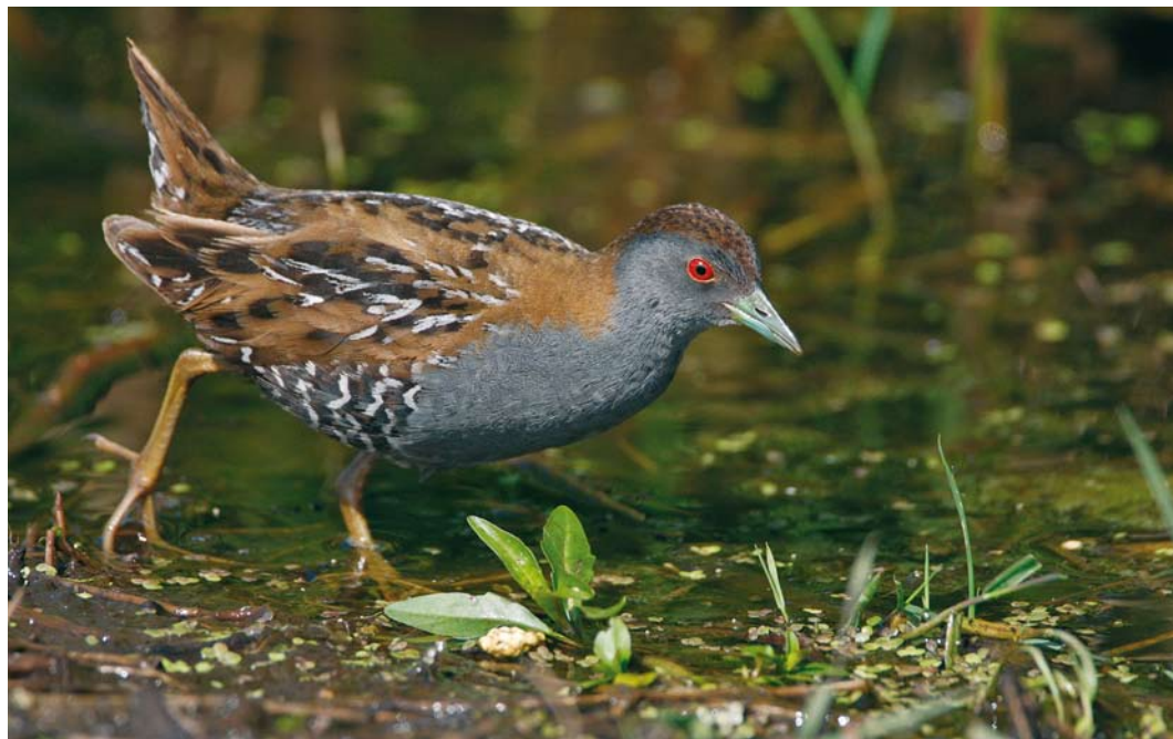
143 Kleinst Waterhoen / Baillon's Crake Porzana pusilla , mannetje, Groene Jonker, Zevenhoven, Zuid-Holland, 13 juni 2009