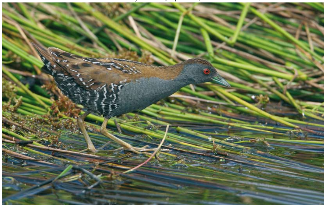
144 Kleinst Waterhoen / Baillon's Crake Porzana pusilla , mannetje, Groene Jonker, Zevenhoven, Zuid-Holland, 20 juni 2009 ( Jaap Denee )