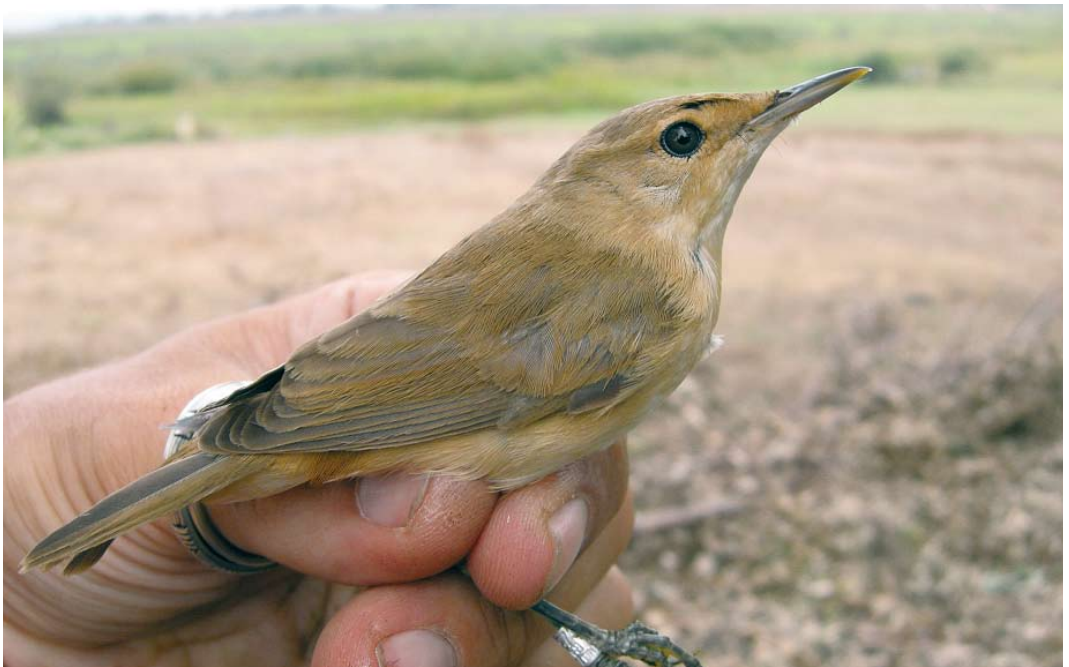
46 Local Moroccan reed warbler / karekiet Acrocephalus , Larrache, lower Loukkos, Morocco, 13 September 2009 (Pascal Provost)