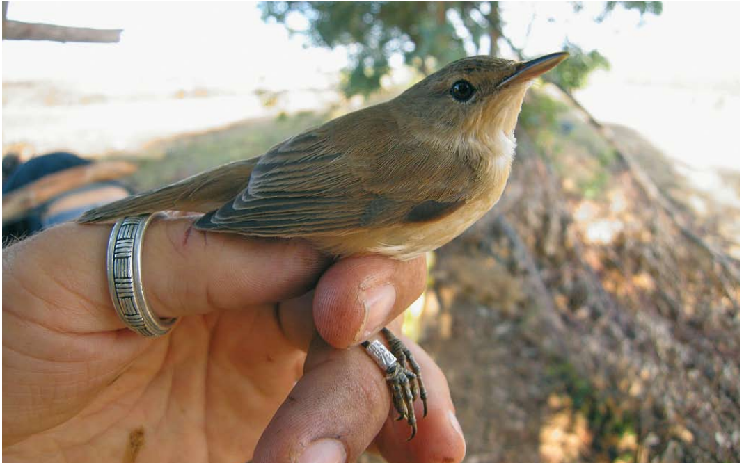
45 Local Moroccan reed warbler / karekiet Acrocephalus , Larrache, lower Loukkos, Morocco, 11 September 2009 (Pascal Provost)