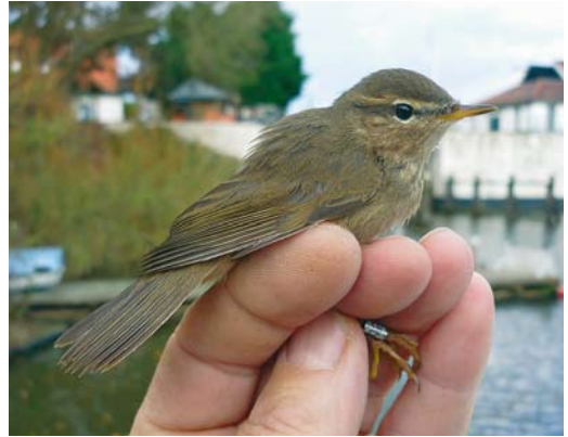
91 Bruine Boszanger / Dusky Warbler Phylloscopus fuscatus , eerstejaars, Gemaal Leemans, Den Oever, Noord-Holland, 22 november 2009 (Bert Winters)

werd op 7 december gemeld bij Deventer, Overijssel. Door de trektellers werd een mager aantal van 31 Strandleeuweriken Eremophila alpestris genoteerd, waaronder één exemplaar op 8 november in De Grote Peel bij Meijel, Noord-Brabant. Het najaarstotaal (september-december) kwam daarmee uit op 187. Van 30 november tot 12 december vloog een Rotszwaluw Ptyonoprogne rupestris dagelijks rond boven de Sint Pietersberg bij Maastricht, Limburg; hoewel het om het zevende of achtste exemplaar voor Nederland ging was er slechts eenmaal eerder een twitchbaar geval (van twee exemplaren). Boerenzwaluwen Hirundo rustica werden nog gemeld op 2 december bij Sint-Michielsgestel, Noord-Brabant, op 3 december bij Enkhuizen, Noord-Holland, en op 4 december bij Nunspeet, Gelderland. Een late Huiszwaluw Delichon urbicum vloog op 9 december boven Kampen, Overijssel. Een Roodstuitzwaluw Cecropis daurica werd op 20 november om 09:46 gefotografeerd boven het Paulinaschor bij Biervliet, Zeeland, en om 11:15 werd vermoedelijk dezelfde c 7 km oostelijker in Terneuzen, Zeeland, opgemerkt.