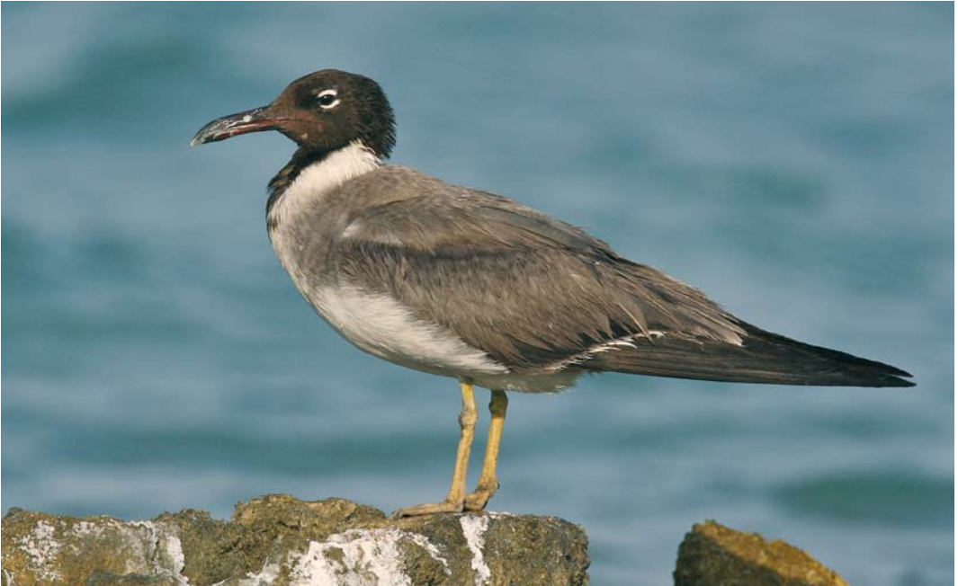
34 White-eyed Gull / Witoogmeeuw Larus leucophthalmus , adult moulting to winter plumage, El Gouna, Egypt, 8 September 2008 ( Edwin Winkel ). Late summer birds become darker by a reddish-brown tinge on upperparts and head due to wear. Leg colour also warmer now compared with unnatural yellow of adult winter and summer. Bill already blackish and first fresh grey scapulars starting to appear. 35 White-eyed Gull / Witoogmeeuw Larus leucophthalmus , adult winter, El Gouna, Egypt, 5 October 2007 ( Edwin Winkel ). Hood showing white spots and flecks, especially on chin and throat. Bare parts duller than in adult summer, legs paler yellow and red bill with blackish wash.