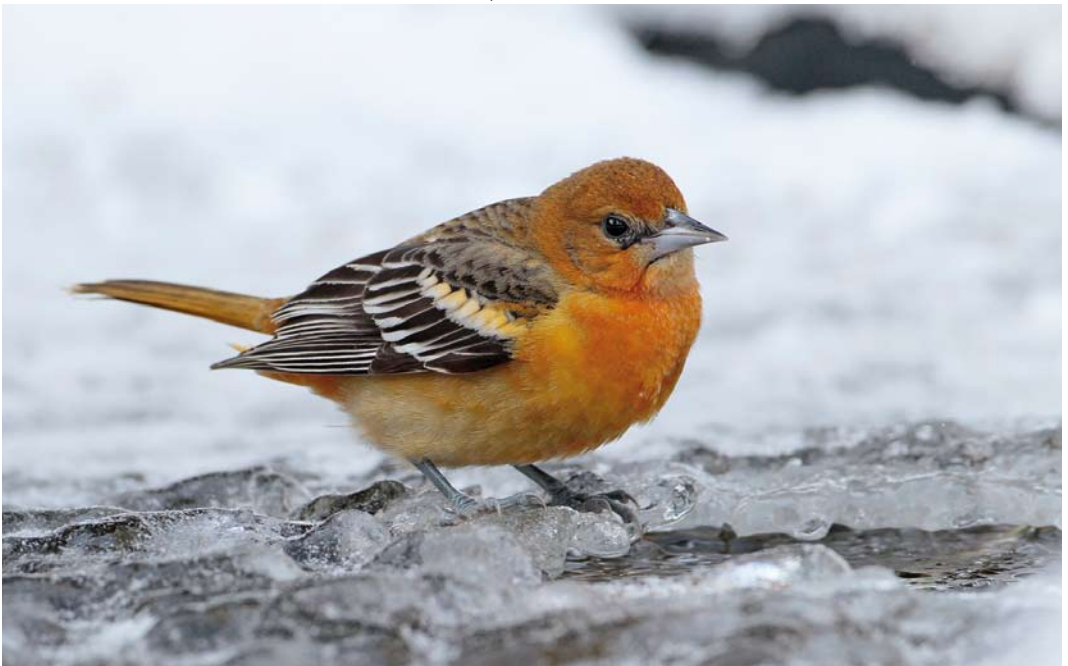
75 Baltimore Oriole / Baltimoretroepiaal Icterus galbula , first-winter, Oudorp, Alkmaar, Noord-Holland, Netherlands, 9 January 2010