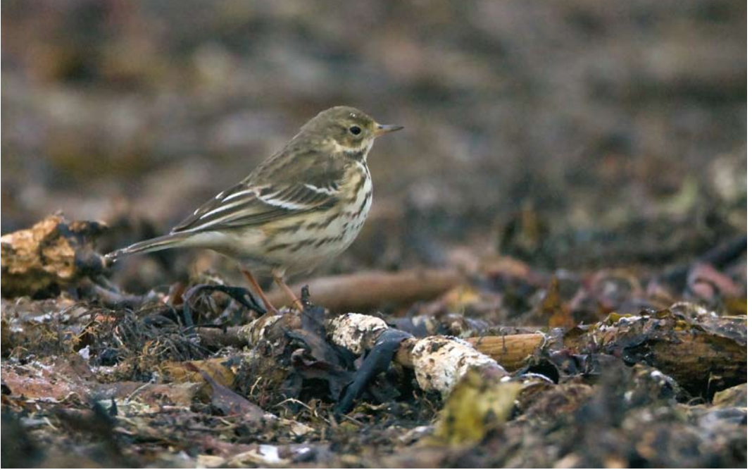
74 Siberian Buff-bellied Pipit / Siberische Waterpieper Anthus rubescens japonicus , Nordhassel, Lista, Vest-Agder, Norway, 19 December 2009 ( Gunnar Gunnersen )