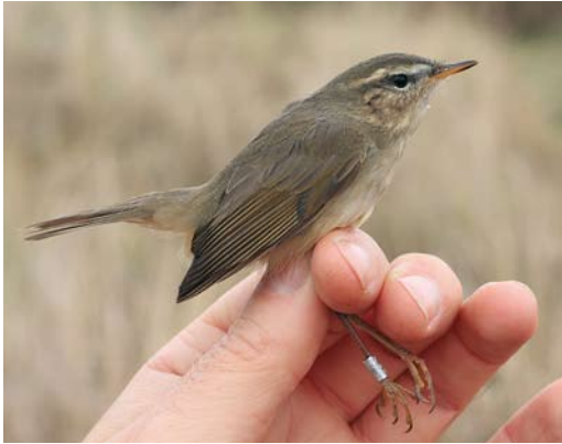
90 Bruine Boszanger / Dusky Warbler Phylloscopus fuscatus , Noordhollands Duinreservaat, Castricum, Noord-Holland, 11 november 2009