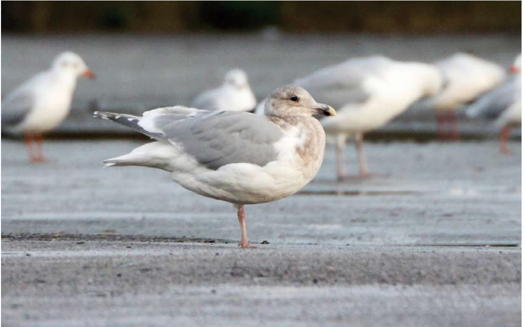
62-63 Glaucous-winged Gull / Beringmeeuw Larus glaucescens , fourth calendar-year, Århus, Midtjylland, Denmark, 27 November 2009 (Kim Aaen)