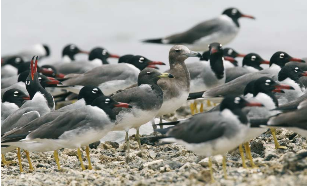
30 Sooty Gulls / Hemprichs Meeuwen Larus hemprichii , second-summer (centre left) and first-summer (centre right), and White-eyed Gulls / Witoogmeeuwen L. leucophthalmus , adult, El Gouna, Egypt, 10 May 2007 (Edwin Winkel). Second-summer Sooty as adult summer but with duller hood, feet and bill. Bill also lacking red tip and bib not yet complete. First-summer brighter than bird in plate 23 and still has typical pale juvenile-look. 31 Sooty Gull / Hemprichs Meeuw Larus hemprichii , adult summer, and White-eyed Gulls / Witoogmeeuwen L. leucophthalmus , adult, El Gouna, Egypt, 10 May 2007 (Edwin Winkel). Brownish upperparts and blackish hood of Sooty divided by clearly visible white collar, especially when neck is stretched. Legs are yellowish and fresh yellow bill has black ring and red tip. This bird, however, shows incomplete red tip, indicating that it is probably in its third summer.