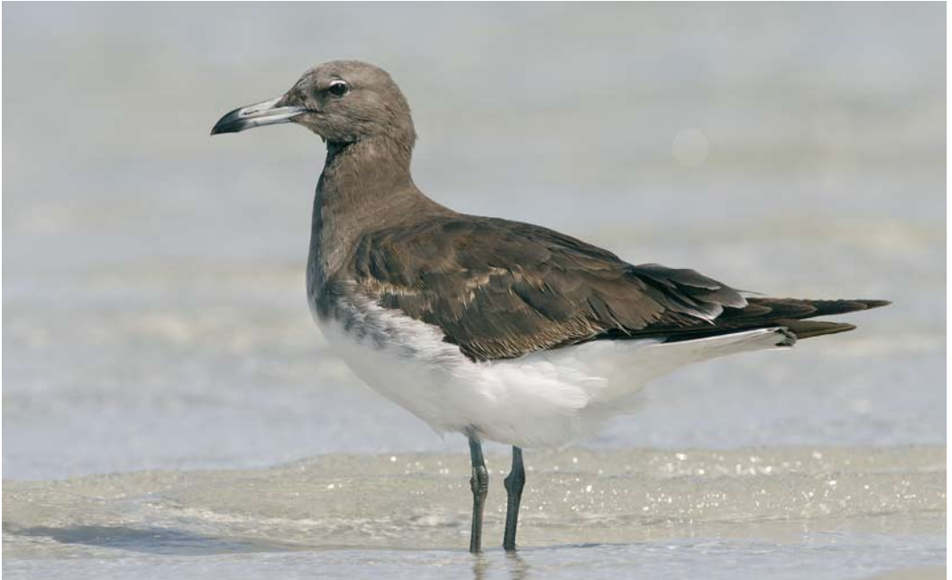
23 Sooty Gull / Hemprichs Meeuw Larus hemprichii , first-summer, El Gouna, Egypt, 16 May 2007 ( Edwin Winkel ). Mantle and scapulars are dark and uniform but coverts still show some faded juvenile feathers. Pointed and worn primaries also still juvenile. 24 Sooty Gull / Hemprichs Meeuw Larus hemprichii , second-winter, El Gouna, Egypt, 11 October 2007 ( Edwin Winkel ). Uniform chocolate-brown except for the head which is still very pale, as in most first-winters. Note new second generation primaries with rounded tip and greenish legs compared with greyish ones of younger bird in plate 23.