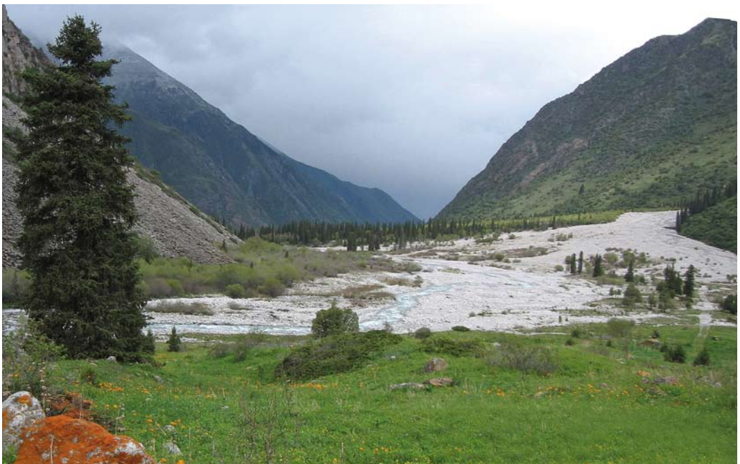
15 Mountain view at Ala Archa, Kyrgyzstan, 21 May 2007