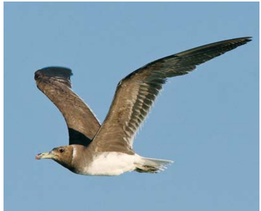
26 White-eyed Gull / Witoogmeeuw Larus leucophthalmus , juvenile, El Gouna, Egypt, 5 October 2007 ( Edwin Winkel ). Typical bird with whitish face and chin, buffy scales on upperparts, all-black bill and dull yellow legs. 27 White-eyed Gull / Witoogmeeuw Larus leucophthalmus , juvenile, El Gouna, Egypt, 8 September 2008 ( Edwin Winkel ). Black bill, yellowish legs and whitish chin characteristic but less pronounced bird than bird in plate 26. 28 White-eyed Gull / Witoogmeeuw Larus leucophthalmus , second-winter, El Gouna, Egypt, 10 October 2007 ( Edwin Winkel ). Hood and bare parts still very like first-summer but upperparts now concolorous. Scattered brown-tinted feathers visible and greater coverts darker than in adult. 29 Sooty Gull / Hemprichs Meeuw Larus hemprichii , adult moulting to winter plumage, El Gouna, Egypt, 14 September 2009 ( Edwin Winkel ). All striking features have gone and bird is more uniform in coloration. Head has turned brown and white neck-ring and eyelid less prominent. Green bill (including markings) and legs inconspicuous but red orbital ring suddenly stands out! Flight-feathers and tail very worn and about to be moulted.

white partial eye-ring above and below the eye (eye-lids) are conspicuous (these eye-lids gave the species its scientific and English name). In winter, White-eyed also becomes duller. The neck collar turns almost grey and the black hood shows white streaks, most prominently on forehead, chin and throat. The legs become more green and the red of the bill gets a blackish wash.