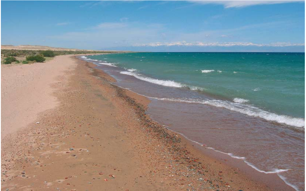
14 Issyk Kul lake at Ak Sai, Kyrgyzstan, 28 May 2007 ( Vincent van der Spek )