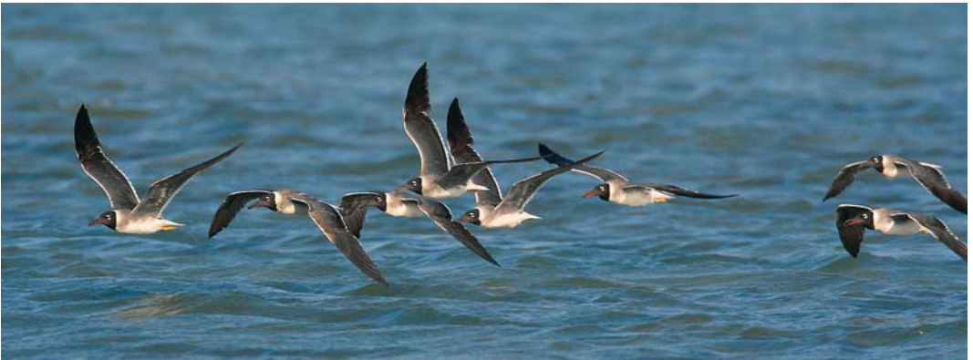
36 Sooty Gull / Hemprichs Meeuw Larus hemprichii , second-winter, El Gouna, Egypt, 11 October 2007 ( Edwin Winkel ). Note dark tail-band and pale greenish bill. Compared with White-eyed Gull L. leucophthalmus , Sooty is a more powerful flyer, with steady and direct flight. 37 White-eyed Gull / Witoogmeeuw Larus leucophthalmus , second-summer, El Gouna, Egypt, 14 May 2007 ( Edwin Winkel ). As adult but brownish hood still showing some white flecking. Bill predominantly dark and collar grey instead of strikingly white. Tail still showing some black markings. 38-39 White-eyed Gulls / Witoogmeeuwen Larus leucophthalmus , El Gouna, Egypt, 3 September 2009 ( Edwin Winkel ). Flight of White-eyed is swinging, playful and elegant like a tern. Note distinctive pale leading edge of wing, which is always absent in Sooty.