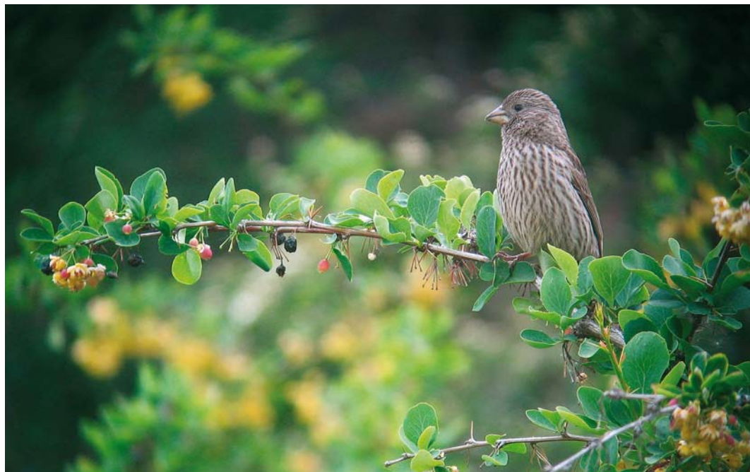
20 Red-mantled Rosefinch / Roze Roodmus Carpodacus rhodochlamys , female, Grigorievka, Kyrgyzstan, 25 May 2007 (Vincent van der Spek) 21 Red-tailed Shrike / Turkestaanse Klauwier Lanius phoenicuroides , female, Chon Kemin, Kyrgyzstan, 23 May 2007 (Vincent van der Spek) 22 Isabelline Wheatear / Izabeltapuut Oenanthe isabellina , Ak Soy, Kyrgyzstan, 25 May 2009 (Vincent van der Spek)