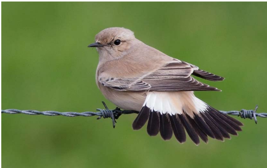
608 Woestijntapuit / Desert Wheatear Oenanthe deserti , vrouwtje, Jachthaven, Schiermonnikoog, Friesland, 29 oktober 2010 (Lex Aalders)