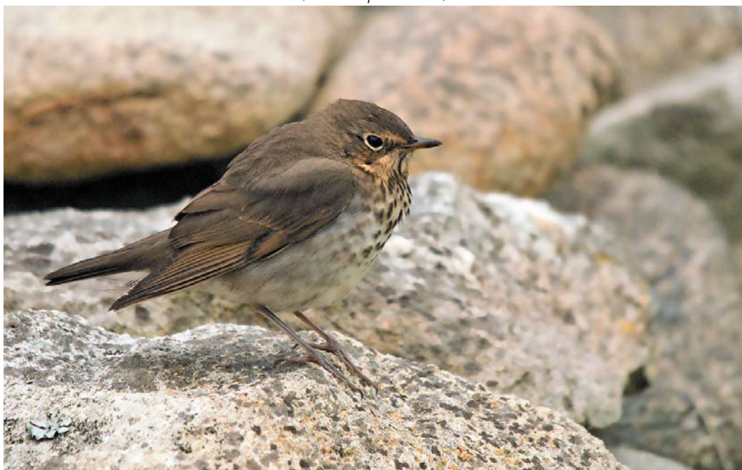
587 Swainson's Thrush / Dwerglijster Catharus ustulatus , Île de Sein, Finistère, France, 9 October 2010