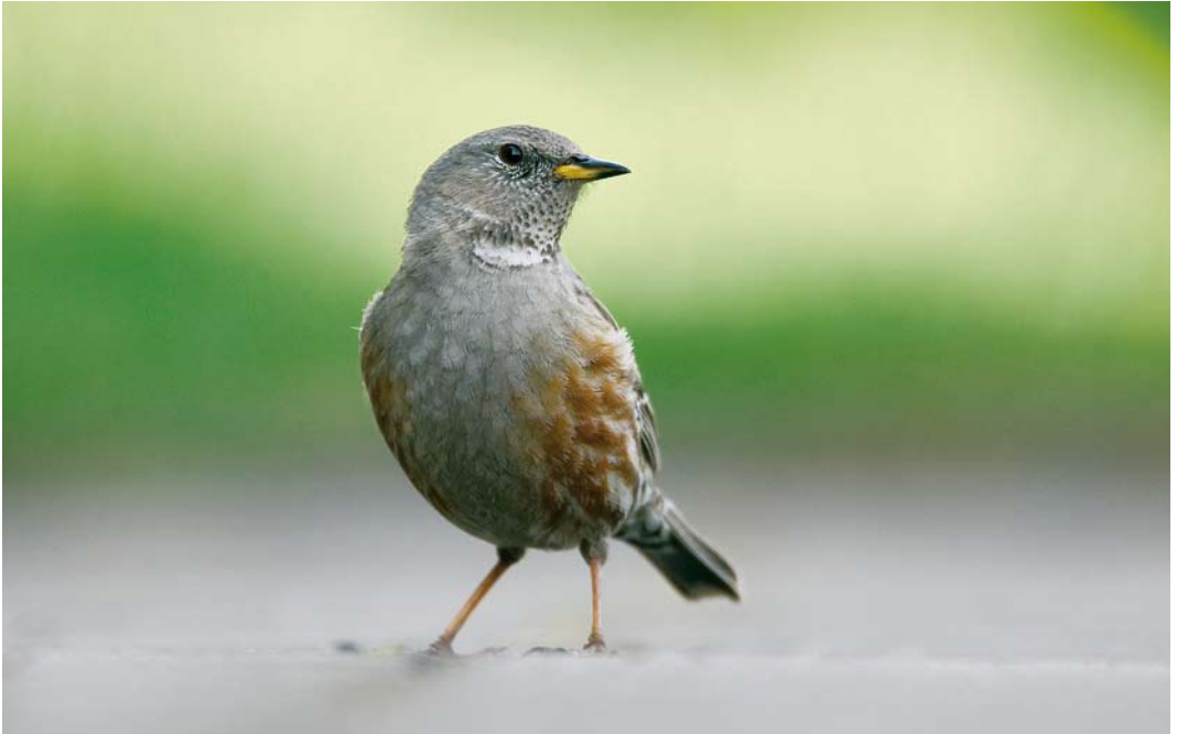
531 Alpine Accentor / Alpenheggenmus Prunella collaris , Eibergen, Gelderland, 27 April 2009