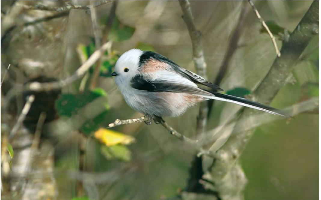
616 Witkopstaartmees / White-headed Long-tailed Tit Aegithalos caudatus caudatus , Vlieland, Friesland, 16 oktober 2010 (Steven Wytema)