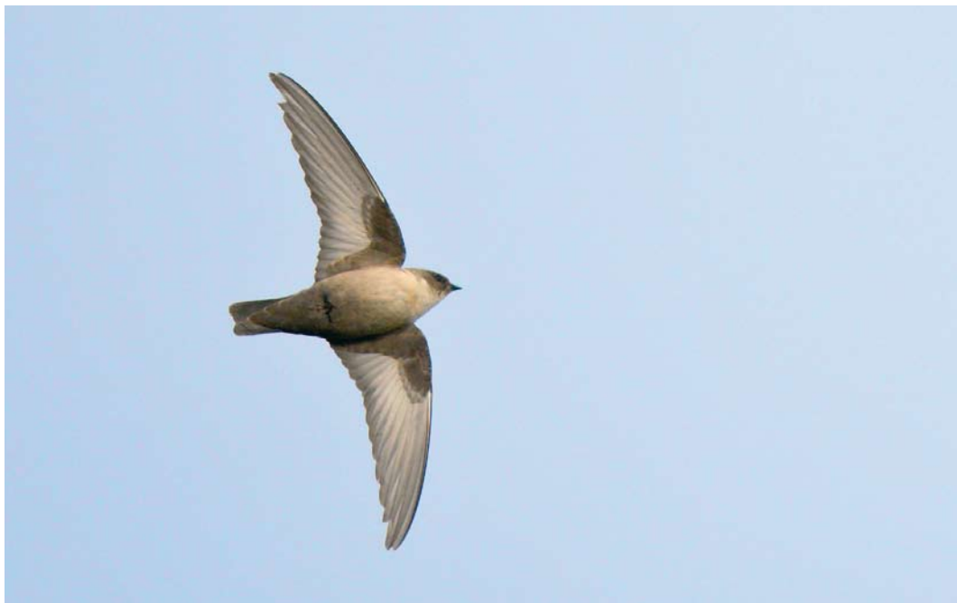
515 Eurasian Crag Martin / Rotszwaluw Ptyonoprogne rupestris , first-year, Sint Pietersberg, Maastricht, Limburg, 3 December 2009