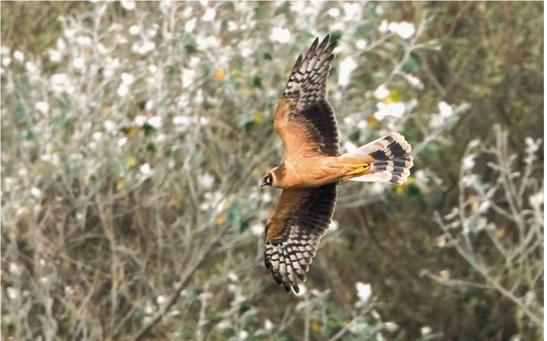
602 Steppekiekendief / Pallid Harrier Circus macrourus , eerstejaars, Petten, Noord-Holland, 4 oktober 2010