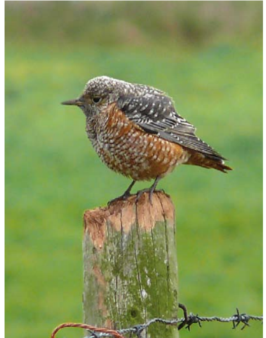
610 Aziatische Roodborsttapuit / Siberian Stonechat Saxicola maurus , eerstejaars mannetje, Oost-Vlieland, Vlieland, Friesland, 26 september 2010 ( Nils van Duivendijk ) 611 Rode Rotslijster / Rufous-tailed Rock Thrush Monticola saxatilis , eerstejaars mannetje, Buren, Ameland, Friesland, 26 oktober 2010 ( Arjan Verbiest ) 612 Blauwstaart / Red-flanked Bluetail Tarsiger cyanurus , eerstejaars mannetje, Kennemerduinen, Bloemendaal, Noord-Holland, 1 november 2010 ( Arnoud B van den Berg/Vrs van Lennepe )