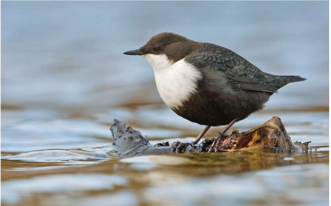
618 Zwartbuikwaterspreeuw / Black-bellied Dipper Cinclus cinclus cinclus , West-Terschelling, Terschelling, Friesland, 2 november 2010