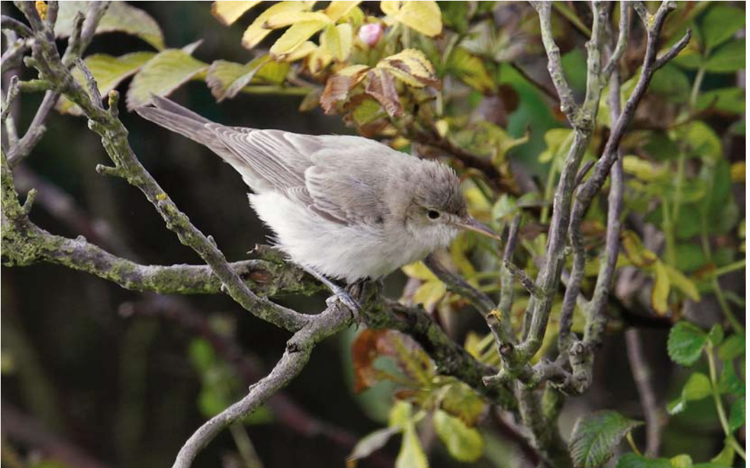
577 Eastern Olivaceous Warbler / Oostelijke Vale Spotvogel Iduna pallida , Bigton, Mainland, Shetland, Scotland, 12 September 2010 cf Dutch Birding 32: 347, 2010