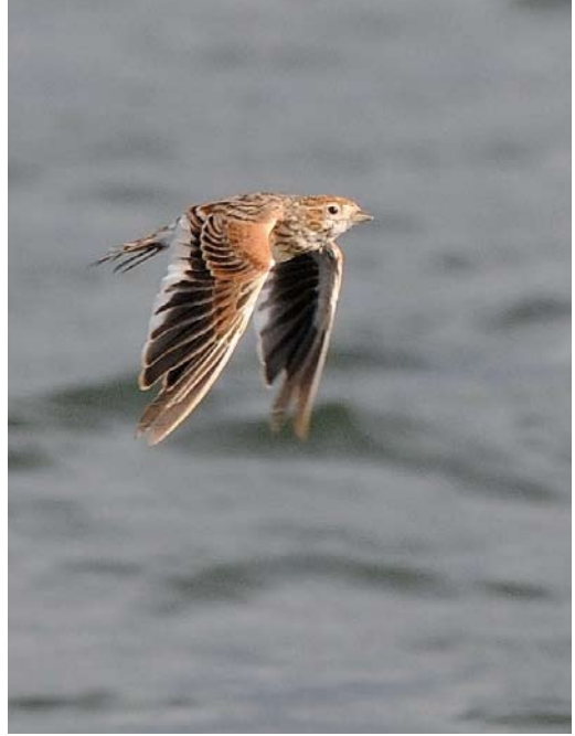
574 Red-flanked Bluetail / Blauwstaart Tarsiger cyanurus , Helgoland, Schleswig-Holstein, Germany, 14 October 2010 575 White-winged Lark / Witvleugelleeuwerik Melanocorypha leucoptera , Holmögadd, Västerbotten, Sweden, 23 September 2010 576 Hornemann's Redpoll / Groenlandse Witsuitbarmsijs Carduelis hornemanni hornemanni , Fair Isle, Scotland, 24 October 2010