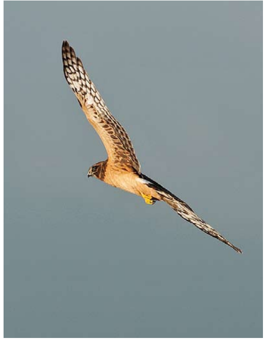
559-560 Northern Harrier / Amerikaanse Blauwe Kiekendief Circus cyaneus hudsonius , first-year, Tacumshin, Wexford, Ireland, 1 November 2010 561 Green Heron / Groene Reiger Butorides virescens , first-year, Pentewan, Cornwall, England, 6 November 2010