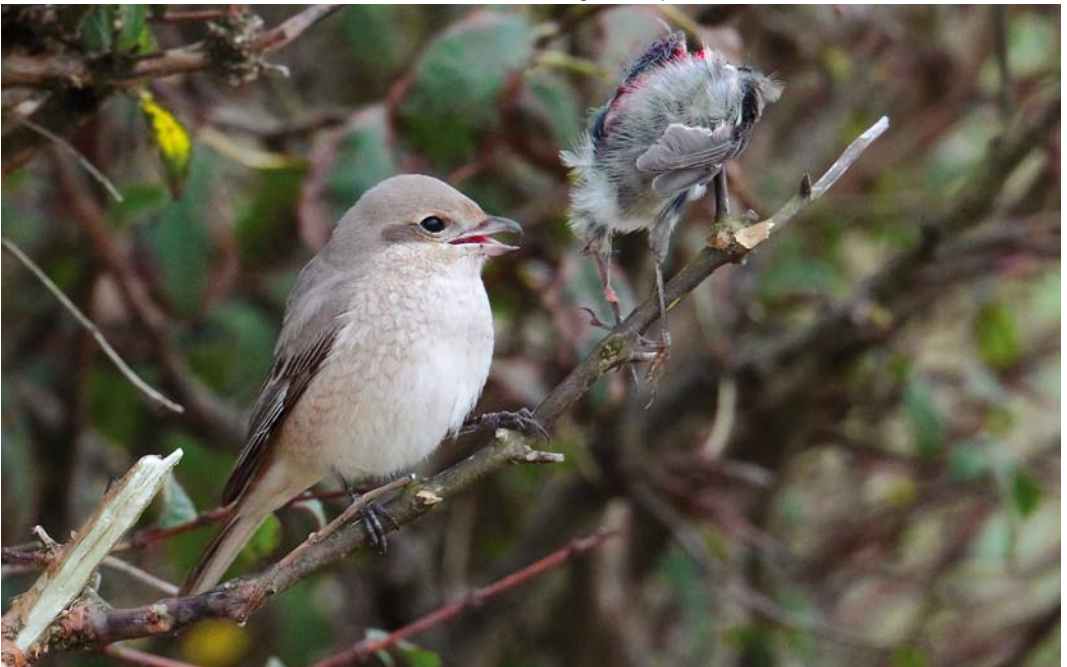
578 Daurian Shrike / Daurische Klauwier Lanius isabellinus , first-year, Spiggie, Mainland, Shetland, Scotland, 12 October 2010