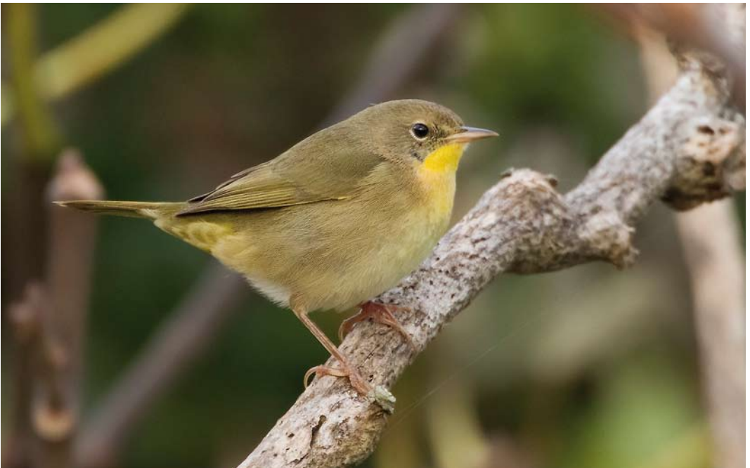
594 Common Yellowthroat / Gewone Maskerzanger Geothlypis trichas , Corvo, Azores, 12 October 2010