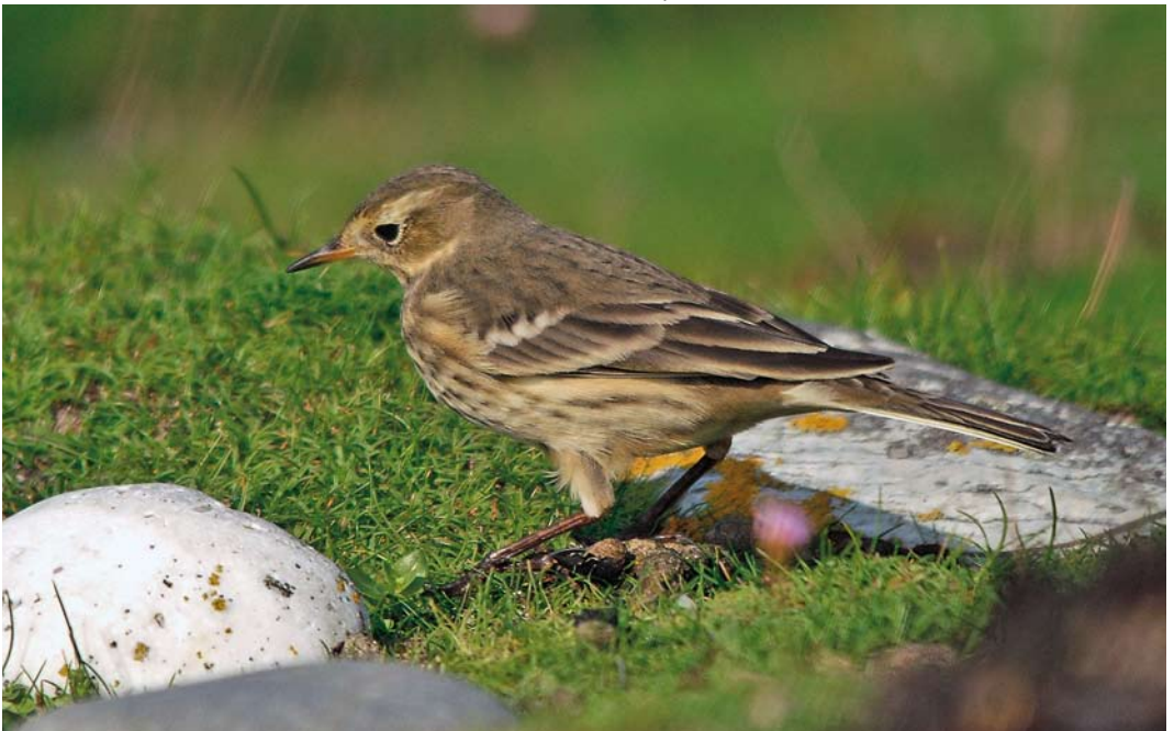
589 Buff-bellied Pipit / Amerikaanse Waterpieper Anthus rubescens rubescens , Île de Sein, Finistère, France, 10 October 2010