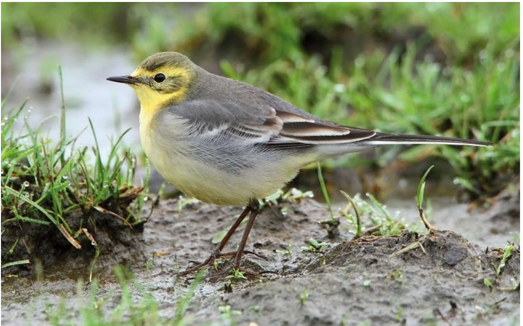
617 Citroenkwikstaart / Citrine Wagtail Motacilla citreola , Klaas Hennepoelpolder, Warmond, Zuid-Holland, 1 november 2010