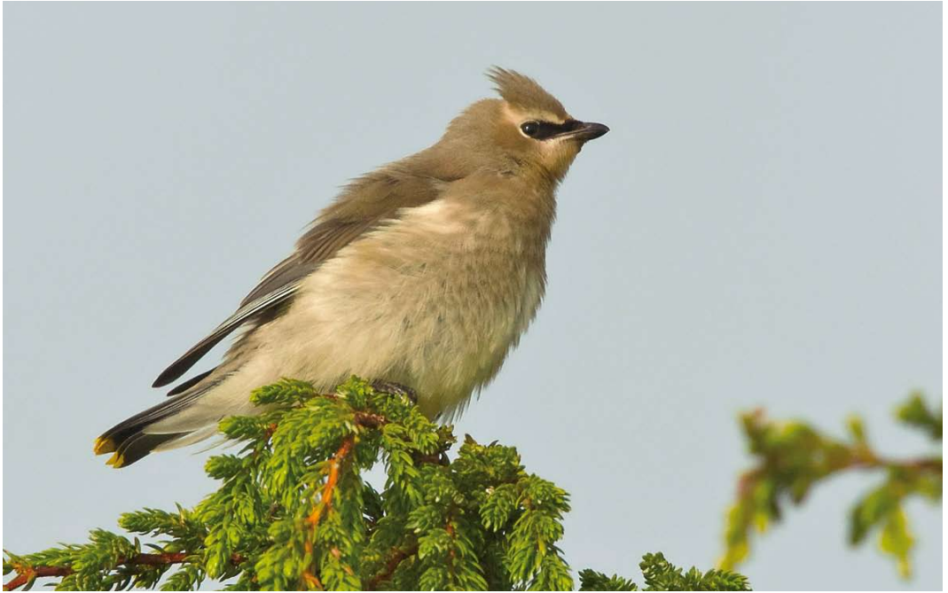
590 Cedar Waxwing / Cederpestvogel Bombycilla cedrorum , first-year, Corvo, Azores, 19 October 2010 (David Monticelli) 591 Northern Flicker / Gouden Grondspecht Colaptes auratus , Corvo, Azores, 26 October 2010 (Vincent Legrand) 592 Belted Kingfisher / Bandijsvogel Megaceryle alcyon , Paul de Praia, Terceira, Azores, 25 October 2010 (David Monticelli)