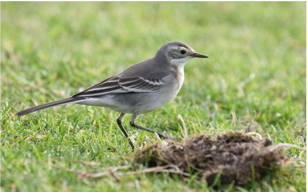
524 Citrine Wagtail / Citroenkwikstaart Motacilla citreola , first-year, Westerveld, Vlieland, Friesland, 28 October 2009 (Martijn Versluijs)