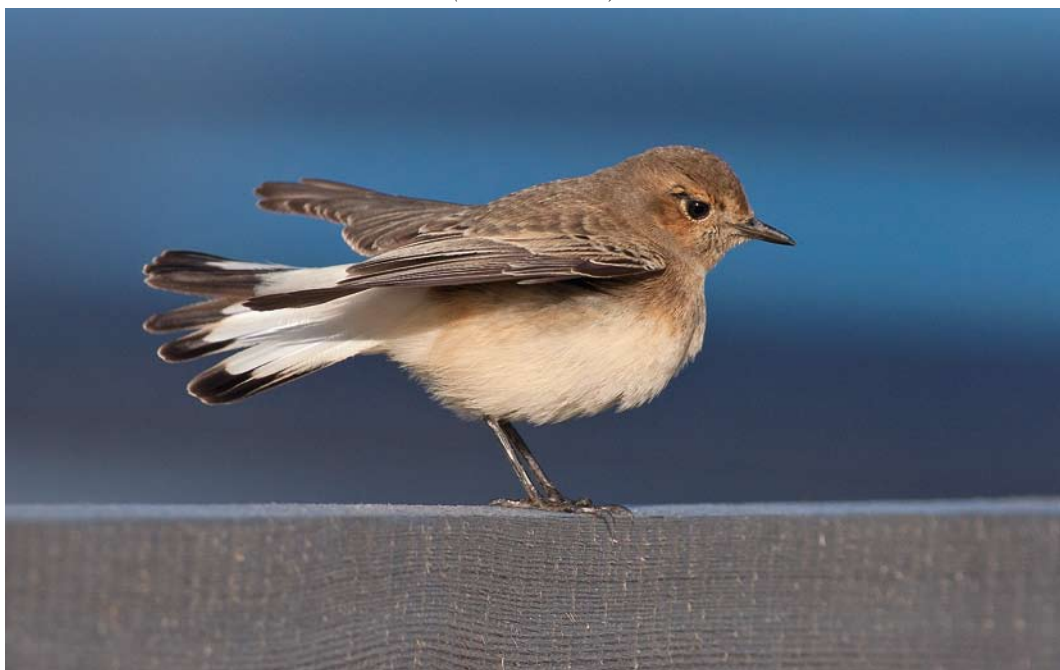
609 Bonte Tapuit / Pied Wheatear Oenanthe pleschanka , vrouwtje, Westkapelle, Zeeland, 25 oktober 2010 (Corstiaan Beeke)