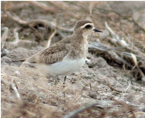
557-558 Kaspische Plevier / Caspian Plover Charadrius asiaticus , eerstejaars, Buitendijk, Texel, Noord-Holland, 19 oktober 2009 (René Pop)

Het zeer zeldzame voorkomen van Kaspische Plevier in (West-)Europa is niet eenvoudig te verklaren. Het gegeven van de grote afstand tot de broed- en overwinteringsgebieden geldt immers ook voor verwante soorten uit dezelfde regio, zoals Steppevorkstaartplevier Glaeola nordmanni