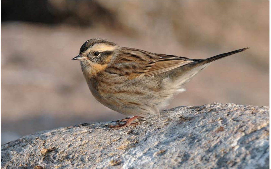
571 Black-throated Accentor / Zwartkeelheggenmus Prunella atrogularis , first-year, Ottenby, Öland, Sweden, 14 October 2010 (David Andersson)