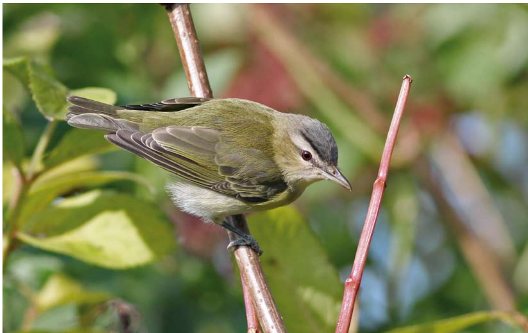
586 Red-eyed Vireo / Roodoogvireo Vireo olivaceus , Dunkerque, Nord, France, 21 October 2010 (Thierry Tancrez)