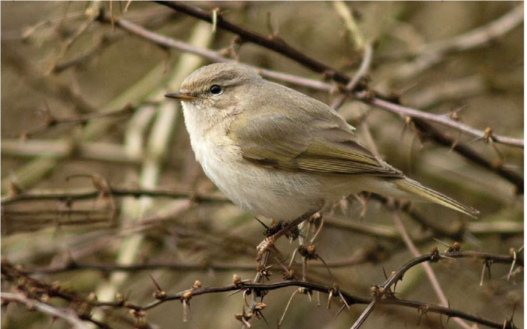
523 Siberian Chiffchaff / Siberische Tjiftjaf Phylloscopus collybita tristis , De Bilt, Utrecht, 16 February 2007