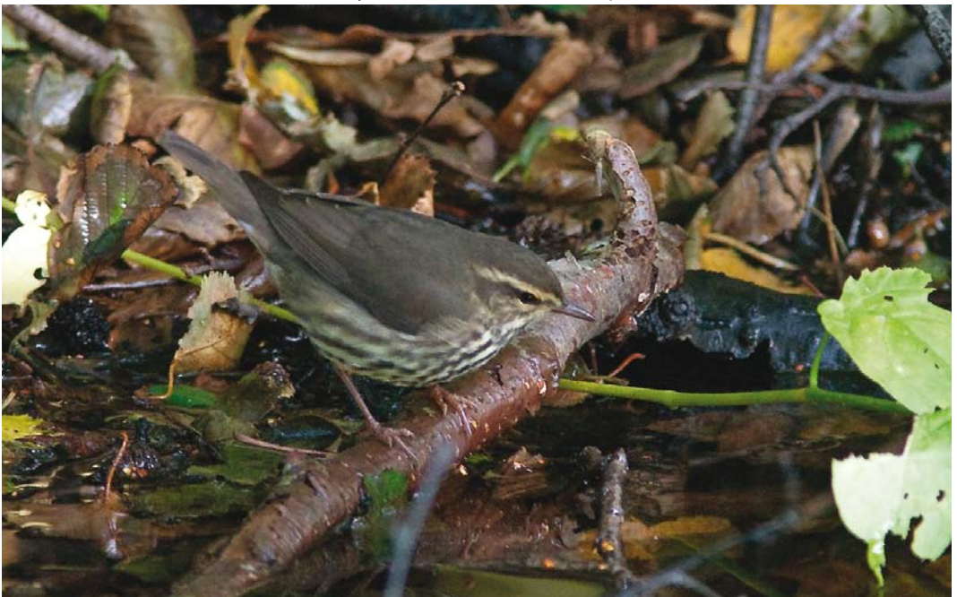
619 Noordse Waterlijster / Northern Waterthrush Seiurus noveboracensis , Oude Kooi, Vlieland, Friesland, 18 september 2010