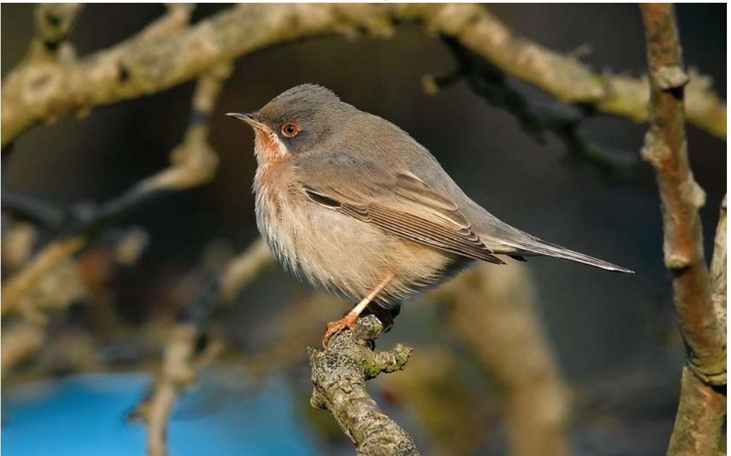
603 Baardgrasmus / Subalpine Warbler Sylvia cantillans , mannetje, Eierland, Texel, Noord-Holland, 9 oktober 2010