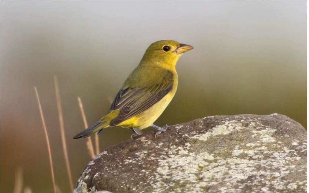
593 Scarlet Tanager / Zwartvleugeltangare Piranga olivacea , first-winter male, Corvo, Azores, 10 October 2010 (David Monticelli)