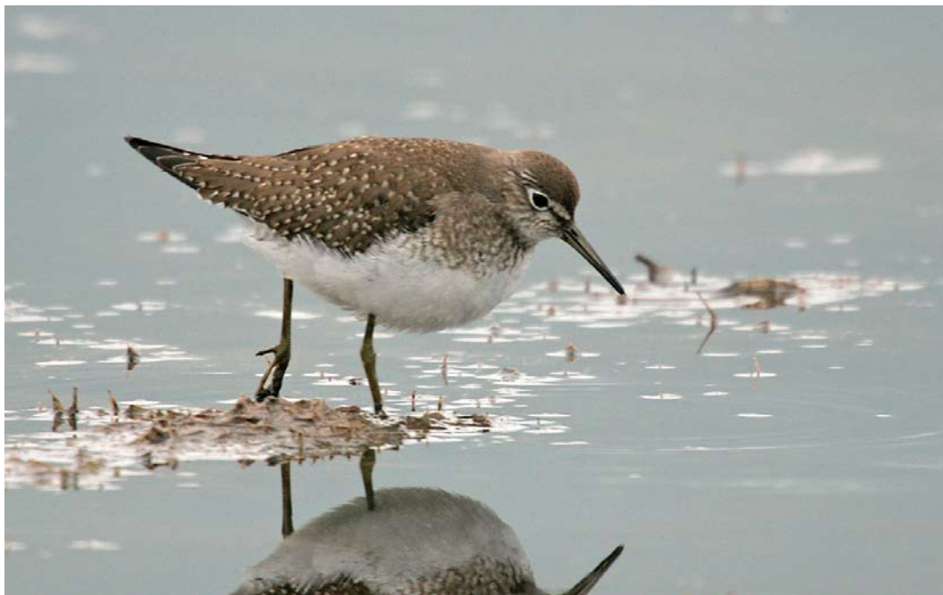
562 Solitary Sandpiper / Amerikaanse Bosruiter Tringa solitaria , Seaton, Devon, England, 14 October 2010 (David Hutton)