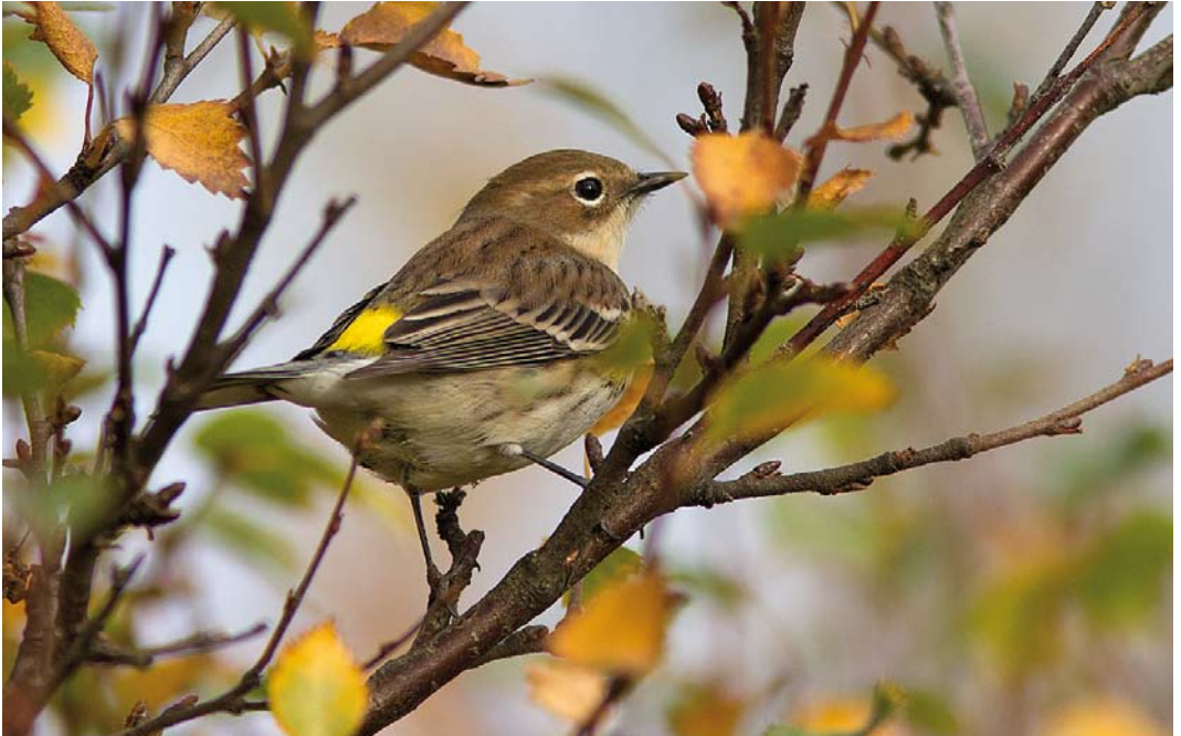
588 Myrtle Warbler / Mirtezanger Dendroica coronata , Þorlákshöfn, Iceland, 6 October 2010