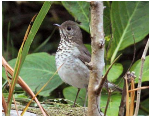
582 Bobolink / Bobolink Dolichonyx oryzivorus , Flores, Azores, 20 October 2010 583 Red-flanked Bluetail / Blauwstaart Tarsiger cyanurus , Linosa, Italy, 6 November 2010 584 American Redstart / Amerikaanse Roodstaart Setophaga ruticilla , Flores, Azores, 8 October 2010 585 Grey-cheeked Thrush / Grijswangdwerglijster Catharus minimus , Corvo, Azores, 17 October 2010

parently watched at close-range) at Lugansk, Ukraine, on 4 September would be the first for the WP; there are two old claims including one allegedly shot (but specimen lost) at Molochniy Liman, Zaporozhye, on 20 August 1952. The first Buff-breasted Sandpiper Tryngites subruficollis for the United Arab Emirates stayed at the Dubai pivot fields on 7-10 November. An Upland Sandpiper Bartramia longicauda at Santa Luzia, Tavira, from 29 September to 2 October was the second for mainland Portugal. In England, (only) two juvenile Spotted Sandpipers Actitis macularius were present during October, including one in Scilly first on St Mary's from 14 September and then on St Agnes on 27-31 October. On 10-15 October, a juvenile Solitary Sandpiper Tringa solitaria stayed at Seaton, Devon, England. A juvenile Greater Yellowlegs T melanoleuca at Wissenkerke, Zeeland, on 17-26 October was the fourth for the Netherlands. A Lesser Yellowlegs T flavipes was photographed at Marikissa, The Gambia, on 13 October. There were four Wilson's Phalaropes Phalaropus tricolor