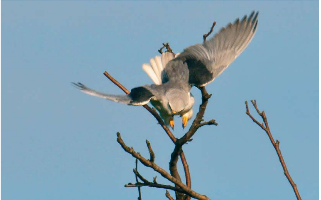
512 Black-winged Kite / Grijze Wouw Elanus caeruleus , Bleskensgraaf, Zuid-Holland, 22 May 2009 ( Hans Gebuis ) 513 Pallid Harrier / Steppiekiekendief Circus macrourus , first-year, Biesbosch, Noord-Brabant, 8 October 2009 ( Hans Gebuis ) 514 Atlantic Great Cormorant / Grote Aalscholver Phalacrocorax carbo carbo , second-winter (right), with Continental Great Cormorant / Aalscholver P c sinensis , adult, Hoornse Meer, Groningen, Groningen, 6 January 2008 ( Rik Winters )