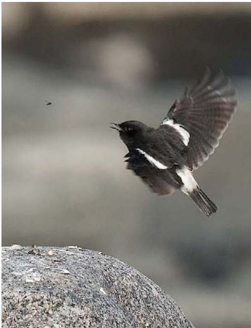
572-573 Pied Bush Chat / Zwarte Roodborsttapuit Saxicola caprata , first-year male, Domarkobban, Kristiinankaupunki, Finland, 13 October 2010 (Kari Eischer)