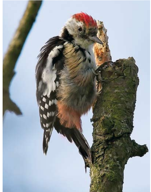
599 Jufferkraanvogel / Demoiselle Crane Grus virgo , eerstejaars, Westduinpark, Den Haag, Zuid-Holland, 9 oktober 2010 600 Middelste Bonte Specht / Middle Spotted Woodpecker Dendrocopos medius , Hollum, Ameland, Friesland, 25 september 2010 601 Bijeneters / European Bee-eaters Merops apiaster , Dijkwielen, Wieringermeer, Noord-Holland, 5 september 2010