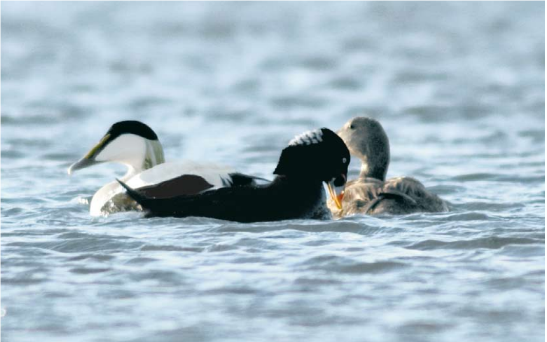
510 Surf Scoter / Brilzee-eend Melanitta perspicillata , adult male, with Common Eiders / Eiders Somateria mollissima , Slufter, Texel, Noord-Holland, 10 May 2009 (René Pop)