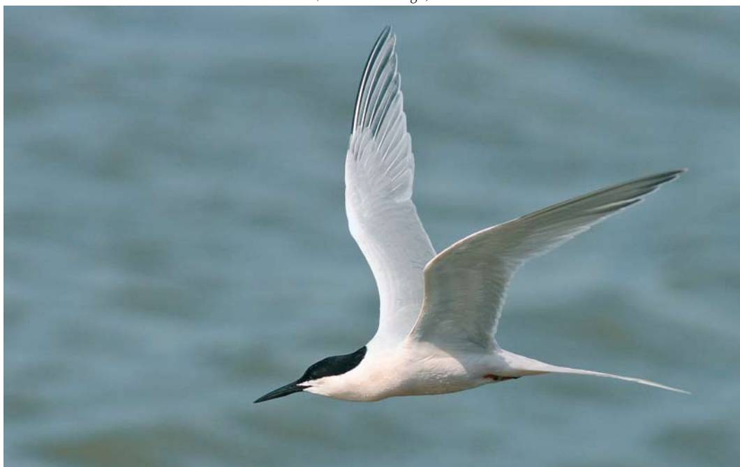
516 Roseate Tern / Dougalls Stern Sterna dougallii , adult, Stellendam, Zuid-Holland, 7 May 2009