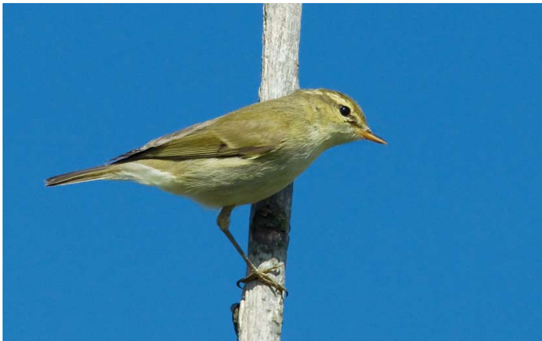
613 Grauwe Fitis / Greenish Warbler Phylloscopus trochiloides , De Cocksdorp, Texel, Noord-Holland, 3 september 2010 ( Jos van den Berg ) 614 Siberische Tjiftjaf / Siberian Chiffchaff Phylloscopus collybita tristis , De Cocksdorp, Texel, Noord-Holland, 17 oktober 2010 ( Jos van den Berg ) 615 Mogelijke Vale Braamsluiper / possible Central Asian Lesser Whitethroat Sylvia curruca halimodendri , De Cocksdorp, Texel, Noord-Holland, 30 oktober 2010 ( Jos van den Berg )