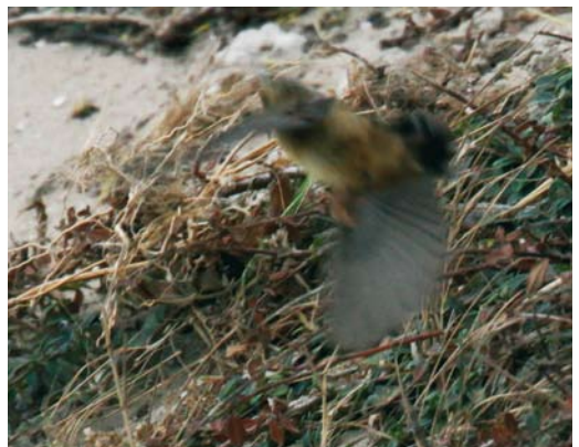
525 Red-spotted Bluethroat / Roodsterblauwborst Luscinia svecica svecica , De Cocksdorp, Texel, Noord-Holland, 18 May 2008 526 Spaanse Mus / Spanish Sparrow Passer hispaniolensis , male, Maasvlakte, Zuid-Holland, 20 April 2009 527 Iberian Chiffchaff / Iberische Tjiftjaf Phylloscopus ibericus , Haarlem, Noord-Holland, 7 June 2009 528 River Warbler / Krekeltzanger Locustella fluviatilis , Nietap, Drenthe, 11 June 2009 529 Rufous-tailed Rock Thrush / Rode Rotslijster Monticola saxatilis , male, Veenhuizerstukken, Groningen, 1 May 2009 530 Pallas's Grasshopper Warbler / Siberische Sprinkhaanzanger Locustella certhiola , Maasvlakte, Zuid-Holland, 3 October 2009