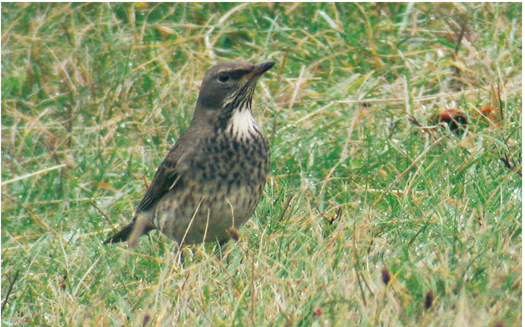
532 Black-throated Thrush / Zwartkeellijster Turdus atrogularis , adult female, 't Horntje, Texel, Noord-Holland, 1 November 2009 (Sjaak Schilperoort)