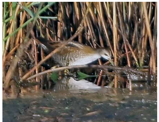
517 Black-winged Pratincole / Steppenvorkstaartplevier Glaucopis trichoptera , Strijen, Zuid-Holland, 6 November 2009 518 Alpine Swift / Alpengierzwaluw Apus melba , Kamperhoek, Flevoland, 3 April 2009 519 Buff-breasted Sandpiper / Blonde Ruiters Tryngites subruficollis , adult, Texel, Noord-Holland, 11 June 2009 520 Long-toed Stint / Taigastrandloper Calidris subminuta , juvenile, Vreugderijkerwaard, Overijssel, 25 October 2009 521 White-rumped Sandpiper / Bonapartes Strandloper Calidris fuscicollis , first-year, Dijksgatsweide, Wieringermeer, Noord-Holland, 16 October 2009 522 Little Crane / Klein Waterhoen Porzana parva , juvenile, Groene Jonker, Zevenhoven, Zuid-Holland, 11 August 2009