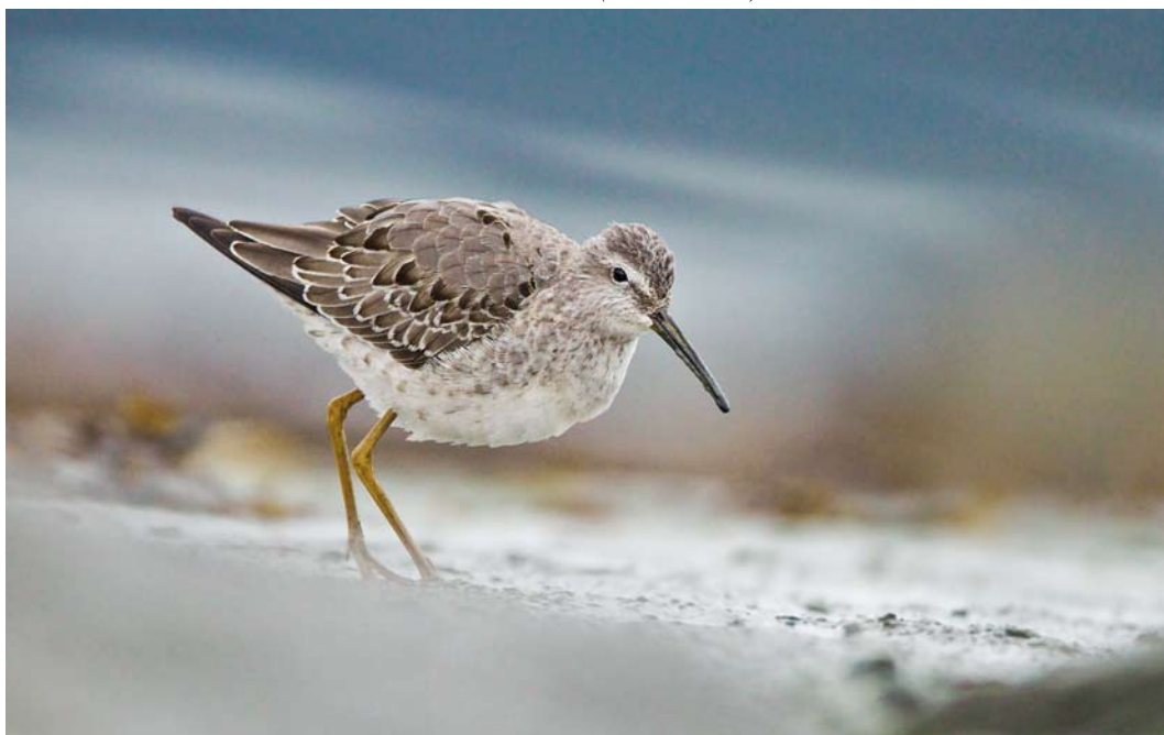
563 Stilt Sandpiper / Steltstrandloper Calidris himantopus , first-year, Stjørdal, Nord-Trøndelag, Norway, 17 October 2010