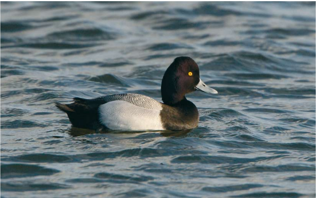
511 Lesser Scaup / Kleine Topper Aythya affinis , male, Oude Zeug, Noord-Holland, 23 March 2009 ( Michel Veldt )