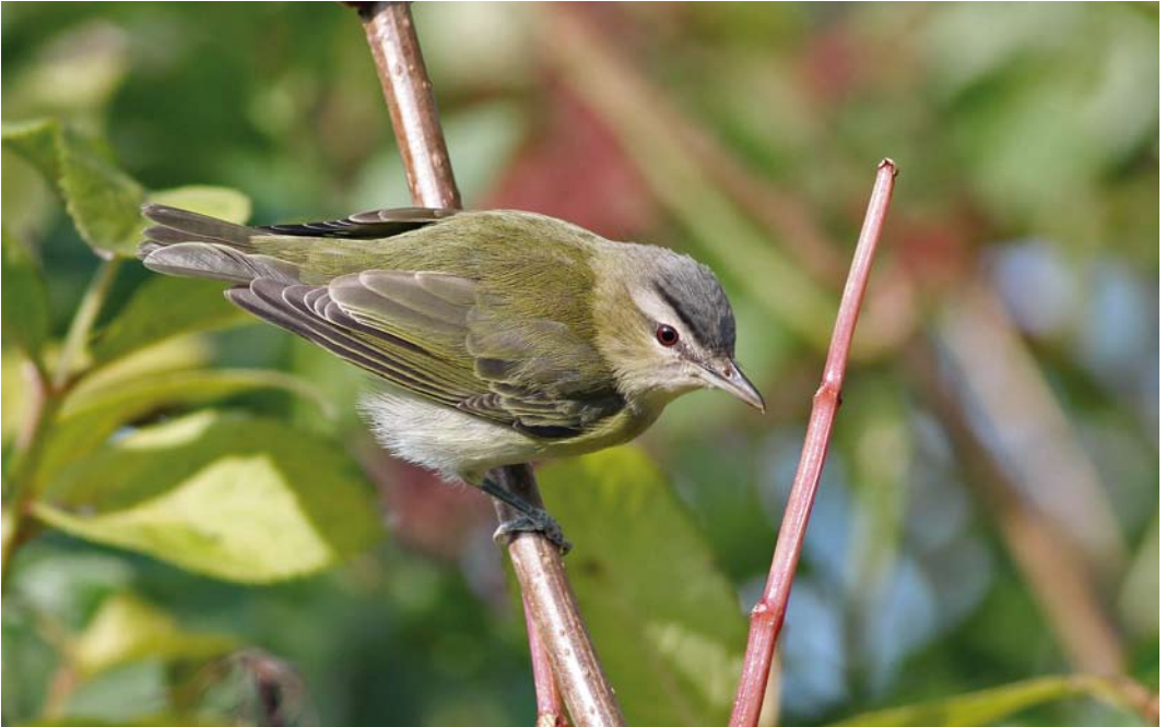
586 Red-eyed Vireo / Roodoogvireo Vireo olivaceus , Dunkerque, Nord, France, 21 October 2010