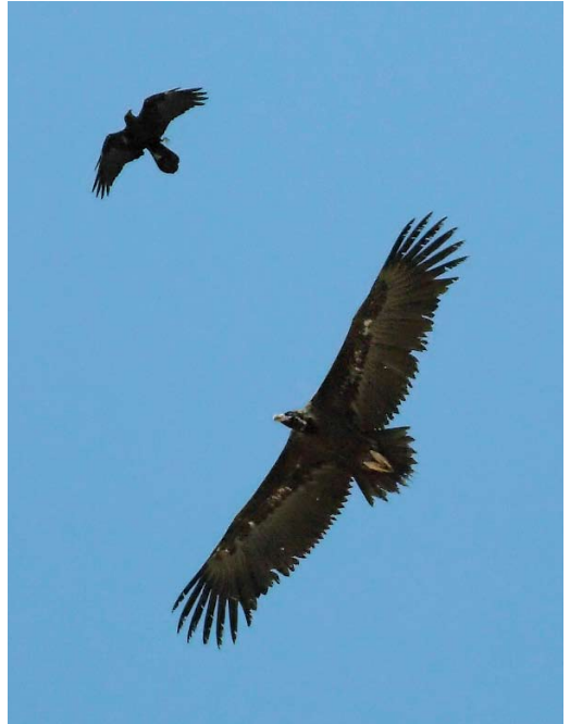
564 Upland Sandpiper / Bartrams Rooter Bartramia longicauda , Santa Luzia, Tavira, Portugal, 3 October 2010 565 Cinereous Vulture / Monniksgier Aegypius monachus , with Brown-necked Raven / Bruinnekraaf Corvus ruficollis , Bir Shalatein, Egypt, 15 October 2010 566 Namaqua Doves / Maskerduiven Oena capensis , El Gouna, Egypt, 2 October 2010