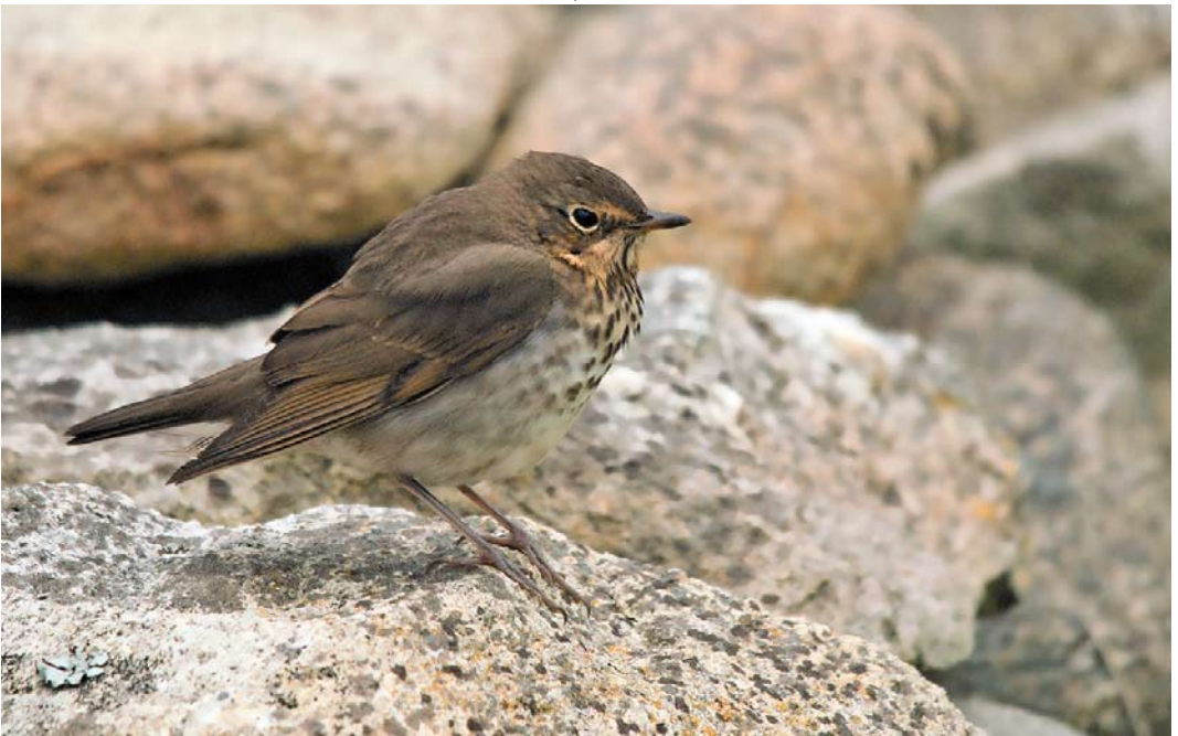
587 Swainson's Thrush / Dwerglijster Catharus ustulatus , Île de Sein, Finistère, France, 9 October 2010