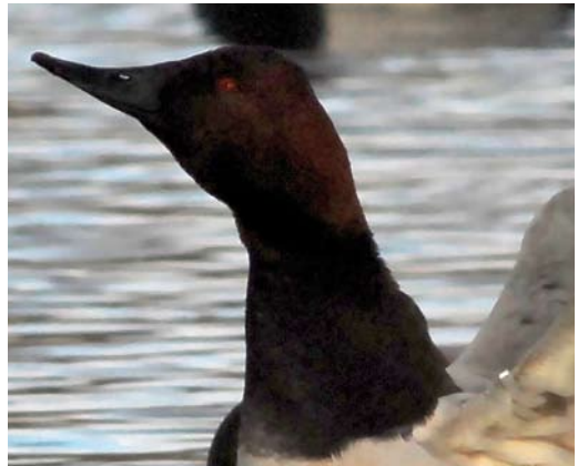
507 Ross's Geese / Ross' Ganzen Anser rossii , Waal en Burg, Texel, Noord-Holland, 28 September 2009 ( Eckard Boot ) 508 Green-winged Teal / Amerikaanse Wintertaling Anas carolinensis , male, Dijkmanshuizen, Texel, Noord-Holland, 4 April 2009 ( René van Rossum ) 509 Canvasback / Grote Tafeleend Aythya valisineria , adult male, Noordhollands Duinreservaat, Castricum, Noord-Holland, 12 January 2008 ( Teun Baarspul ). Note wing-clip on left wing, which led to recirculation of this record and subsequently to removal of this species from the Dutch list.

Greenland White-fronted Goose / Groenlandse Kogans Anser albifrons flavirostris 14,66,1 9 October to 22 November, Hoorn, Terschelling , Friesland, adult, photographed, videoed (A Ouwkerk, M Feenstra, J Vink et al). 2005 12 November, Kampereiland, Kampen , Overijssel, photographed (G J ter Haar, C Fikkert et al).