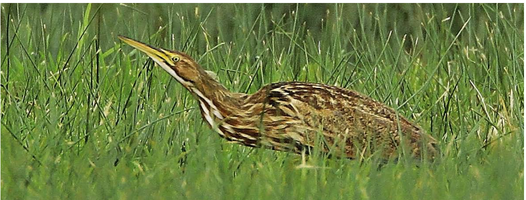
567 Wallcreeper / Rotskruiper Tichodroma muraria , Sint Pietersberg, Maastricht, Limburg, Netherlands, 22 November 2010 568 Blyth's Pipit / Mongoose Pieper Anthus godlewskii , first-year, Berlenga island, Portugal, 13 October 2010 569 Pacific Loon / Pacifische Parel-duiker Cavia pacifica (right), with Black-throated Loon / Parel-duiker G arctica , Great Northern Loon / Ijsduiker G immer and Velvet Scoter / Grote Zee-eend Melanitta fusca , Tuusulanjärvi, Finland, 10 November 2010 570 American Bittern / Noord-Amerikaanse Roerdomp Botaurus lentiginosus , Trewey Common, Cornwall, England, 6 November 2010