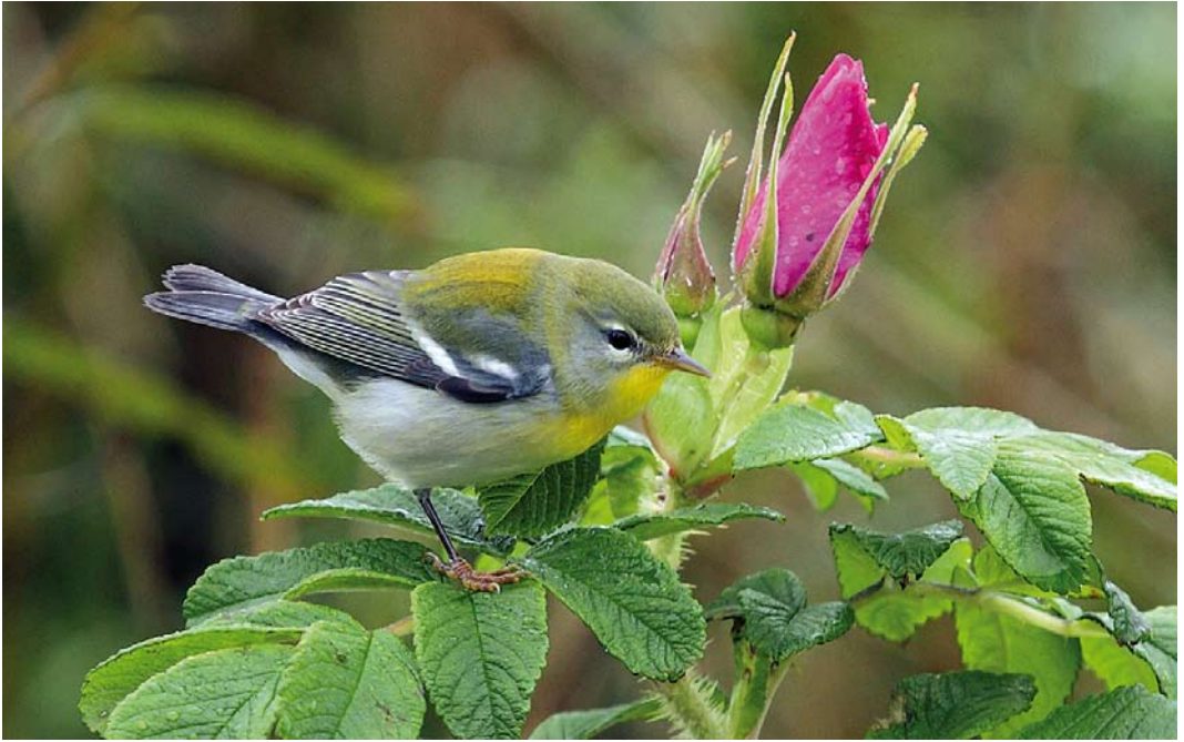
579 Northern Parula / Brillparulazanger Parula americana , Tiree, Argyll, Scotland, 29 September 2010 580 Alder Flycatcher / Elzenfeetiran Empidonax alnorum , first-year, Blakeney Point, Norfolk, England, 26 September 2010 581 Chestnut-sided Warbler / Roestflankzanger Dendroica pensylvanica , first-year, Île de Sein, Finistère, France, 10 October 2010