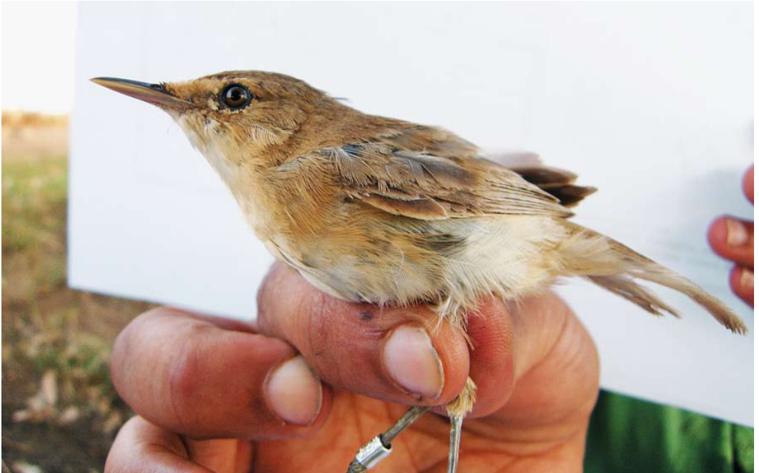
42 Local Moroccan reed warbler / karekiet Acrocephalus , adult, Larrache, lower Loukkos, Morocco, 7 September 2009 ( Pascal Provost ) 43 Local Moroccan reed warbler / karekiet Acrocephalus (left) and migrant Eurasian Reed Warbler / Kleine Karekiet A. scirpaceus , Larrache, lower Loukkos, Morocco, 9 September 2009 ( Pascal Provost ) 44 Local Moroccan reed warbler / karekiet Acrocephalus , Larrache, lower Loukkos, Morocco, 11 September 2009 ( Pascal Provost )