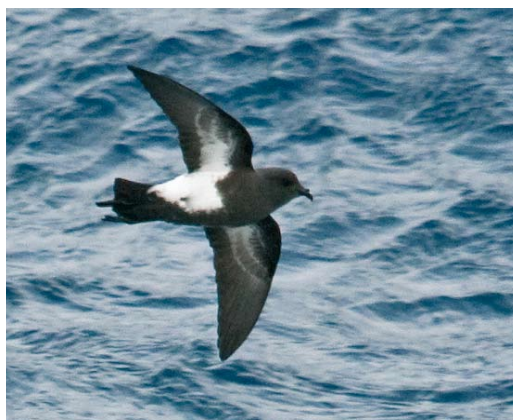
51-52 White-bellied Storm Petrel / Witbuikstormvogeltje Fregetta grallaria , between South Georgia and Gough Island (45°S, 21°W), 6 April 2009 (Steve N G Howell). Note narrow black leading edge to underwing, relatively small black hood and clean-cut, almost parallel-sided borders to large white belly patch on these two individuals. Distinct toe projections (score 2.5-3) suggest they are a smaller form of South Atlantic White-bellied Storm Petrel (cf plate 55). 53 Black-bellied Storm Petrel / Zwartbuikstormvogeltje Fregetta tropica , northeast of South Georgia (51°S, 30°W), 4 April 2009 (Steve N G Howell). Classically marked individual (belly score 4.5), but with no toe projection. 54 Black-bellied Storm Petrel / Zwartbuikstormvogeltje Fregetta tropica , at sea east-northeast of Campbell Island, New Zealand, 19 November 2008 (Steve N G Howell). Although this heavily marked individual (belly score 5, toe projection 3) agrees with classic field guide illustrations, such well-marked birds are probably in a minority in many areas of this species' range.

wings of Atlantic White-bellied have a narrower black leading edge than on Black-bellied (plate 50-55). Given that Haase did not specifically describe the extent of black on the chest and underwing, or any toe projection, these features cannot be evaluated, and the last is not relevant to Atlantic birds, anyway.