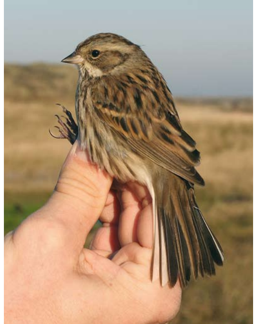
2-3 Maskergors / Black-faced Bunting Emberiza spodocephala oligoxantha , eerstejaars vrouwtje, Noordhollands Duinreservaat, Castricum, Noord-Holland, 18 november 2007

dicht duingras begroeid valleetje, waar hij ondanks zorgvuldig zoeken niet meer werd teruggevonden. De waarneming is door de Commissie Dwaalgasten Nederlandse Avifauna (CDNA) aangevaard als derde geval en het betreft het 16e geval voor Europa.