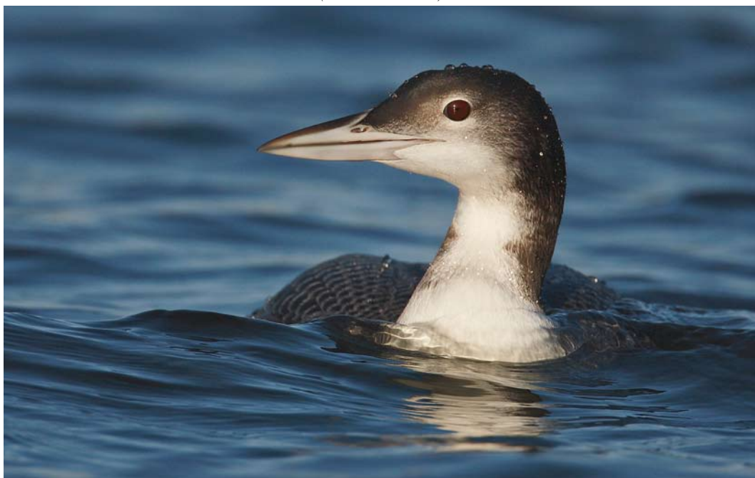
82 Ijsduiker / Great Northern Loon Gavia immer , eerstejaars, Harderhaven, Flevoland, 22 november 2009 ( Mark Schuurman )