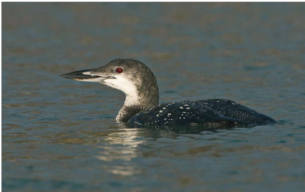
81 Ijsduiker / Great Northern Loon Gavia immer , adult, West-Terschelling, Terschelling, Friesland, 11 december 2009 ( Arie Ouwerkerk )