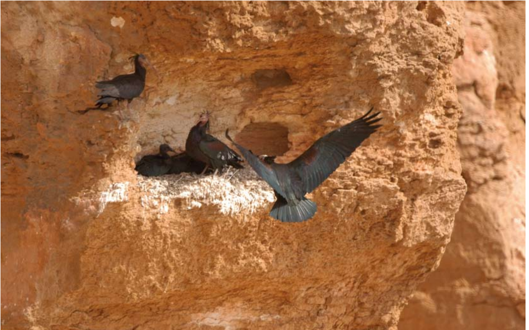
56 Northern Bald Ibises / Kaalkopibissen Geronticus eremita , Palmyra, Syria, 20 June 2006 (Mahmud Abdallah)