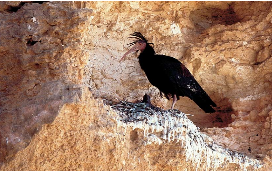
57 Northern Bald Ibis / Kaalkopibis Geronticus eremita , adult, Palmyra, Syria, spring 2008 (Mahmud Abdallah)