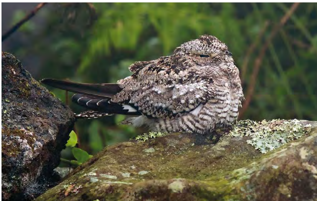
412 Common Nighthawk / Amerikaanse Nachtzwaluw Chordeiles minor , juvenile, main road to lighthouse, Corvo, Azores, 25 October 2007 (Vincent Legrand)