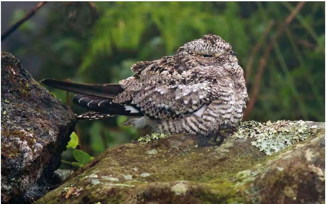
412 Common Nighthawk / Amerikaanse Nachtzwaluw Chordeiles minor , juvenile, main road to lighthouse, Corvo, Azores, 25 October 2007