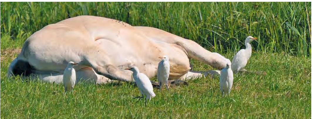
495 Struikrietzanger / Blyth's Reed Warbler Acrocephalus dumetorum , Castricum, Noord-Holland, 9 juli 2010 496 Veldrietzanger / Paddyfield Warbler Acrocephalus agricola , Valkeveen, Naarden, Noord-Holland, 22 augustus 2010 497 Woudaap / Little Bittern Ixobrychus minutus , juveniel, Zevenhuizen, Zuid-Holland, 9 augustus 2010 498 Waterrietzanger / Aquatic Warbler Acrocephalus paludicola , Abtskolk, Petten, Noord-Holland, 7 augustus 2010 499 Koereigers / Cattle Egrets Bubulcus ibis , juveniel (links) en adulte, Sliedrechtse Biesbosch, Zuid-Holland, 20 augustus 2010