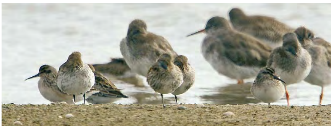
490 Aziatische Goudplevier / Pacific Golden Plover Pluvialis fulva , adult, Ottersaat, Texel, Noord-Holland, 18 augustus 2010 491 Grijsze Strandloper / Semipalmated Sandpiper Calidris pusilla , met Bonte Strandloper / Dunlin C alpina , 't Vroon, Westkapelle, Zeeland, 23 juli 2010 492 Breedbekstrandloper / Broad-billed Sandpiper Limicola falcinellus , juveniel, Eemshaven-West, Groningen, 24 augustus 2010 493 Breedbekstrandloper / Broad-billed Sandpiper Limicola falcinellus , juveniel, Balgzandpolder, Den Helder, Noord-Holland, 22 augustus 2010 494 Breedbekstrandlopers / Broad-billed Sandpipers Limicola falcinellus , juveniele (twee, links en rechts), Balgzandpolder, Den Helder, Noord-Holland, 25 augustus 2010