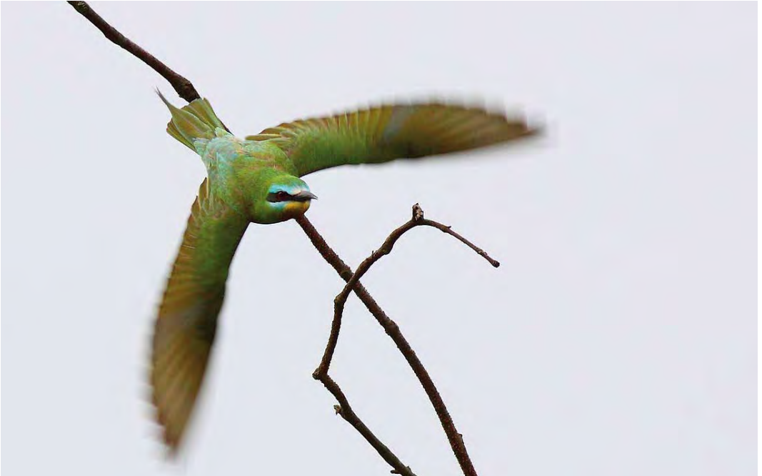
446 Groene Bijeneter / Blue-cheeked Bee-eater Merops persicus , adult, Castricum, Noord-Holland, 16 augustus 2010

het voorhoofd (minder en soms ontbrekend bij chrysocercus ). Verschillen in de groentint (meer geelgroen bij chrysocercus ) van bepaalde veerpartijen zijn door effecten van sleet en lichtomstandigheden niet altijd betrouwbaar als veldkenmerk voor ondersoortbepaling (cf Cramp 1988, del Hoyo et al 2001). Overigens staan de verschillen tussen beide taxa niet of nauwelijks vermeld in de meest gangbare veldgidsen (maar zie Heinzel et al 1996, del Hoyo et al 2001).