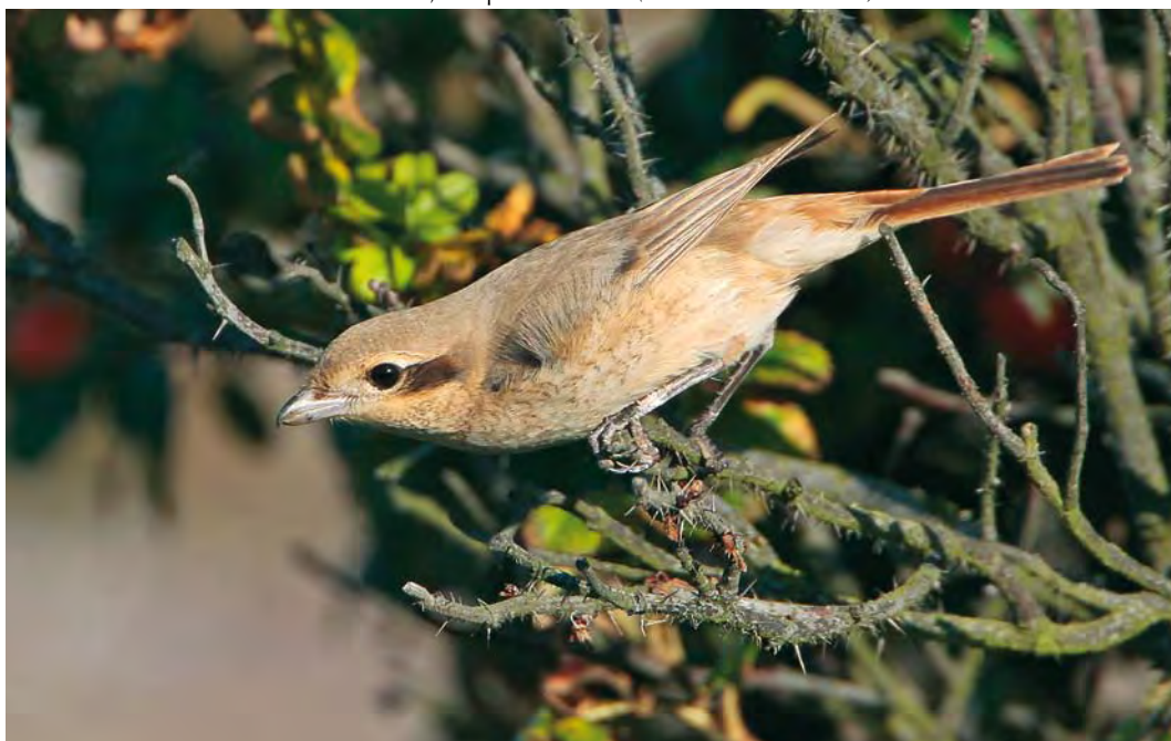
480 Daurian Shrike / Daurische Klauwier Lanius isabellinus , adult female, Den Helder, Noord-Holland, Netherlands, 5 September 2010 ( Martin van der Schalk )