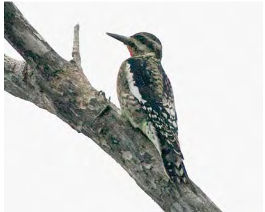
416 Tree Swallow / Boomzwaluw Tachycineta bicolor, high fields, Corvo, Azores, 19 October 2007 417 Chimney Swift / Schoorsteengierzwaluw Chaetura pelagica, Fojo, Corvo, Azores, 25 October 2009 418 American Barn Swallow / Amerikaanse Boerenzwaluw Hirundo rustica erythrogaster, first-winter, high fields, Corvo, Azores, 25 October 2006 419 Yellow-bellied Sapsucker / Geelbuiksapspecht Sphyrapicus varius, first-winter male, Fojo, Corvo, Azores, 29 October 2008