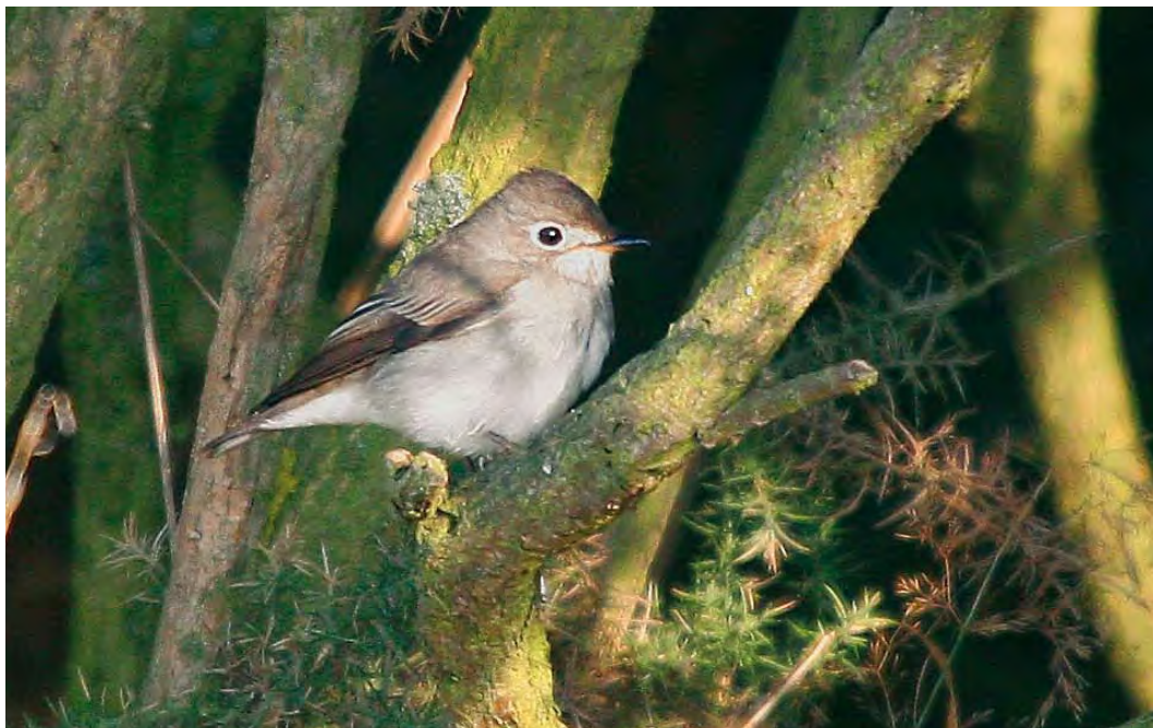
479 Asian Brown Flycatcher / Bruine Vliegenvanger Muscicapa dauurica , Buckton, East Yorkshire, England, 5 September 2010