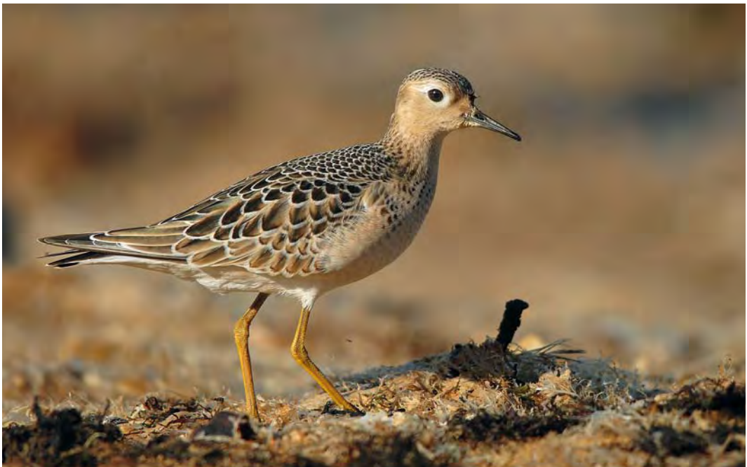
467 Buff-breasted Sandpiper / Blonde Ruiter Tryngites subruficollis , juvenile, Bañugues, Asturias, Spain, 20 September 2010

RAPTORS Two adult females and a male Crested Honey Buzzard Pernis ptilorhynchus flew past Batumi, Georgia, on 9, 10 and 11 September, when no less than 360 000 European Honey Buzzards P apivorus had already been counted here for this autumn. In France, a record 37-43 pairs of Black-winged Kite Elanus caeruleus produced at least 89 young in 2009. Singles were seen in Lüzern and St Gallen, Switzerland, on 2 and 4 August, in Baden-Württemberg, Germany, on 18 August, and at Warstein, Nordrhein-Westfalen, Germany, on 23-24 August. The reintroduction of White-tailed Eagles Haliaeetus albicilla in Suffolk, England, has been cancelled. The assumption that, in the long run, the species is likely to return by its own steam from the continent was not mentioned as the reason; instead, the consideration was a public outcry from game bird shooters and concerns about the survival of Eurasian Bitterns Botaurus stellaris . In 2009, breeding numbers of vultures in France increased for Bearded Vulture Gypaetus barbatus with 48 pairs producing 17 young, remained stable for Cinereous