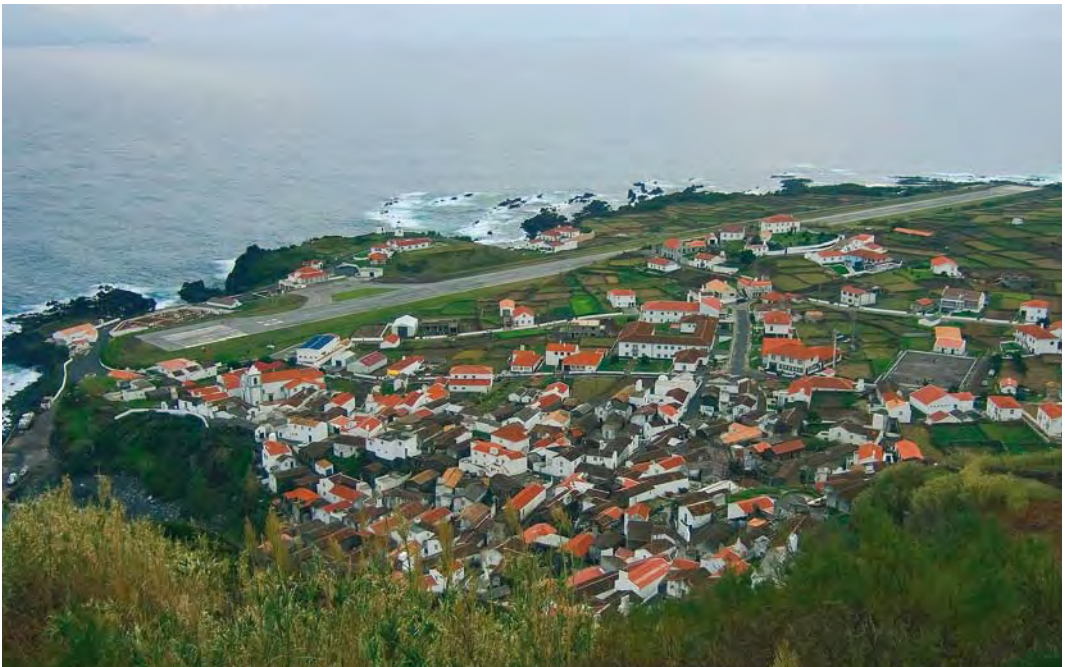
410 View of Corvo village from hill of high fields, Corvo, Azores, 1 November 2006 ( Vincent Legrand )

The primary purpose of this article is to explore that part of the avifauna for which Corvo is most well known – Nearctic vagrants. Recognizing the island's potential for American accidentals, Bannerman & Bannerman (1966) wrote: 'As a haven for vagrants ... [the Azores] must rank very high ... it is on Corvo and Flores that we should expect these overseas wanderers to arrive ... It would be astonishing if Corvo, in time, could not supply an even more interesting list of American migratory species.' It took 39 years for that prediction to be fully realised, when Peter Alfrey set out for Corvo at the height of a multi-decadal cycle of Atlantic storm activity in October 2005. Hoping to see an American landbird or two, he actually found 52 individuals of 17 species (Alfrey 2005). In the five years since that discovery, there have been several interesting developments. First and foremost has been the confirmation that American