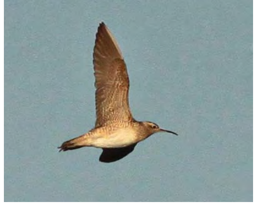
504-505 Kleine Regenwulp / Little Curlew Numenius minutus , Nieuwmunster, West-Vlaanderen, België, 18 september 2010

Kleine Regenwulp bij Uitkerke Begin september 2010 vroeg mijn oude vogelmaat Bart De Schutter, die ik al meer dan 15 jaar niet meer had gesproken, mij (Gunther Vergauwen) of ik het zag zitten om nog eens een ouderwets dagje te gaan vogelen in West-Vlaanderen, België, samen met Wim Van Nunen en Steven Keteleer. Met hen maakte ik vroeger de omgeving van Kallo-Doel onveilig; daar begon mijn vogelcarrière, ergens in 1985. Geen van ons hoefde lang na te denken, het ging een reünie vol nostalgische gevoelens worden, zoveel was zeker! En dat werd het dus ook... Op 18 september was het zover. Het werd al snel duidelijk dat er niet veel te beleven was aan het bosjesfront, er zat vrijwel niets aan de grond en de zichtbare trek was ook vrijwel nul. Ondanks de afwezigheid van leuke aantallen vogels konden we voor de middag toch een eerste-winter Spervergrasmus