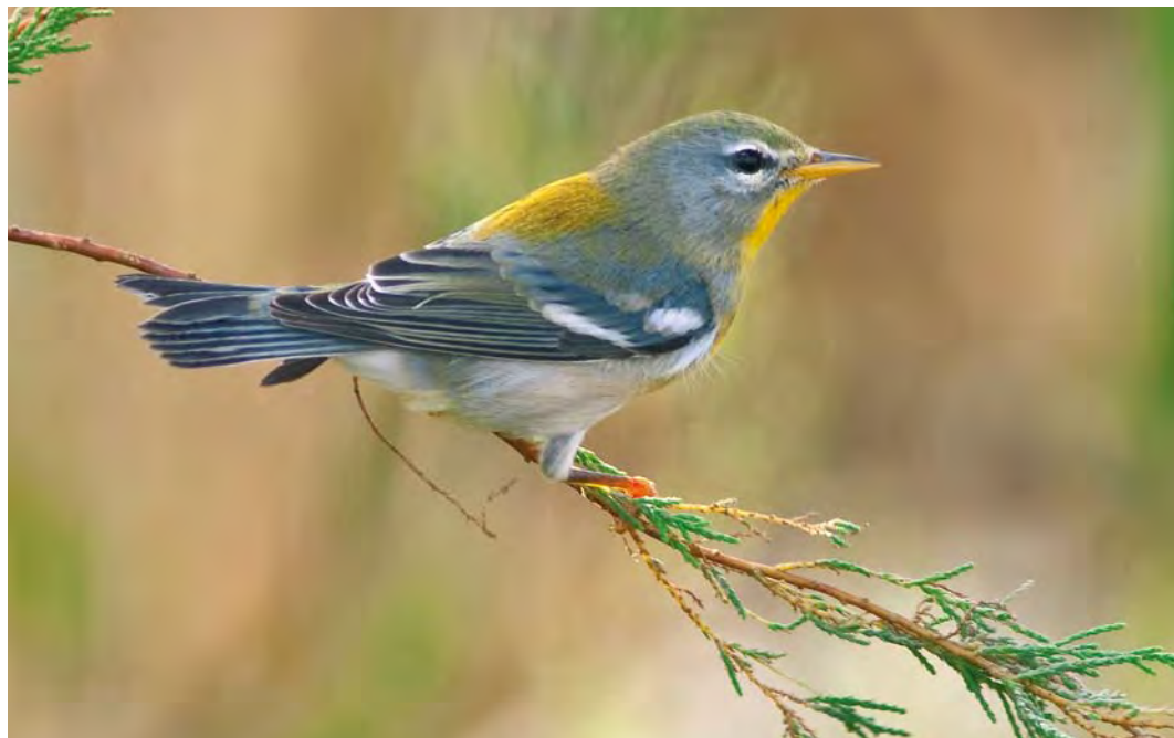
426 Northern Parula / Brilparulazanger Parula americana , first-winter male, power station, Corvo, Azores, 20 October 2009 ( David Monticelli )