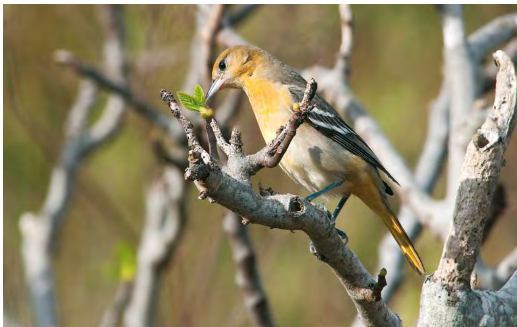
425 Baltimore Oriole / Baltimoreorioepial Icterus galbula , middle fields, Corvo, Azores, 16 October 2009