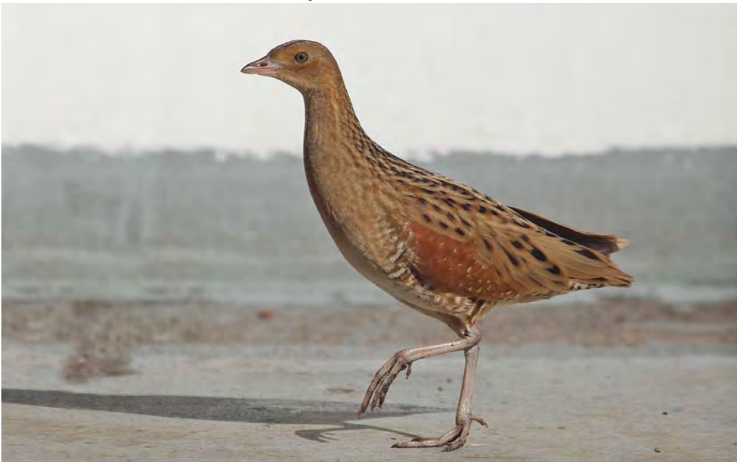
486 Kwartelkoning / Corn Crake Crex crex , juveniel, Noordzee ten westen van Zuid-Holland, Continentaal Plat, 28 augustus 2010 ( Cor Fikkert )