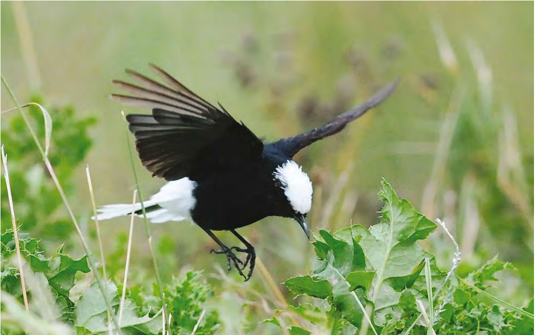
475 White-crowned Wheatear / Witkruintapuit Oenanthe leucopyga , Wremen, Niedersachsen, Germany, 19 September 2010