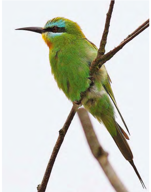
442-444 Groene Bijeneter / Blue-cheeked Bee-eater Merops persicus , adult, Castricum, Noord-Holland, 16 augustus 2010