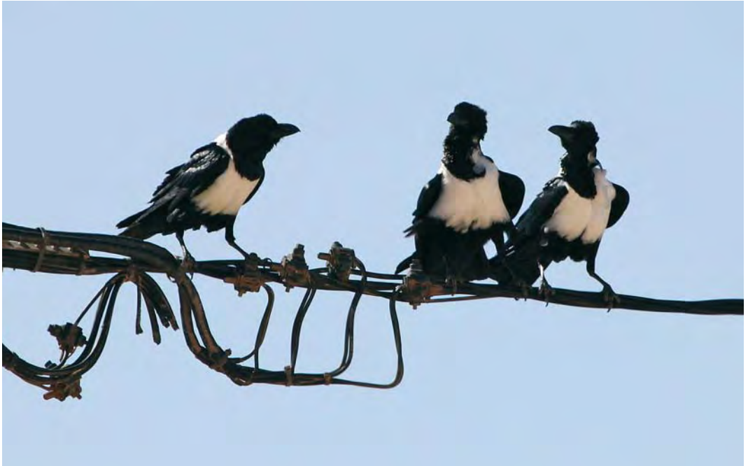
448 Pied Crows / Schildraven Corvus albus , 152 km north-east of Dakhla, Western Sahara, Morocco, 13 December 2009

with an obvious gape patch were seen, proving that the breeding attempt had been successful (Richard Bonser, Josh Jones, Oliver Metcalf and Plop Pointon; www.go-south.org ).