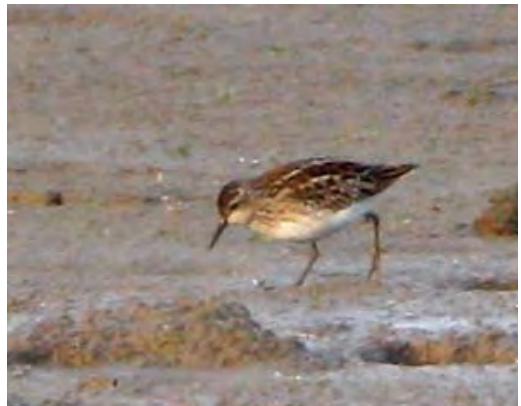
434 Taigastrandloper / Long-toed Stint Calidris subminuta , juveniel (onder), met Bonte Strandloper / Dunlin C alpina , Vreugderijkerwaard, Zwolle, Overijssel, 25 oktober 2009 (Jaap Denee) 435 Taigastrandloper / Long-toed Stint Calidris subminuta , juveniel, Vreugderijkerwaard, Zwolle, Overijssel, 25 oktober 2009 (Jaap Denee) 436 Taigastrandloper / Long-toed Stint Calidris subminuta , juveniel, Vreugderijkerwaard, Zwolle, Overijssel, 25 oktober 2009 (Eric Menkveld) 437 Taigastrandloper / Long-toed Stint Calidris subminuta , juveniel, Vreugderijkerwaard, Zwolle, Overijssel, 24 oktober 2009 (Martin van der Schalk)

STAART Bovenstaart wit met donker centraal deel (in lengterichting).