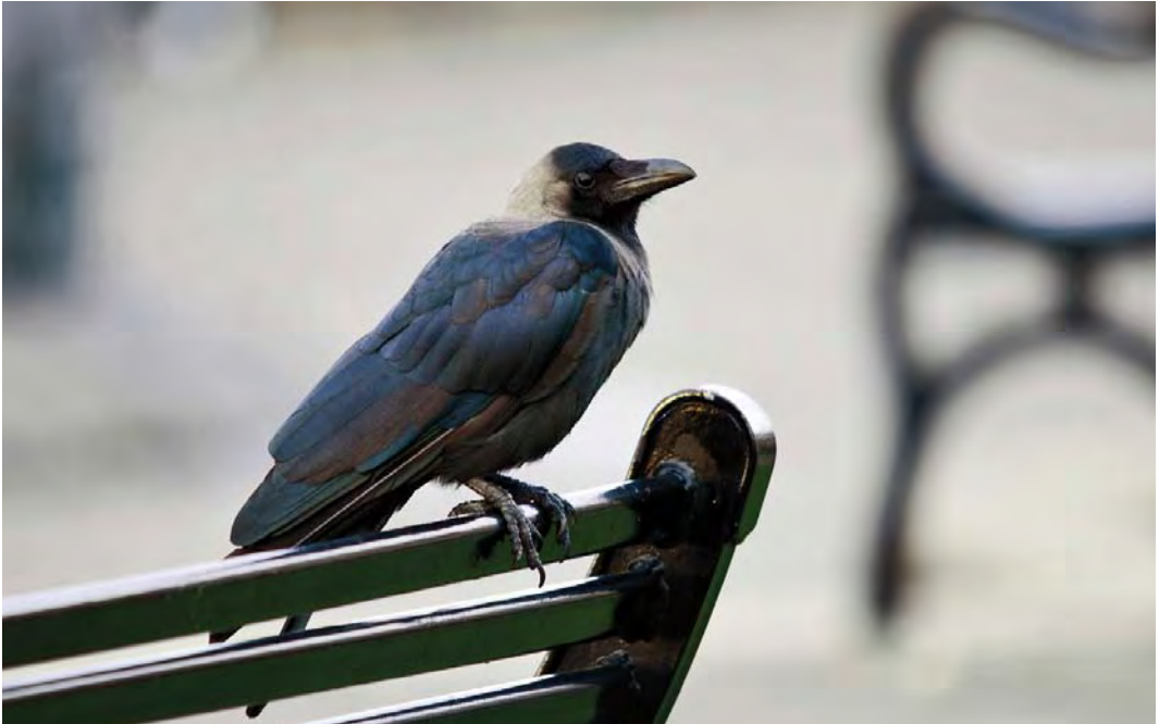
481 House Crow / Huis kraai Corvus splendens , Cobh, Cork, Ireland, 15 September 2010

tember was the first for Denmark in 26 years. Equally remarkable was the first for the Frisian Wadden Sea islands discovered on Ameland, Friesland, on 25 September.