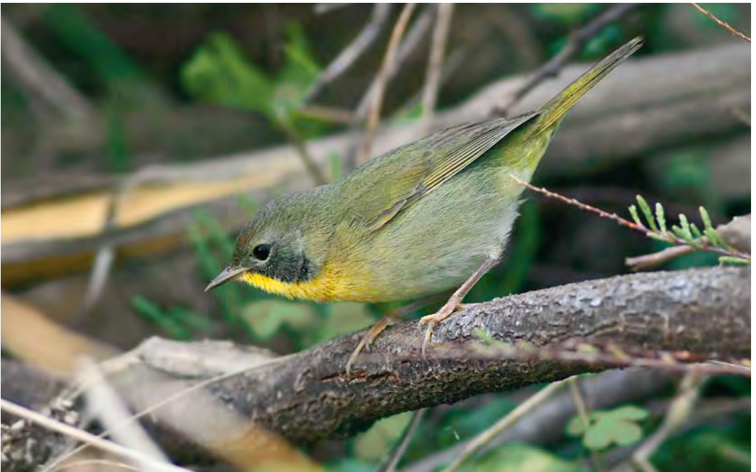
429 Common Yellowthroat / Gewone Maskerzanger Geothlypis trichas , first-winter male, middle fields, Corvo, Azores, 30 October 2008 (David Monticelli)