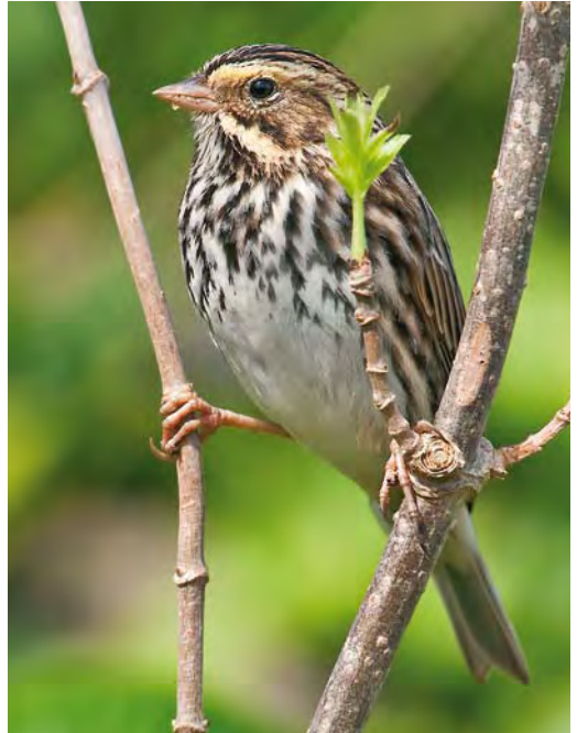
413 Black-and-white Warbler / Bonte Zanger Mniotilta varia , first-winter male, Ribeira da Ponte, Corvo, Azores, 6 October 2009 ( Rafael Armada ) 414 Savannah Sparrow / Savannahgors Passerculus sandwichensis , first-winter male, high fields, Corvo, Azores, 29 October 2009 ( Vincent Legrand ) 415 Yellow-billed Cuckoo / Geelsnavelkoekoek Coccyzus americanus , first-winter, middle fields, Corvo, Azores, 19 October 2009 ( Vincent Legrand )