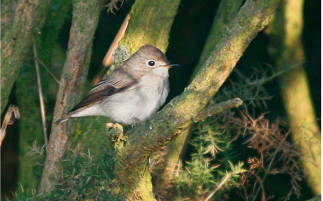
479 Asian Brown Flycatcher / Bruine Vliegenvanger Muscicapa dauurica , Buckton, East Yorkshire, England, 5 September 2010