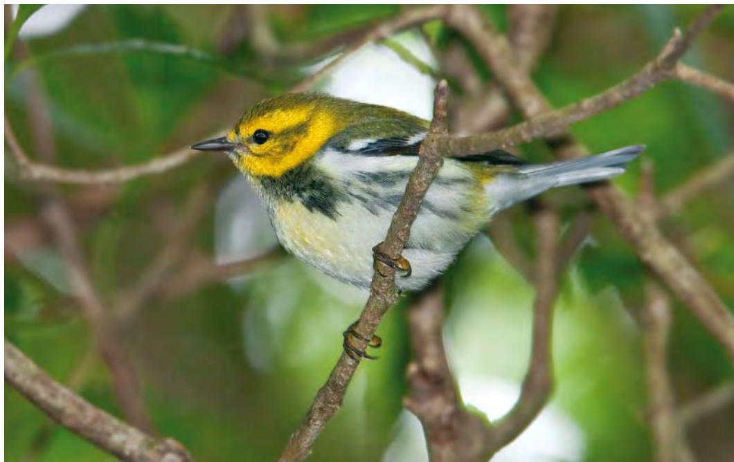
428 Black-throated Green Warbler / Gele Zwartkeelzanger Dendroica virens , first-winter male, Ribeira da Ponte, Corvo, Azores, 10 October 2009 (Vincent Legrand)