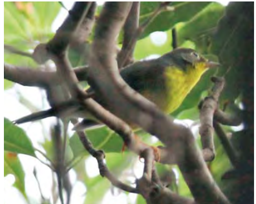
430 White-eyed Vireo / Witoogvireo Vireo griseus , Ribeira da Lapa, Corvo, Azores, 24 October 2008 (Edward Verduyze) 431 Hooded Warbler / Monnikszanger Wilsonia citrina , male, Cancelas, Corvo, Azores, 11 October 2008 (Dominic Mitchell) 432 American Redstart / Amerikaanse Roodstaart Setophaga ruticilla , Ribeira da Ponte, Corvo, Azores, 17 October 2009 (David Monticelli) 433 Canada Warbler / Canadazanger Wilsonia canadensis , Fojo, Corvo, Azores, 12 October 2009 (Olof Jönsson)