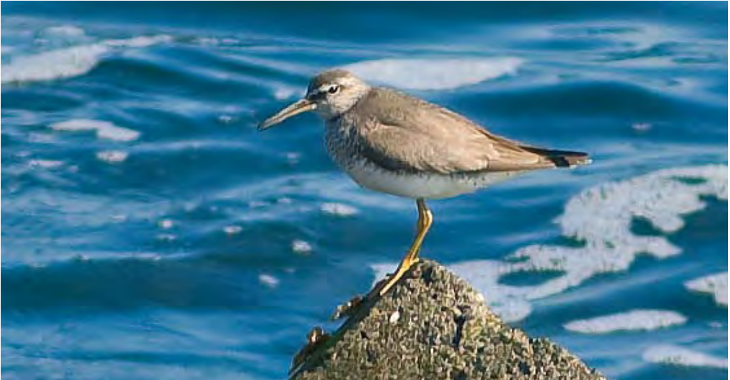
438 Siberische Grijs Ruiters / Grey-tailed Tattler Tringa brevipes , IJmuiden, Noord-Holland, 28 juli 2010