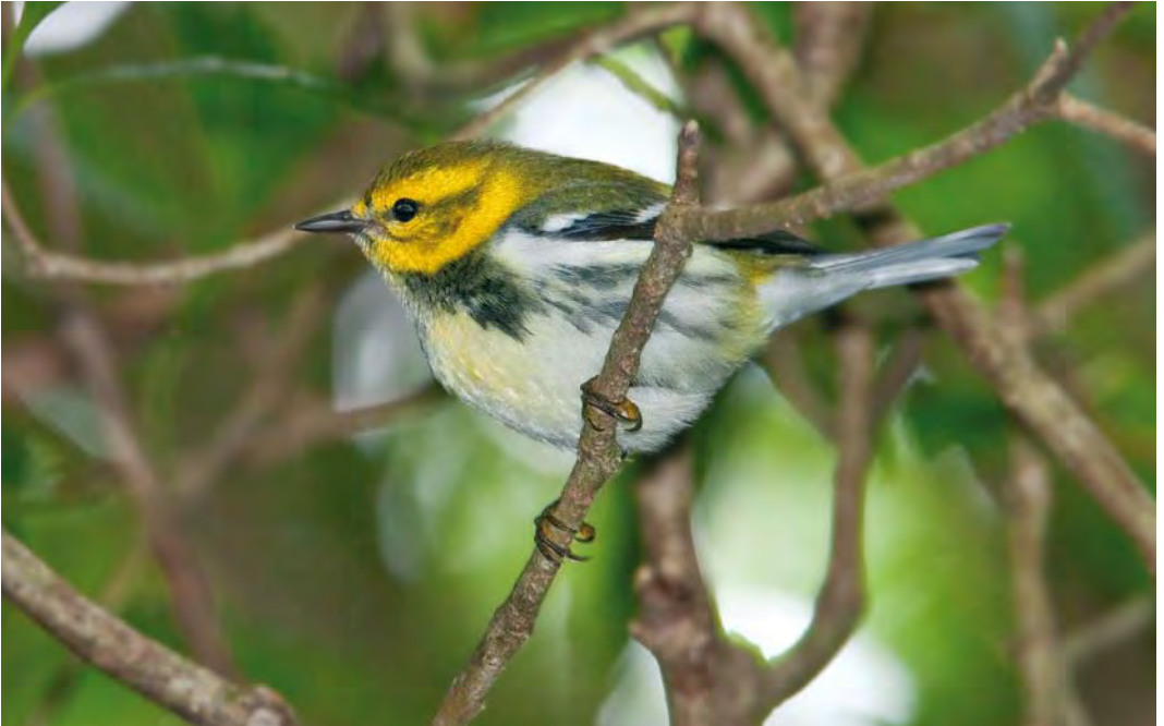
428 Black-throated Green Warbler / Gele Zwartkeelzanger Dendroica virens , first-winter male, Ribeira da Ponte, Corvo, Azores, 10 October 2009