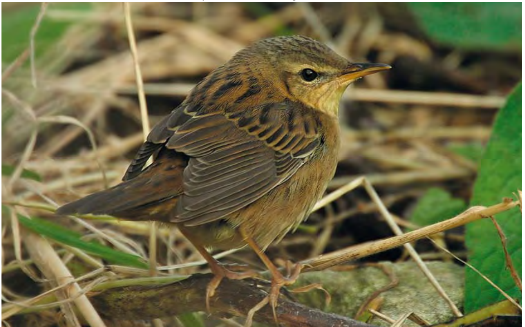
472 Pallas's Grasshopper Warbler / Siberische Sprinkhaanzanger Locustella certhiola , Fair Isle, Shetland, Scotland, 23 September 2010