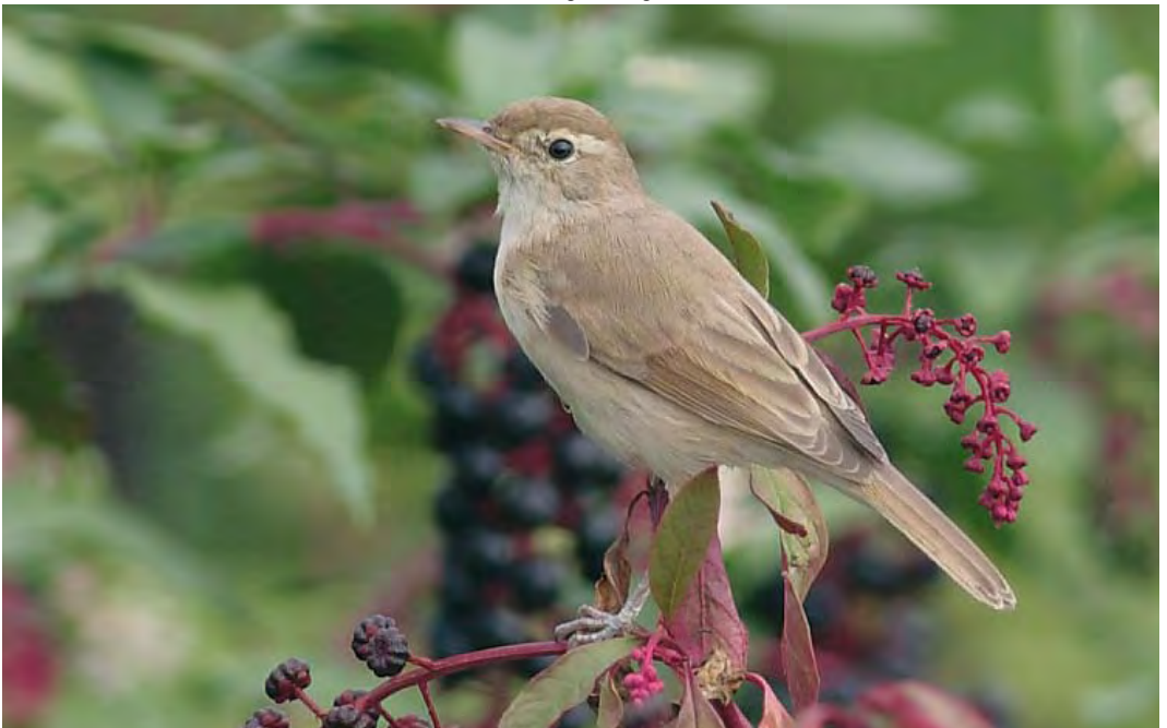
474 Booted Warbler / Kleine Spotvogel Iduna caligata , Rize, Rize, Turkey, 5 September 2010