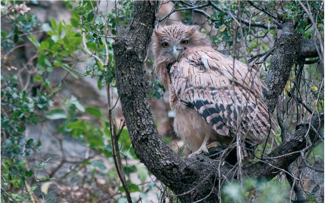
407 Western Brown Fish Owl / Westelijke Bruine Visuil Bubo (zeylonensis) semenowi , fledgling roosting by day near nest site, Antalya, Turkey, 14 July 2009