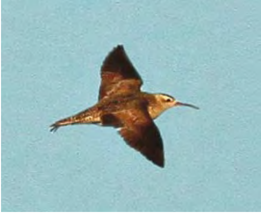
504-505 Kleine Regenwulp / Little Curlew Numenius minutus , Nieuwmunster, West-Vlaanderen, België, 18 september 2010 (Johan Buckens)