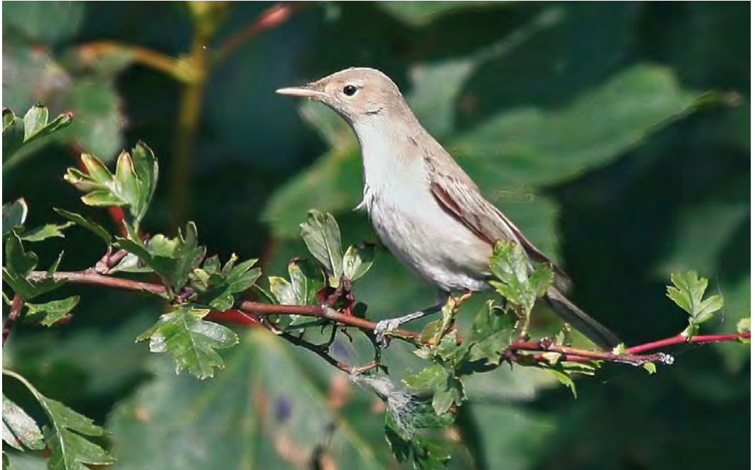
471 Eastern Olivaceous Warbler / Oostelijke Vale Spotvogel Iduna pallida , Flamborough Head, East Yorkshire, England, 1 September 2010