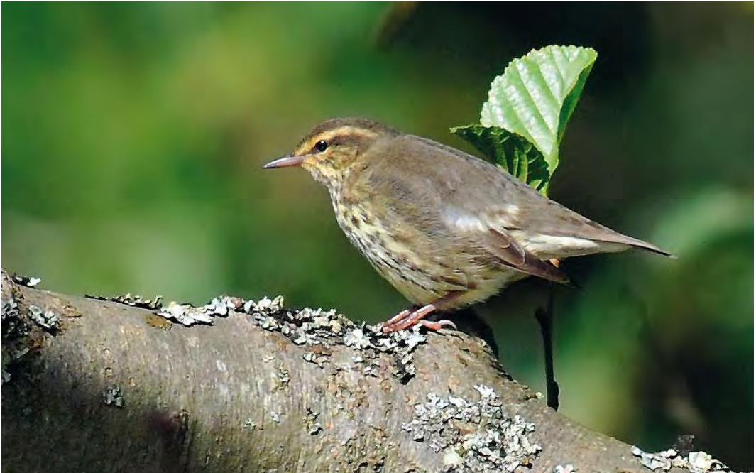
503 Noordse Waterlijster / Northern Waterthrush Seiurus noveboracensis , Oude Eendenkooi, Vlieland, Friesland, 21 september 2010

een vogelboek bij Jeroens fiets zodat ik kon checken wat ik had gezien. Ik zocht snel Noordse Waterlijster op – dat leek wel heel erg op de vogel... Arnout was de eerste die hem daarna kort maar goed zag. Hij bevestigde dat het een waterlijster was. Vervolgens vond Bas hem op een ander plekje terug en konden we hem alle vier goed bekijken. Jeroen sloot Louisianawaterlijster S motacilla uit op basis van de eenkleurige wenkbrauwstreep en zeemkleurige flanken en onderdelen. Na c 1 min vloog hij zonder aanleiding de plas van de eendenkooi op en verdween links om de bocht.