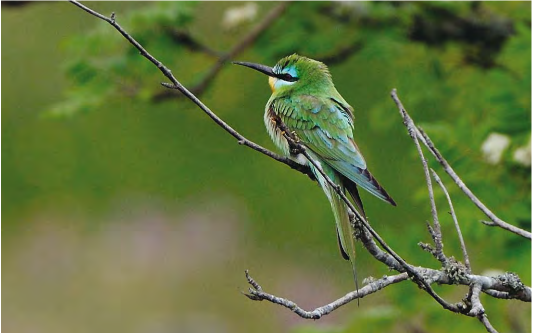
468 Blue-cheeked Bee-eater / Groene Bijeneter Merops persicus , adult, Sandviken, Gotland, Sweden, 8 June 2010 cf Dutch Birding 32: 275, 2010 469 Great Spotted Cuckoo / Kuifkoekoek Clamator glandarius , juvenile, IJzerbroeken, Reninge, West-Vlaanderen, Belgium, 12 August 2010 470 Northern Waterthrush / Noordse Waterlijster Seiurus noveboracensis , Oude Eendenkooi, Vlieland, Friesland, Netherlands, 18 September 2010