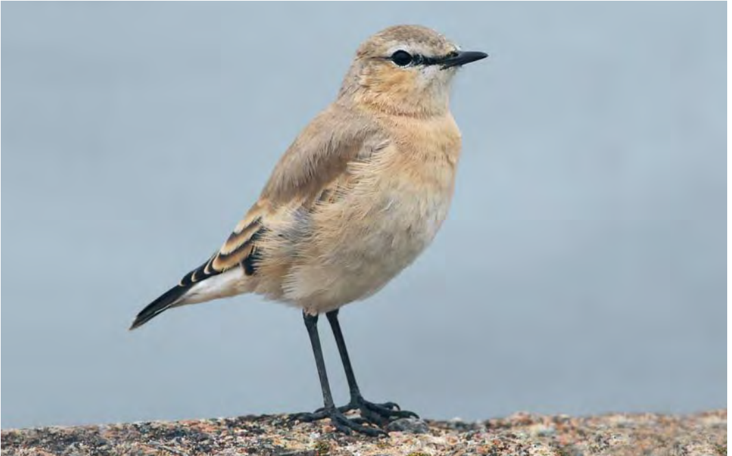
477 Isabelline Wheatear / Izabeltapuit Oenanthe isabellina , Tampere, Finland, 5 September 2010 (William Velmala)