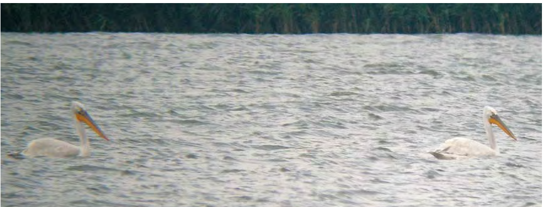
456-457 Pallas's Sandpiper / Steppehoen Syrrhaptes paradoxus , Askola, Lappeenranta, Finland, 30 July 2010 458 Rock Partridge / Steenpatrijs Alectoris graeca , Allgäuer Alpen, Bayern, Germany, 6 June 2010 459 Pallas's Gull / Reuzenzwartkopmeeuw Larus ichtyaetus , adult, with Caspian Gulls / Pontische Meeuwen L. cachinnans , Kummerower See, Mecklenburg-Vorpommern, Germany, 1 August 2010 460 Dalmatian Pelicans / Kroeskoppelikanen Pelecanus crispus , Kis Balaton, Zala, Hungary, 31 July 2010