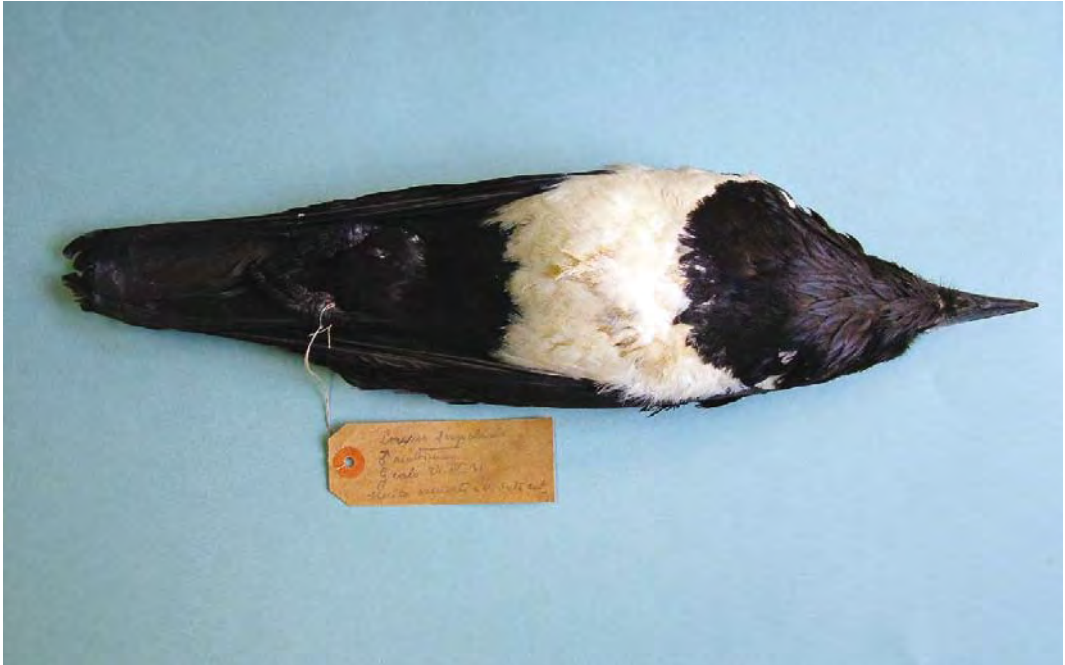
452 Pied Crow / Schildraaf Corvus albus (collected at Jalo oasis, Al Wahat, Libya, on 24 April 1931), Museo Civico di Storia Naturale Giacomo Doria, Genova, Italy, 26 February 2009