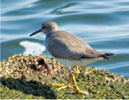
441 Siberische Grijsze Ruiters / Grey-tailed Tattler Tringa brevipes , IJmuiden, Noord-Holland, 28 juli 2010

sen suggereert dat veel vogels de afstand tussen Japan en Australië non-stop overbruggen (Bamford et al 2008).