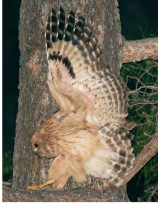
409 Western Brown Fish Owl / Westelijke Bruine Visuil Bubo (zeylonensis) semenowi , adult in flight near nest site, Antalya, Turkey, 11 March 2010