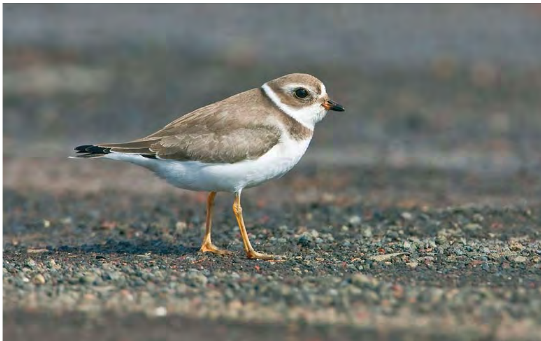
411 Semipalmated Plover / Amerikaanse Bontbekplevier Charadrius semipalmatus , first-winter, airport area, Corvo, Azores, 24 October 2007