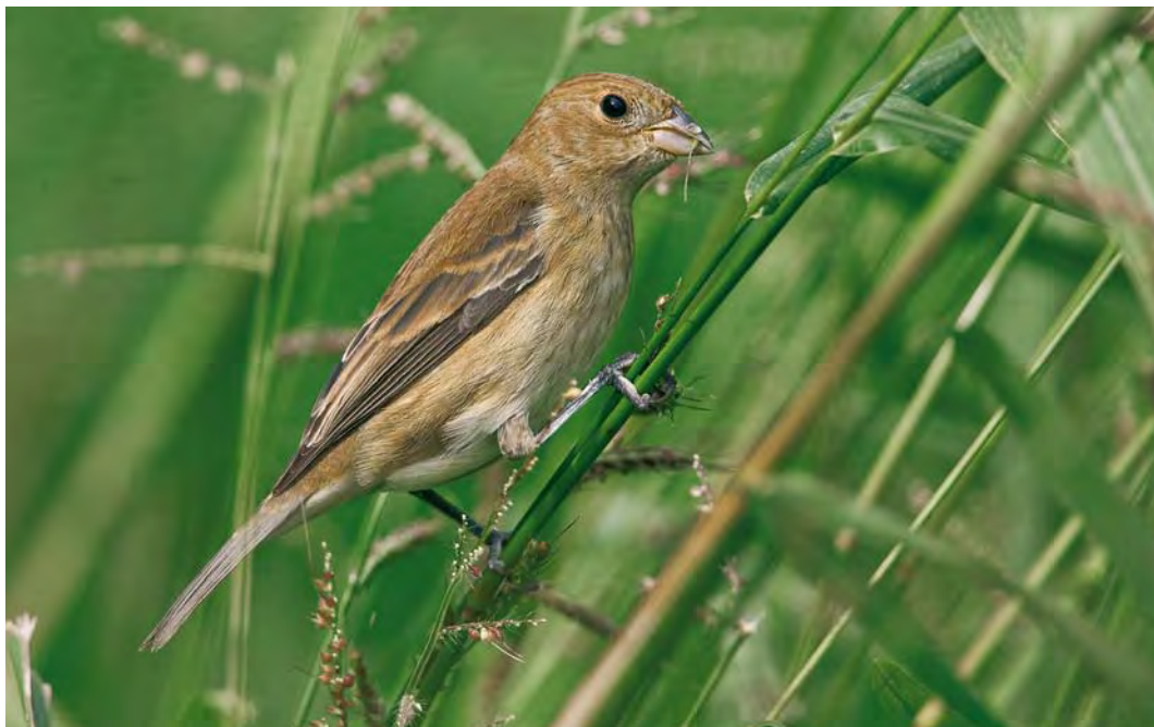
424 Indigo Bunting / Indigogors Passerina cyanea , Ribeira da Ponte, Corvo, Azores, 23 October 2007 (Rafael Armada)