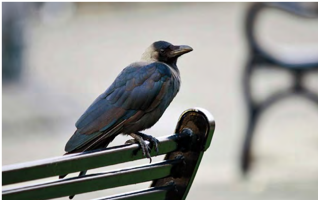
481 House Crow / Huis kraai Corvus splendens , Cobh, Cork, Ireland, 15 September 2010 (Rónán Mclaughlin)

tember was the first for Denmark in 26 years. Equally remarkable was the first for the Frisian Wadden Sea islands discovered on Ameland, Friesland, on 25 September.