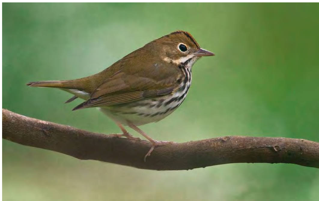
427 Ovenbird / Ovensvogel Seiurus auricapilla , first-winter, Fojo, Corvo, Azores, 15 October 2009