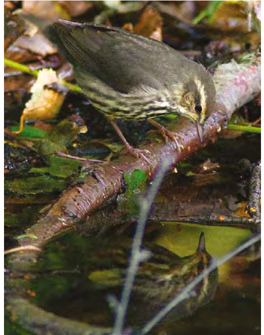
500 Noordse Waterlijster / Northern Waterthrush Seiurus noveboracensis , Oude Eendenkooi, Vlieland, Friesland, 18 september 2010 ( Laurens Steijn ) 501-502 Noordse Waterlijster / Northern Waterthrush Seiurus noveboracensis , Oude Eendenkooi, Vlieland, Friesland, 18 september 2010 ( Arnold W J Meijer )