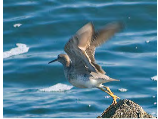
439-440 Siberische Grijs Ruiters / Grey-tailed Tattler Tringa brevipes , IJmuiden, Noord-Holland, 28 juli 2010 (Arno Piek)

dering tot op buik en onderstaartdekveren); 2 opvallende wenkbrauwstreep achter het oog (bij zomerkleed Amerikaanse Grijs onduidelijk begrensd en in sterkere mate verscholen onder vlekjes of streepjes); 3 duidelijke witte veerranden aan bovenstaartdekveren (bij Amerikaanse Grijs hooguit smalle witte randen); 4 tweekleurige snavel (bij Amerikaanse Grijs gewoonlijk donker met alleen licht op ondersnavelbasis); en 5 tweetonige roep (vaak zes- tot 10-tonig en aan Regenwulp Numenius phaeopus herinnerend bij Amerikaanse Grijs) (zie Hayman et al 1986, Hirst & Proctor 1995, van Duivendijk 2002, Forsyth 2004, Chandler 2009).