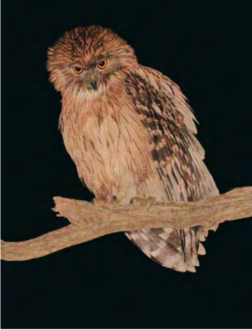
408 Western Brown Fish Owl / Westelijke Bruine Visuil Bubo (zeylonensis) semenowi , blackish-faced adult in pine tree near nest site, Antalya, Turkey, 28 December 2009