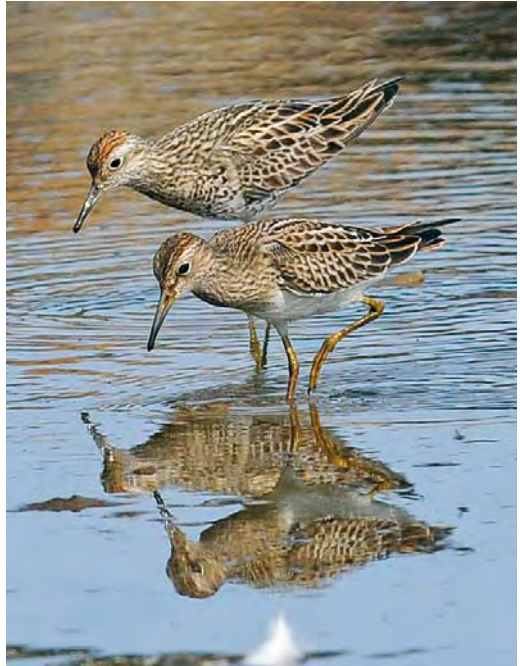
453 Solitary Sandpiper / Amerikaanse Bosruiter Tringa solitaria , Lugar de Baixo, Madeira, 2 September 2010 (Roef Mulder) 454 Sharp-tailed Sandpiper / Siberische Strandloper Calidris acuminata , adult (back), and Pectoral Sandpiper / Gestreepte Strandloper C. melanotos , juvenile, Lugar de Baixo, Madeira, 29 August 2010 (Roef Mulder) 455 Red-necked Stint / Roodkeelstrandloper Calidris ruficollis , adult (front), with Dunlin / Bonte Strandloper C. alpina , juvenile, Weymouth, Dorset, England, 27 August 2010 (Paul F Baker)