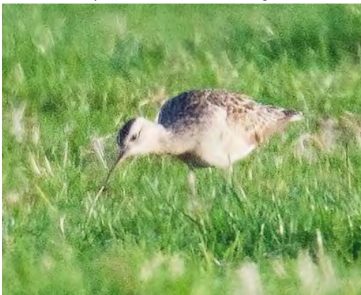
506 Kleine Regenwulp / Little Curlew Numenius minutus , Nieuwmunster, West-Vlaanderen, België, 18 september 2010

Sylvia nisoria , een Draaihals Lynx torquilla en een Graszanger Cisticola juncidis scoren. Niet slecht eigenlijk, vooral voor Wim en Bart die deze soorten al in geen jaren hadden gezien. Na de middag konden we daar nog een zeer mak vrouwtje Sneeuwgorst Plectrophenax nivalis in de Voorhaven en een door Bart gevonden Koereiger Bubulcus ibis aan toevoegen.