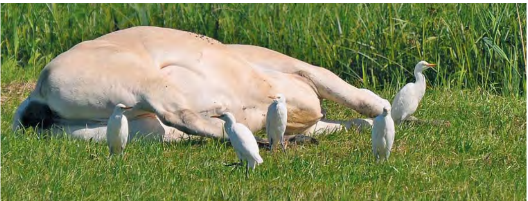
495 Struikrietzanger / Blyth's Reed Warbler Acrocephalus dumetorum , Castricum, Noord-Holland, 9 juli 2010 ( Jan Visser ) 496 Veldrietzanger / Paddyfield Warbler Acrocephalus agricola , Valkeveen, Naarden, Noord-Holland, 22 augustus 2010 ( Rudy Schippers ) 497 Woudaap / Little Bittern Ixobrychus minutus , juveniel, Zevenhuizen, Zuid-Holland, 9 augustus 2010 ( Jan den Hertog ) 498 Waterrietzanger / Aquatic Warbler Acrocephalus paludicola , Abtskolk, Petten, Noord-Holland, 7 augustus 2010 ( Fred Visscher ) 499 Koereigers / Cattle Egrets Bubulcus ibis , juveniel (links) en adulte, Sliedrechtse Biesbosch, Zuid-Holland, 20 augustus 2010 ( Marco Vriens )