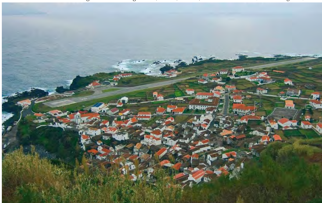
410 View of Corvo village from hill of high fields, Corvo, Azores, 1 November 2006 ( Vincent Legrand )

The primary purpose of this article is to explore that part of the avifauna for which Corvo is most well known – Nearctic vagrants. Recognizing the island's potential for American accidentals, Bannerman & Bannerman (1966) wrote: 'As a haven for vagrants ... [the Azores] must rank very high ... it is on Corvo and Flores that we should expect these overseas wanderers to arrive ... It would be astonishing if Corvo, in time, could not supply an even more interesting list of American migratory species.' It took 39 years for that prediction to be fully realised, when Peter Alfrey set out for Corvo at the height of a multi-decadal cycle of Atlantic storm activity in October 2005. Hoping to see an American landbird or two, he actually found 52 individuals of 17 species (Alfrey 2005). In the five years since that discovery, there have been several interesting developments. First and foremost has been the confirmation that American