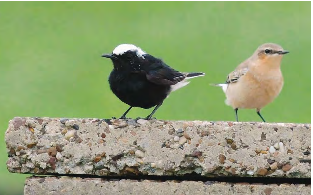
476 White-crowned Wheatear / Witkruintapuit Oenanthe leucopyga (left), with Northern Wheatear / Tapuit O oenanthe , Wremen, Niedersachsen, Germany, 19 September 2010 (Roef Mulder)