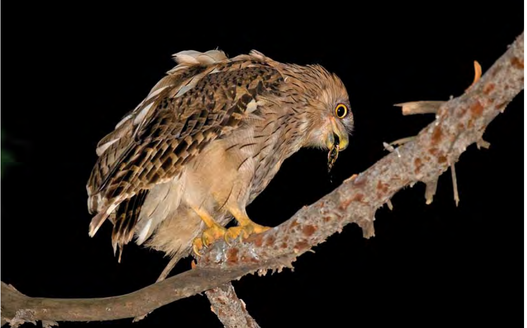
404 Western Brown Fish Owl / Westelijke Bruine Visuil Bubo (zeylonensis) semenowi , adult carrying food for fledgling, Antalya, Turkey, 14 July 2009 (Arnaud B van den Berg/The Sound Approach) 405 Western Brown Fish Owl / Westelijke Bruine Visuil Bubo (zeylonensis) semenowi , fledgling at night near nest site, Antalya, Turkey, 15 July 2009 (Arnaud B van den Berg/The Sound Approach) 406 Western Brown Fish Owl / Westelijke Bruine Visuil Bubo (zeylonensis) semenowi , immature (with a few adult-type barred feathers on underparts) perched in tree at side of river, Antalya, Turkey, 5 August 2009 (Arnaud B van den Berg/The Sound Approach)