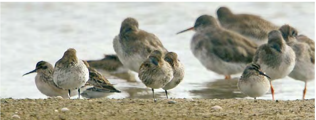
490 Aziatische Goudplevier / Pacific Golden Plover Pluvialis fulva , adult, Ottersaat, Texel, Noord-Holland, 18 augustus 2010 ( Eric Menkveld ) 491 Grijsze Strandloper / Semipalmated Sandpiper Calidris pusilla , met Bonte Strandloper / Dunlin C alpina , 't Vroon, Westkapelle, Zeeland, 23 juli 2010 ( Jaap Denee ) 492 Breedbekstrandloper / Broad-billed Sandpiper Limicola falcinellus , juveniel, Eemshaven-West, Groningen, 24 augustus 2010 ( Martijn Bot ) 493 Breedbekstrandloper / Broad-billed Sandpiper Limicola falcinellus , juveniel, Balgzandpolder, Den Helder, Noord-Holland, 22 augustus 2010 ( Fred Visscher ) 494 Breedbekstrandlopers / Broad-billed Sandpipers Limicola falcinellus , juveniele (twee, links en rechts), Balgzandpolder, Den Helder, Noord-Holland, 25 augustus 2010 ( Jan den Hertog )