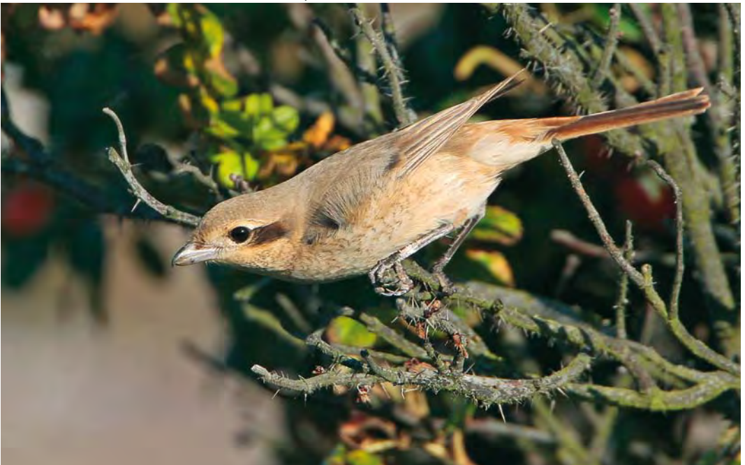
480 Daurian Shrike / Daurische Klauwier Lanius isabellinus , adult female, Den Helder, Noord-Holland, Netherlands, 5 September 2010 ( Martin van der Schalk )