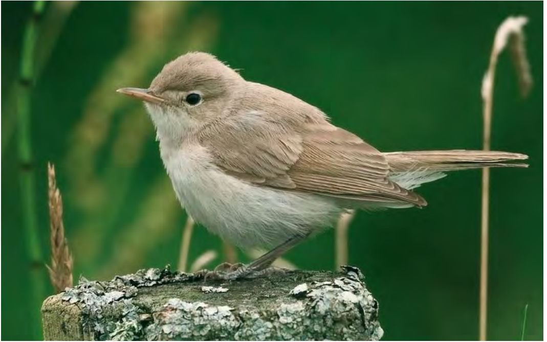
473 Sykes's Warbler / Sykes' Spotvogel Iduna rama , Burrafirth, Unst, Shetland, Scotland, 16 August 2010