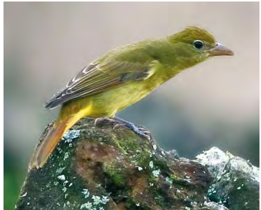
420 Myrtle Warbler / Mirtezanger Dendroica coronata , lighthouse valley, Corvo, Azores, 26 October 2008 (David Monticelli) 421 American Yellow Warbler / Gele Zanger Dendroica petechia , Ribeira da Ponte, Corvo, Azores, 15 October 2009 (Peter Alfrey) 422 Black-throated Blue Warbler / Blauwe Zwartkeelzanger Dendroica caerulescens , Ribeira do Cantinho, Corvo, Azores, 28 October 2006 (Vincent Legrand) 423 Summer Tanager / Zomertangare Piranga rubra , first-winter, middle fields, Corvo, Azores, 28 October 2006 (Vincent Legrand)

rensis , Eurasian Blackcaps Sylvia atricapilla gularis , Common Starlings Sturnus vulgaris granti , House Sparrows Passer domesticus , Azores Chaffinches Fringilla coelebs moreletti , Atlantic Canaries Serinus canaria and smaller numbers of European Goldfinch Carduelis carduelis parva (contra Clarke 2006). There is also a small population of Eurasian Woodcock Scolopax rusticola , mainly in the eastern valleys. Common Snipe Gallinago gallinago breeds in the caldera (or caldeira), from where there is also a breeding record of Northern Wheatear Oenanthe oenanthe (Hering & Hering 2006ab). A regular hybrid flock of Mallard A platyrhynchos and American Black Duck A rubripes commutes between the caldera and the neighbouring island of Flores.