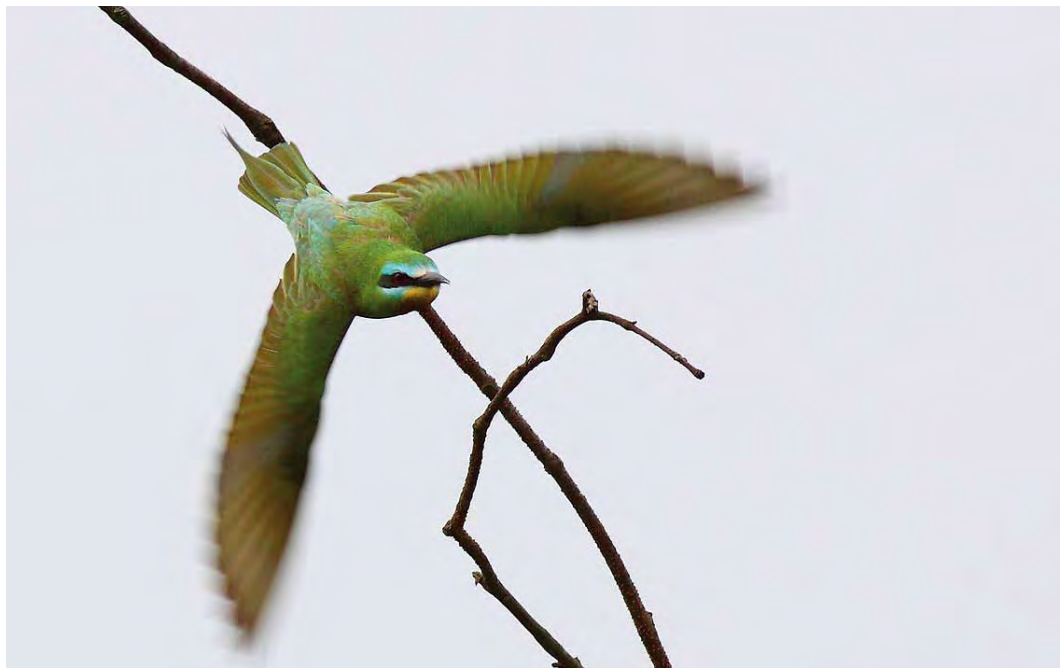
446 Groene Bijeneter / Blue-cheeked Bee-eater Merops persicus , adult, Castricum, Noord-Holland, 16 augustus 2010 (Cock Reijnders)

het voorhoofd (minder en soms ontbrekend bij chrysocercus ). Verschillen in de groentint (meer geelgroen bij chrysocercus ) van bepaalde veerpartijen zijn door effecten van sleet en lichtomstandigheden niet altijd betrouwbaar als veldkenmerk voor ondersoortbepaling (cf Cramp 1988, del Hoyo et al 2001). Overigens staan de verschillen tussen beide taxa niet of nauwelijks vermeld in de meest gangbare veldgidsen (maar zie Heinzel et al 1996, del Hoyo et al 2001).