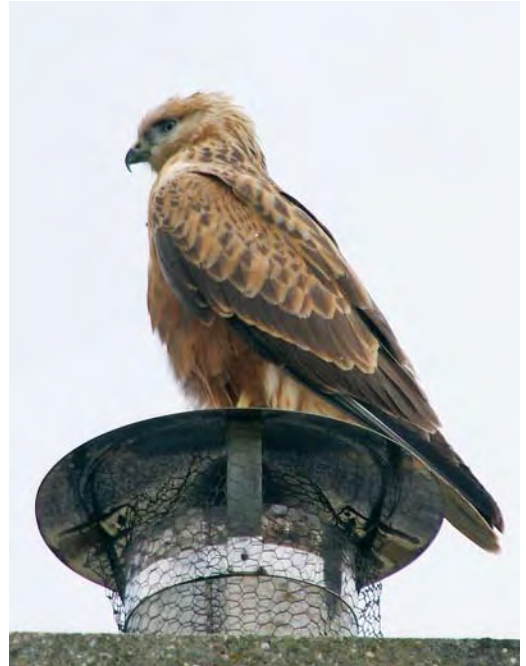
487 Zeearend / White-tailed Eagle Haliaeetus albicilla , Biesbosch, Noord-Brabant, 21 augustus 2010 488-489 Arendbuiserd / Long-legged Buzzard Buteo rufinus , juveniel, De Krim, Texel, Noord-Holland, 13 juli 2010