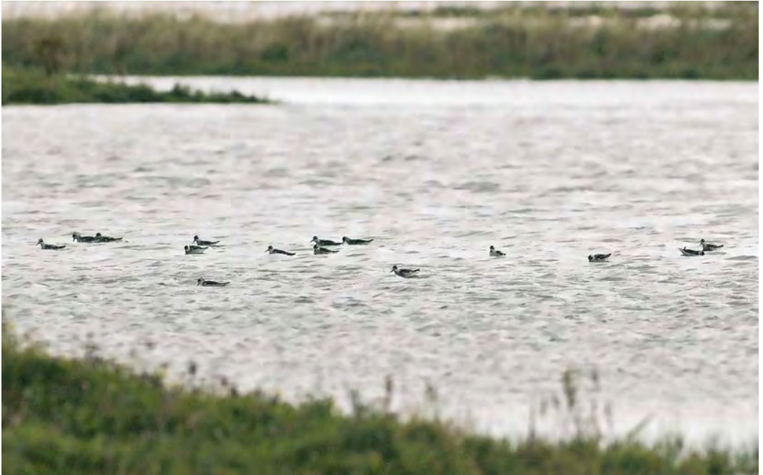
485 Grauwe Franjepoten / Red-necked Phalaropes Phalaropus lobatus , Mariëndal, Den Helder, Noord-Holland, 30 augustus 2010