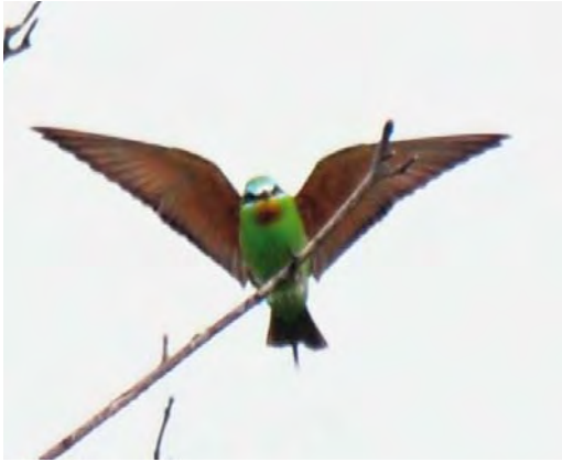
445 Groene Bijeneter / Blue-cheeked Bee-eater Merops persicus , adult, Castricum, Noord-Holland, 16 augustus 2010 (Arnoud B van den Berg)

09:15 tot 09:30 een Groene Bijeneter had gezien bij de Horsmeertjes op Texel, Noord-Holland. Hij maakte een net herkenbaar bewijsplaatje met zijn compactcamera en verliet de plek om een telescoop en betere fotoapparatuur te halen maar na terugkomst was de vogel verdwenen. Hij probeerde zijn collega Jos van den Berg op Texel te bellen maar omdat die in het buitenland verbleef lukte dat niet. Andere pogingen om vogelaars in te lichten werden niet ondernomen. Indien aanvaard mag worden aangenomen dat het dezelfde vogel betrof als bij Castricum.