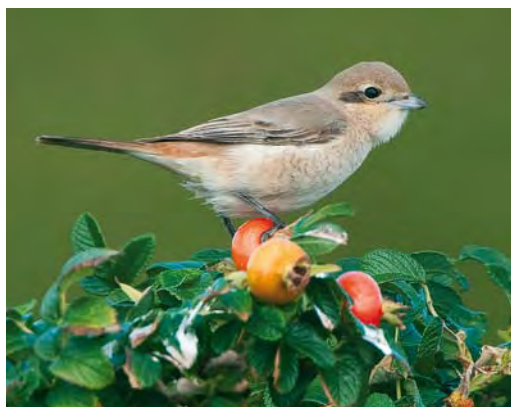
461 Red-footed Booby / Roodvoetgent Sula sula , Estepona, Málaga, Spain, 11 August 2010 462 Red-necked Stint / Roodkeelstrandloper Calidris ruficollis , adult, Grenen, Skagen, Nordjylland, Denmark, 11 August 2010 463 Sharp-tailed Sandpiper / Siberische Strandloper Calidris acuminata , adult, Lugar de Baixo, Madeira, 29 August 2010 464 Little Curlew / Kleine Regenwulp Numenius minutus , Nieuwmunster, West-Vlaanderen, Belgium, 18 September 2010 465 Possible African Cormorant / mogelijke Afrikaanse Aalscholver Phalacrocorax carbo lucidus , juvenile, IJzermonding, West-Vlaanderen, Belgium, 8 August 2010 466 Daurian Shrike / Daurische Klauwier Lanius isabellinus , adult female, Den Helder, Noord-Holland, Netherlands, 5 September 2010