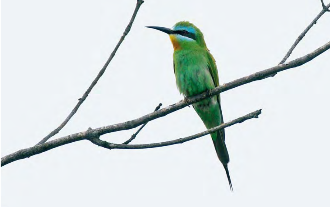
482 Groene Bijeneter / Blue-cheeked Bee-eater Merops persicus , adult, Castricum, Noord-Holland, 16 augustus 2010 (Cees de Vries)