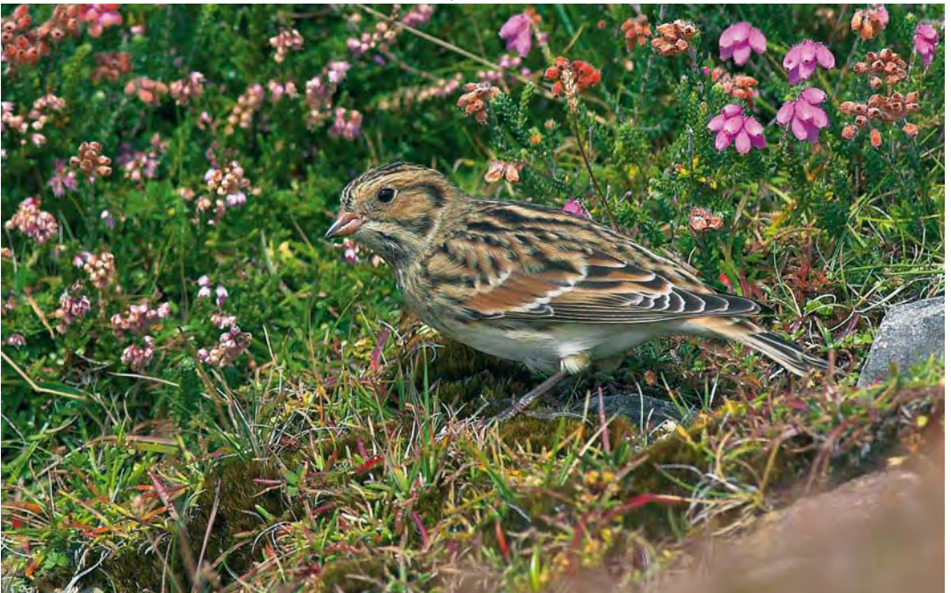
478 Lapland Longspur / Ijsgors Calcarius lapponicus , Inishbofin, Galway, Ireland, 30 August 2010 (Anthony McGeehan)