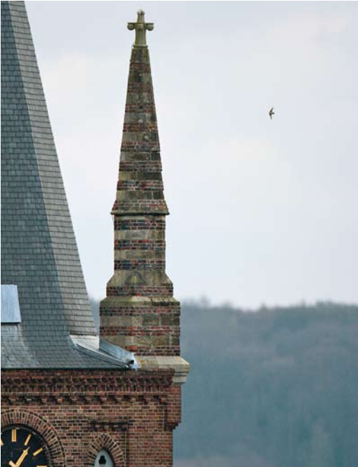
92 Rotszwaluw / Eurasian Crag Martin Ptyonoprogne rupestris , eerstejaars, Maastricht, Limburg, 10 december 2009