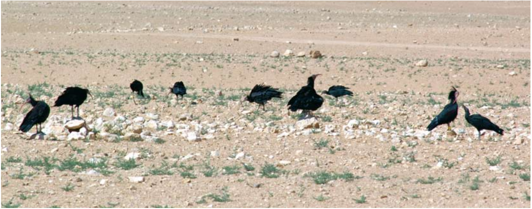
59 Northern Bald Ibises / Kaalkopibissen Geronticus eremita , Palmyra, Syria, March 2008

Middle East? This appears increasingly unlikely. Up to 14 birds were found wintering at Taif in the highlands of Yemen in 1985, which led to speculation about a possible breeding population in south-western Arabia, but numbers dwindled away and there have been no records for at least 15 years. In retrospect, these were probably Syrian birds. A massif in northern Iraq has suitable cliffs; a colony there is a remote possibility. A visit to the desert mountains of central Syria is a sobering experience: some of the precipices still bear the distinctive droppings of extinct colonies and until recently it was possible to find ibis feathers at their base. It appears that colonies containing 100s of pairs survived in the central Syrian desert into the 1980s (Serra et al 2009). Conservationists arrived too late to save them.