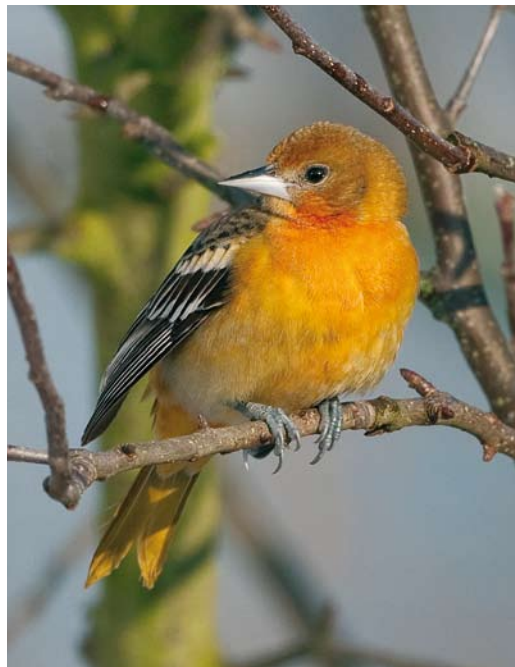
94 Baltimoretroepiaal / Baltimore Oriole Icterus galbula , eerste-winter, Oudorp, Alkmaar, Noord-Holland, 8 januari 2010 (Wilma van Holten) 95-96 Baltimoretroepiaal / Baltimore Oriole Icterus galbula , eerste-winter, Oudorp, Alkmaar, Noord-Holland, 7 januari 2010 (Hans Brinks)