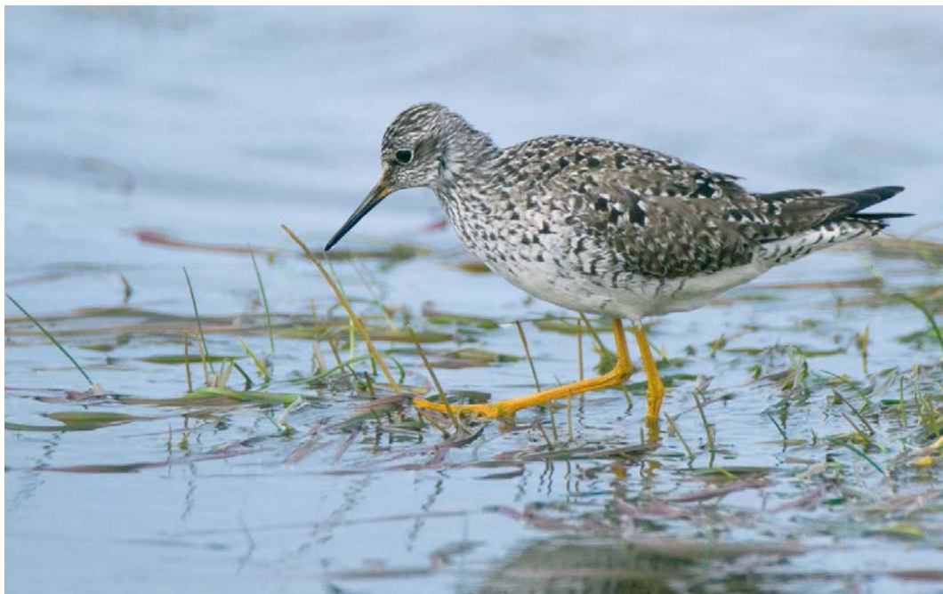
257 Lesser Yellowlegs / Kleine Geelpootruiter Tringa flavipes , Keflavík, Iceland, 18 May 2010