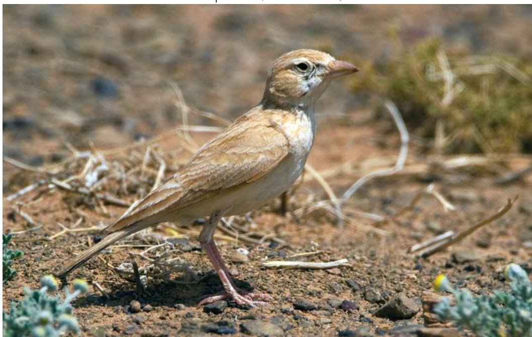
266 African Dunn's Lark / Afrikaanse Dunns Leeuwerik Eremalauda dumni dumni , Merzouga, Tafilalt, Morocco, 11 April 2010 ( Marc Gottenbos )