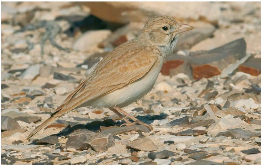
265 Arabian Dunn's Lark / Arabische Dunns Leeuwerik Eremalauda dumni eremodites , Arava valley, Israel, 14 April 2010