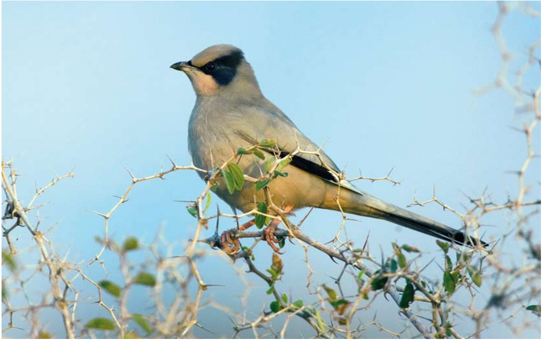
235 Hypocolius / Zijdestaart Hypocolius ampelinus , Mond protected area, Bushehr, Iran, 23 January 2009 236 Iraq Babbler / Iraakse Babbelaar Turdoides altirostris , Horeh Bamdej, Khuzestan, Iran, 17 January 2009 237 Sind Pied Woodpecker / Tamariskspecht Dendrocopos assimilis , Chikalar, Hormuzgan, Iran, 17 January 2009