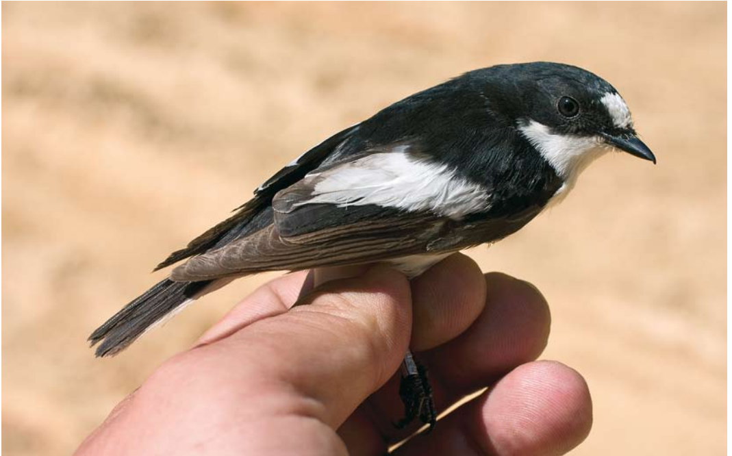
205-206 Iberian Pied Flycatcher / Iberische Vliegenvanger Ficedula hypoleuca iberiae , first-summer male, La Hiruela, Madrid, Spain, 15 May 2007. Two different birds, showing some white in tail. Also note amount of white in tertials, similar to that shown by some adult male Atlas Flycatchers F. speculigera .