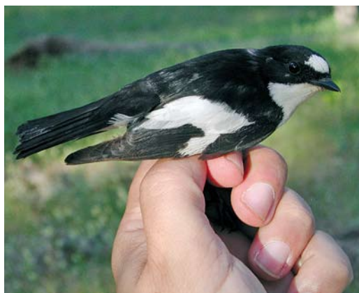
201 Atlas Flycatcher / Atlasvliegenvanger Ficedula speculigera , male, Ifrane, Morocco, 9 June 2009 (José Luis Copete). This could be a first-summer male (p2 is retained) with entirely black tail or an adult with aberrant post-breeding moult. Also note quite extensive white patch on rump. 202 Atlas Flycatcher / Atlasvliegenvanger Ficedula speculigera , adult male, Ifrane, Morocco, 9 June 2009 (José Luis Copete). Other bird than in plate 199. Note rump and entirely black tail. This bird with largest amount of white on rump, with birds in other plates showing common pattern. 203-204 Atlas Flycatcher / Atlasvliegenvanger Ficedula speculigera , adult male, Ifrane, Morocco, 9 June 2009 (José Luis Copete). Same bird as in plate 200. Rump patch showing common pattern.

picted in that black-and-white plate, and another adult male (plate 201) with a quite extensive white patch. However, we feel that this is not the norm for speculigera , since the rest of the examined males were all showing very small or almost non-existent white rump patches. This was confirmed by close observations of 30+ individuals in the field.