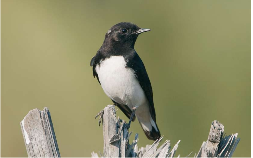
242 Variable Wheatear / Picatatapuit Oenanthe picata , between Bandar Abbas and Minab, Hormuzgan, Iran, 26 January 2009 (Arie Ouwerkerk)