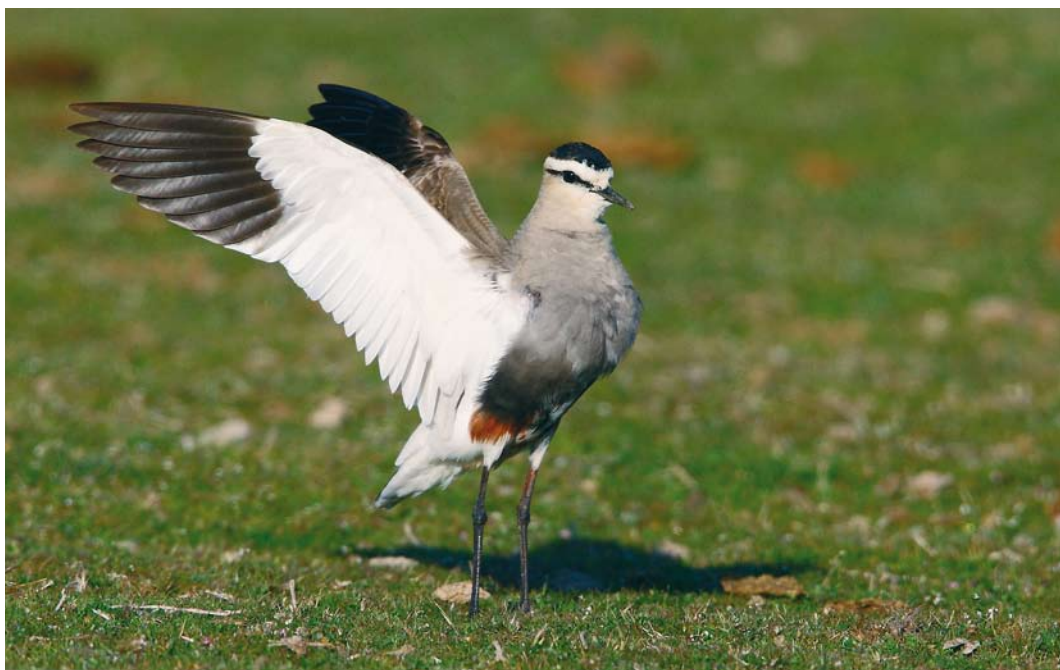
258 Sociable Lapwing / Steppekievit Vanellus gregarius , Valladolid, Castilla y León, Spain, 10 April 2010 (Juan Sagardía)