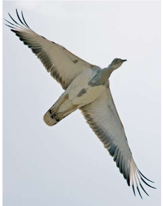
227 Masked Booby / Maskergent Sula dactylatra , Khoor-e Chal, Hormuzgan, Iran, 15 January 2009 228 Macqueen's Bustard / Oostelijke Kraagtrap Chlamydotis macqueenii , Mond protected area, Bushehr, Iran, 20 January 2009 229 Crested Honey Buzzard / Aziatische Wespindief Pernis ptilorhyncus , adult male, Bandzark, Hormuzgan, Iran, 24 January 2009