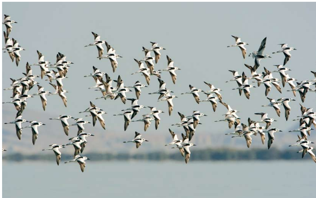
220 Crab Plovers / Krabplevieren Dromas ardeola , Hara protected area, Hormuzgan, Iran, 16 January 2009 (Arie Ouwerkerk)