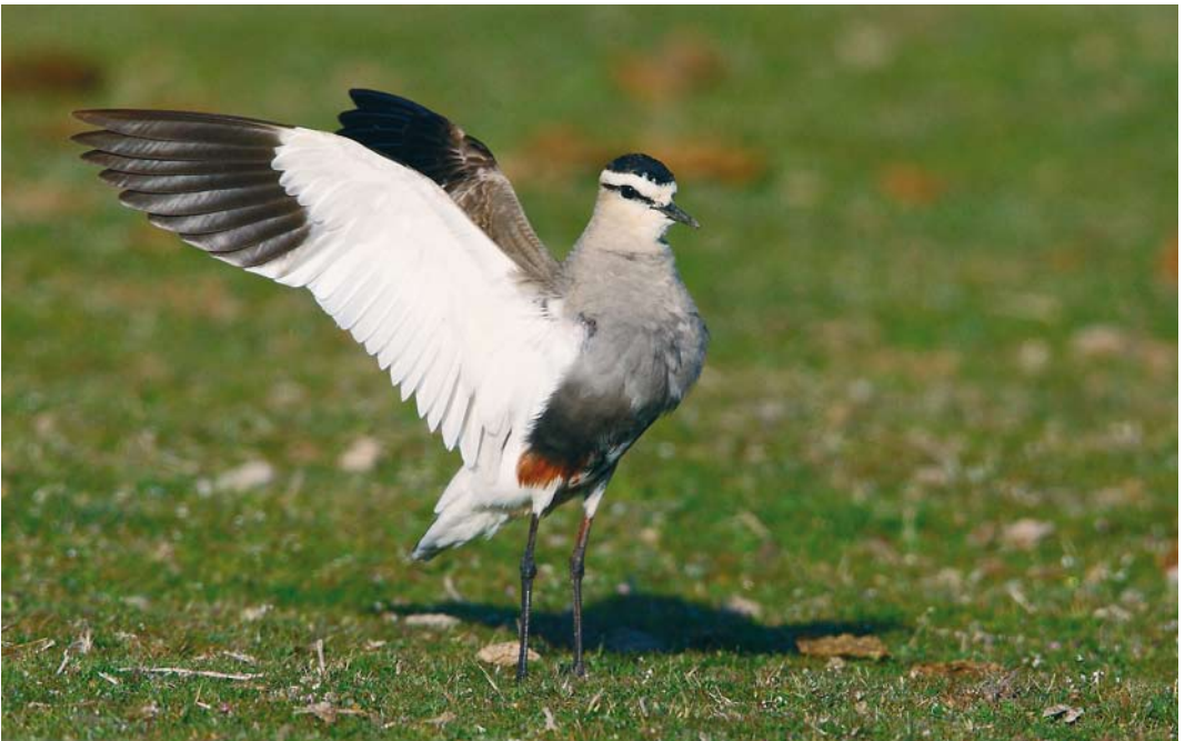
258 Sociable Lapwing / Steppekievit Vanellus gregarius , Valladolid, Castilla y León, Spain, 10 April 2010