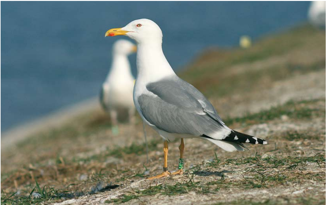
213-215 Hybrid Caspian x Herring Gull / hybride Pontische Meeuw x Zilvermeeuw Larus cachinnans x argentatus , fifth-calendar year, Włocławek reservoir, central Poland, April 2009 (Grzegorz Neubauer). Offspring of male cachinnans and female yellow-legged argentatus , ringed as chick in the nest at Włocławek reservoir (central Poland) in May 2005 and found breeding in same colony in 2009. Note non-spotted iris, intense coloration of bare parts and large amount of black on wing-tip (including seven black-tipped primaries and patterns of both p9 and p10), creating appearance strongly resembling Yellow-legged Gull L. michahellis . Such hybrids are impossible to separate from pure michahellis based on phenotype alone.