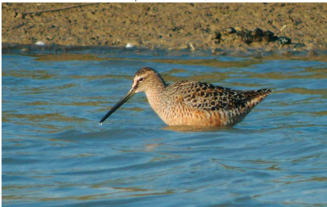
299 Grote Griuze Snip / Long-billed Dowitcher Limnodromus scolopaceus , Lingewal, Huissen, Gelderland, 26 april 2010 (Erik de Waard)