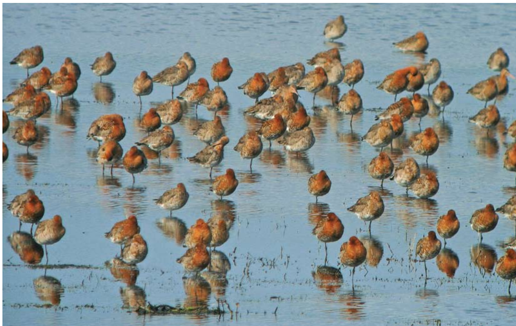
298 IJslandse Grutto's / Icelandic Black-tailed Godwits Limosa limosa islandica , Landje van Geijssel, Ouderkerk aan de Amstel, Noord-Holland, 3 april 2010 (Enno B Ebels)