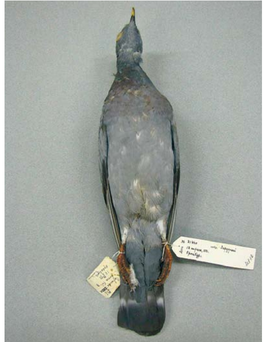
248-249 Yellow-eyed Dove / Oosterse Holenduif Columba eversmanni , adult (collected at Orenburg, European Russia, on 12 May 1881), Zoological Museum, St Petersburg, Russia, October 2009 (Vladimir Loskot)

WP) on 18 October 1998, supporting its vagrancy potential in the south-eastern part of the WP (Davygora 2000, AV Davygora in litt).