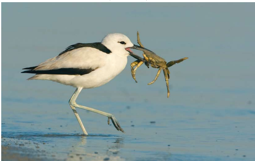
221 Crab Plover / Krabplevier Dromas ardeola , adult, Hara protected area, Hormuzgan, Iran, 17 January 2009