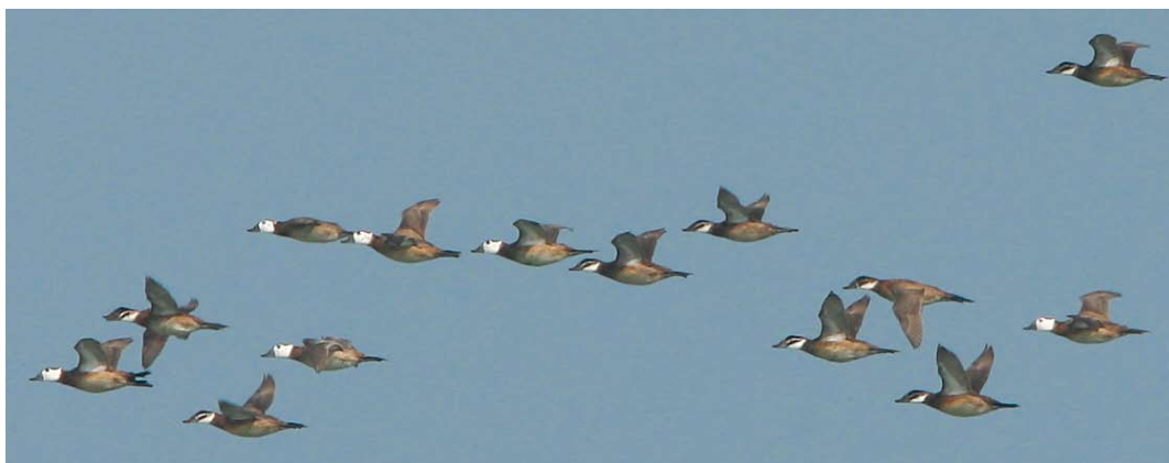
230 Amur Falcon / Amoerroodpootvalk Falco amurensis , first-winter, 15 km east of Chabahar Sistan Baluchestan, Iran, 24 January 2009 (Maarten Pieter Lantsheer) 231 Eastern Rock Nuthatch / Grote Rotsklever Sitta tephronota tephronota , Alneh valley, Golestan, Iran, 22 January 2009 (Edwin Winkel) 232 Eurasian Eagle-Owl / Oehoe Bubo bubo , Gomishan, Golestan, Iran, 19 January 2009 (Edwin Winkel) 233 Black-throated Loon / Parelduiker Gavia arctica , Jask, Hormuzgan, Iran, 19 January 2009 (Mark Zekhuis) 234 White-headed Ducks / Witkopeenden Oxyura leucocephala , Gorgan bay, Mazandaran, Iran, 20 January 2009 (Mervyn Roos)