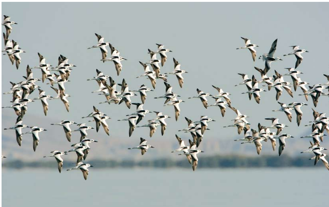
220 Crab Plovers / Krabplevieren Dromas ardeola , Hara protected area, Hormuzgan, Iran, 16 January 2009 (Arie Ouwerkerk)