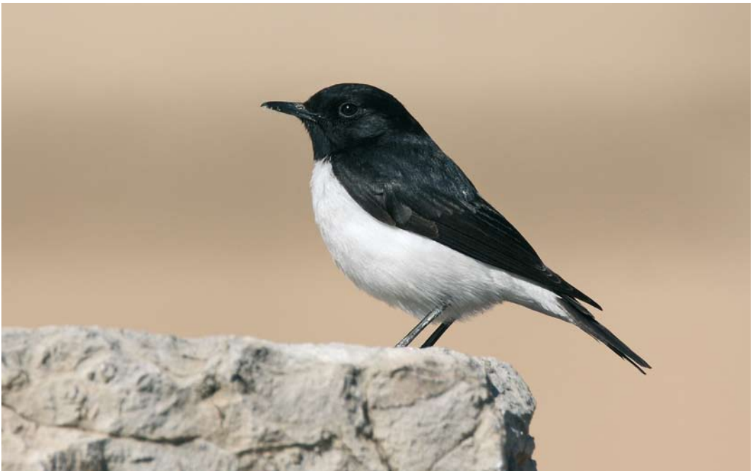
243 Hume's Wheatear / Humes Tapuit Oenanthe albonigra , Persepolis, Fars, Iran, 9 January 2009