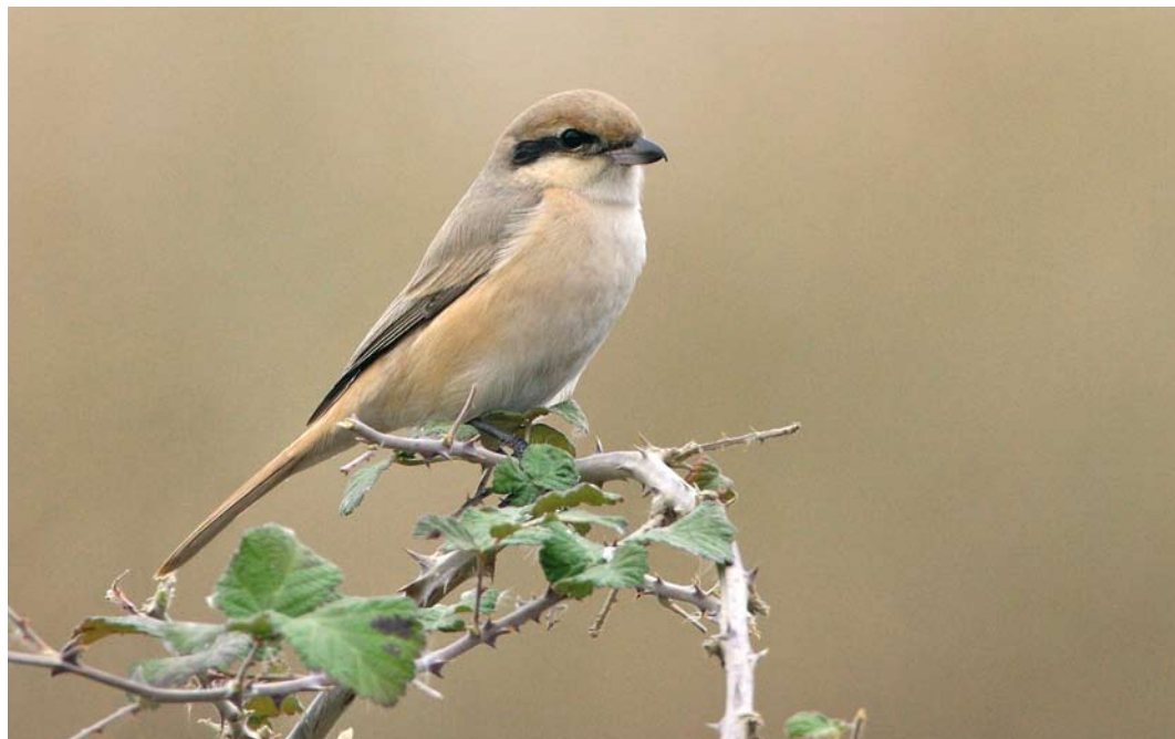
240 Chinese Shrike / Chinese Klauwier Lanius arenarius , Bibi Shirvan, Golestan, Iran, 19 January 2009