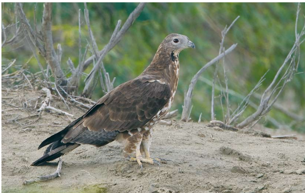
229 Crested Honey Buzzard / Aziatische Wespendiff Pernis ptilorhyncus , adult male, Bandzark, Hormuzgan, Iran, 24 January 2009 (Arie Ouwerkerk)