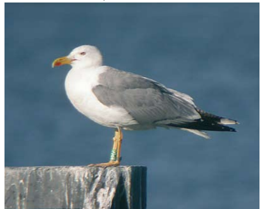
218 Yellow-legged Gull / Geelpootmeeuw Larus michahellis , adult male, Jankowice, southern Poland, July 2006. This bird was paired with a female Caspian Gull L. cachinnans .

Identification of michahellis in central Europe seems far more difficult than in the west due to a relatively larger proportion of hybrids compared to the 'real thing'. Its separation from yellow-legged argentatus is fairly easy when based on measurements but when using a near-diagnostic combination of the length of black markings on p7 and p8, a few individuals overlap and are better left unidentified. Separation of michahellis from