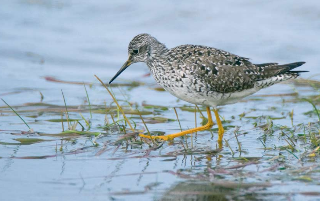
257 Lesser Yellowlegs / Kleine Geelpootruiter Tringa flavipes , Keflavík, Iceland, 18 May 2010