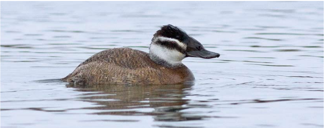
185 Witkopeenden / White-headed Ducks Oxyura leucocephala (links), met Rosse Stekelstaart / Ruddy Duck O. jamaicensis , Starrevaart, Leidschendam, Zuid-Holland, 28 februari 2010 ( Sjaak Schilperoort ) 186 Kleine Burgemeester / Iceland Gull Larus glaucooides , eerste-winter, Amsterdam, Noord-Holland, 8 februari 2010 ( Jurriën van Deijk ) 187 Witkopeend / White-headed Duck Oxyura leucocephala , Zevenhuizerplas, Zuid-Holland, 14 februari 2010 ( Carry Bakker )

natie niet onomstreden. Het hoogste aantal Dwergganzen A erythropus bedroeg 55 op 4 februari bij Strijen, Zuid-Holland. Op een 10-tal plekken buiten de reguliere overwinteringsgebieden doken eveneens exemplaren op. Er waren meldingen van Hutchins' Canadese Ganzen Branta hutchinsii hutchinsii op 17 en 18 januari in de omgeving van Leimuiden, Zuid-Holland, en op 14 februari bij Hoofdplaat, Zeeland (twee). De 77 721 Brandganzen B leucopsis die op 30 januari over de Dordtse Biesbosch, Zuid-Holland, vlogen betekenden een landelijk dagrecord voor een trektelpost. In alle provincies behalve Drenthe doken Roodhalsganzen B ruficollis op. Daarmee was de soort deze winter goed vertegenwoordigd. Maar liefst zeven werden er op 24 februari geteld bij Echteld, Gelderland, waar een dag eerder al vijf vogels verbleven (mogelijk hetzelfde groepje van vijf dat eind 2009 in Friesland werd gezien). Hoge aantallen Witbuirokrotganzen B hrota bereikten ons land deze win-