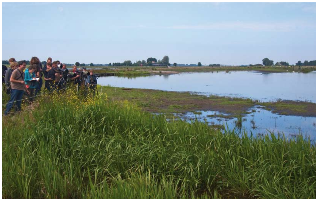
141 Biotop van Kleinst Waterhoen Porzana pusilla , Groene Jonker, Zevenhoven, Zuid-Holland, 13 juni 2010

In de avond van 27 mei 2009 hoorde Felix Verschoor rond 22:30 een Kleinst Waterhoen roepen aan de zuidoostkant van het nieuwe waterrijke natuurontwikkelingsgebied De Groene Jonker. De dagen erna werd het gebied door veel vogelaars bezocht maar vervolgwaarnemingen bleven uit. In de middag van 8 juni fotografeerde Kees Janmaat twee exemplaren in de zuidwesthoek van het gebied. Later op de dag plaatste hij een aantal foto's op www.waarneming.nl . Na overleg met de terreinbeheerder van Natuurmonumenten werd de precieze locatie bekend gemaakt. In de hoop op een zichtwaarneming kwamen die avond veel vogelaars naar het gebied. De vogels werden die avond echter alleen