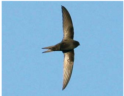
134 Common Swift / Gierzwaluw Apus apus apus , Backworth, Northumberland, England, 4 August 2008 ( Ross Ahmed ). Note dark head without obvious eye-mask and only small throat patch sharply set off from rest of head. This bird is an example of an adult that has started its primary moult near the breeding grounds. 135 Pallid Swift / Vale Gierzwaluw Apus pallidus , South Gare, Cleveland, England, 2 November 2005 ( Ian Boustead ). Head looking paler brown than body, with blackish eye-mask. In upperwing of some pallidus , all greater primary coverts appear distinctly paler than outer primaries, as is the case here. This is not usually shown by apus but see the pekinensis in plate 132. 136 Asian Common Swift / Aziatische Gierzwaluw Apus apus pekinensis , Koko Nor (now known as Qinghai lake), Qinghai province, China, 27 May 2008 ( Paul French ). Head looking essentially dark, like body. 137 Common Swift / Gierzwaluw Apus apus apus , Selby, North Yorkshire, England, 15 July 2008 ( Ross Ahmed ). Non-juvenile bird. In addition to blackish plumage, note dark head and scaling of undertail-coverts more prominent than on belly/flanks.

to put more emphasis on a few other characters that may be less dependent on light conditions (cf Chantler 1990, Chantler & Driessens 2000, van Duivendijk 2008). These may be helpful when dealing with the large colour variation in swifts (as described above). They are: 1 general shape; 2 head pattern; 3 pattern of scaling on underparts; and 4 features in under- and upperwing.