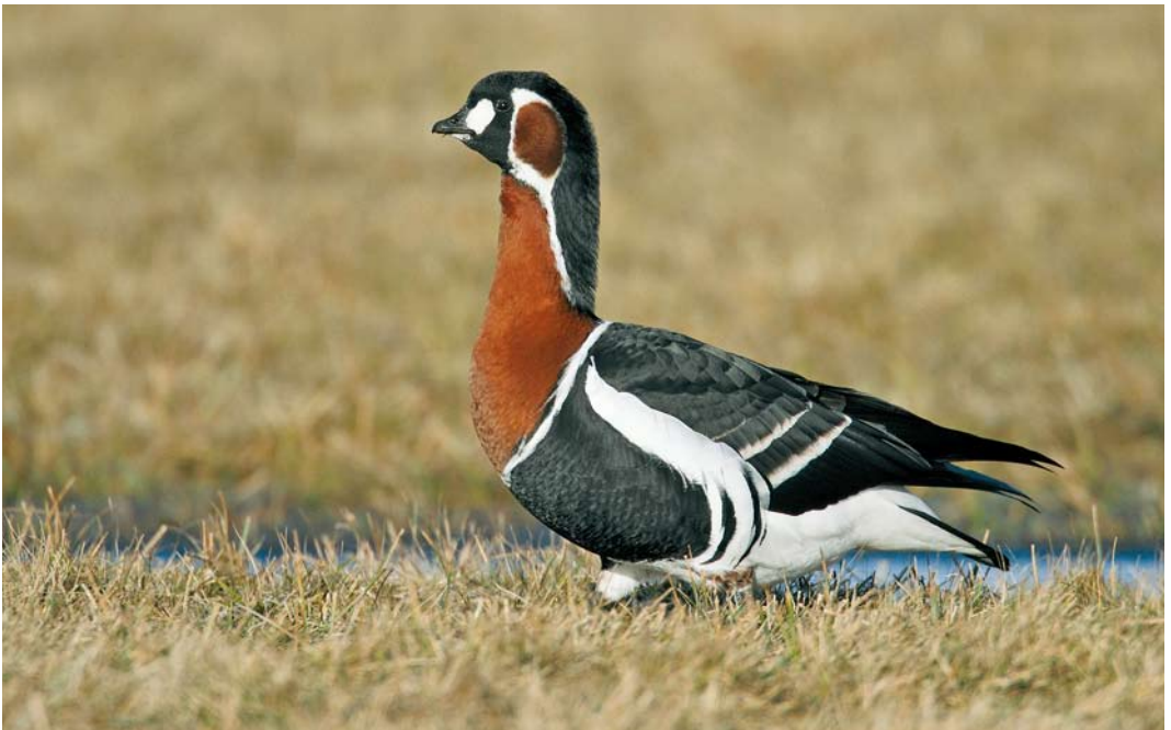
184 Roodhalsgans / Red-breasted Goose Branta ruficollis , adult, Lauwersmeer, Friesland, 5 maart 2010 (Mark Schuurman)