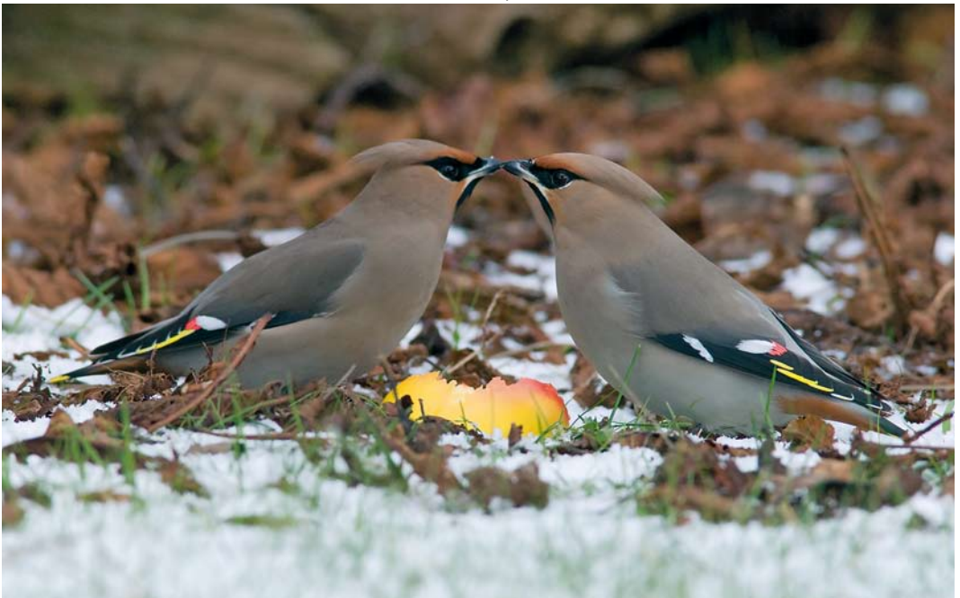
193 Pestvogels / Bohemian Waxwings Bombycilla garrulus , De Cocksdorp, Texel, Noord-Holland, 11 februari 2010