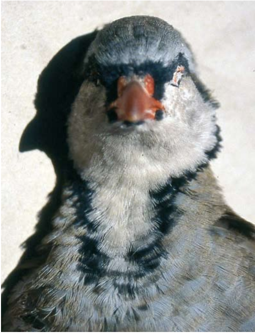
116 Sicilian Rock Partridge / Siciliaanse Steenpatrijs Alectoris (graeca) whitakeri , collected at Malvagna, Sicily, Italy, late autumn ( Angelo Scuderi ). Same specimen as in plate 112-115.