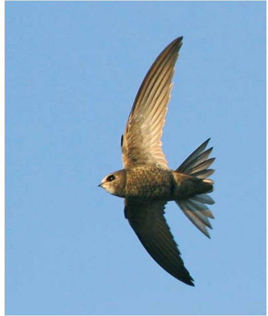
126 Common Swift / Gierzwaluw Apus apus apus , Selby, North Yorkshire, England, 15 July 2008. Same bird as in plate 124. Note essentially dark head, with limited white throat patch (not reaching past eye).