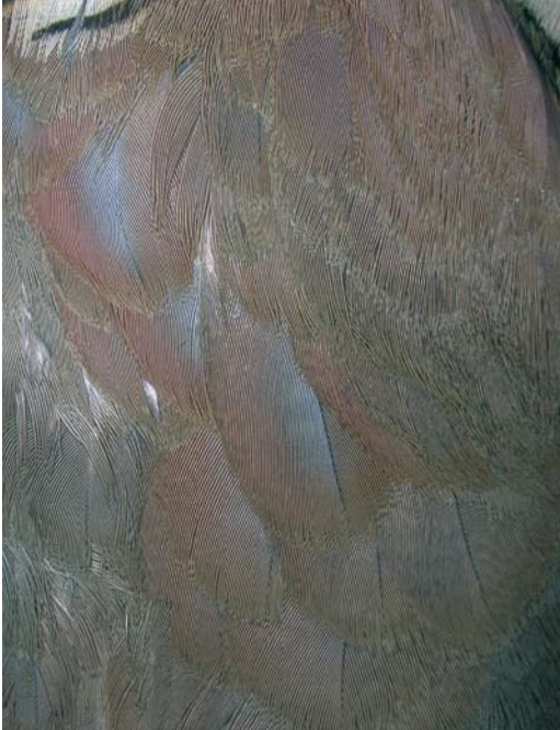
120 Details of scapulars and mantle side of Sicilian Rock Partridge / Siciliaanse Steenpatrijs Alectoris (graeca) whittakeri , collected at Monte Etna, Sicily, Italy (Andrea Corso). Note intense vinaceous tinge and cerulean centre of some feathers.