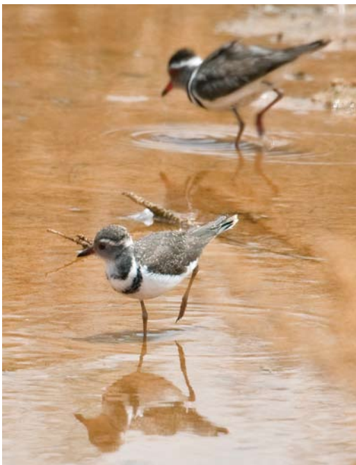
160 Three-banded Plovers / Driebandplevieren Charadrius tricollaris , juvenile and adult, Tut Amon, Aswan, Egypt, 30 April 2009

and two recently fledged juveniles) actively foraging on the mudflat. We immediately started to take photographs but were rapidly interrupted by military guards requesting us to leave the area. In fact, we later learnt that the fishponds are situated within the highly protected area of the Aswan High Dam and that access is not permitted for civilians (and apparently with no possibility to obtain any kind of entry permit); obviously, the guard at the entrance had mistakenly opened the gate! Because of the fact that the juveniles had recently fledged (based on their very fresh plumage) and that the pair had been present since 2007, it is safe to conclude that the pair had bred locally and to exclude the possibility that this or another pair had bred further south and moved northward with their young in post-breeding dispersal.