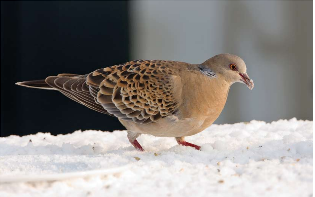
178 Western Oriental Turtle Dove / Westelijke Oosterse Tortel Streptopelia orientalis meena , adult, Wergea, Friesland, Netherlands, 25 January 2010