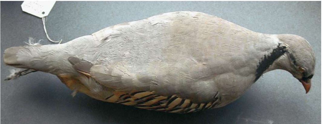
107 Italian Rock Partridge / Italiaanse Steenpatrijs Alectoris graeca orlandoi (collected in Monti Appennini, Italy), Arrigoni degli Oddi collection, Museo di Scienze Naturali di Roma, Roma, Italy ( Andrea Corso ). Note paleness, this bird being duller and less cerulean than some others. Note paler rump and uppertail-coverts, contrasting with shade duller, more olive-tinged mantle.

when still two to three juvenile primaries are retained (Priolo 1984; pers obs on 37 specimens and a few wild birds)