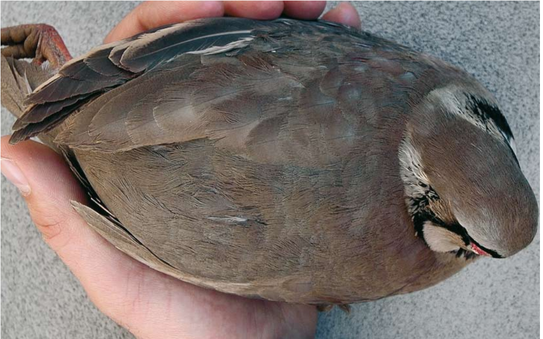
104 Sicilian Rock Partridge / Siciliaanse Steenpatrijs Alectoris (graeca) whittakeri , collected at Monti Nebrodi, Sicily, Italy ( Andrea Corso ). Note typical colour of fresh whittakeri , with intense olive tinge over mantle, rump and uppertail, being most intense and warmest of all Rock Partridge taxa. Also, note obvious ear-coverts stripe.