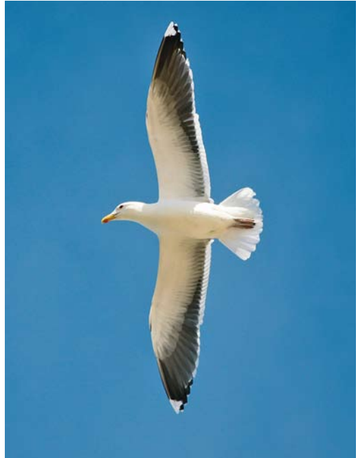
173 Lappet-faced Vulture / Oorgier Torgos tracheliotus , Shalatin, Egypt, 3 March 2010 174 Cape Gull / Afrikaanse Kelpmeeuw Larus dominicanus vetula , adult, Khnifiss lagoon, Western Sahara, Morocco, 8 March 2010 175 Spoon-billed Sandpiper / Lepelbekstrandloper Eurynorhynchus pygmeus , Pak Thale, Thailand, 12 January 2010