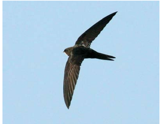
122 Common Swift / Gierzwaluw Apus apus apus , Selby, North Yorkshire, England, 12 July 2008 (Ross Ahmed). Worn, non-juvenile bird. Note that small white throat patch does not reach past eye and is sharply set off from dark head. 123 Asian Common Swift / Aziatische Gierzwaluw Apus apus pekinensis , Koko Nor (now known as Qinghai lake), Qinghai province, China, 27 May 2008 (Paul French). Note dark head without obvious eye-mask. 124 Common Swift / Gierzwaluw Apus apus apus , Selby, North Yorkshire, England, 15 July 2008 (Ross Ahmed). Non-juvenile bird with full crop. 125 Common Swift / Gierzwaluw Apus apus apus , Selby, North Yorkshire, England, 15 July 2008 (Ross Ahmed). Non-juvenile bird. Note dark head without obvious eye-mask; pale throat is sharply set off from rest of head and forehead is dark.

plumage or abrasion that could be used to separate adults from first-years, so all birds caught were classed as adults. Studies on known first-year swifts will be important to establish criteria for identification of this age group. Currently, however, there are no variations in appearance that can be attributed to differences in age.