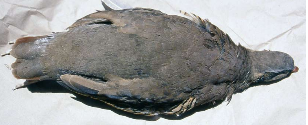
106 Sicilian Rock Partridge / Siciliaanse Steenpatrijs Alectoris (graeca) whitakeri , collected at Malvagna, Nebrodi, Sicily, Italy ( Angelo Scuderi ). Even more uniform bird than in plate 104, showing homogenous upperparts of whitakeri .