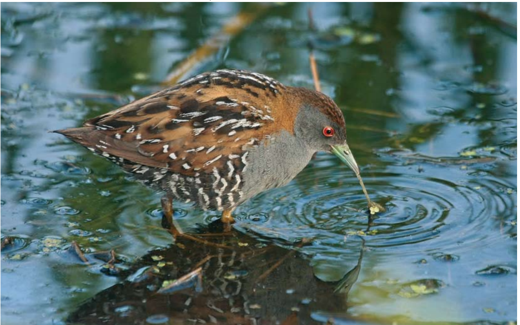
148 Kleinst Waterhoen / Baillon's Crake Porzana pusilla , mannetje, Groene Jonker, Zevenhoven, Zuid-Holland, 13 juni 2009