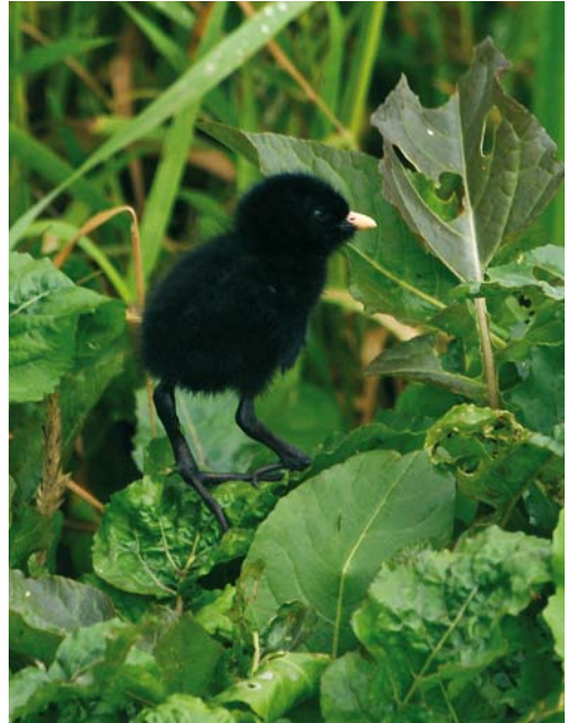
152 Kleinst Waterhoen / Baillon's Crake Porzana pusilla , kuiken, Groene Jonker, Zevenhoven, Zuid-Holland, 19 juli 2009 (Jan den Hertog)

paring en het feit dat de ene vogel veelvuldig riep en de andere niet.