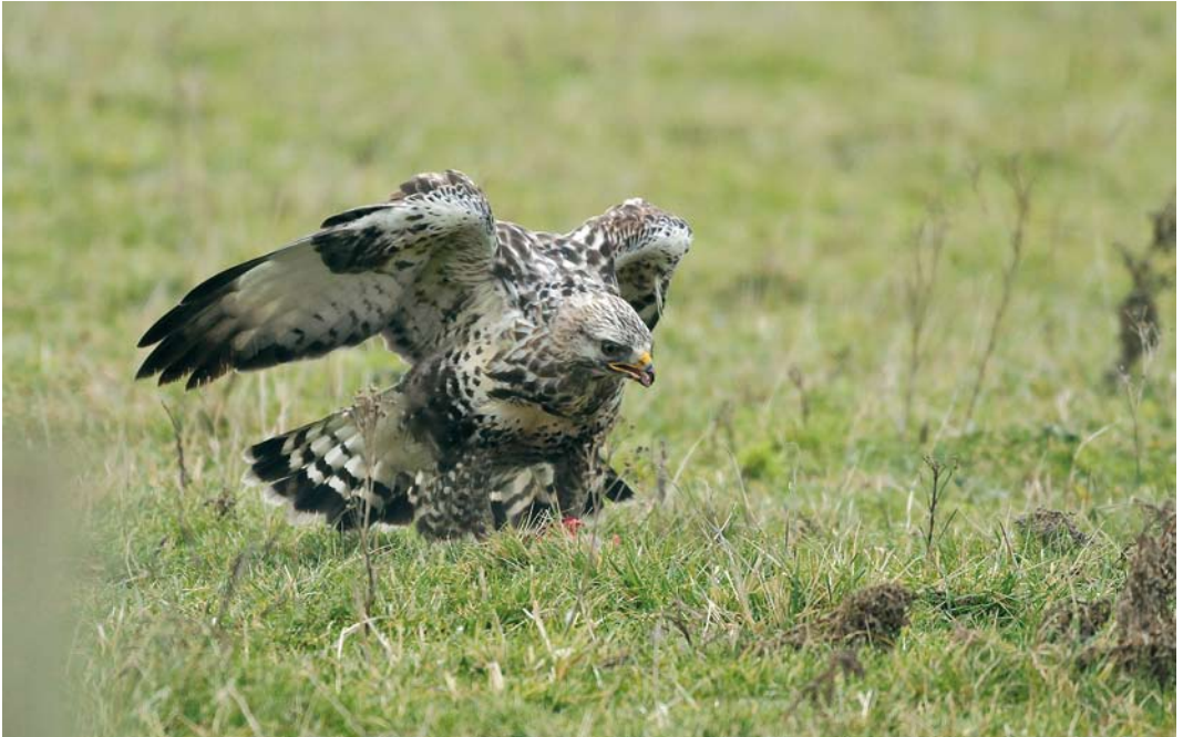
192 Ruigpootbuiserd / Rough-legged Buzzard Buteo lagopus , Cadzand, Zeeland, 21 januari 2010