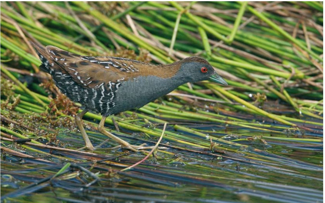
144 Kleinst Waterhoen / Baillon's Crake Porzana pusilla , mannetje, Groene Jonker, Zevenhoven, Zuid-Holland, 20 juni 2009 ( Jaap Denee )