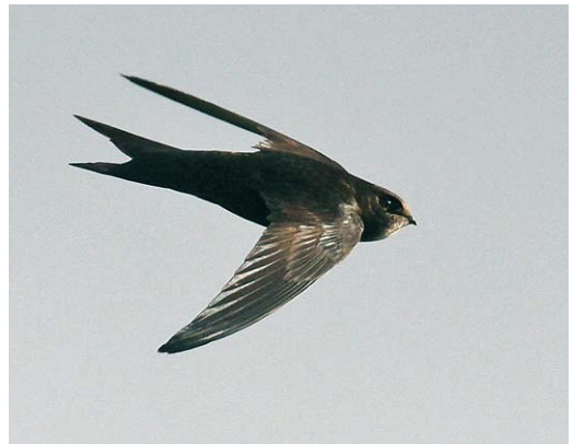
130-131 Asian Common Swift / Aziatische Gierzwaluw Apus apus pekinensis , Koko Nor (now known as Qinghai lake), Qinghai province, China, 27 May 2008 (Paul French). Note dark head without obvious eye-mask, and scaling of undertail-coverts more prominent than on belly/flanks. 132 Asian Common Swift / Aziatische Gierzwaluw Apus apus pekinensis , Koko Nor (now known as Qinghai lake), Qinghai province, China, 27 May 2008 (Paul French). In this photograph, probably not safely told from Pallid Swift A pallidus except perhaps for slimmer, more elongated tail and rump. Brief views of pekinensis may strongly suggest pallidus ! 133 Common Swift / Gierzwaluw Apus apus apus , Selby, North Yorkshire, England, 15 July 2008 (Ross Ahmed). Non-juvenile bird. Note dark head, with limited pale throat patch not reaching past eye.

different feathers tracts in any individual swift should also be described in relative terms; for example, 'the greater primary coverts were usually paler than the outer primaries'. The use of technology such as photographic editing software may be of use in comparing coloration in swifts. Such software is capable of numbering colours in, for example, the form of RGB values and thus removing the problem of ambiguity of colour names. Although there are a number of limitations, this may allow comparisons of RGB values within and between photographs, and could therefore provide a useful tool to aid identification; research is currently being undertaken in this area (Antero Lindholm in litt). It is also clear that the coloration