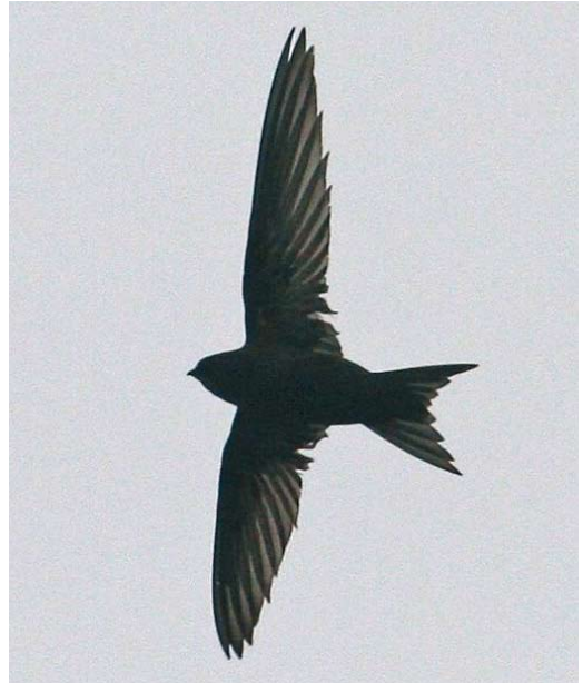
128 Pallid Swift / Vale Gierzwaluw Apus pallidus , Marrakech, Morocco, 3 April 2007 (Stef McElwee). Pale head with contrasting, blackish eye-mask and dark scaling of belly/flanks more prominent than on undertail-coverts instantly separate this bird from Common Swift A. apus . Note also rather pale median coverts. 129 Common Swift / Gierzwaluw Apus apus apus , Selby, North Yorkshire, England, 5 August 2008 (Ross Ahmed)

bird there is at least a degree of consistency in its appearance (and apparent hues), as it is in relatively constant light conditions (balance of light and shade) for comparatively long periods of time, this is not the case with swifts. As they are such aerial and fast-flying birds, they interact with the light in a more dynamic, ever-changing way. Photographs capture a bird in an instant in time. They show how the bird appears in that instant, as it 'interacts' with the light conditions prevailing at that precise moment. In that instant, it is very possible that various feather tracts will catch the light, causing all taxa to appear very similar. Over a more extended period of observation, the light will interplay with the plumage in a more varied way. This point illustrates that a bird must be watched carefully over a reasonable period, so that the true 'colour balance' can be better evaluated and that temporary 'artefacts' can be eliminated. Similarly, single photographs can easily give a false impression, and to be totally convincing, a series of images is required which all show a consistent appearance. At least however in swifts, the shadows created by for example leaves and buildings, which affect many species of birds, are less of an issue. In the nominate apus in plate 124 & 126, much of the scaled effect and brown