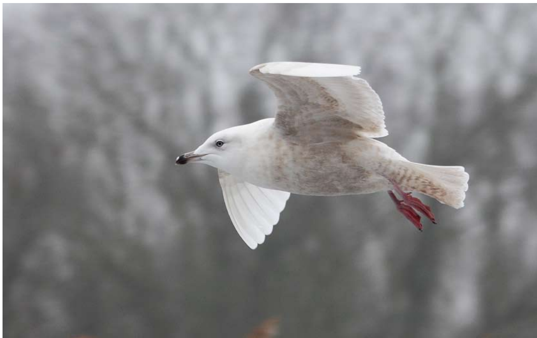
189 Kleine Burgemeester / Iceland Gull Larus glaucoides , tweede-winter, Den Helder, Noord-Holland, 21 februari 2010 (Bob Woets) 190 Noordse Stormvogel / Northern Fulmar Fulmarus glacialis , donkere vorm, Bruine Bank, Noordzee, Continentaal Plat, 27 januari 2010 (Hans Verdaat) 191 Grote Burgemeester / Glaucous Gull Larus hyperboreus , eerste-winter, Lauwersoog, Groningen, 17 januari 2010 (Roef Mulder)