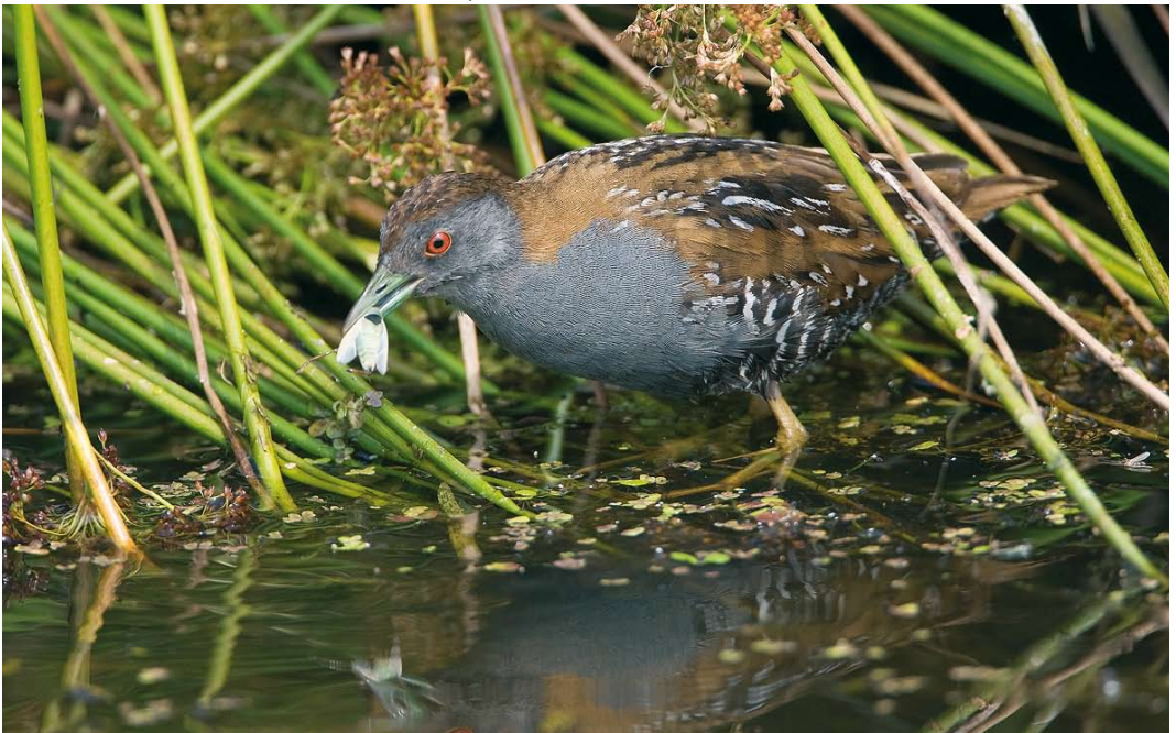
146 Kleinst Waterhoen / Baillon's Crake Porzana pusilla , mannetje, Groene Jonker, Zevenhoven, Zuid-Holland, 25 juni 2009 ( Roland Jansen )