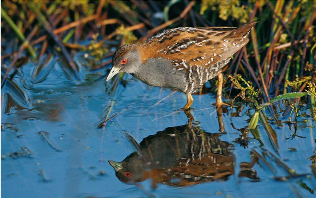
142 Kleinst Waterhoen / Baillon's Crake Porzana pusilla , mannetje, Groene Jonker, Zevenhoven, Zuid-Holland, 13 juni 2009

gehoord. De volgende dag hadden geïnteresseerden meer geluk; al vanaf de ochtendschemering lieten beide vogels zich goed zien. Gedurende de hele dag was het een komen en gaan van vele 10-tallen vogelaars. Na 9 juni werden ze in deze hoek niet meer gehoord of gezien. Diezelfde avond (9 juni) ontdekte Kees de Vries rond 21:00 een derde exemplaar in het gebied. Deze riep veelvuldig vanuit een smalle pitrusrand vlak langs het pad, tegenover de dierenbegraafplaats aan de Hogedijk. Ook deze vogel liet zich die avond en in de hierop volgende dagen zeer fraai en vaak van korte afstand bekijken, fotograferen en op video vastleggen (cf Plomp et al 2010). In de eerste dagen verplaatste hij zich soms over een afstand van 10-tallen meters maar later werd hij vaak op één plek gezien. Hij werd vanaf 12 juni vergezeld door een tweede vogel die 's ochtends vroeg was ontdekt door Phil Koken. Op 13 juni en de dagen erna werd van deze vogels meerdere keren paring en voedseloverdracht waargenomen. Ze waren vaak open en bloot foeragerend op een klein slikrandje te zien. Het paar trok 100en belangstellenden uit binnen- en buitenland. De soortdeterminatie was vanwege de goede waarnemingsomstandigheden eenvoudig; het zeer kleine formaat