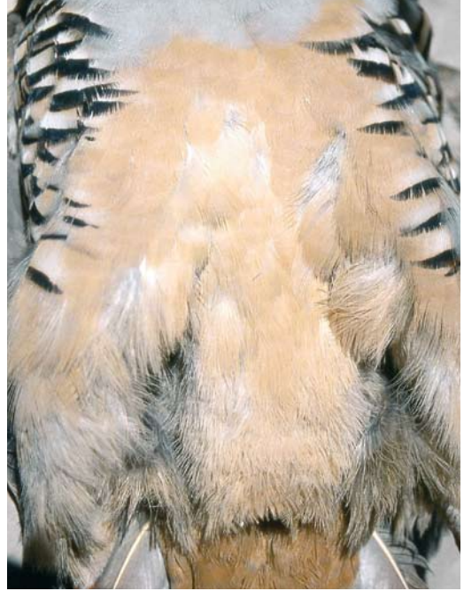
119 Sicilian Rock Partridge / Siciliaanse Steenpatrijs Alectoris (graeca) whitakeri , collected at Monti Nebrodi, Sicily, Italy (Angelo Scuderi). Note richly coloured underparts with intense creamy coloration, especially very saturated and deeply coloured undertail-coverts.

other tail-feathers. Nominate graeca shows more often mottling on t1, rarely with barely visible vermiculations also on the uppertail-coverts (three birds out of 40). However, contrary to previous literature that mainly refers to the central pair (t1) and the uppertail-coverts, the truly typical whitakeri character are the dark vermiculations on the base of the complete tail (figure 4), which, during the present study, was not found as conspicuously in any individual of the other taxa.