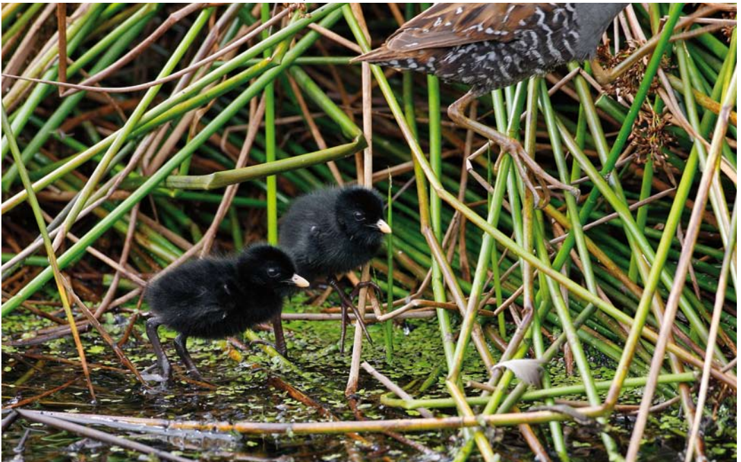
150 Kleinst Waterhoen / Baillon's Crake Porzana pusilla , kuikens en adult, Groene Jonker, Zevenhoven, Zuid-Holland, 18 juli 2009 ( Martin van der Schalk )