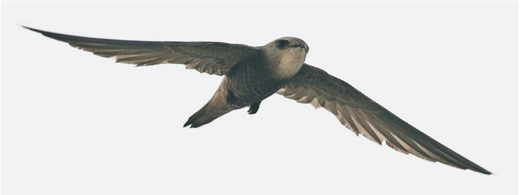
140 Pallid Swift / Vale Gierzwaluw Apus pallidus , Dumistan region, Bahrain, 14 May 2008. Note rather pale head with blackish eye-mask and large pale throat patch reaching down to upper breast.

Kleurbeschrijvingen vormen een belangrijke basis om tot een bepaalde determinatie te komen maar zijn op zich erg lastig te interpreteren. De bruine tint van gierzwaluwen varieert afhankelijk van bijvoorbeeld de belichting, weersomstandigheden, hoek ten opzichte van de waarnemer, leeftijd van de vogel, slijtage van het verenkleed en ondersoort. Het kan erg lastig zijn om kleur correct te beoordelen op foto's, die steeds maar een momentopname zijn en vaak ook nog digitaal zijn bewerkt. Bij beschrijvingen speelt bovendien individuele interpretatie mee: niet iedereen verstaat hetzelfde onder termen als 'zandkleurig' of 'warmbruin'. Dergelijke kleurschakeringen zijn nergens exact gedefinieerd. Een mogelijk hulpmiddel kan de kleurenlijst van Wikipedia zijn ( http://en.wikipedia.org/wiki/List_of_colours ).