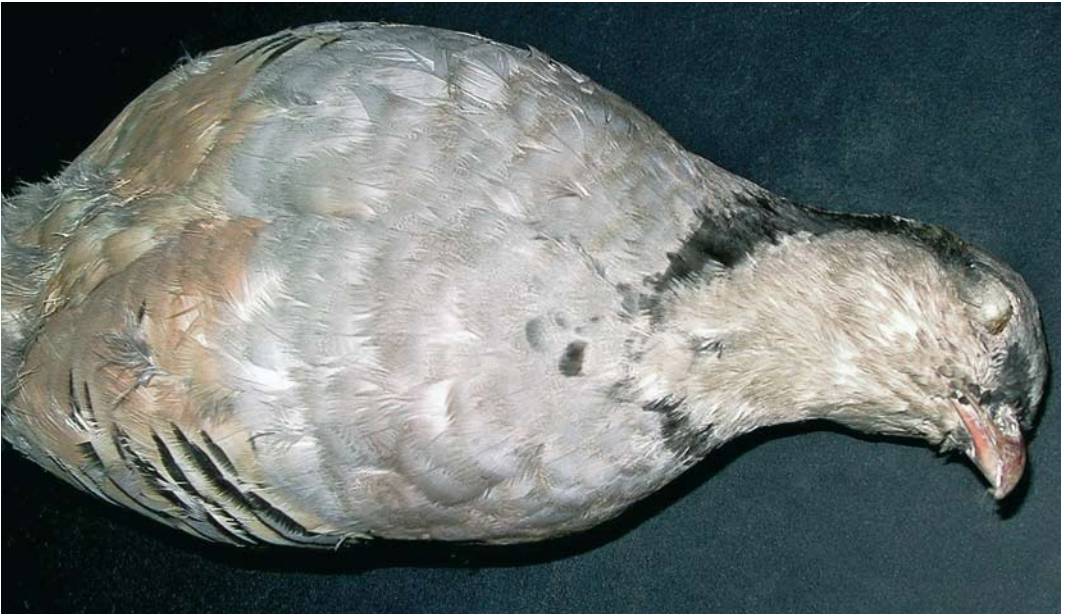
105 Underparts of Sicilian Rock Partridge / Siciliaanse Steenpatrijs Alectoris (graeca) whittakeri (collected at Monti Peloritani, Sicily, Italy), Arrigoni degli Oddi collection, Museo di Scienze Naturali, Roma, Italy ( Andrea Corso ). Note broken black collar, spotted in front, and very warm and rich creamy vent and belly.