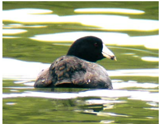
165 American Eider / Amerikaanse Eider Somateria mollissima dresseri , adult male, Glassagh Bay, Donegal, Ireland, 14 February 2010 ( Craig Shaw ) 166 Purple Gallinule / Amerikaans Purperhoen Porphyrio martinica , Limeira, Graciosa, Azores, 9 January 2010 ( Jerry Bettencourt ) 167 Pied-billed Grebes / Dikbekfuten Podilymbus podiceps , adult (right) and first-winter, Lagoa das Furnas, São Miguel, Azores, February 2010 ( Gerbrand Michielsen ) 168 American Coot / Amerikaanse Meerkoet Fulica americana , Lagoa das Furnas, São Miguel, Azores, February 2010 ( Gerbrand Michielsen )

pairs of Little Egret Egretta breeding in the Netherlands in 2009 to 110 (after an annual increase since 1996, there were 170 pairs in 2008); the winter of 2009/10 may have caused even greater damage. Western Great Egrets Casmerodius albus appear to be much more hardy in severe winter weather and, in 2009, the number of breeding pairs at, eg, Oostvaardersplassen, Flevoland, increased to 96 (from 78 in 2008); a record winter roost for the Netherlands of 347 individuals was counted at Polder Maltha, Biesbosch, Noord-Brabant, at dusk on 12 February. In Sardinia, Italy, 175 were counted at Gulf of Oristano in January. In the Azores, a Great Blue Heron Ardea herodias stayed at Paul da Praia, Terceira, from 15 February. This winter, two or three Black Storks Ciconia nigra were present in Camargue, Bouches-du-Rhône, France. Since the winter of 1997/98, the species regularly winters in Camargue and rarely also elsewhere in France, with one successfully wintering in six con-