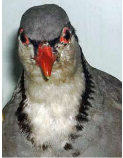
117 Sicilian Rock Partridge / Siciliaanse Steenpatrijs Alectoris (graeca) whitakeri (collected at Monte Etna, Sicily, Italy), Museo ornitologico di Randazzo, collezione Angelo Priolo, Italy ( Andrea Corso ). Bird with broken collar and creamy tinged throat.

more with mantle; the same applies for the neck side and/or neck base. Nominate graeca is paler, more diffusely and intensely tinged greyish or cerulean-grey, though some birds are duller and darker, approaching whitakeri . The median upperwing-coverts in whitakeri show the least amount of greyish-bluish tinge on the inner web. The upperparts of orlandoi are the palest and the most cerulean-grey to cold greyish.