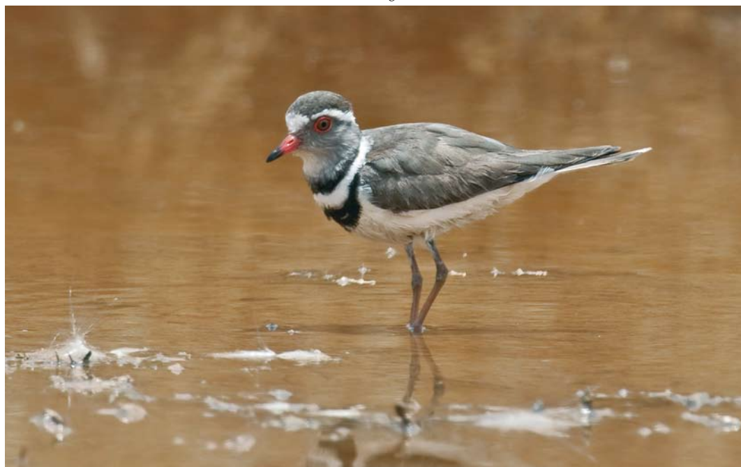
159 Three-banded Plover / Driebandplevier Charadrius tricollaris , adult, Tut Amon, Aswan, Egypt, 30 April 2009

On 30 April, we were back at Aswan. We had planned to return to the fishponds of Tut Amon to ask the guard whether an entrance permit could be obtained by contacting specific authorities. We arrived at the entrance gate (at 23.972°N-32.851°E) in the late afternoon but, contrary to what we had expected, the guard (a different man from the one present on 27 April) opened the gate without any questioning. We therefore quickly drove the