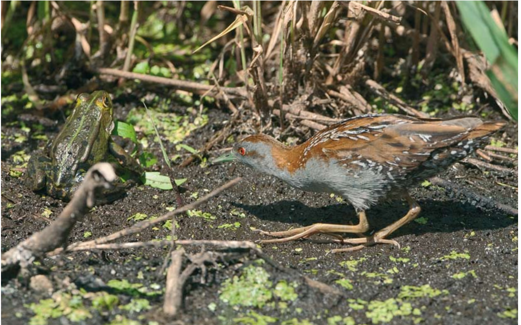
149 Kleinst Waterhoen / Baillon's Crake Porzana pusilla , vrouwtje, met waarschijnlijke Bastaardkikker / probable Edible Frog Rana klepton esculenta , Groene Jonker, Zevenhoven, Zuid-Holland, 16 juli 2009 ( Phil Koken )