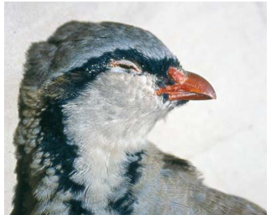
112-115 Sicilian Rock Partridge / Siciliaanse Steenpatrijs Alectoris (graeca) whitakeri , collected at Malvagna, Sicily, Italy, late autumn (Angelo Scuderi). Specimen photographed from different angles to show all typical characters.