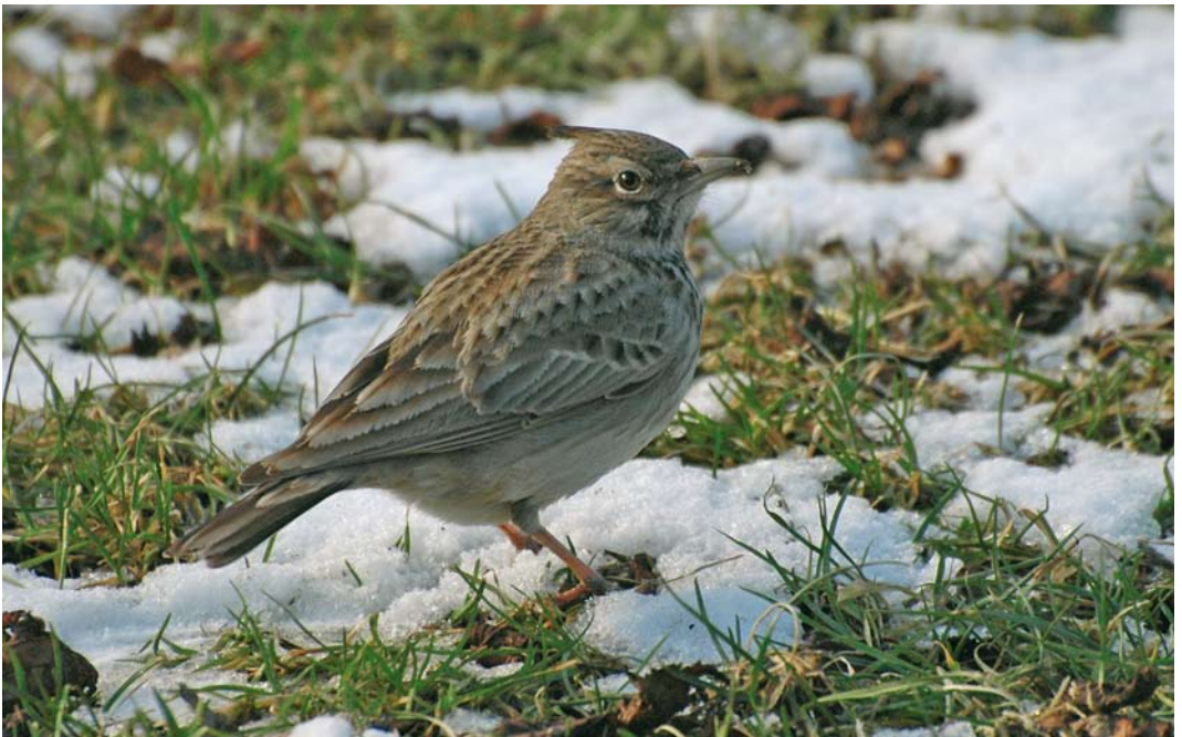
195 Kuifleeuwerik / Crested Lark Galerida cristata , 's-Gravenzande, Zuid-Holland, 17 februari 2010 (John van der Graaf)