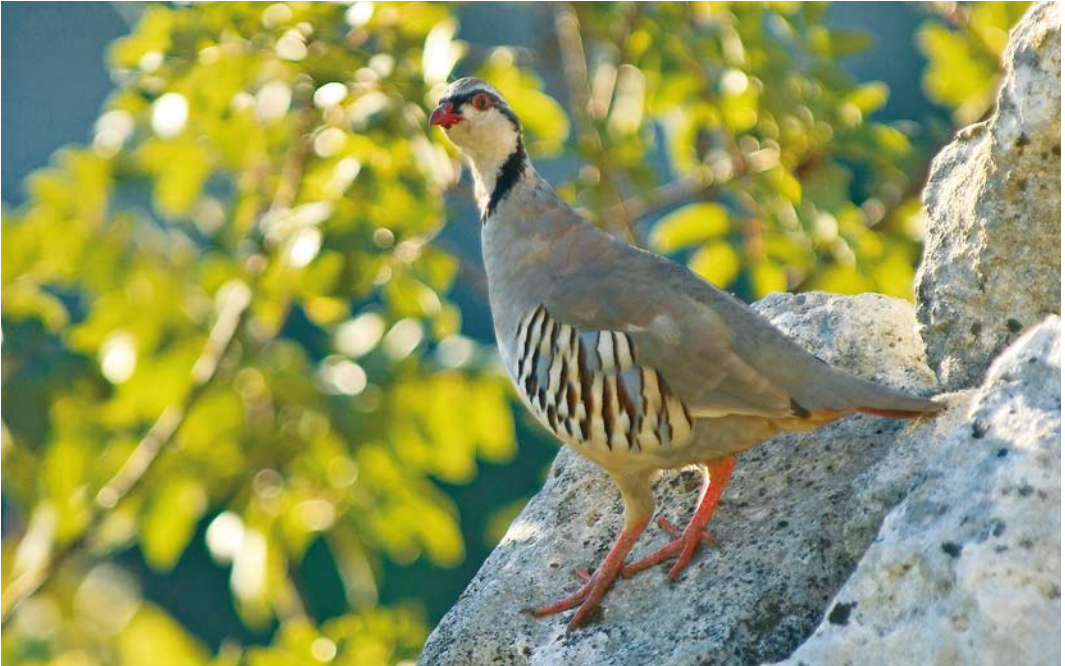
121 Sicilian Rock Partridge / Siciliaanse Steenpatrijs Alectoris (graeca) whitakeri , Monti Iblei, Pantalica, Siracusa, Sicily, Italy, 2 October 2005. Note that this bird is not saturated in upperparts coloration, with rump and uppertail-coverts slightly but visibly paler than mantle, atypically for whitakeri . Note, however, contrasting pale ear-coverts, narrow collar, almost broken in front, very dark and colourfull undertail-coverts.

Randi (2006) all express great concern about the conservation status of whitakeri because it still is a game bird, with hunting open almost all over Sicily. It is one of few endemic taxa in Europe, decreasing due to habitat loss and destruction, pollution, and genetic pollution (see below). Therefore, it is highly questionable that the Italian government and the Sicilian region administration still permits hunting ( whitakeri is listed in Annex I of the Birds Directive); 100s if not 1000s of birds are killed every year all over the island. Hunters are allowed to shoot a maximum of five birds per season but in fact they sometimes each kill as many as one to five each day of hunting.