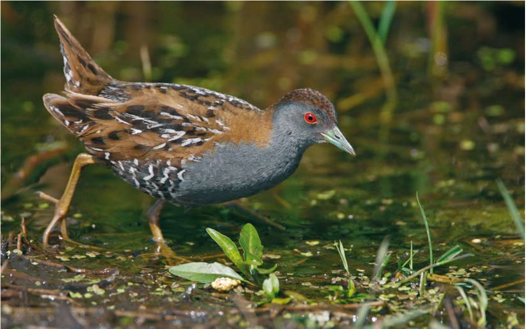
143 Kleinst Waterhoen / Baillon's Crake Porzana pusilla , mannetje, Groene Jonker, Zevenhoven, Zuid-Holland, 13 juni 2009