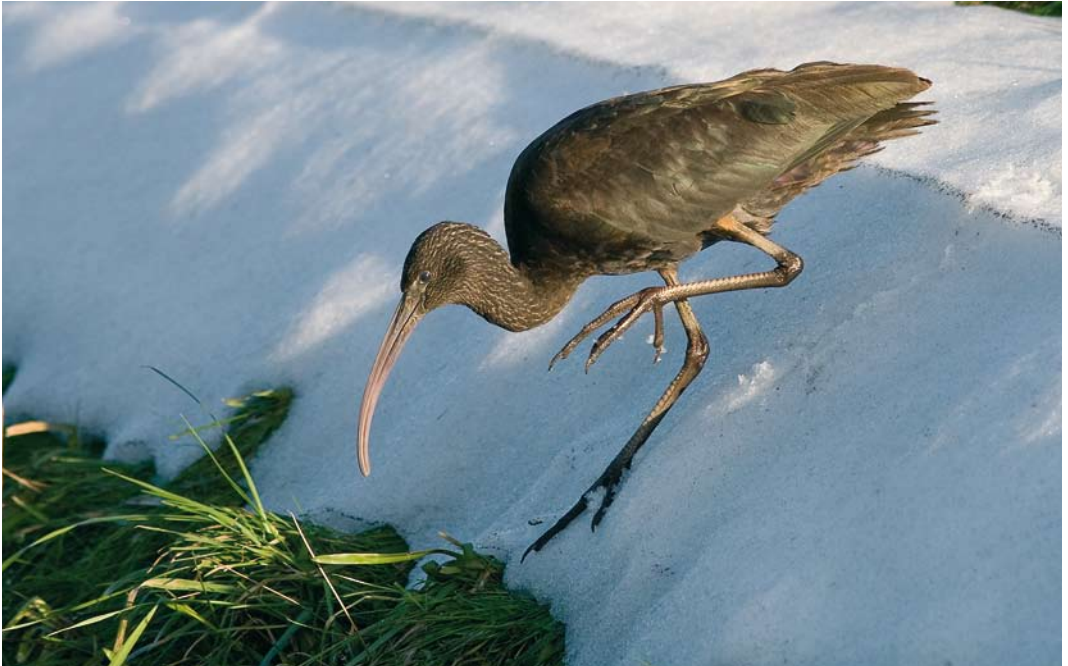
183 Zwarte Ibis / Glossy Ibis Plegadis falcinellus , eerste-winter, Noordwijkerhout, Zuid-Holland, 17 januari 2010