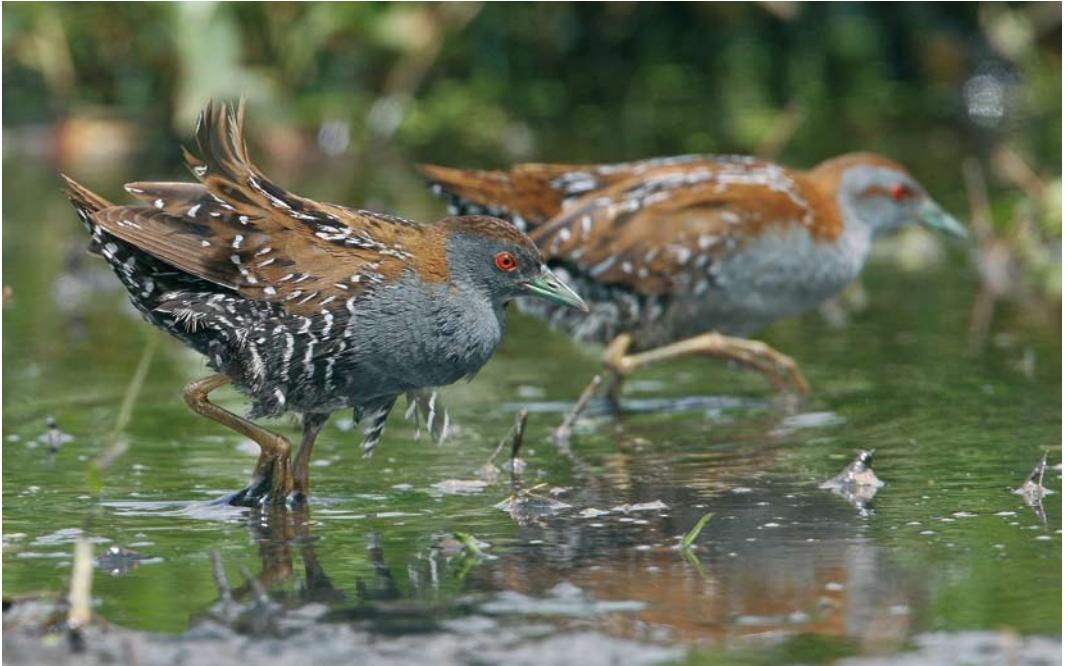
145 Kleinst Waterhoen / Baillon's Crake Porzana pusilla , mannetje en vrouwtje, Groene Jonker, Zevenhoven, Zuid-Holland, 20 juni 2009