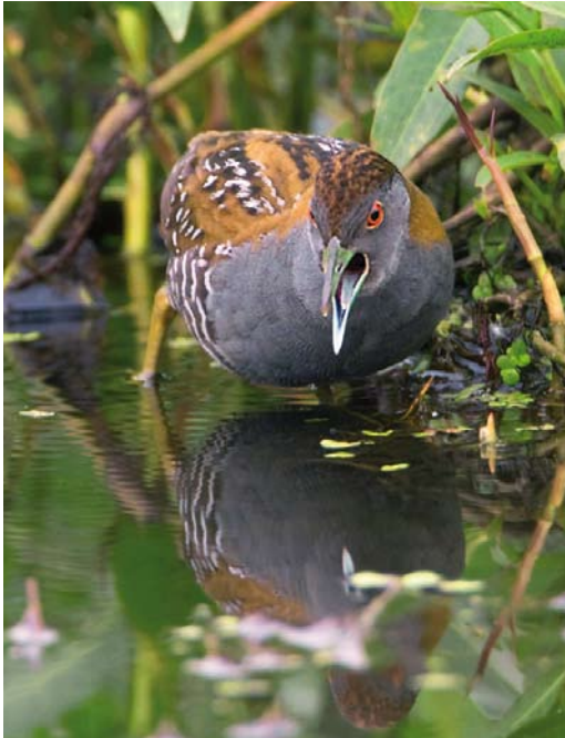
151 Kleinst Waterhoen / Baillon's Crake Porzana pusilla , roepend mannetje, Groene Jonker, Zevenhoven, Zuid-Holland, 10 juni 2009