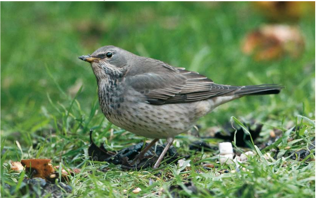
179 Black-throated Thrush / Zwartkeellijster Turdus atrogularis , female, Newholm, Whitby, North Yorkshire, England, 17 January 2010