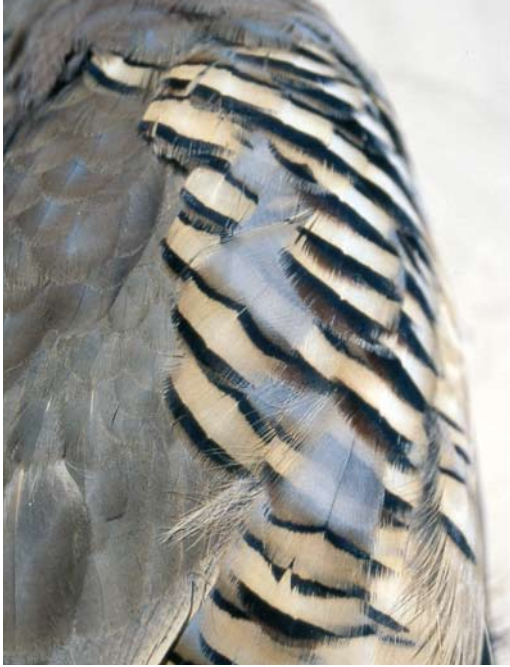
118 Sicilian Rock Partridge / Siciliaanse Steenpatrijs Alectoris (graeca) whitakeri , collected at Monti Nebrodi, Sicily, Italy, in winter (Andrea Corso).