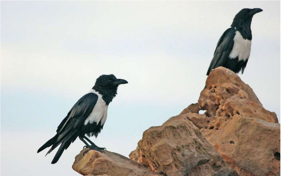
176 Pied Crows / Schildraven Corvus albus , 154 km north-east of Dakhla, Western Sahara, Morocco, 5 March 2010