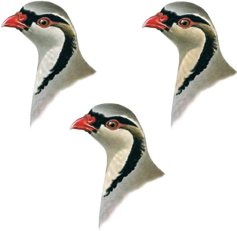
FIGURE 5 Variability of head pattern in Sicilian Rock Partridge / Siciliaanse Steenpatrijs Alectoris (graeca) whitakeri (Lorenzo Starnini). Below: typical bird, showing off-white throat with pale isabelline hue; upper right: frequent pattern with intense creamy-drab isabelline tinge; upper left: greyish tinged throat, similar to several saxatilis . Note ear-coverts stripe pattern and colour and black collar pattern.

2004, Baratti et al 2005, Barbanera et al 2005, 2009ab, Barilani et al 2007ab). However, back in 1934, when Schiebel described whitakeri , there were apparently no introduced chukar in Sicily, therefore also pure birds may show an isabelline or creamy tinge.