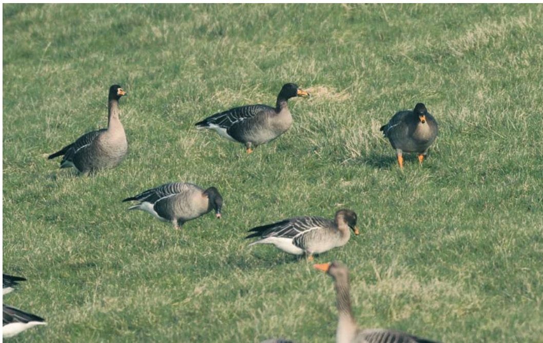
181 Taigarietganzen / Taiga Bean Geese Anser fabalis , met Kleine Rietgans / Pink-footed Goose A brachyrhynchus en Grauwe Gans / Greylag Goose A anser , Retranchement, Zeeland, 17 februari 2010