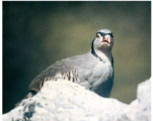
98-99 Sicilian Rock Partridge / Siciliaanse Steenpatrijs Alectoris (graeca) whitakeri , Monti Sicani, Sicily, Italy, spring 2004. Note very warm and uniform brownish olive or even rusty upperparts, more intense than in other taxa, with just slightly paler, barely contrasting uppertail-coverts. This bird shows creamy or isabelline-tinged throat patch. Black collar (neck-lace) is barely broken in front, appearing just disjoint and spotted. Note obvious ear-coverts stripe, almost like Chukar Partridge A chukar . 100-101 Sicilian Rock Partridge / Siciliaanse Steenpatrijs Alectoris (graeca) whitakeri , Monti Iblei, Sicily, Italy, autumn 1999. Two old photographs, appearing much more bluish than bird actually was. Note very typical open broken black collar and conspicuous ear-coverts stripe.

eastern Serbia and northern Albania and the Republic of Macedonia seem to exhibit some clinal intergradation with nominate graeca (Cramp 1980, Priolo 1984, Snow & Perrins 1998). According to Vaurie (1965), this taxon is limited to the Alps and he regarded the other populations as belonging to nominate graeca . Orlando (1967) further complicated the situation, stating that the range of saxatilis was limited to the western Alps, as the other populations in the Alps are very similar to the population in the Apennines. Priolo (1984) claimed that the Alpine populations all belong to saxatilis , and that this taxon enters former Yugoslavia, intergrading here (Republic of Mace-