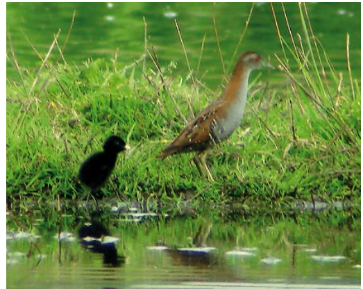
154 Kleinst Waterhoen / Baillon's Crake Porzana pusilla , adult met kuiken, Oegstgeest, Zuid-Holland, 29 juli 2009 (Luuk Punt)

Gevalen van voor 1980 werden niet herzien door de CDNA (in tegenstelling tot de meeste beoordeeltaxa op de Nederlandse lijst). Van den Berg & Bosman (1999, 2001) vermelden daarom