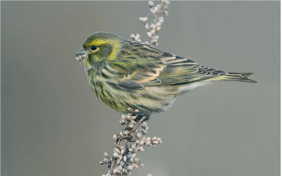
194 Europese Kanarie / European Serin Serinus serinus , Nijmegen, Gelderland, 26 januari 2010