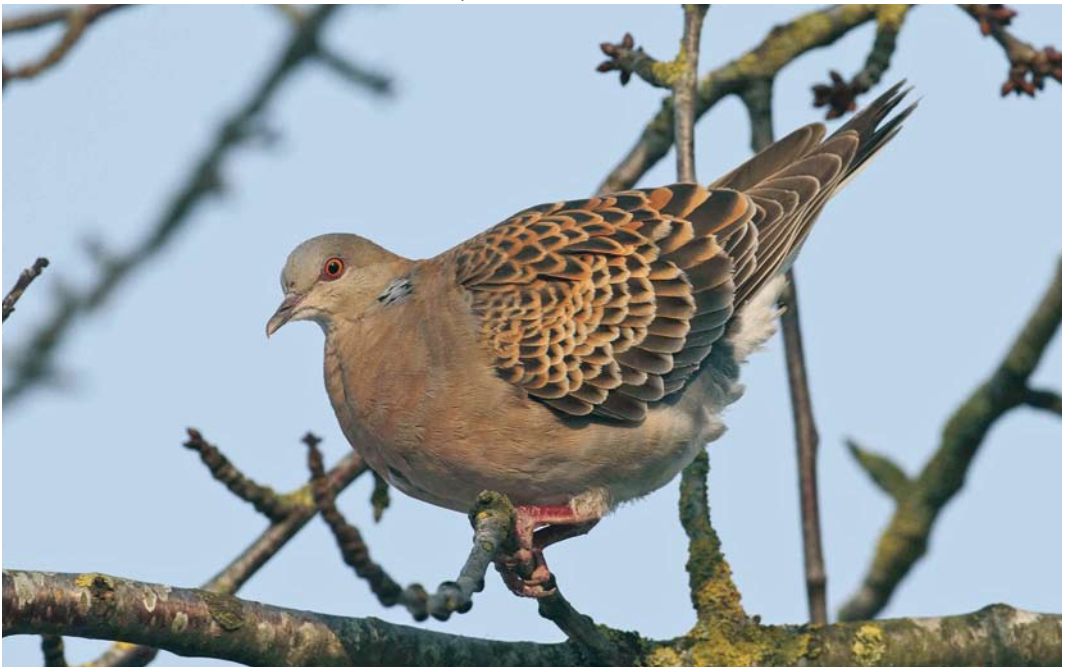
156 Westelijke Oosterse Tortel / Western Oriental Turtle Dove Streptopelia orientalis meena , adult, Wergea, Friesland, 25 januari 2010