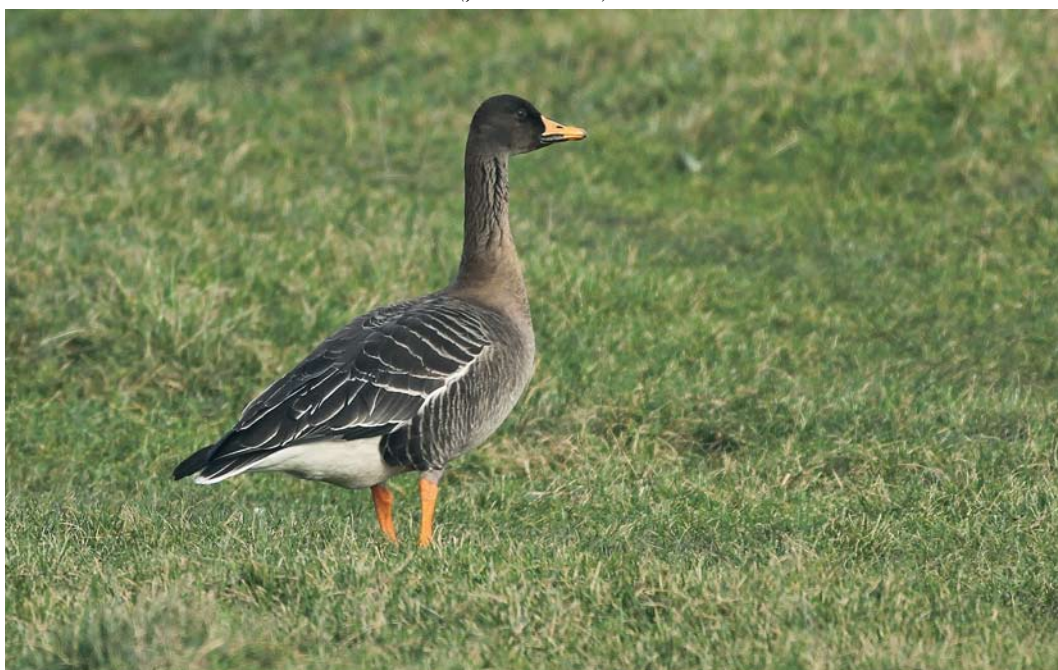
182 Taigarietgans / Taiga Bean Goose Anser fabalis , Retranchement, Zeeland, 17 februari 2010 (Johan Buckens)