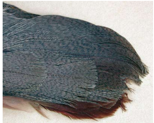
FIGURE 4 Tail pattern of Sicilian Rock Partridge / Siciliaanse Steenpatrijs Alectoris (graeca) whitakeri (below) and other Rock Partridge / Steenpatrijs A graeca taxa ( Lorenzo Starnini ). Note marked vermiculation on both uppertail-coverts and whole tail-feathers. In other taxa, uppertail-coverts more or less vermiculated (rarely almost in shape of dark bars), as can be central tail-feathers (t1), but tail never fully vermiculated/barring as in whitakeri .