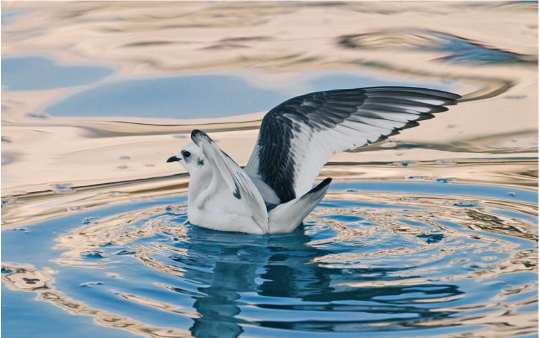
164 Ross's Gull / Ross' Meeuw Rhodostethia rosea , first-winter, Toftir, Eysturoy, Faeroes, February 2010

Netherlands since 2005. At Kalmthoutse Heide, Oost-Vlaanderen, a female with five young in 2009 constituted the first breeding ever for Belgium. The fifth Hooded Merganser Lophodytes cucullatus for the Azores stayed from 28 December 2009 to at least mid-March at Ponta Delgada, São Miguel. In freezing winter weather, a female-type paired up with a male Smew at Zwartewater, Overijssel, between 15 January and 24 February. Long-staying male American Black Ducks Anas rubripes occurred, for instance, on Achill Island, Mayo, Ireland, into March, at Melrakkaslétta, Iceland, until at least 11 February, on Tresco, Scilly, England, until 11 February and at Hlíðarvatn, Selvogur, Iceland, until at least 10 February. In Cornwall, England, a male occurred at Dozmary Pool from 16 February into March. In the Netherlands, an unringed confiding male Baikal Teal A formosa stayed in ice-free water at Almelo, Overijssel, from 30 January to 24 February. In Ireland, both a hybrid and a pure bird were seen at Tacumshin, Wexford, between 5 January and 23 February (cf Dutch Birding 32: 52, 2010). The wintering population in Korea increased from a declining 75 000 in the early 1990s to over one million in 2009; this spectacular increase is believed to be linked to lots of land reclaiming as well as to a decline in hunting pressure.