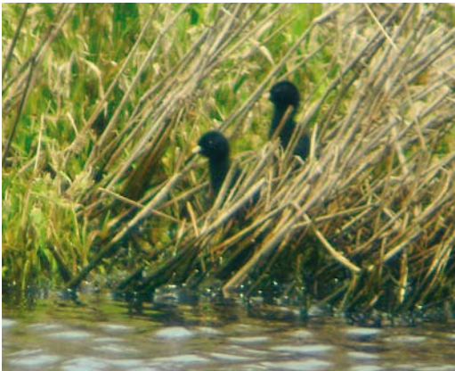
153 Kleinst Waterhoen / Baillon's Crake Porzana pusilla , kuikens, Oegstgeest, Zuid-Holland, 26 juli 2009

Het broedgeval vond plaats in een helofytenfilter dat onder beheer valt van het Hoogheemraadschap Rijnland. Dit in 2007 door Zuid-Hollands Landschap verworven en ingericht gebiedje grenst aan de noordzijde aan een natuurontwikkelingsgebied in de Klaas Hennepoelpolder en Veerpolder en valt net in de gemeente Warmond. Het bestaat uit rietkragen, enkele stukjes plasdras, een ringsloot en een paar sloten die het gebiedje doorsnijden. Het aangrenzende natuurontwikkelingsgebied bevat naast de natte habitats ook kruidenrijk grasland en bosschages.