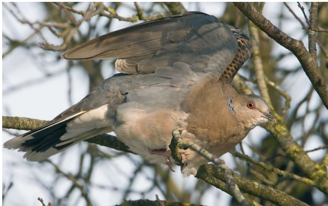
157 Westelijke Oosterse Tortel / Western Oriental Turtle Dove Streptopelia orientalis meena , adult, Wergea, Friesland, 26 januari 2010 (Roland Jansen)