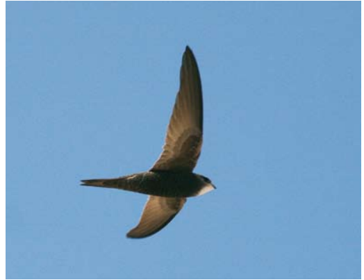
138 Pallid Swift / Vale Gierzwaluw Apus pallidus , Marrakech, Morocco, 29 March 2006 ( James Lidster ). Note pale head with blackish eye-mask. 139 Asian Common Swift / Aziatische Gierzwaluw Apus apus pekinensis , near Boon Tsagaan Nuur (Buuntsagaan lake), Mongolia, 10 June 2008 ( James Lidster ). Despite large white throat patch, note that head is still darker than in average Pallid Swift A pallidus , and that scaling of undertail-coverts is more prominent than on belly/flanks. Median coverts clearly darker than greater coverts.