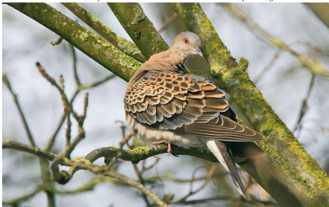
158 Westelijke Oosterse Tortel / Western Oriental Turtle Dove Streptopelia orientalis meena , adult, Wergea, Friesland, 31 januari 2010. P4 ontbrekend / p4 missing