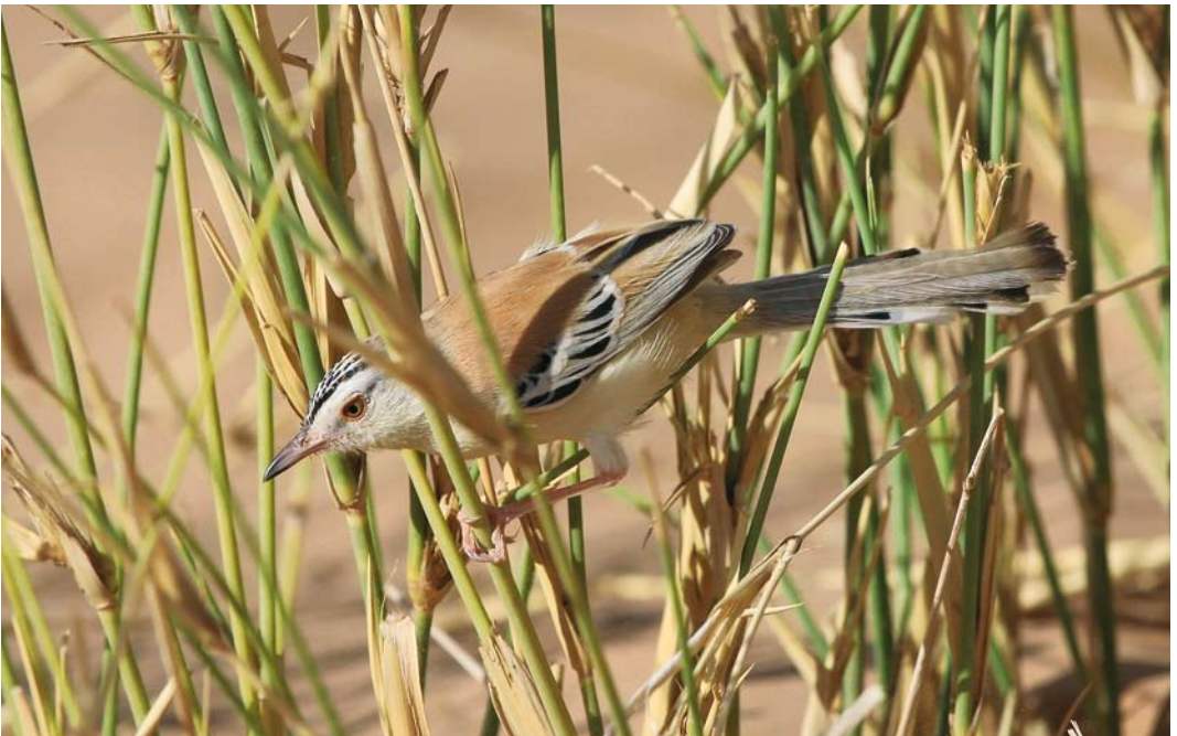
177 Cricket Warbler / Krekelprinia Spiloptila clamans , Aoussard, Western Sahara, Morocco, 6 March 2010