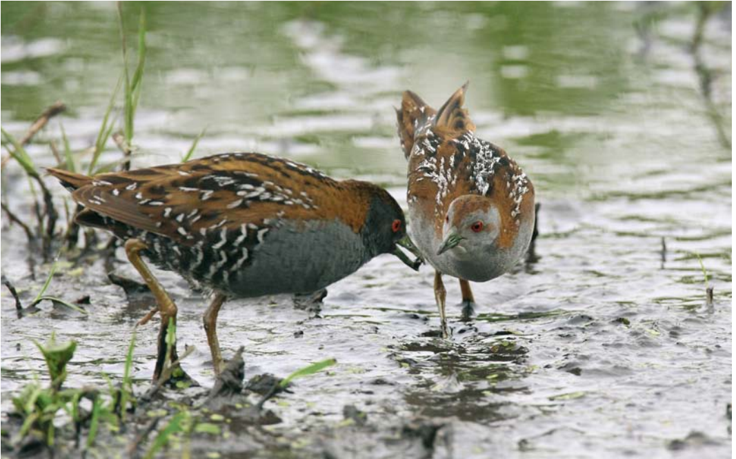
147 Kleinst Waterhoen / Baillon's Crake Porzana pusilla , mannetje en vrouwtje, Groene Jonker, Zevenhoven, Zuid-Holland, 15 juni 2009