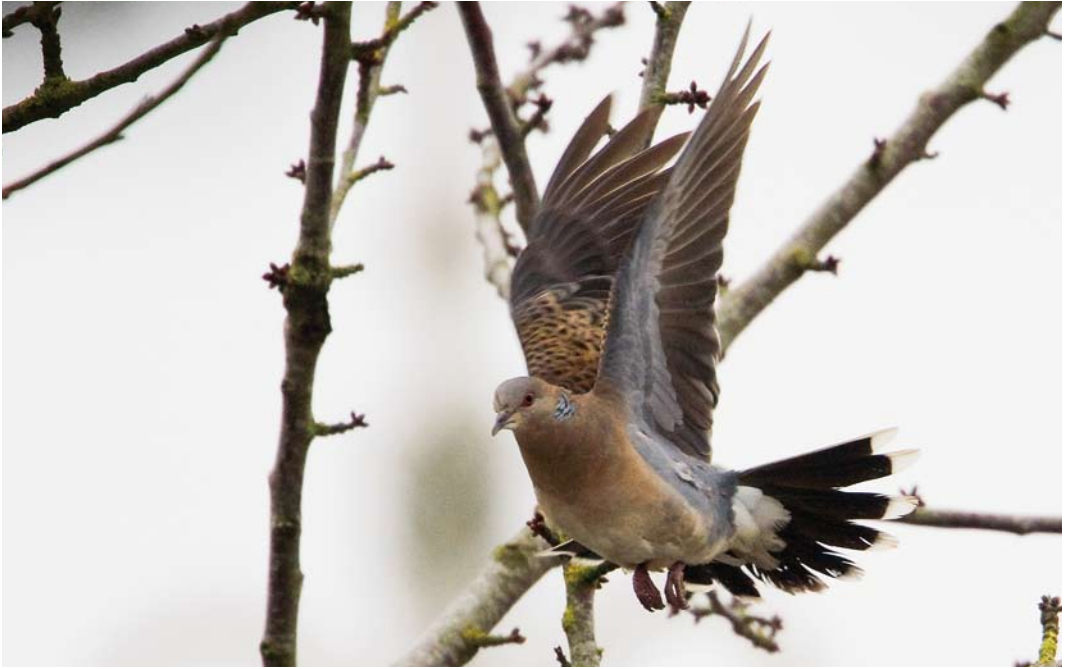
155 Westelijke Oosterse Tortel / Western Oriental Turtle Dove Streptopelia orientalis meena , adult, Wergea, Friesland, 22 januari 2010