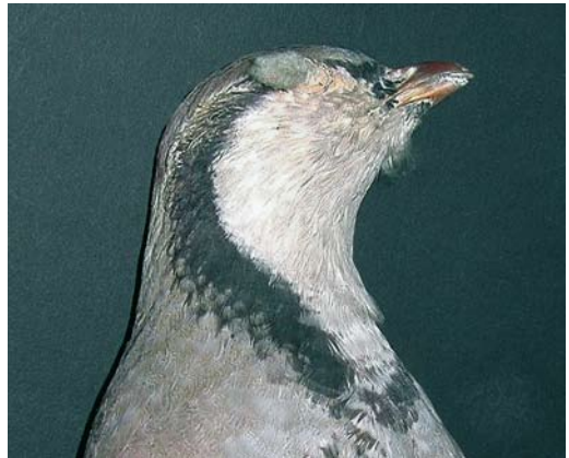
108 Sicilian Rock Partridge / Siciliaanse Steenpatrijs Alectoris (graeca) whittakeri , Monti Nebrodi, Sicily, Italy ( Andrea Corso ). Close-up view showing variegated colour of throat as in some birds, being mixed drab greyish-isabelline. 109 Sicilian Rock Partridge / Siciliaanse Steenpatrijs Alectoris (graeca) whittakeri , collected at Monti Nebrodi, Sicily, Italy ( Andrea Corso ). Bird with whiter and cleaner throat and unbroken collar. 110 Alpine Rock Partridge / Alpensteenpatrijs Alectoris graeca saxatilis (collected at Brescia, Brescia, Italy), Arrigoni degli Oddi collection, Museo di Scienze Naturali, Roma, Italy ( Andrea Corso ). Note width of collar at sides, intense greyish-tinged throat, and near absence of ear-coverts stripe. 111 Sicilian Rock Partridge / Siciliaanse Steenpatrijs Alectoris (graeca) whittakeri (collected at Monte Etna, Sicily, Italy), Arrigoni degli Oddi collection, Museo di Scienze Naturali, Roma, Italy ( Andrea Corso ). Note width of collar at sides, broken collar in front, spotted, white creamy-tinged throat, visible ear-coverts stripe.

the present study in Italian taxa. The white or pale supercilium is also variable, more extensive in saxatilis and orlandoi . Interestingly, in this character, whittakeri is most different from chukar which has a broader and paler supercilium, not reaching the forehead or diffusely so.