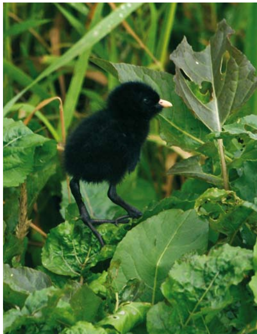
152 Kleinst Waterhoen / Baillon's Crake Porzana pusilla , kuiken, Groene Jonker, Zevenhoven, Zuid-Holland, 19 juli 2009 (Jan den Hertog)

paring en het feit dat de ene vogel veelvuldig riep en de andere niet.