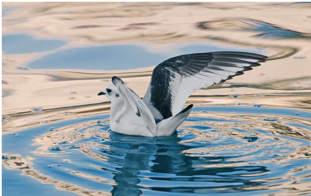
164 Ross's Gull / Ross' Meeuw Rhodostethia rosea , first-winter, Toftir, Eysturoy, Faeroes, February 2010

Netherlands since 2005. At Kalmthoutse Heide, Oost-Vlaanderen, a female with five young in 2009 constituted the first breeding ever for Belgium. The fifth Hooded Merganser Lophodytes cucullatus for the Azores stayed from 28 December 2009 to at least mid-March at Ponta Delgada, São Miguel. In freezing winter weather, a female-type paired up with a male Smew at Zwartewater, Overijssel, between 15 January and 24 February. Long-staying male American Black Ducks Anas rubripes occurred, for instance, on Achill Island, Mayo, Ireland, into March, at Melrakkaslétta, Iceland, until at least 11 February, on Tresco, Scilly, England, until 11 February and at Hlíðarvatn, Selvogur, Iceland, until at least 10 February. In Cornwall, England, a male occurred at Dozmary Pool from 16 February into March. In the Netherlands, an unringed confiding male Baikal Teal A formosa stayed in ice-free water at Almelo, Overijssel, from 30 January to 24 February. In Ireland, both a hybrid and a pure bird were seen at Tacumshin, Wexford, between 5 January and 23 February (cf Dutch Birding 32: 52, 2010). The wintering population in Korea increased from a declining 75 000 in the early 1990s to over one million in 2009; this spectacular increase is believed to be linked to lots of land reclaiming as well as to a decline in hunting pressure.