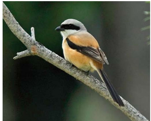
8 Azure Tit / Azuurmees Cyanistes cyanus , adult, Grigorievka, Kyrgyzstan, 25 May 2007 (Vincent van der Spek) 9 Common Rosefinch / Roodmus Carpodacus erythrinus ferghanensis , male, Grigorievka, Kyrgyzstan, 25 May 2007 (Vincent van der Spek) 10 Grey-headed Goldfinch / Grijskopputter Carduelis carduelis caniceps/parapanisi , Chon Kemin, Kyrgyzstan, 22 May 2007 (Vincent van der Spek) 11 Eversmann's Redstart / Eversmanns Roodstaart Phoenicurus erythronotus , Ala Archa, Kyrgyzstan, 21 May 2007 (Peter Hoppenbrouwers) 12 Golden Eagle / Steenarend Aquila chrysaetos , chick, Temir Kanat, Kyrgyzstan, 29 May 2007 (Vincent van der Spek) 13 Long-tailed Shrike / Langstaartklauwier Lanius schach , Bishkek, Kyrgyzstan, 20 May 2007 (Peter Hoppenbrouwers)