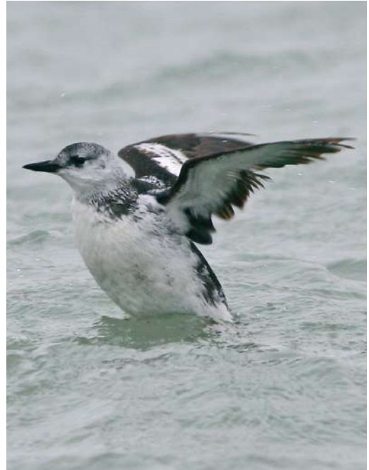
83 Steppevorkstaartplevier / Black-winged Pratincole Glareola nordmanni , Strijen, Zuid-Holland, 7 november 2009 (Menno van Duijn) 84 Zwarte Zeekoet / Black Guillemot Cephus grylle , eerstejaars, Brouwersdam, Zeeland, 21 december 2009 (Pim A Wolf) 85 Rosse Franjepoot / Red Phalarope Phalaropus fulicarius , eerste-winter, De Cocksdorp, Texel, Noord-Holland, 28 november 2009 (René Pop)