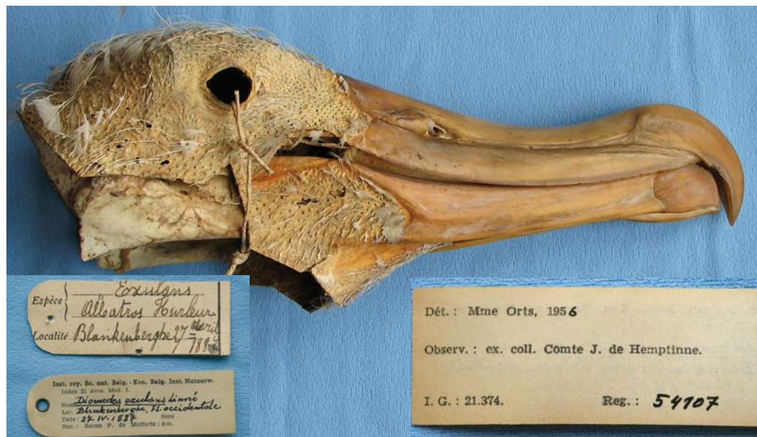
FIGURE 7 Wandering Albatross / Grote Albatros Diomedea exulans, found at Blankenberge, West-Vlaanderen, Belgium, on 27 April 1887