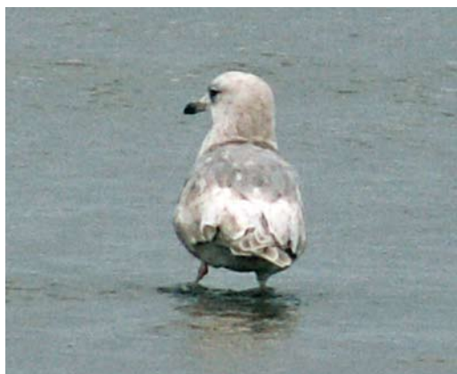
1-6 Kumliens Meeuw / Kumlien's Gull Larus glaucooides kumlieni , tweede-winter, West aan Zee, Terschelling, Friesland, 30 januari 2005