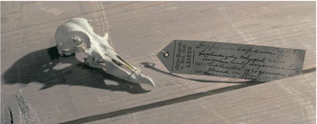
11 Cape Petrel / Kaapse Stormvogel Daption capense (reportedly shot at Crumlin, near Dublin, Dublin, Ireland, on 30 October 1881), Natural History Museum of Ireland, Dublin, Ireland, 7 March 2008 12 Cape Petrel / Kaapse Stormvogel Daption capense , immature (collected at sea, off Sciacca, Agrigento, Sicily, Italy, in September 1964), private collection of Gino Fantin, Treviso, Veneto, Italy, November 1973 13 Cape Petrel / Kaapse Stormvogel Daption capense , skull (found at Hoek van Holland, Zuid-Holland, Netherlands, between mid August and mid September 1930), Nationaal Natuurhistorisch Museum/Naturalis, Leiden, Zuid-Holland, Netherlands, April 1983

1998) mainly because of the probability of ship assistance (Paul Milne in litt).