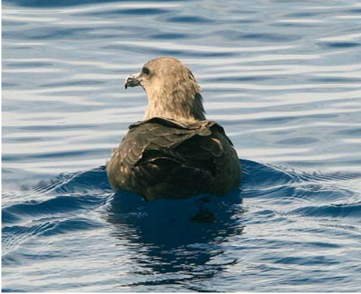
10 South Polar/Brown Skua / Zuidpooljager/ Subantarctische Grote Jager Stercorarius maccormicki/ antarcticus , off La Palma, Canary Islands, 6 October 2005