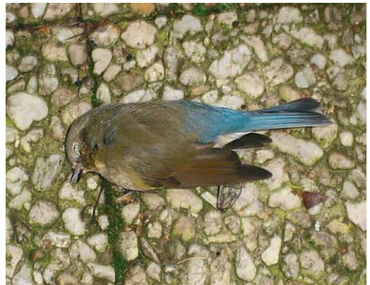
51 Kuhls Pijlstormvogel / Cory's Shearwater Calonectris borealis , Rotterdam, Zuid-Holland, 2 december 2008 52 Stormvogeltje / European Storm Petrel Hydrobates pelagicus , Eemshaven, Groningen, 22 november 2008 53 Aziatische Roodborsttapuit / Siberian Stonechat Saxicola maurus , eerstejaars, IJmuiden, Noord-Holland, 6 november 2008 54 Humes Bladkoning / Hume's Leaf Warbler Phylloscopus humei , Ballastplaatbos, Lauwersmeer, Groningen, 7 december 2008 55 Blauwstaart / Red-flanked Bluetail Tarsiger cyanurus , eerstejaars mannetje, Groene Glop, Schiermonnikoog, Friesland, 8 november 2008 56 Blauwstaart / Red-flanked Bluetail Tarsiger cyanurus , eerstejaars mannetje, Putten, Gelderland, 30 oktober 2008