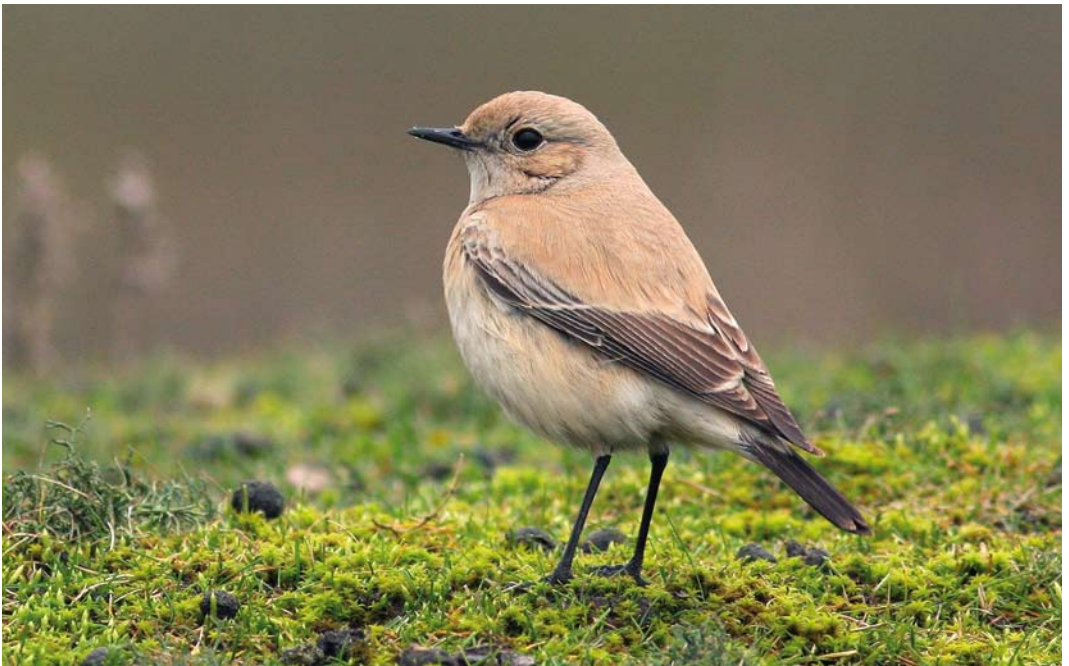
58 Woestijntapuit / Desert Wheatear Oenanthe deserti , vrouwtje, Verdronken Land van Saeftinghe, Zeeland, 20 december 2008 (Thomas Luiten)