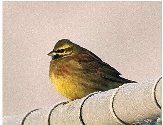
29 Iceland Gull / Kleine Burgemeester Larus glaucooides , first-year, Villa Real de Santo Antonio, Portugal, 4 January 2009 (Laurens Steijn) 30 Franklin's Gull / Franklins Meeuw Larus pipixcan , Étang d'Entressens, Bouches-du-Rhône, France, 30 December 2008 (Roef Mulder) 31 Glaucous-winged Gull / Beringmeeuw Larus glaucescens , adult, Cowpen Bewley, Cleveland, England, 10 January 2009 (John Carter) 32 Slaty-backed Gull / Kamtsjatkameeuw Larus schistisagus , adult, Klaipeda, Lietuva, Lithuania, 17 November 2008 (Vytautas Pareigis) 33 Naumann's Thrush / Naumanns Lijster Turdus naumanni , Neiden, Sor-Varanger, Norway, 11 December 2008 (Knut-Sverre Horn) 34 Cirl Bunting / Cirlgors Emberiza cirlus , male, Doelpolder, Oost-Vlaanderen, Belgium, 10 January 2009 (Toy Jansen)