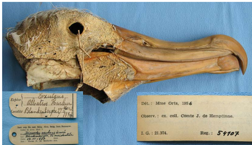
FIGURE 7 Wandering Albatross / Grote Albatros Diomedea exulans, found at Blankenberge, West-Vlaanderen, Belgium, on 27 April 1887