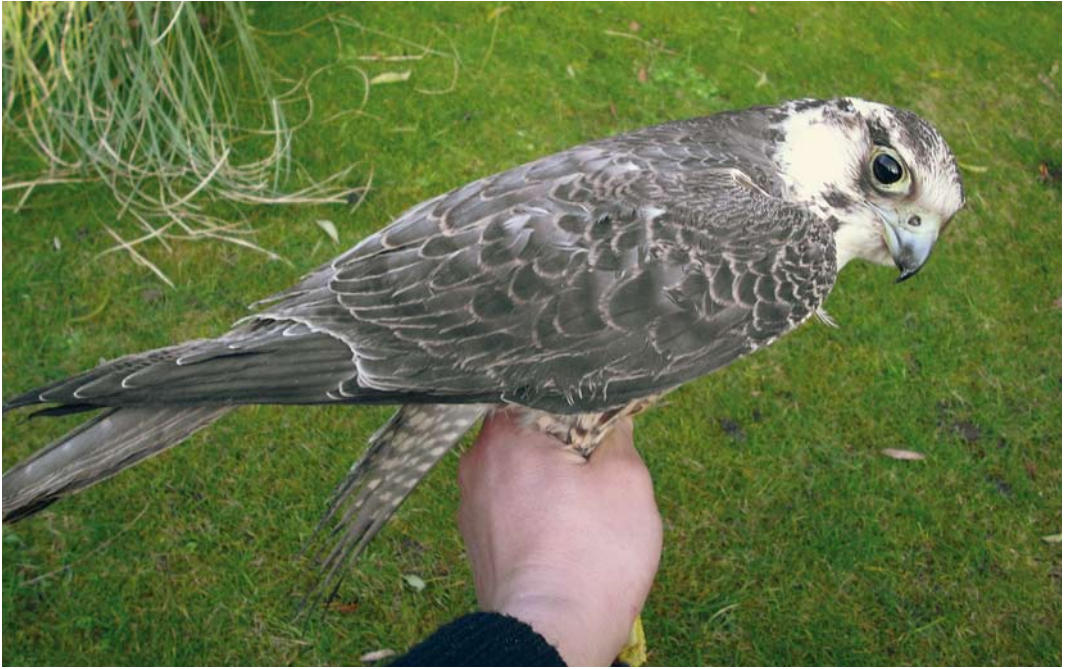
64-65 Toendraslechtvalk / Tundra Peregrine Falcon Falco peregrinus calidus , eerstejaars, Darisdonk, Oud-Turnhout, Antwerpen, België, 13 december 2008