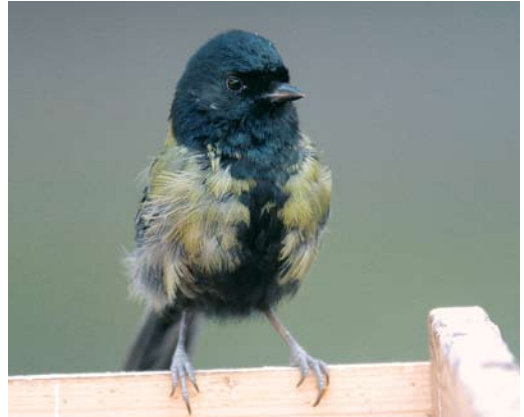
21 Koolmees / Great Tit Parus major , Rotterdam-Overschie, Zuid-Holland, 29 december 2008

het meespeuren op internet naar meer informatie.