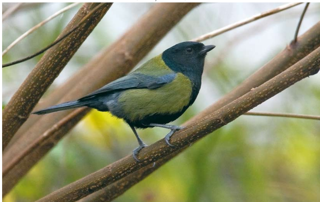
18 Koolmees / Great Tit Parus major , Krimpen aan den IJssel, Zuid-Holland, 29 november 2008 (Harvey van Diek)

Naar aanleiding van de waarneming in Krimpen aan den IJssel meldde Chris van Rijswijk (in litt) dat een vergelijkbare 'Zwartkopkoolmees' al drie winters lang (2006/07 tot 2008/09) dagelijks de tuin van zijn ouders bezoekt in Rotterdam-Overschie, Zuid-Holland (c 15 km van Krimpen aan den IJssel). Het verenkleed lijkt sterk op dat