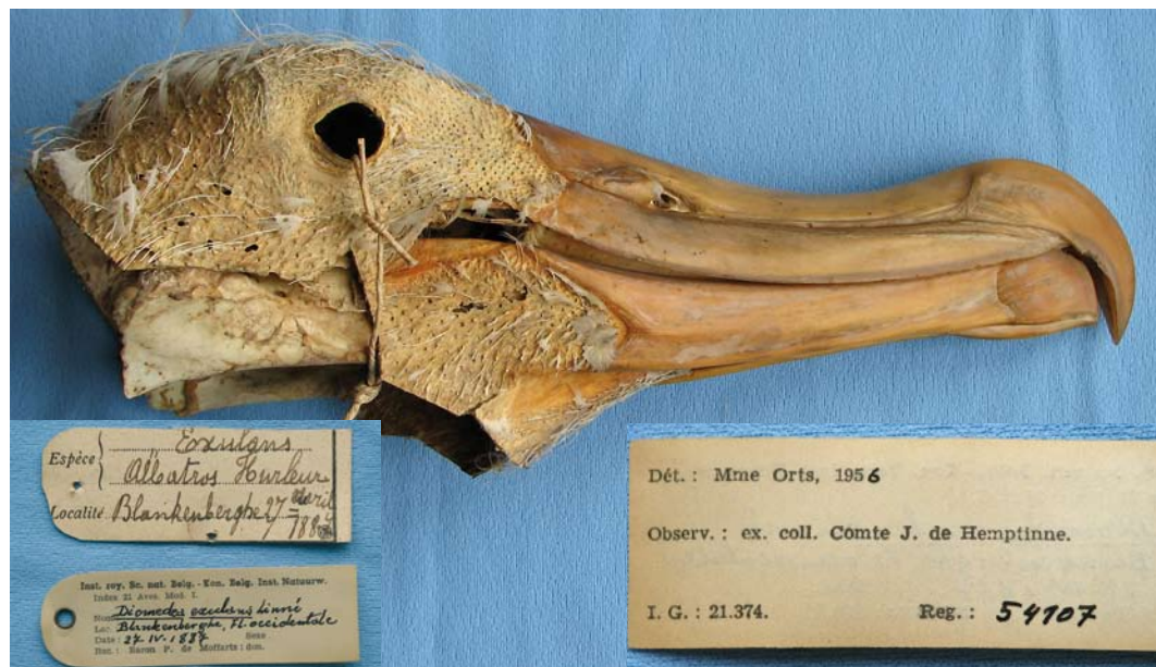
FIGURE 7 Wandering Albatross / Grote Albatros Diomedea exulans , found at Blankenberghe, West-Vlaanderen, Belgium, on 27 April 1887 (George Lenglet/Royal Belgian Institute of Natural Sciences, Brussel)

Blankenberghe on 27 April 1887. The story goes that the bird was eaten by the port warden's family but that the head was kept, although it only just escaped being eaten by a cat or by rats (Jacobs & Dirx 1945). The head ended up in the collection of a small zoo in Gent, Oost-Vlaanderen. When this zoo went out of business, the head was acquired by the count De Hemptinne for his private collection. Shortly after the count's death in September 1942, Dupond (1943) visited the count's widow to verify the find. He found the head in a poor state ('badly eaten by mites'). De Hemptinne's collection was transferred to baron P de Moffarts, who donated it in May 1958 to the Royal Belgian Institute of Natural Sciences in Brussels where it is still kept (KBIN 54107) (figure 7). The bird can be identified as exulans , with a culmen of 164.8 mm and a bill width of 44.4 mm (figure 5). The bill is nicked at the cutting edge of the inner hook.