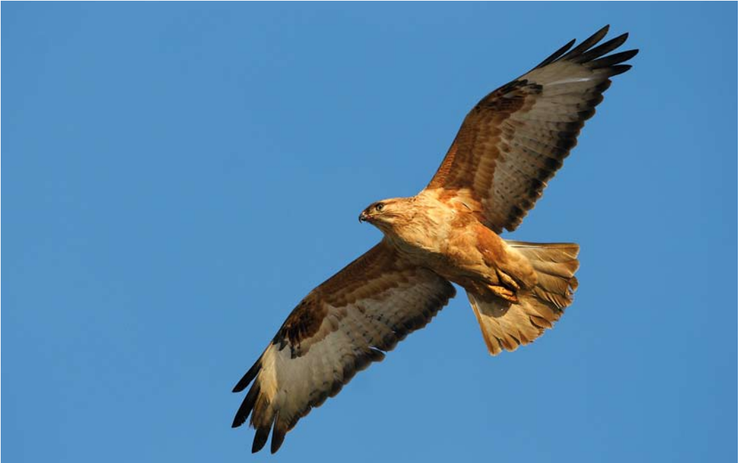
27 Long-legged Buzzard / Arendbuiserz Buteo rufinus , subadult, Doel, Oost-Vlaanderen, Belgium, 11 January 2009