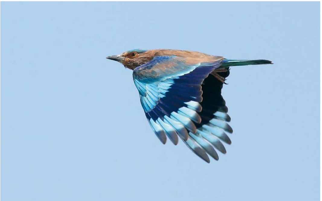
28 Indian Roller / Indische Scharrelaar Coracias benghalensis , Jahra farms, Kuwait, 27 December 2008