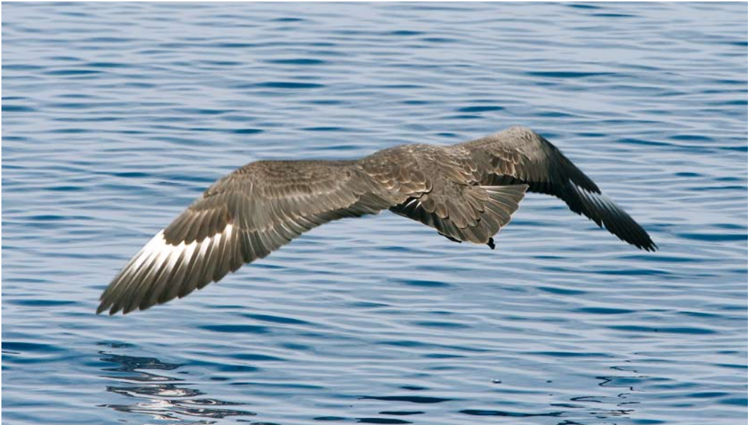
7 South Polar/Brown Skua / Zuidpooljager/Subantarctische Grote Jager Stercorarius maccormicki/antarcticus , off La Palma, Canary Islands, 6 October 2005

South Polar Skua is a monotypic species and breeds around the coast of Antarctica between October and February. After breeding, adults probably stay close to their breeding grounds. Juveniles and immatures, on the other hand, are long-distance migrants and perform a clockwise movement in the Pacific and Atlantic Ocean. In the Pacific Ocean, it is a common visitor along the coasts of Japan, and the west coast of Canada, the USA and Mexico. In the Atlantic Ocean, South Polar Skua is much scarcer. There are several