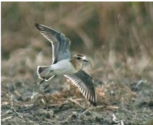
567 Kaspische Plevier / Caspian Plover Charadrius asiaticus , eerstejaars, Buitendijk, Texel, Noord-Holland, 19 oktober 2009