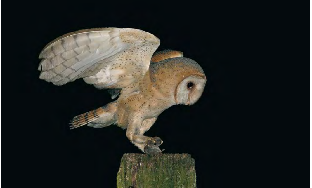
486 Kerkuil / Dark Barn Owl Tyto alba guttata , adult, Barneveld, Gelderland, 29 juni 2004. Let op donkere tekening op onderkant van buitenste handpennen / Note dark markings on underside of outer primaries.